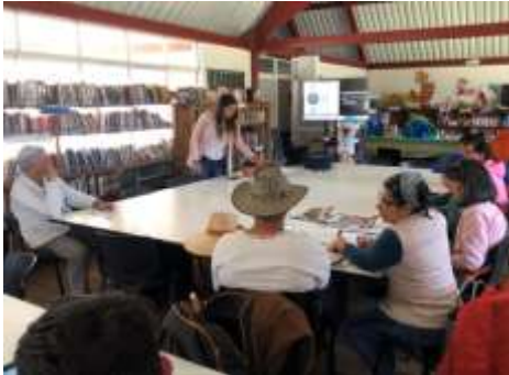
Descripción: Taller de Diversificación línea colección Iza Boyacá Tomada por Gina Arteaga Septiembre 2019 Artesanías de Colombia

El artesano identificó los diferentes conceptos con el fin de desarrollar productos acordes con la oferta y demanda. A través de un ejercicio práctico el artesano desarrolló los conceptos de set, líneas de producto, colección teniendo en cuenta la relación con la función y dinámica del mercado (oferta - demanda) a partir de fotografías que se organizaron en tableros, luego cada participante muestra y explica el ejercicio realizado.