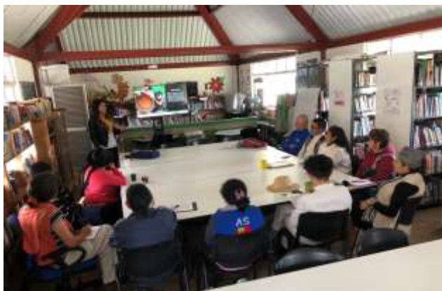
Descripción: Taller Artesanía, arte manual y otras expresiones productivas. Iza Boyacá Tomada por Rosnery Pineda Julio 2019 Artesanías de Colombia