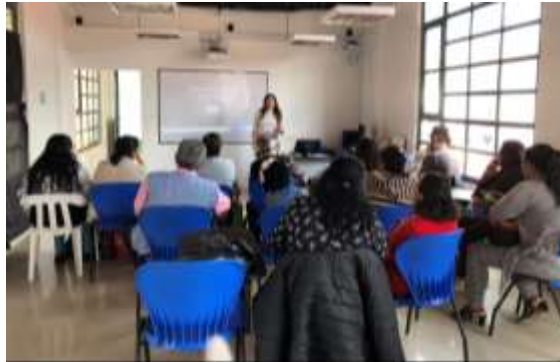
Descripción: Taller Artesanía, arte manual y otras expresiones productivas Firavitoba Boyacá Tomada por Rosnery Pineda Agosto 2019 Artesanías de Colombia

Se realizó el taller para la definición de Artesanía. Explicar la diferencia entre Artesanía, Manualidad, Arte, Manufactura, Producto Industrial para que los beneficiarios del proyecto, conozcan y enmarquen su desarrollo de producto dentro de una labor productiva.