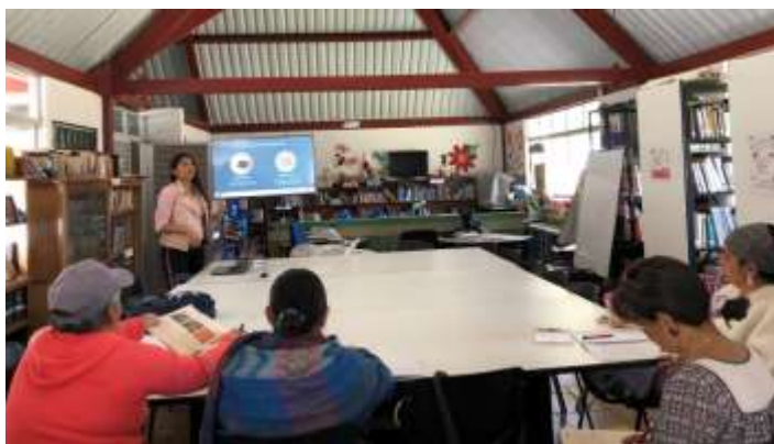
Descripción: Taller de empaque y embalajes Iza Boyacá Septiembre 2019 Artesanías de Colombia

Con el fin de mejorar la estrategia de comunicación de los productos se dictó el taller de empaques y embalajes donde se dio a conocer diferentes tipos de empaques útiles a la hora de distribuir y vender productos artesanales. Esta capacitación se complementó con diferentes estrategias para la elaboración de etiquetas de una manera fácil y práctica.