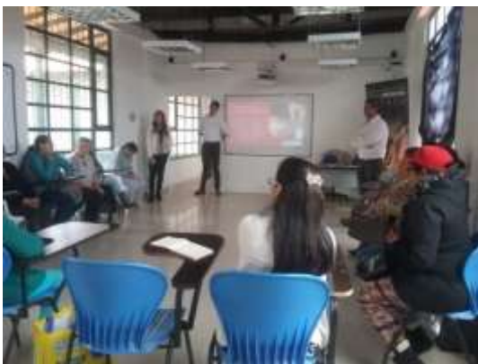
Descripción: Socialización proyecto “Trama Artesanal” Firavitoba Boyacá Tomada por Rosnery Pineda Julio 2019 Artesanías de Colombia

Se realizó la Socialización del proyecto “Trama Artesanal” bajo el convenio marco celebrado entre la Fundación Social de Holcim Colombia y Artesanías de Colombia; con el fin de dar a conocer el objetivo, alcance y metas esperadas en este proyecto donde se espera trabajar con 20 artesanos del municipio en las áreas de Desarrollo Social, Producción y Calidad, Diseño y Comercialización. Se determinó con la comunidad artesanal trabajar los días jueves en las tardes.