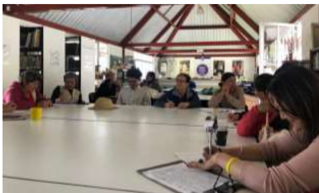
Descripción: Taller de Referentes Iza Boyacá Tomada por Gina Arteaga Agosto 2019 Artesanías de Colombia

Se trabajó con los artesanos en la explicación del significado del Referente como herramienta para el desarrollo de ideas para nuevos productos, los criterios de selección de un Referente, tipologías de referentes y desarrollo de la metodología de trabajo con referentes. La identidad es el principal factor diferencial para la decisión de compra de un producto artesanal, el trabajo con referentes le permite al artesano implementar una metodología de diseño por sí solo, logrando obtener rasgos identitarios que eventualmente se pueden insertar en un producto.