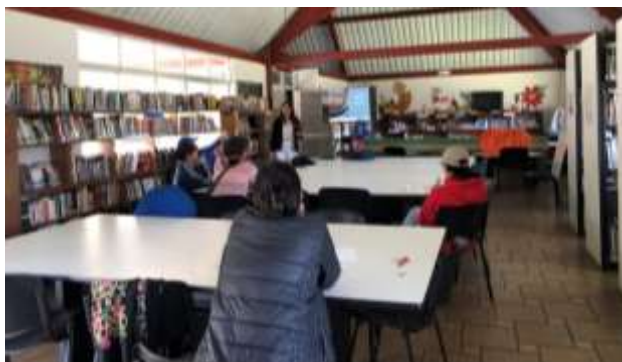
Descripción: Taller de Tendencias