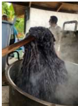
Descripción: Taller de tintes industriales Rit Iza Boyacá Septiembre 2019 Artesanías de Colombia

El taller de mejoramiento del proceso de tintura de la lana se desarrolló en 3 fases, en cada una se mejoraron los procesos a partir de un insumo, una herramienta o mejoramiento de un proceso.