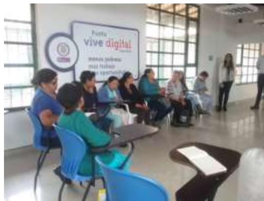
Descripción: Socialización proyecto “Trama Artesanal” Firavitoba Boyacá Julio 2019 Artesanías de Colombia