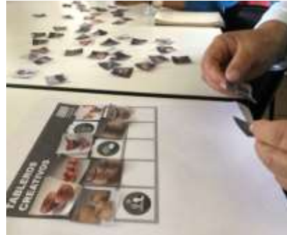
Descripción: Taller de Diversificación línea colección Iza Boyacá Tomada por Gina Arteaga Septiembre 2019 Artesanías de Colombia