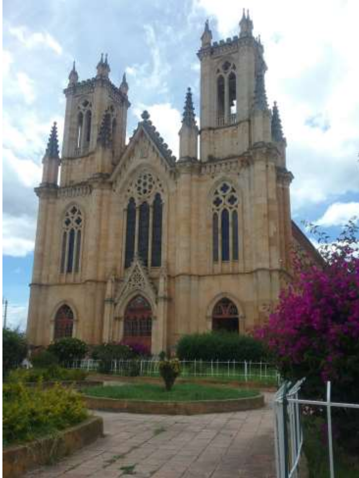
Iglesia Nuestra Señora de las Nieves de Firavitoba

El Municipio de Firavitoba se encuentra ubicado en la Provincia de Sugamuxi al centro oriente del Departamento de Boyacá, a una distancia de 9 kilómetros de la ciudad de Sogamoso, capital provincial, cuenta con área de 109.9 Km 2 , comprende tierras ubicadas entre los 2500 m. s. n. m , con una temperatura promedio de 14° C. y una precipitación media anual del orden de 750 m.m., cuenta con una población aproximada de 6552 habitantes , localizados el 25% en la cabecera municipal y el 75% en el área rural. Sus principales actividades económicas son ganadería, agricultura y minería (Caliza).