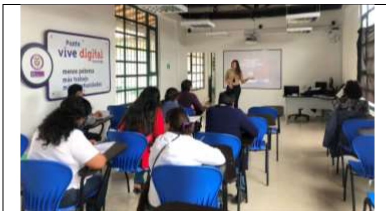
Descripción: Taller de Tendencias Firavitoba Boyacá Tomada por Gina Arteaga Agosto 2019 Artesanías de Colombia

Los beneficiarios del proyecto entendieron el concepto de tendencia para ser competitivos en el mercado. El taller dio a conocer los movimientos de diseño que se proponen como inspiración para el 2019 y las diferentes tendencias de color, formas y texturas. Así mismo se mostraron las expectativas del consumidor a la hora de adquirir determinados productos partiendo de las diferentes paletas de color propuestas en tonalidades terracotas. Al finalizar el taller se expusieron casos de aplicación de tendencias en la artesanía por categorías de productos.