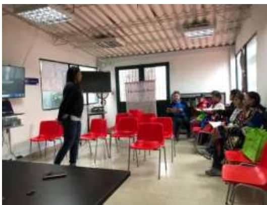
Descripción: Taller de Diversificación Línea – colección Firavitoba Boyacá

El artesano identificó los diferentes conceptos con el fin de desarrollar productos acordes con la oferta y demanda. A través de un ejercicio práctico el artesano desarrolló los conceptos de set, líneas de producto, colección teniendo en cuenta la relación con la función y dinámica del mercado (oferta - demanda) a partir de fotografías que se organizaron en tableros, luego cada participante muestra y explica el ejercicio realizado.