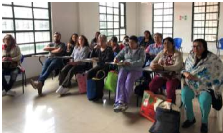
Descripción: Taller de Referentes Firavitoba Boyacá Julio 2019 Artesanías de Colombia