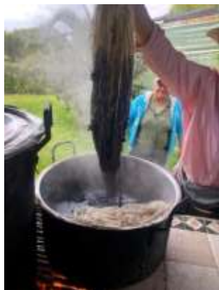
Descripción: Taller de tintes industriales Rit Iza Boyacá Septiembre 2019 Artesanías de Colombia