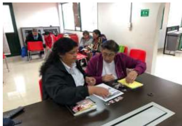
Descripción: Taller de Diversificación Línea – colección Firavitoba Boyacá