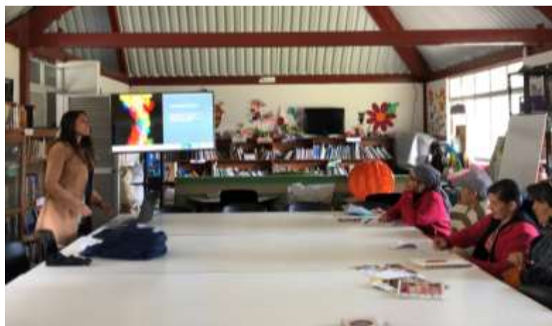
Descripción: Taller de Tendencias de color

Se retoman los principales conceptos de la presentación de tendencias, necesidades del mercado y se desarrollan ejercicios de aplicación de las mismas analizando las posibilidades reales de las técnicas y se trabajan cartas de color de acuerdo a los materiales y procesos de tinturación. Este proceso es muy importante ya que se ayuda al artesano a implementar una carta de color que se utiliza en el desarrollo de productos.