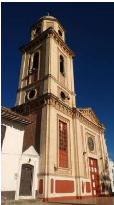
Templo Parroquial del Divino Salvador de Iza

El municipio de Iza pertenece a la provincia de Sugamuxi y se caracteriza por la conservación de su contenido histórico, el cual se manifiesta en su ancestro prehispánico, arte rupestre, mitos, leyendas, tradiciones, festejos y oficios como el tejido en algodón y lana, utilizando prácticas y telares de la España Medieval, así como en su arquitectura colonial, aspectos que le significaron su declaratoria como Bien de Interés Cultural de Carácter Nacional, por el Ministerio de Cultura de Colombia en el año 2002.