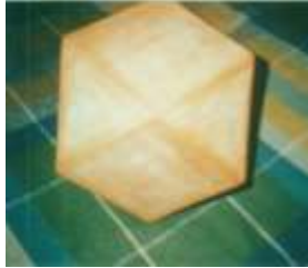
Foto # 4