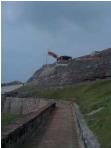
Castillo de San Felipe

Sociedad de Mejoras Públicas de Cartagena: Existe un aire de incertidumbre en el futuro inmediato de la Sociedad, ya que no se tiene información exacta de la fecha de trasteo del Castillo de San Felipe a la casa en la Calle Don Sancho