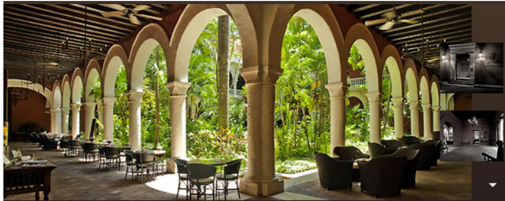
Análisis de los espacios exteriores de los hoteles para el desarrollo de los productos