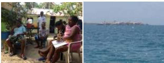
Comunidad de Isla Múcura y foto del Islote desde la lancha

Diagnóstico con comunidades artesanales jurisdicción de PNN tanto en San Bernardo como en Islas del rosario. Ya existen algunas iniciativas de artesanías con MP recicladas y con material biológico. Trabajo conjunto, donde PNN nos apoya con transporte y alojamiento de los asesores