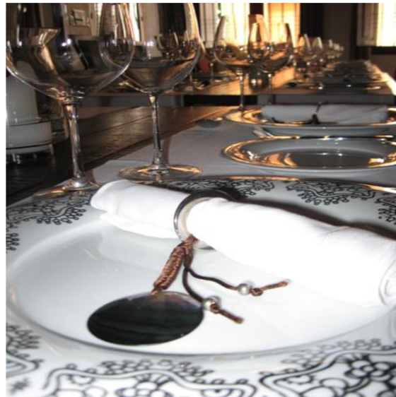
Análisis de colores y texturas actualmente utilizadas