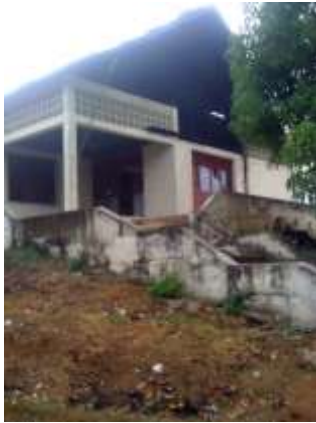
Casa de Artesanías de Colombia en San Jacinto

Gobernación se encargará de adecuar la casa para tener un taller y una muestra comercial de las artesanías de la región.