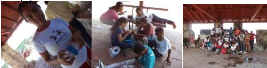
Castillo de San Felipe

Por otro lado, se han desarrollado actividades conjuntas con el área de Educación de la SMPC. Invitación a 35 niños de los Barrios Sta Rita, Petares, San Pedro, y Olaya Herrera, beneficiarios de la Alianza Tiempo de Juego/Colombianitos, quienes atienden a más de 500 niños en Cartagena. Durante la actividad se realizó una visita al castillo, una actividad de educación ambiental y se finalizó con una actividad: manualidades con material reciclado: con botellas plásticas hicimos unos monederos con la asesoría de la diseñadora del equipo del laboratorio.