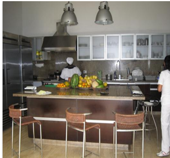
Decoración Actual hoteles Espacios Interiores