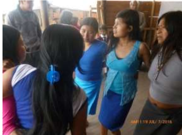
“Taller cultura Material y transferencia de saberes Comunidad Wounaan” Ciudad Bolívar, Bogotá D.C. Proyecto: “Fomento del emprendimiento artesanal en Bogotá D.C. 2015-2016” de Artesanías de Colombia S.A. y el equipo de la CMMC. Fecha: 7 de Julio de 2016.