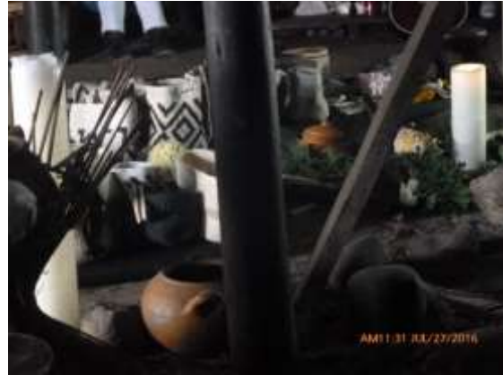
Taller cultura Material y transferencia de saberes comunidad muisca, Bosa, Bogotá D.C. Proyecto: “Fomento del emprendimiento artesanal en Bogotá D.C. 2015-2016” de Artesanías de Colombia S.A. y el equipo de la CMMC. Fecha: 27 de Julio de 2016.