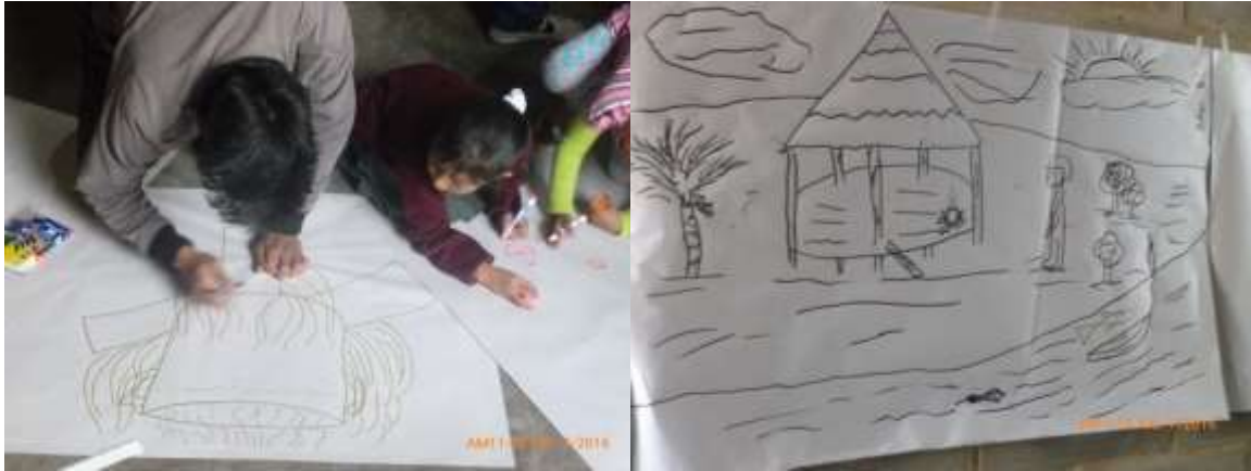
“Taller cultura Material y transferencia de saberes Comunidad Wounaan” Ciudad Bolívar, Bogotá D.C. Proyecto: “Fomento del emprendimiento artesanal en Bogotá D.C. 2015-2016” de Artesanías de Colombia S.A. y la CMMC. Fecha: 7 de Julio de 2016.