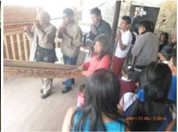
“Taller cultura Material y transferencia de saberes Comunidad Wounaan” Ciudad Bolívar, Bogotá D.C. Proyecto: “Fomento del emprendimiento artesanal en Bogotá D.C. 2015-2016” de Artesanías de Colombia S.A. y el equipo de la CMMC. Fecha: 7 de Julio de 2016.