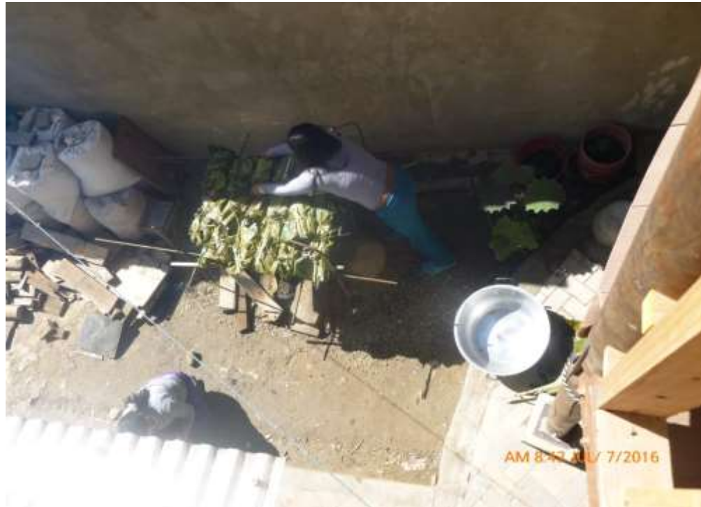
“Taller cultura Material y transferencia de saberes Comunidad Wounaan” Ciudad Bolívar, Bogotá D.C. Proyecto: “Fomento del emprendimiento artesanal en Bogotá D.C. 2015-2016” de Artesanías de Colombia S.A. y la CMMC. Fecha: 7 de Julio de 2016.