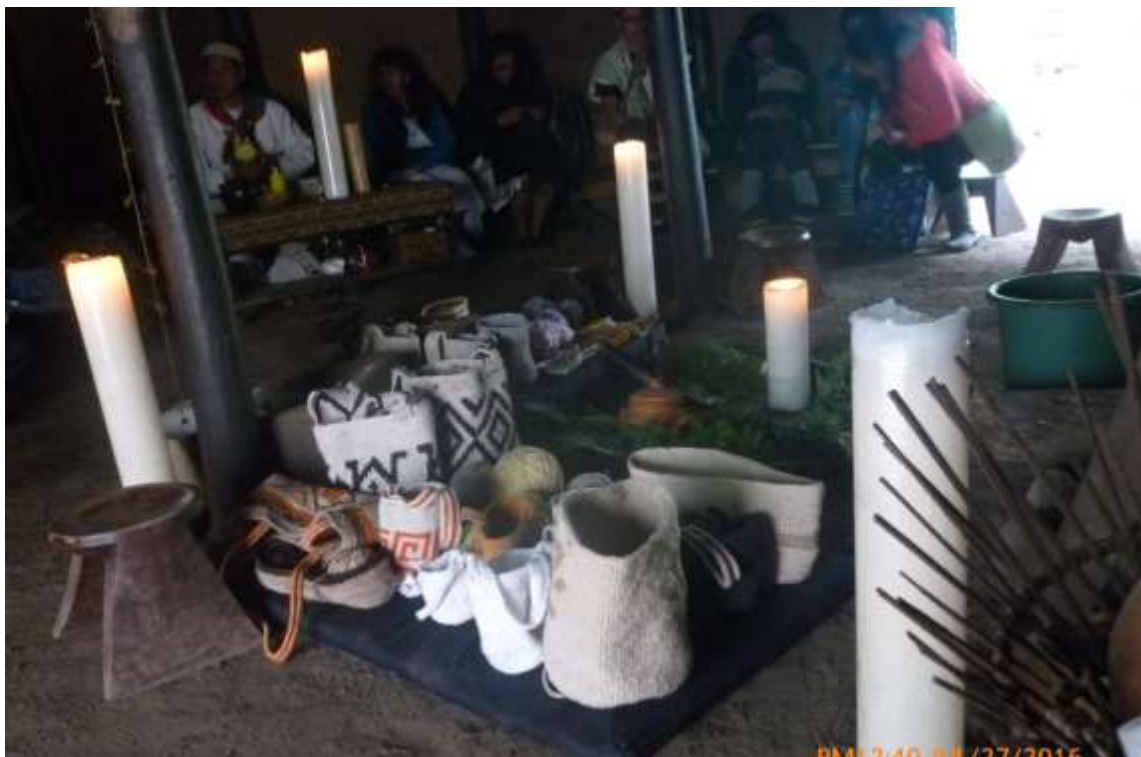
Taller cultura Material y transferencia de saberes comunidad muisca, Bosa, Bogotá D.C. Proyecto: “Fomento del emprendimiento artesanal en Bogotá D.C. 2015-2016”

En el centro del Kusmuy se disponen todos los elementos ceremoniales y los productos desarrollados por las tejedoras que son para el ofrecimiento y la bendición en el ritual.