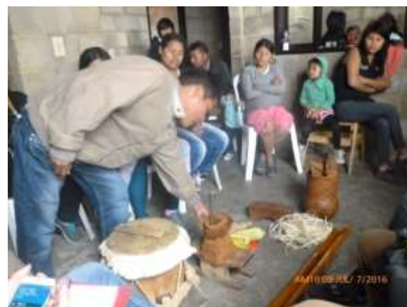
Taller cultura Material y transferencia de saberes Comunidad Wounaan” Ciudad