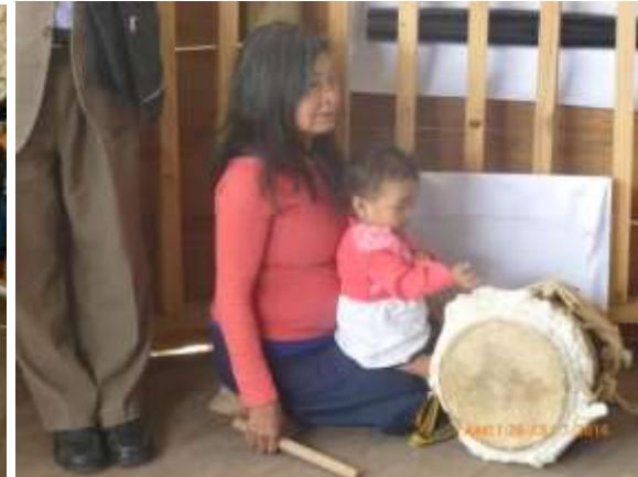
“Taller cultura Material y transferencia de saberes Comunidad Wounaan” Ciudad Bolívar, Bogotá D.C. Proyecto: “Fomento del emprendimiento artesanal en Bogotá D.C. 2015-2016” de Artesanías de Colombia S.A. y el equipo de la CMMC. Fecha: 7 de Julio de 2016.