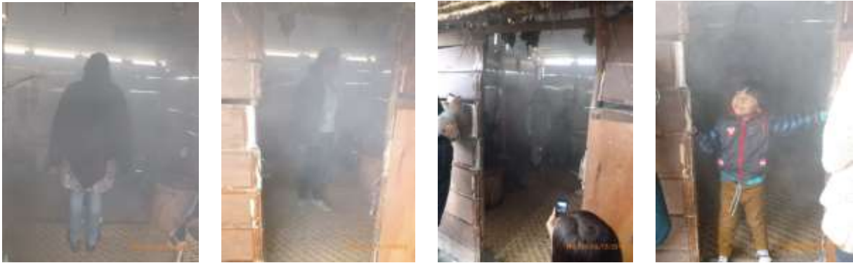
Taller cultura Material y transferencia de saberes Pueblo Inga” Casa de Pensamiento Inga, Barrio el Sosiego, Localidad San Cristóbal, Bogotá D.C. Proyecto: “Fomento del emprendimiento artesanal en Bogotá D.C. 2015-2016” de Artesanías de Colombia S.A. y el equipo de la CMMC. Fecha: 15 de Julio de 2016.

→ Cada persona se va sentando en un círculo sobre su respectivo banco de madera.