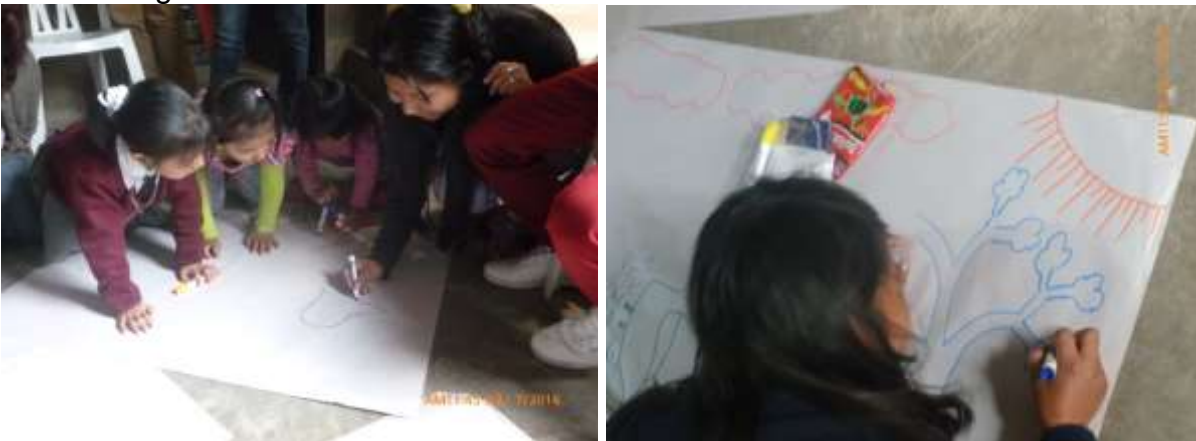
“Taller cultura Material y transferencia de saberes Comunidad Wounaan” Ciudad Bolívar, Bogotá D.C. Proyecto: “Fomento del emprendimiento artesanal en Bogotá D.C. 2015-2016” de Artesanías de Colombia S.A. y la CMMC. Fecha: 7 de Julio de 2016.