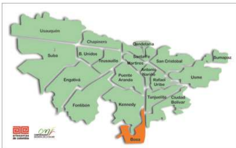
Mapa de la Localidad de Bosa.