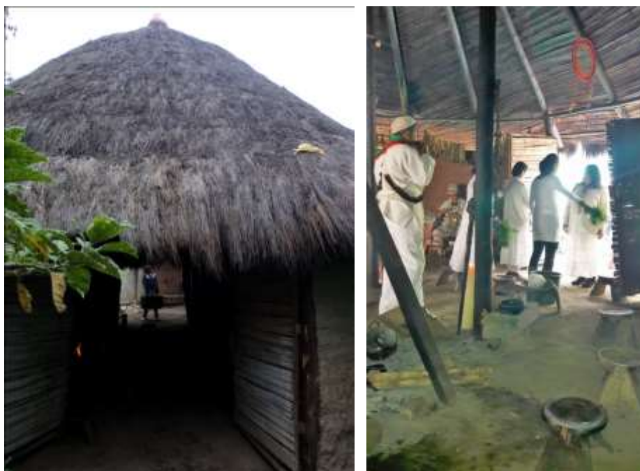
Bogotá, Cabildo Muisca, Localidad Bosa. Imagen: DI. Gabriela Oliva. Fecha 27 julio 2016. Artesanías de Colombia.

Los integrantes de la comunidad compartieron conocimientos acerca de su cosmovisión, de su cultura, su organización sociocultural y económica, y sobre la recuperación de las costumbres y legados ancestrales.