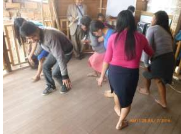
“Taller cultura Material y transferencia de saberes Comunidad Wounaan” Ciudad Bolívar, Bogotá D.C. Proyecto: “Fomento del emprendimiento artesanal en Bogotá D.C. 2015-2016” de Artesanías de Colombia S.A. y el equipo de la CMMC. Fecha: 7 de Julio de 2016.