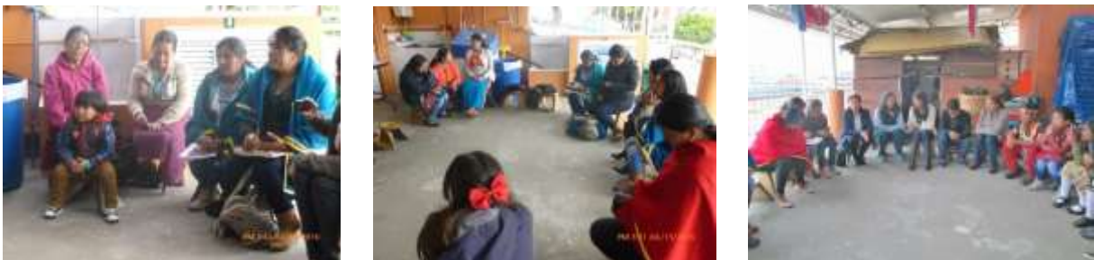
Taller cultura Material y transferencia de saberes Pueblo Inga” Casa de Pensamiento Inga, Barrio el Sosiego, Localidad San Cristóbal, Bogotá D.C. Proyecto: “Fomento del emprendimiento artesanal en Bogotá D.C. 2015-2016” de Artesanías de Colombia S.A. y el equipo de la CMMC. Fecha: 15 de Julio de 2016.

→ Cada persona se va sentando en un círculo sobre su respectivo banco de madera.