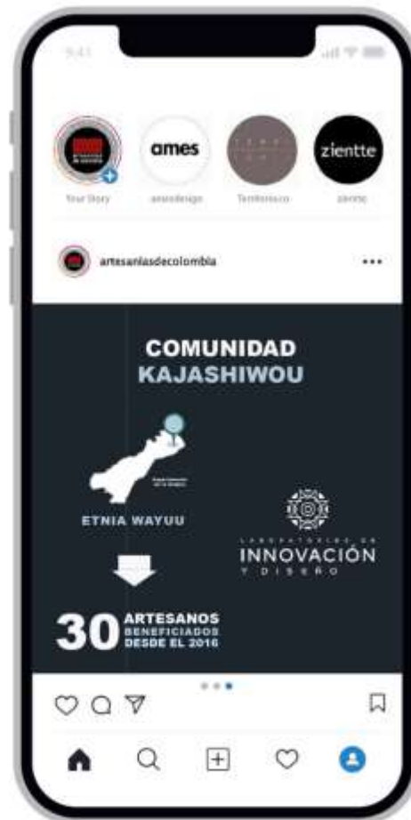
Caption: La comunidad de Kajashiwou, ubicada en el municipio de Uribia, Alta Guajira, se dedica a la elaboración del sombrero tradicional de la etnia Wayuu, y principalmente los hombres son quienes lo trabajan. La materia prima utilizada es la mawisa, una paja que se da en la Serranía de La Macuira. A través del trabajo con los Laboratorios de Innovación y Diseño de Artesanías de Colombia, se han desarrollado nuevos productos, que han permitido que la comunidad genere ingresos en diferentes mercados a nivel nacional. #artesaniasdecolombia #artesano #artesaniawayuu #compralonuestro #proCOVID19