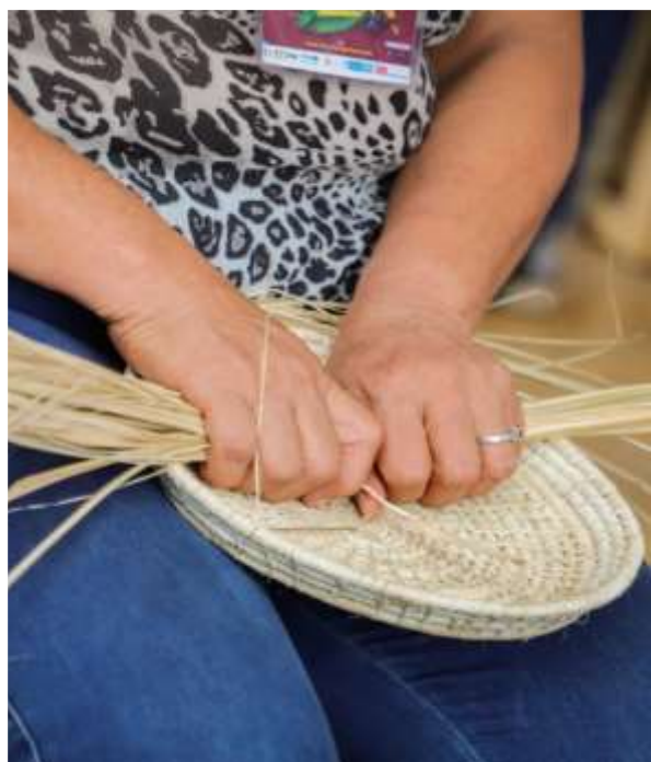
Feria "Origenes de mi Tolima" 13, 14, 15 de marzo 2020