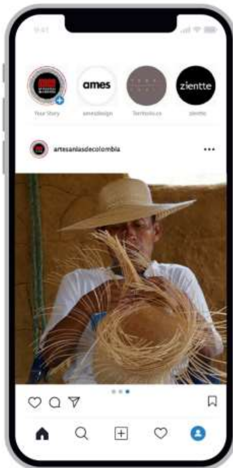
Tercer slide Proceso Productivo