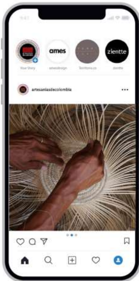
Segundo slide Proceso Productivo