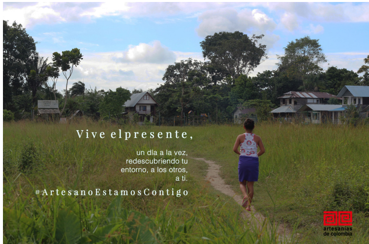
Imágenes 4, 5 y 6: postales entregadas a artesanos beneficiarios del programa APV sobre cuidado emocional durante la cuarentena (Ferrari, S., 2020).