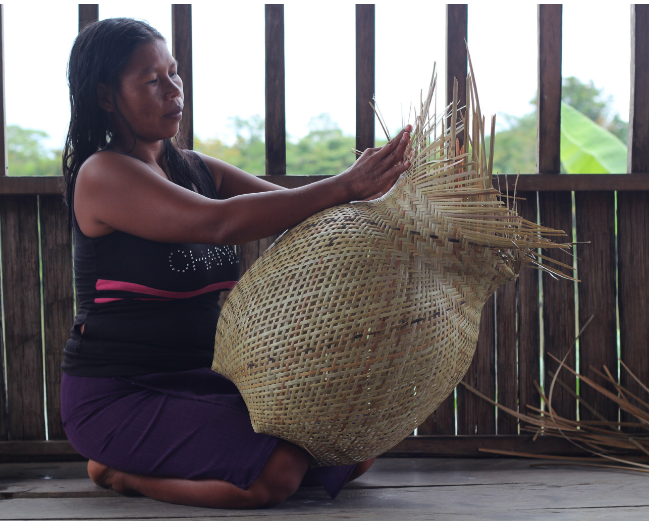
Foto 2: artesana de Bellavista. Guapi, Cauca.