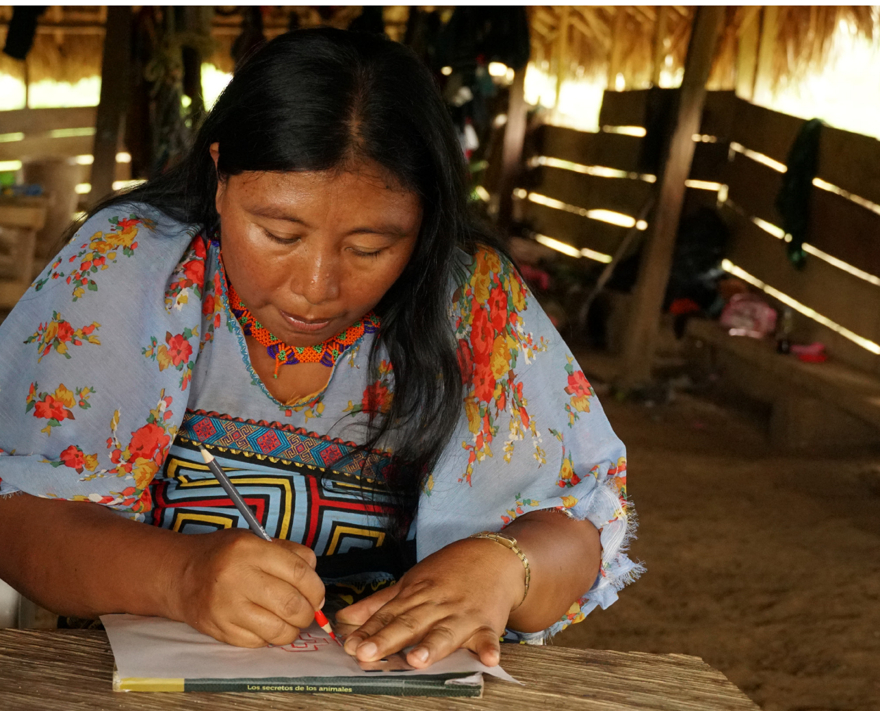
Foto 1: mujer Gunadule diseñando. Turbo, Antioquia.