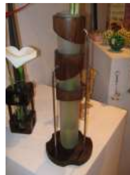
Solitario y florero. Guadua, vidrio y acero

Acciones en diseño: Con esta unidad productiva se realizó el desarrollo de nuevas líneas de producto que complementaran las actuales (candelabros - fruteras) a partir de segmentos de guadua armados con acero inoxidable y madera. Es de notar que los objetos están compuestos por las mismas piezas, que se rotan y arman según los requerimientos del diseño.