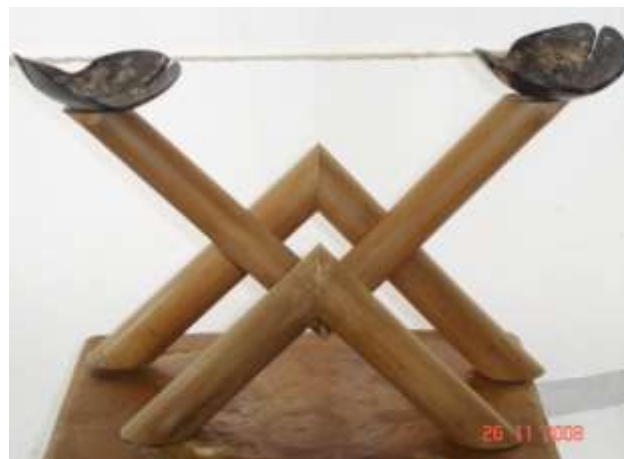
Candelabro de mesa