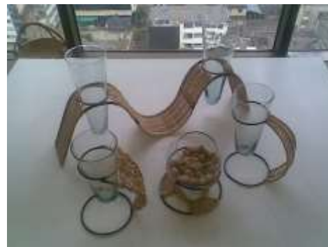
Línea de Floreros. Estructura metálica, tejido tripeperro y contenedores de vidrio