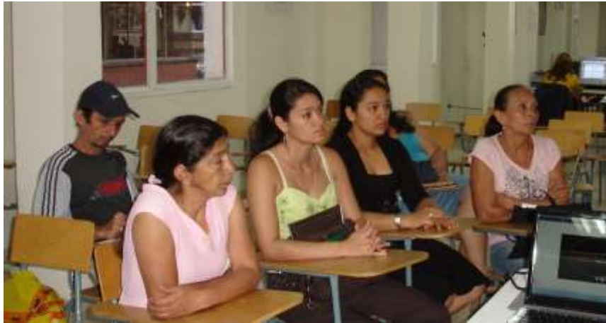
Artesanos de Asodisquim en la capacitación de Metodología de Diseño

Telares del Café: Grupo conformado por 4 mujeres cabeza de hogar del municipio de Calarcá.