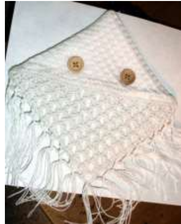
Producto mejorado: se percibe el avance en combinación de color, aplicación de materiales como algodón y detalles en madera.