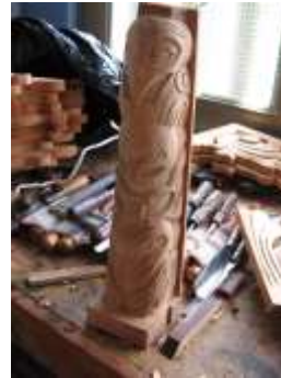
Tallas sobre madera