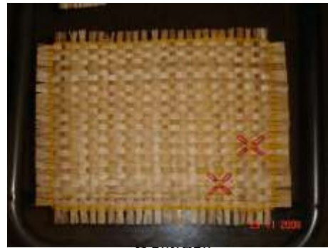
Producto mejorado: se percibe manejo de color, limpieza en el tejido, adecuación de tamaño del individual a 45x30 cm.