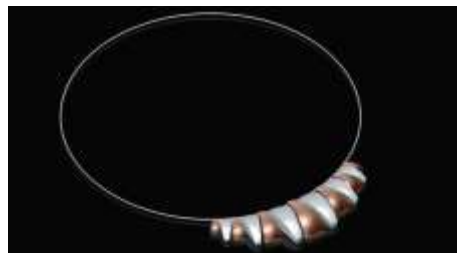
Línea planteada para Asodisquim: Collares combinados en plata y coco