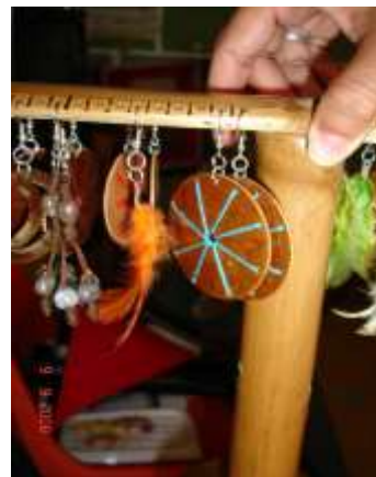
Productos de las asociadas de Asamet

Acciones en diseño: Se han realizado 40 asesorías de producto a 12 beneficiarias, en las cuales se ha enfatizado en el mejoramiento de acabados, rediseño de productos que puedan incursionar en nuevos nichos de mercado. Los resultados han sido satisfactorios, ya que las nuevas propuestas han tenido gran aceptación por parte de los consumidores. Entre las artesanas para destacar se encuentran: