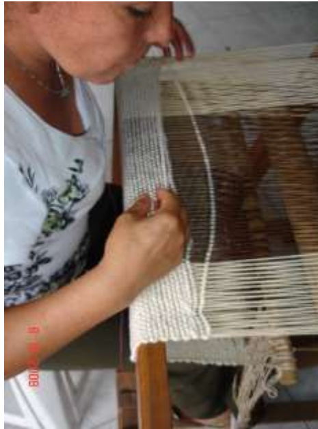
Artesana tejiendo en telar horizontal

Taller Artesanal Badú: Unidad Productiva del municipio de Salento, dedicada al oficio de la Guadua