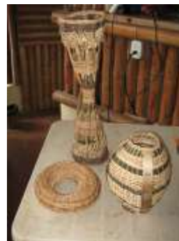
Contenedor con aplique en guadua