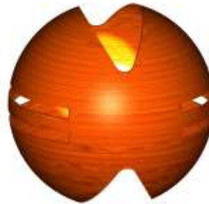
Lámparas en totumo: de pared, de techo, de piso