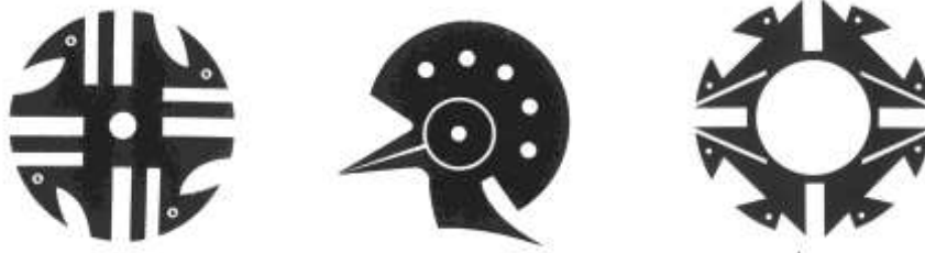
Motivos de inspiración para la nueva línea en cerámica

Acciones en diseño: Aplicado el conocimiento en los distintos procesos cerámicos y la inquietud del artesano por el tema precolombino las asesorías a los productos se centraron en la exploración de imágenes y diseños precolombinos aplicados a objetos utilitarios de mesa y decoración. La unidad desarrolló una línea de accesorios inspirados en gráficos precolombinos que incluyen una batea, dos fruteras y dos candelabros. A partir de motivos planos se concibieron volúmenes que puede albergar una función.