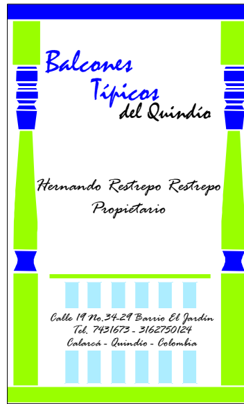
TARJETA DE PRESENTACIÓN