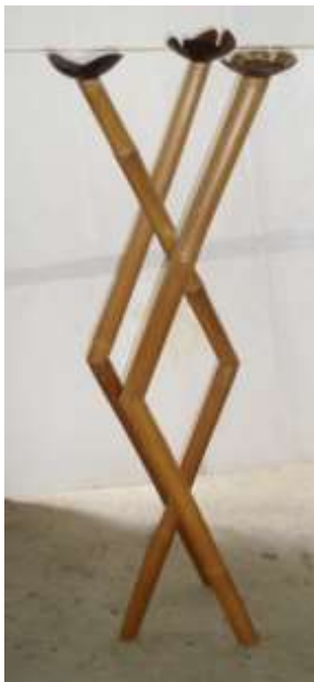
Candelabro de piso