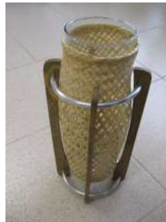
Mesa para desayuno y florero - Guadua viche tejida