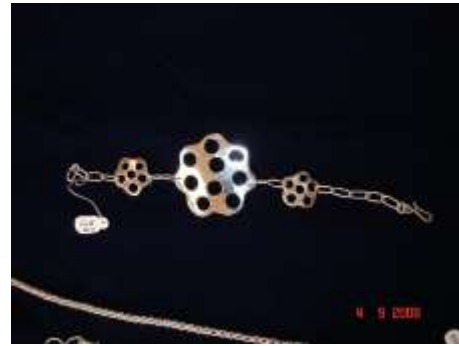
Productos de Asodisquim

Acciones en diseño: para esta asociación se dejan planteadas dos líneas de producto, la cual no se pudo elaborar debido a conflictos internos de esta organización. Se espera que para el próximo año se puedan elaborar los primeros prototipos. La identidad corporativa se encuentra en proceso ya que deben definir primero el nombre para el taller. Los artesanos de esta asociación han sido capacitados en Metodología de Diseño, por lo tanto, se espera para el próximo año un avance en cuanto al desarrollo conceptual de sus piezas.