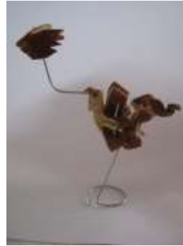
Nuevos diseños., portafotos y tarjetero para una línea de utilitarios de oficina.