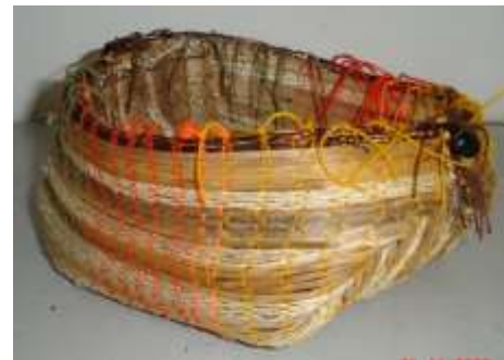
Desarrollo de productos con volumen a partir del individual.