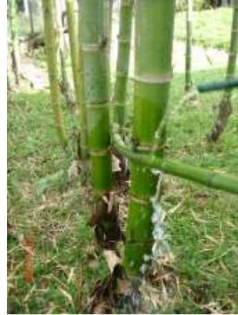
Ensayos para doblar el bambú