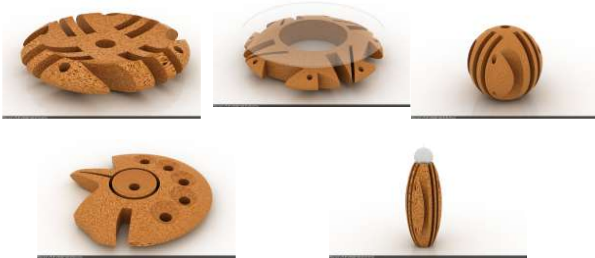
Render, línea de utilitarios en cerámica con inspiración precolombina