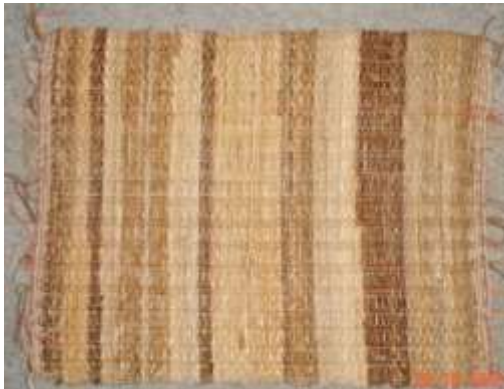
Individual elaborado por las artesanas en telar horizontal