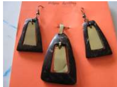
Rediseño. Aderezo y aretes. Se mezcló bronce y coco en diseños limpios con posibilidad de movimiento