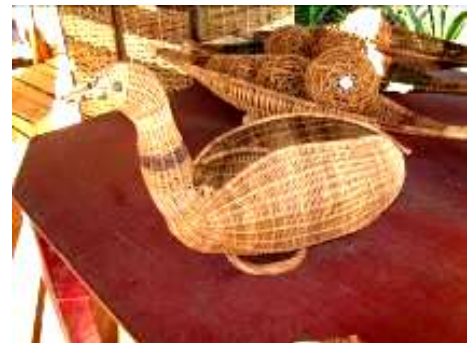
Productos artesanales Filandia, en su orden: contenedor, lámparas y porta-huevos