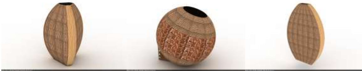
Render. Nueva línea de contenedores de Filandia.

Acciones en diseño: Con el grupo se desarrolló un trabajo en el manejo de tintes naturales para el bejuco y la mezcla de materiales (metal y guadua) en los tejidos, con el fin de permitir la exploración de nuevas composiciones y efectos visuales, logrando también la reducción del uso de bejuco (manejo de un componente ambiental ante una planta que necesita su conservación), y el desarrollo de diseños contemporáneos que ostenten alternativas para la cestería cada vez más apartadas de los contenedores tradicionales.