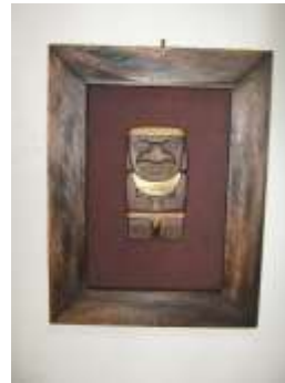
Retablo con figura precolombina

Acciones en diseño: Aplicado el conocimiento en los distintos procesos cerámicos y la inquietud del artesano por el tema precolombino las asesorías a los productos se centraron en la exploración de imágenes y diseños precolombinos aplicados a objetos utilitarios de mesa y decoración. La unidad desarrolló una línea de accesorios inspirados en gráficos precolombinos que incluyen una batea, dos fruteras y dos candelabros. A partir de motivos planos se concibieron volúmenes que puede albergar una función.