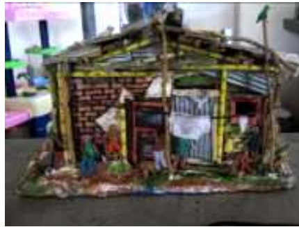
Miniatura, cerámica y papel

Ceramista que se ha enfocado a la miniatura de escenas costumbristas de tugurios, tabernas y pesebres. El artesano tiene buenos conocimientos de las diferentes técnicas para el trabajo en cerámica que podrían tener potencial para el desarrollo de nuevos objetos.