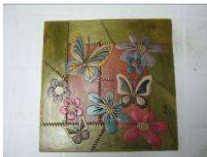
Cuadro, enchapen Hoja Caulinar de la guadua

Enchapados en Hoja caulinar tinturada de la guadua sobre distintos soportes. Los productos de esta unidad productiva se centran en cuadros para pared y enchapes en algunos objetos en guadua. Es de resaltar lo interesante de la técnica, el color y los acabados.