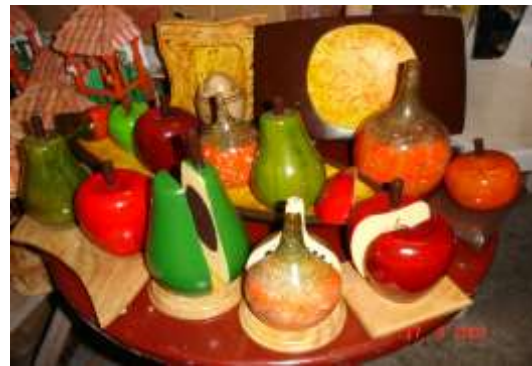
Productos del Almacén Artesanal Asociación de Artesanos de Calarcá