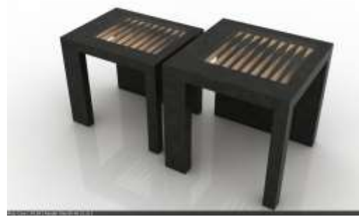
Juego de mesas. Madera oscura con apliques en guadua laminada curvada.