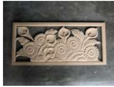
Tallas sobre madera y mdf. Motivos florales