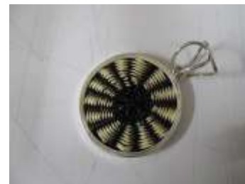
Nuevos Diseños de dijes con semillas de cedro, tejido en güerregue y plata

Es así, que las asesorías se orientaron hacia la realización de una nueva propuesta de collar con detalles tejidos; se asesora en nuevas aplicaciones para los personajes en semillas (que actualmente son llaveros) como prendedores. Está pendiente su elaboración.