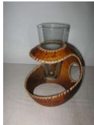
Nuevos Diseños de contenedores y flore. Totuma, madera, acero y guasca.