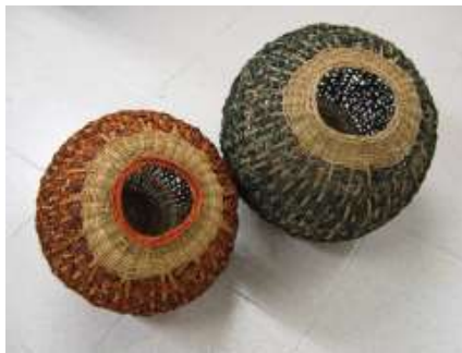
Contenedores. Nuevo diseño en tejido de trenza tinturado