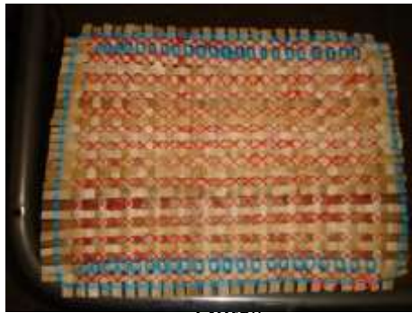
El individual en el proceso de mejoramiento: se recomienda utilizar el tejido en pequeños

Las asesorías se orientaron al mejoramiento de producto de acuerdo con las dos técnicas que dominaba la artesana: enchape y tejido en calceta de plátano. La técnica de enchape en guasca se aplicó para mejorar las postales actuales y realizar unas nuevas con motivos alusivos al Quindío; por otro lado, se realizó el mejoramiento de los individuales tejidos en calceta de plátano, ya que al principio realizaba el borde con lana, por lo tanto, se recomendó utilizar fibras naturales como el fique y la aplicación de algún detalle en este mismo. En las fotos podemos observar los resultados: