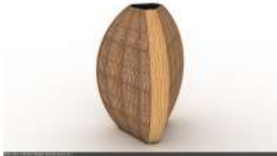
Nueva línea de contenedores de Filandia.

diseño formal con un valor estético alto, hacen de la nueva línea un complemento idónea a la tradicional, generando oportunidades de negocio mayores y la incursión en nuevos nichos mercados.