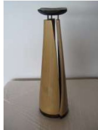
Nueva línea de decoración y utilitarios en guadua. Fruteras y candelabro.