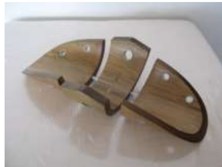
Frutera. Armado de guadua con ensambles e incrustaciones en aluminio

Como complemento a los productos de la unidad y con el ánimo de incentivar el diseño, la mezcla de materiales y el desarrollo de líneas de decoración se diseñó un juego de mesas en madera con apliques en guadua laminada curvada.