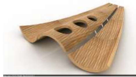
Render. Candelabro y frutera en guadua