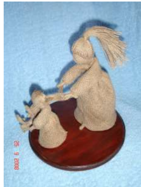
Producto elaborado en fique por Arte Q