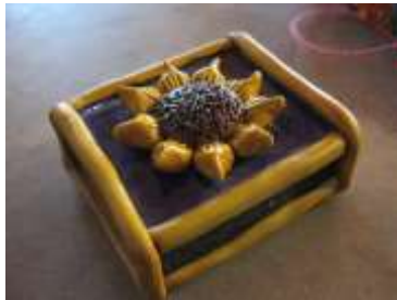
Cofre. Vidrio y resina