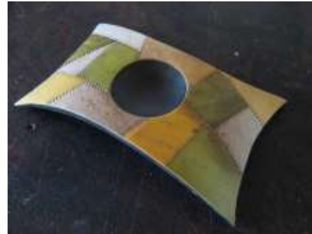
Batea. Diversificación de producto. La técnica aplicada a retablos se traslado a objetos utilitarios.