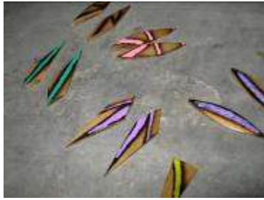
Bisutería, Guadua con apliques en pintura y soplete