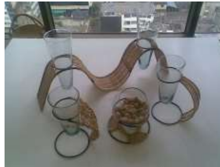
Línea de Floreros. Estructura metálica, tejido tripeperro y contenedores de vidrio