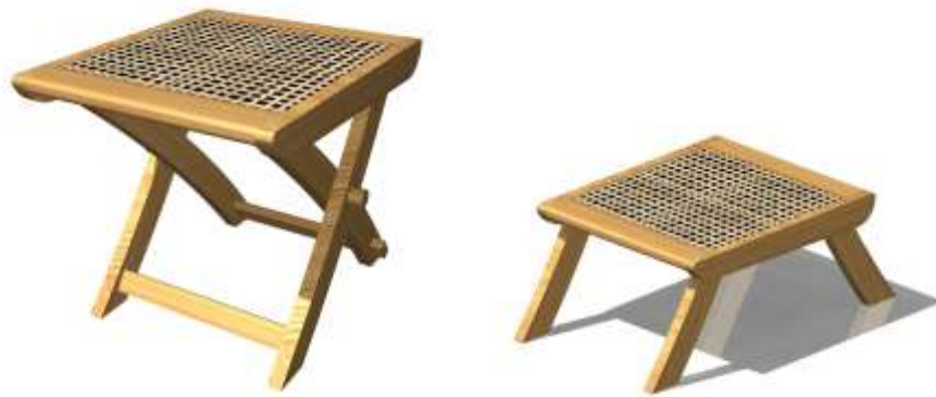
Banquito y mesa de servicio elaborados en guadua biche con tejidos finos de bambú

Acciones en diseño: Se diseñó una línea de objetos utilitarios tales como: mesa de servicio (desayuno) y butacos de dos tamaños. Se asesoró en exploración del color para generar contraste entre el acabado natural de la guadua biche y algunas piezas tinturadas en tonos oscuros.