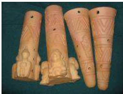
Incensarios, cerámica con motivos precolombinos

Decoraciones en cerámica con motivos precolombinos y típicos. El artesano de esta unidad productiva tiene consolidada una línea de productos de los que se destacan los apliques y cuadros para pared.