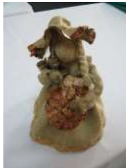
Rediseño, chapolera en yute. Se enfatizo en los gestos y decoraciones (cascara de huevo) de la figura.

Acciones es diseño: El acompañamiento a la unidad productiva se centro en la exploración de motivos míticos y típicos de la región junto con la mejora de las técnicas y acabados sobre materiales naturales.