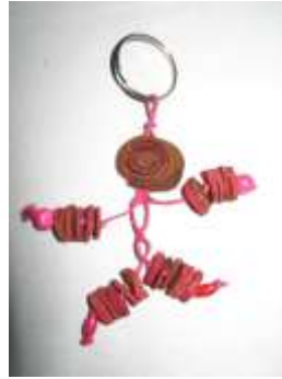
Rediseño, Llaverito en cascara de naranja. De un ensartado sin forma se configura una figura humanoide con menos material

Acciones en diseño: El desarrollo de nuevos productos se enfocó a la línea de utilitarios para oficina cambiando el formato de figuras tradicionales en cascara de naranja (figuras típicas) por motivos más “amistosos” y minimalistas.