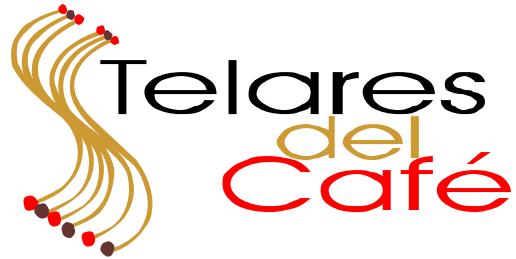
Logo para Imagen Corporativa