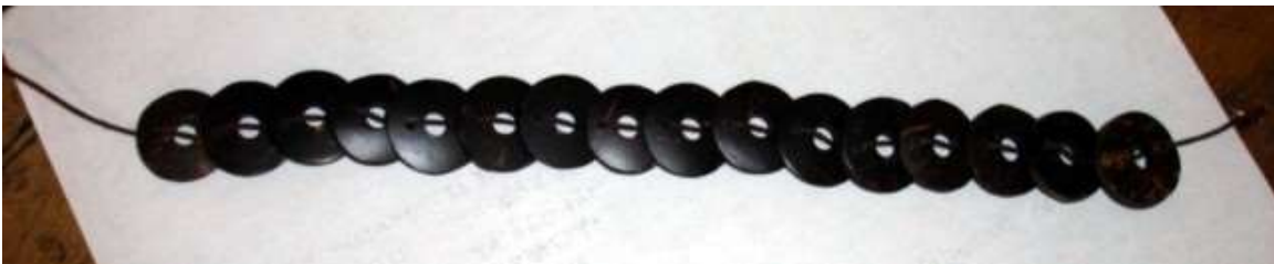
Producto mejorado en cuanto a acabados y exploración de nuevas composiciones

En cuanto a mejoramiento de producto actual, se recomendó realizar textura a los brazaletes en guadua por medio de pintura y cinta de enmascarar. Además se realizaron diferentes collares a partir de módulos de cáscara de coco.