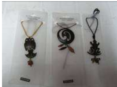
Bisutería, coco y cobre

Artesano dedicado a la Bisutería y la Joyería en plata, bronce y Cuero. Actualmente esta experimentando con diseños en los que incluye piedras de río seleccionadas, junto con los materiales anteriormente descritos. El desarrollo de mejores acabados y la fusión de técnicas y material constituyen el camino a seguir para el mejoramiento de esta unidad productiva.