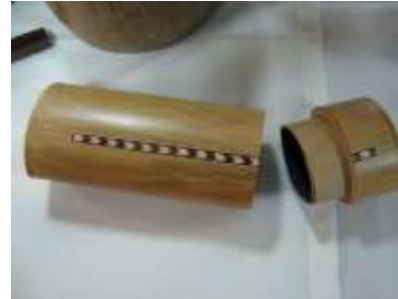
Rediseño portagafas. Incrustación en fibras naturales

Acción en diseño: La labor de asesoramiento se encaminó a reforzar la mezcla de materiales (incrustaciones sobre la guadua en metal y fibras), y al diseño de objetos utilitarios con un alto componente estético y de sofisticación a través de segmentos de guadua y ensambles, reemplazando de esta manera los diseños convencionales en guadua rolliza. De este concepto se desarrolló una frutera de tres segmentos de guadua con armados e incrustaciones en aluminio.