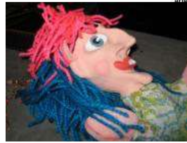
Marioneta, papel reciclado