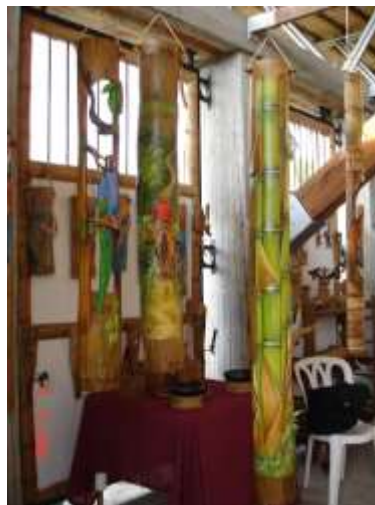
Productos de la Aldea Artesanal

Esta asociación de artesanos está compuesta por 33 miembros (de los cuales 4 son activos) dedicados a la elaboración de productos en guadua y madera. La acción en diseño es mejorar los souvenirs en guadua.