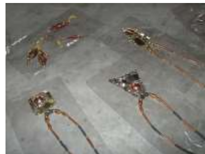
Orfebrería . Aretes, y collares en bronce y cerámica