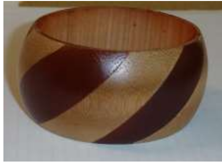
Producto mejorado en cuanto a acabados y exploración de nuevas composiciones