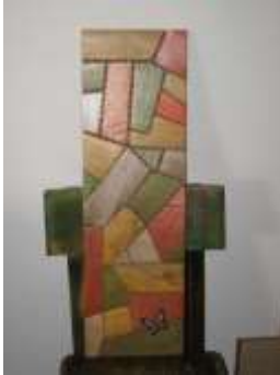
Rediseños de retablo. Se modificaron las dimensiones para darle un formato más contemporáneo

como bateas y contenedores en madera enchapados con la técnica. Con esta unidad se debe profundizar de igual manera el manejo de nuevos motivos “pictóricos” que resalten el material y la técnica.