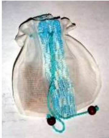
Se recomienda mejorar la combinación de color y utilización de materiales acordes con las características del producto.

Es una artesana dedicada a la elaboración de manualidades en diferentes técnicas. En las asesorías de diseño se recomendó aplicar la técnica del macramé en productos que puedan tener mayor rotación comercial, entre ellos, las bolsitas de tela para diferentes usos.