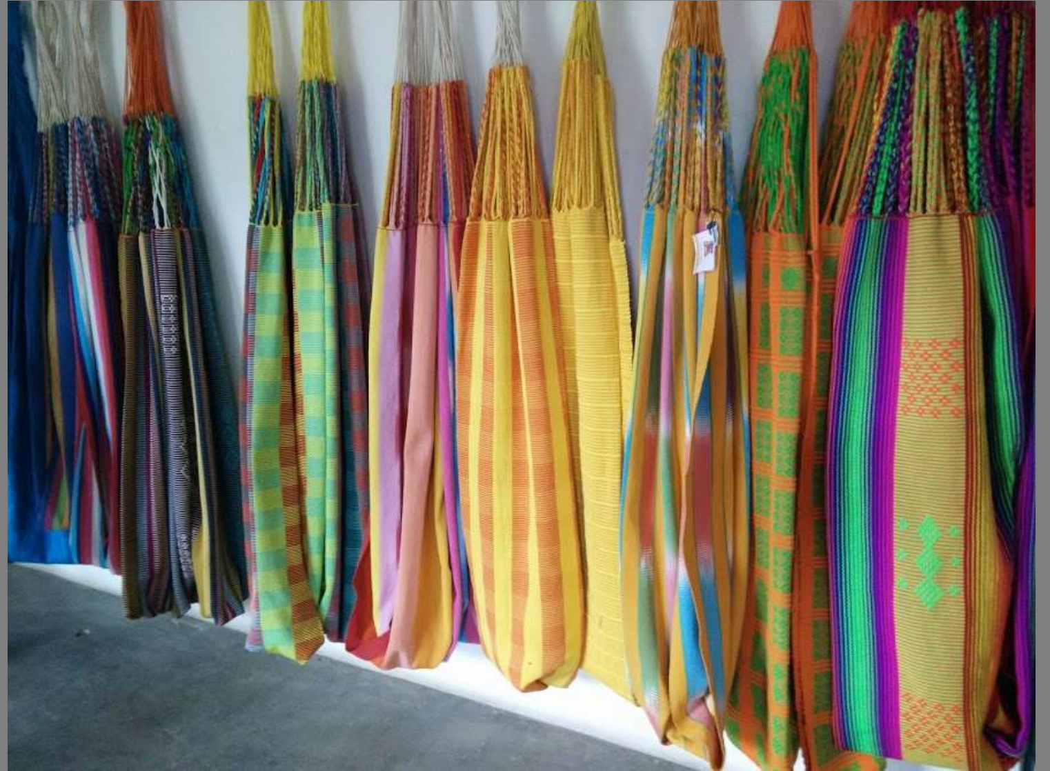
TALLER DE VITRINISMO, SAN JACINTO BOLIVAR