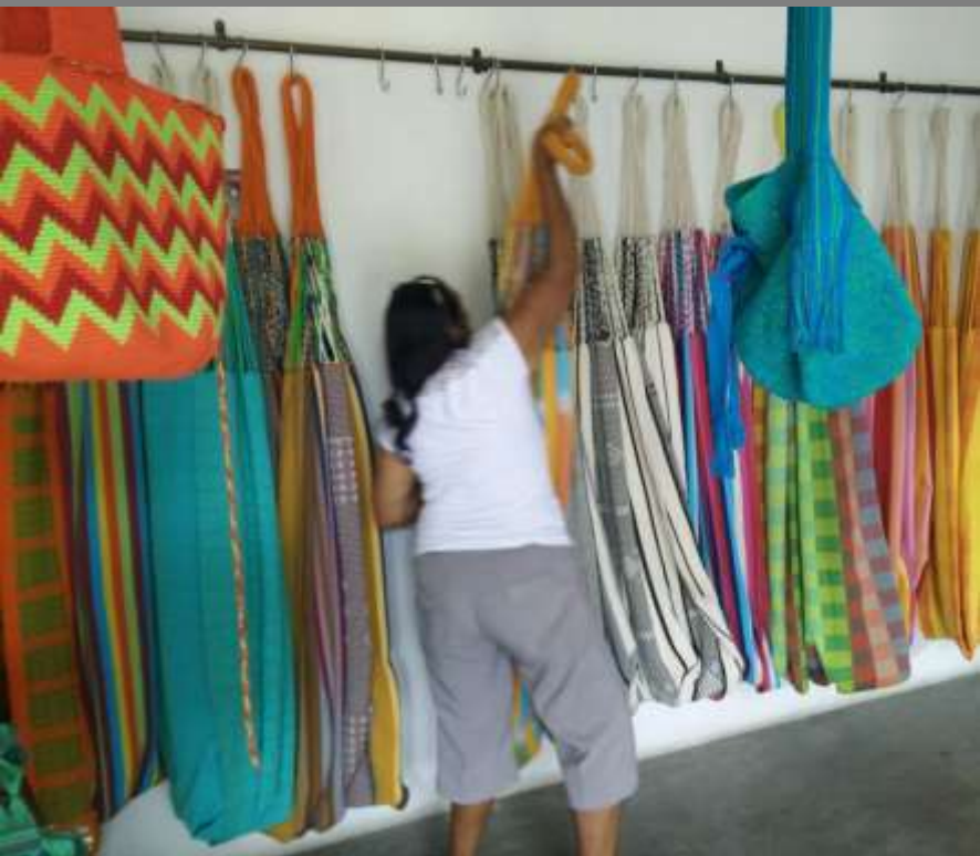
TALLER DE VITRINISMO, SAN JACINTO BOLIVAR