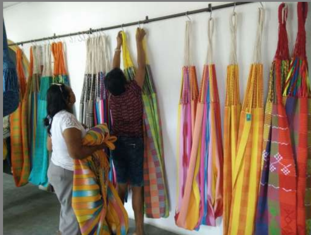
TALLER DE VITRINISMO, SAN JACINTO BOLIVAR