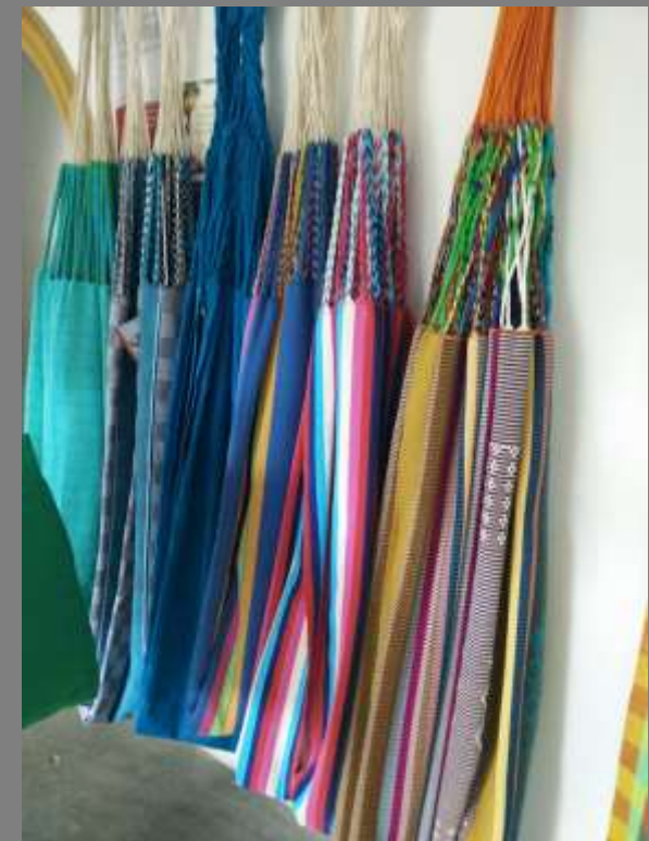
TALLER DE VITRINISMO, SAN JACINTO BOLIVAR