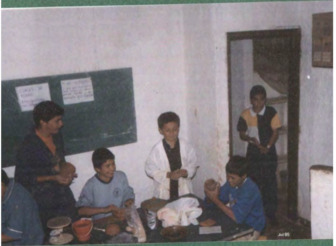
NINOS APRENDIENDO CERAMICA