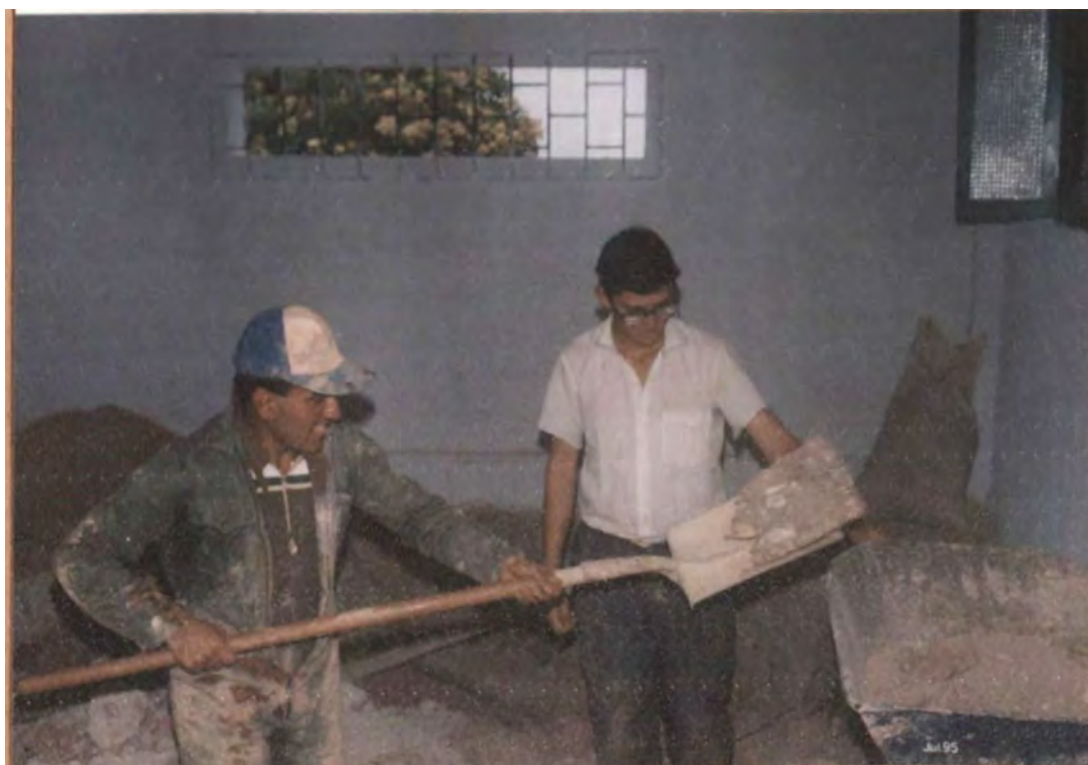
TRITURADO Y ZARANDEADO EN SECO