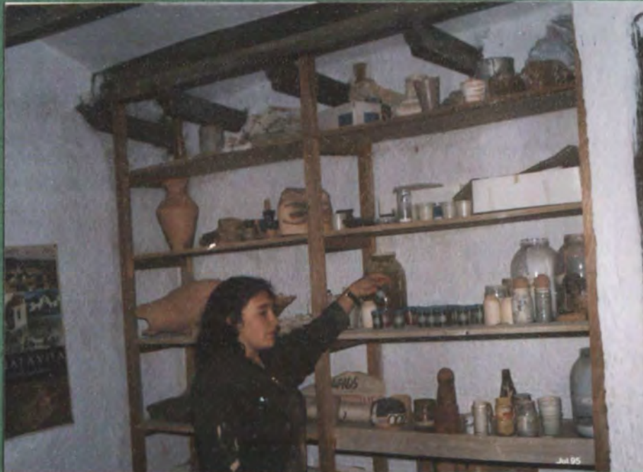
PROFESORA EXPLICANDO ESMALTES Y ENGOMBES