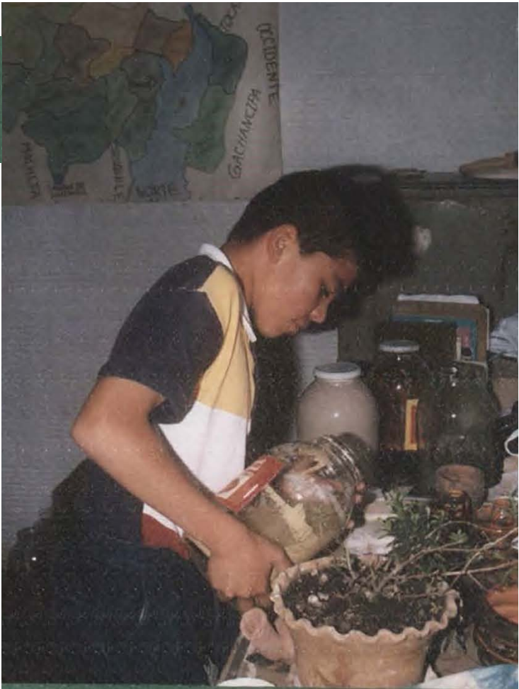
NINO PREPARANDO PIEZAS POR EL METODO DE VACIADO