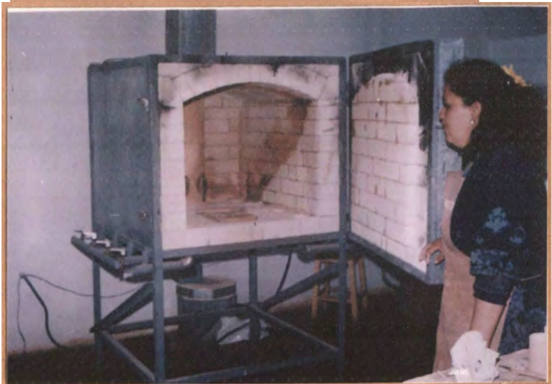
HORNO A GAS