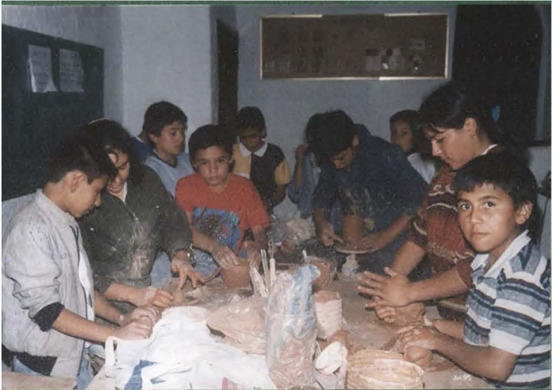
NINOS EN CURSO DE CERAMICA