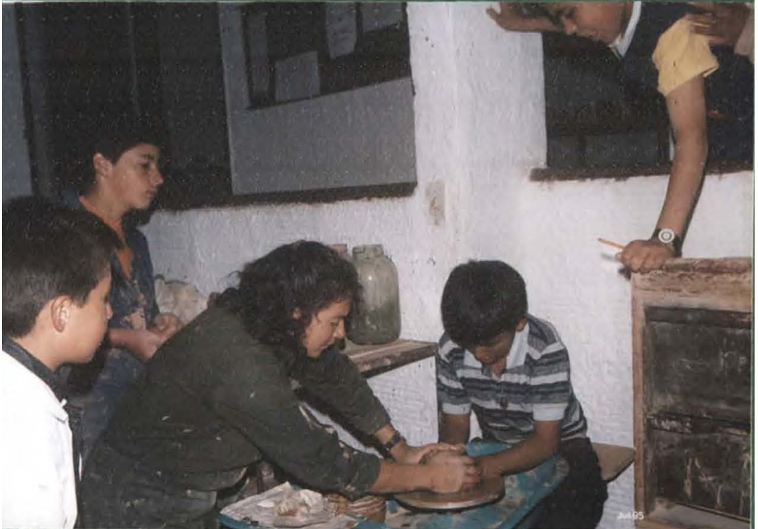
CURSO DE TORNO DE LEVANTE