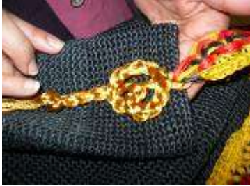
Desarrollo de accesorio Nora Alcalde