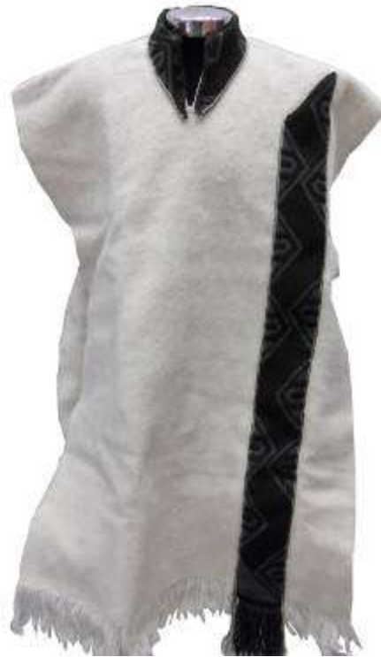
Implementación de ruanas masculinas con intervención de riatas tejidas en telar vertical manual.