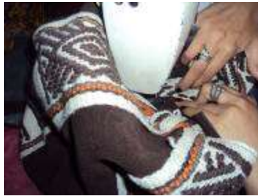
Combinación con cuero Camilo Jamioy