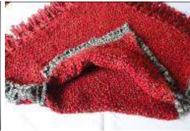
Desarrollo de ruana Patricia Gutiérrez

Se logra la transformación de la materia prima y su combinación con otros materiales dando vida a nuevos productos.