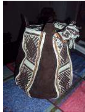
Desarrollo de accesorio Camilo Jamioy

Se plantea el desarrollo de accesorios interviniéndolos con insumos que dan mejor consistencia a sus acabados.