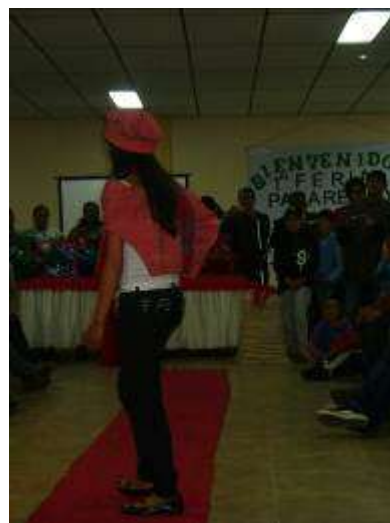
Desarrollo de la primera pasarela artesanal Marulanda noviembre/2011