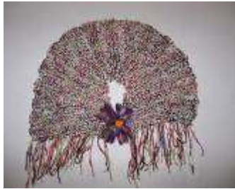
Desarrollo de cuello Claudia Uribe