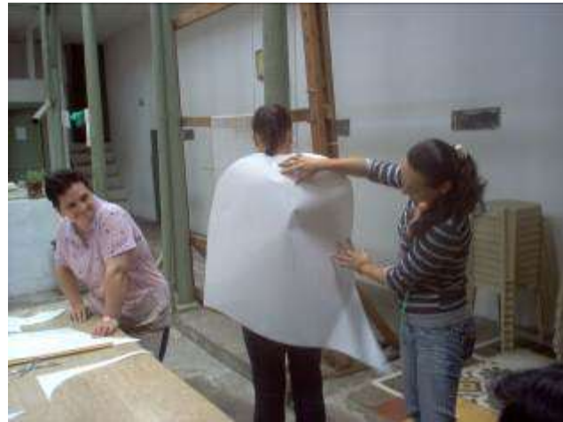
Taller de capacitación en modelaje sobre maniquí y Patronaje industrial, y desarrollo de la colección masculina de invierno propuesta en textiles de lana natural.