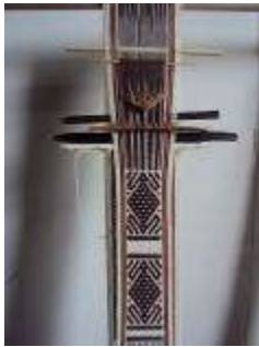
Riata de lana en telar vertical. Camilo Jamioy

Se logra la transformación de la materia prima y su combinación con otros materiales dando vida a nuevos productos.