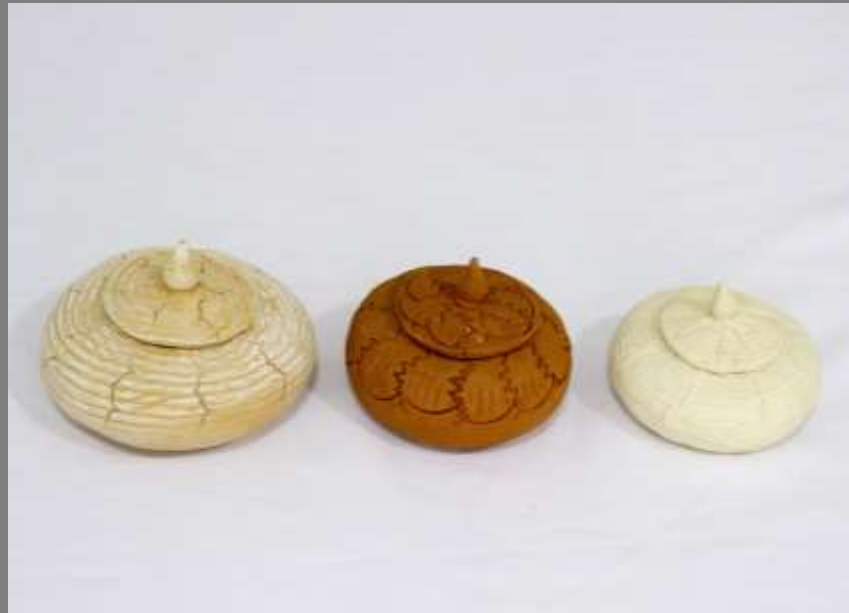
Nuevos desarrollos: trabajo en texturas y nuevas formas.