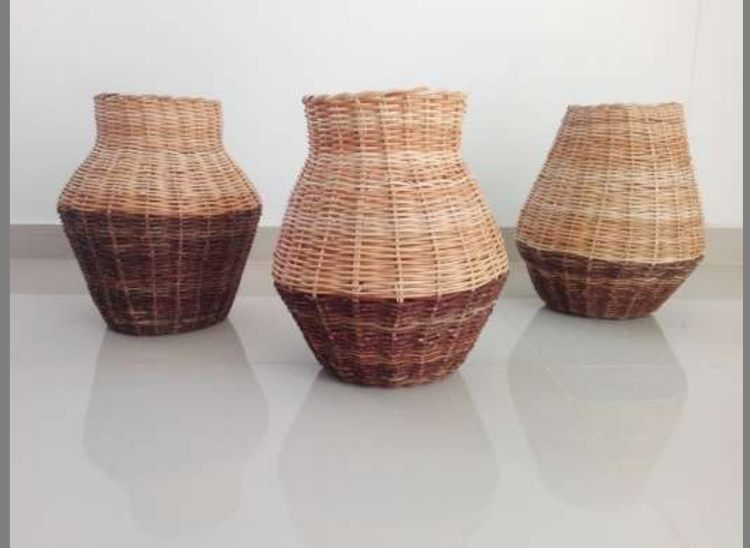
Nuevos desarrollos: formas con aristas y con mezcla de materiales en diferentes tonos.