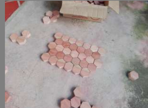
Nuevos desarrollos: pruebas con tintillas y con colores naturales