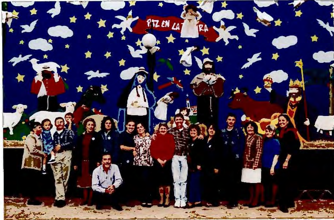
Foto tomada el miércoles 22 de Dic. con el grupo de artesanos que elaboraron las figuras. Un día después de la celebración, pasaron la carta de queja.