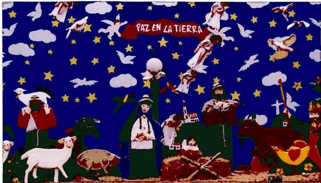
Detalles de las figuras principales del pesbre