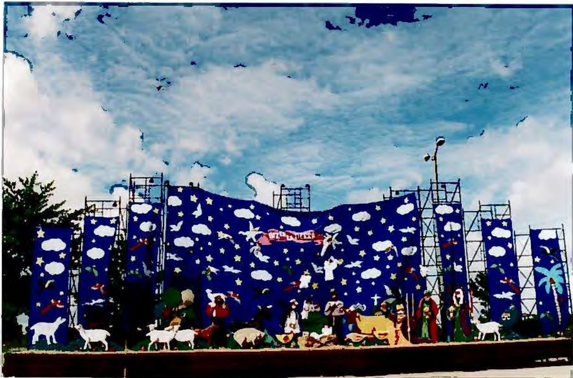
Vista del pesebre del Parque Simón Bolívar cuyo telón de fondo se rasgó en dos oportunidades debido al fuerte viento.