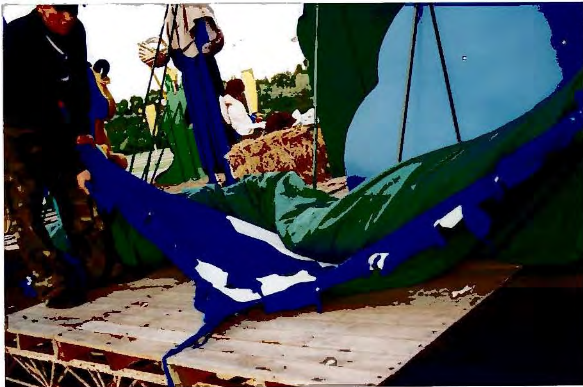
Detalle del telón rasgado en la parte superior.