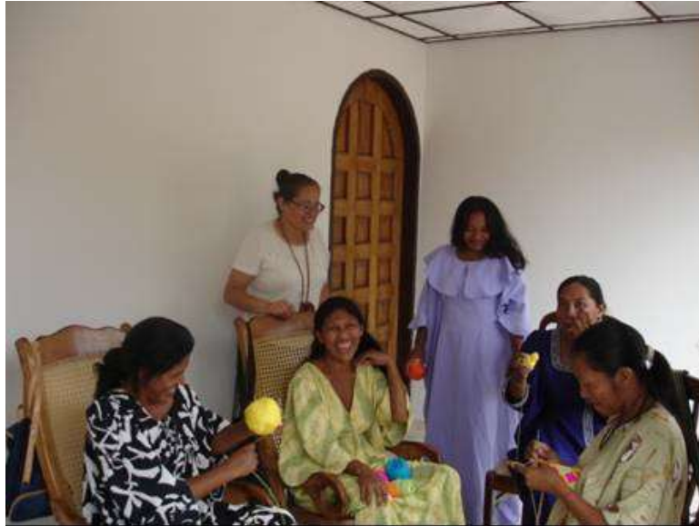
Artesanas indígenas wayúu Barrancas, Guajira