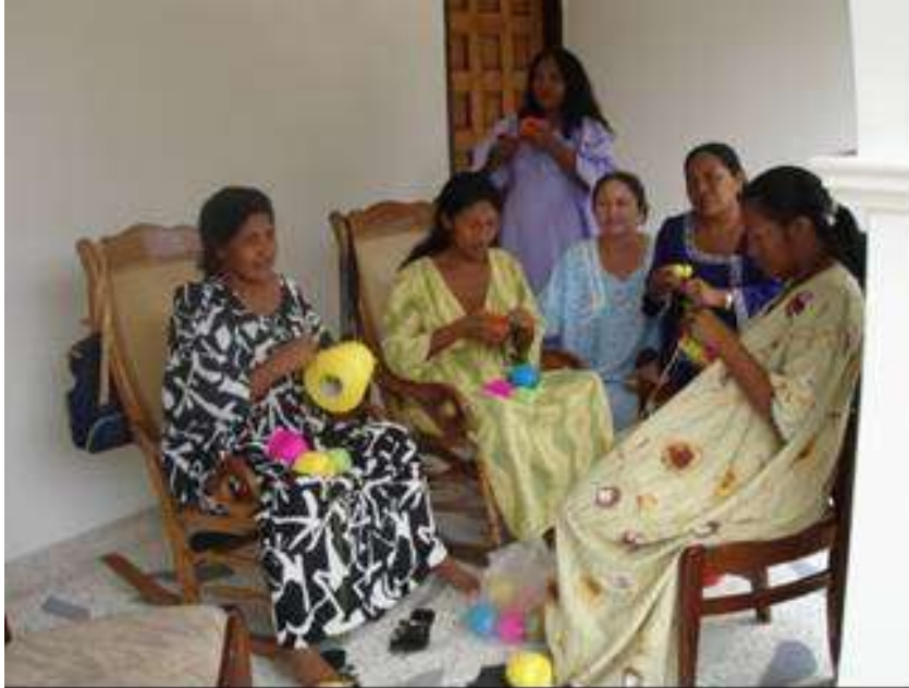
Artesanas indígenas wayúu Barrancas, Guajira