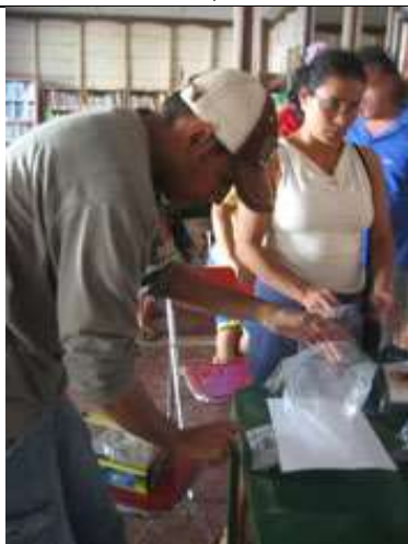
Lugar: Biblioteca Casa de la cultura de Colosó Fecha : Agosto 12 /08 Descripción: Capacitación en el uso adecuado de las grameras.