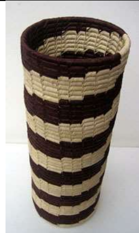
Fecha: Sept. 2 /08 Descripción: Resultados - contenedor Faider Flórez – Arte en iraca