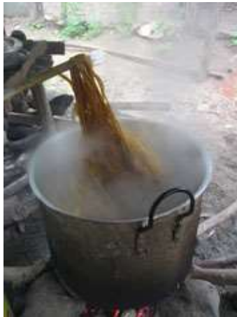
Lugar: Casa de Martha Borja Padilla, calle de las flores, Colosó Fecha : Agosto 11 /08 Descripción: aplicación color amarillo puro terasil sobre 1 kg de iraca.