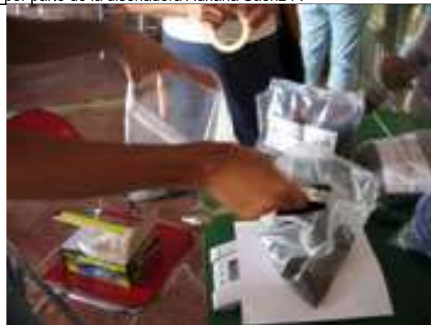
Tomada por: Adriana Sáenz Forero Lugar: Biblioteca Casa de la cultura de Colosó Fecha : Agosto 12 /08 Descripción: Distribución equitativa del tinte entre los grupos de artesanos, decisión de común acuerdo.