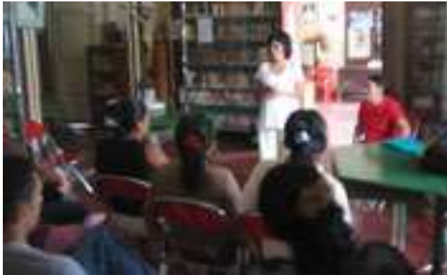
Lugar: Biblioteca Casa de la Cultura de Colosó Fecha : Agosto 8 /08 Descripción: Introducción Presentación Mercadeo, Tendencias, Identidad Gráfica.