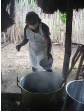
Tomada por : Adriana Sáenz Forero Lugar: Casa de Martha Borja Padilla, calle de las flores, Colosó Fecha : Agosto 11 /08 Descripción: Preparación del agua para la cocción.