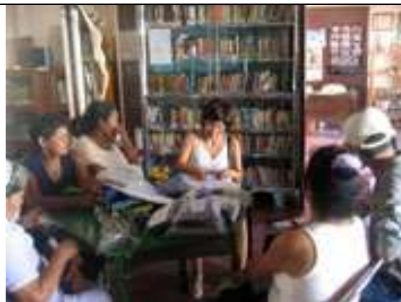
Lugar: Biblioteca Casa de la cultura de Colosó Fecha : Agosto 12 /08 Descripción: firma del Acta de entrega de material capacitación por parte de la diseñadora Adriana Sáenz F.