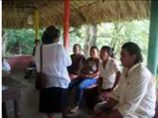
Lugar: Kiosco Casa de la Cultura de Colosó Fecha : Agosto 9 /08 Descripción: Acuerdos distribución del trabajo propuestas de diseño.