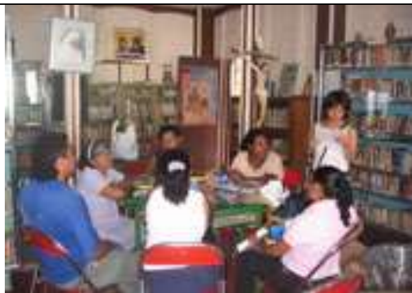
Lugar: Biblioteca Casa de la cultura de Colosó Fecha : Agosto 12 /08 Descripción: Lectura Acta de entrega de material de Asistencias técnicas, en presencia de 7 representantes de las asociaciones de artesanos: Casa de la Cultura, Arte en Iraca