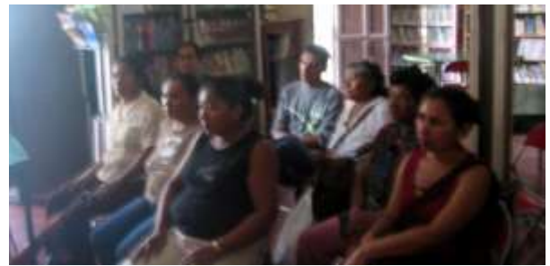
Lugar: Biblioteca Casa de la Cultura de Colosó Fecha : Agosto 8 /08 Descripción: Presentación Mercadeo, Tendencias, Identidad Gráfica.