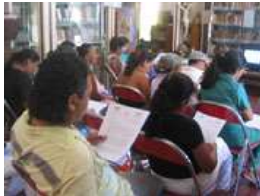
Lugar: Biblioteca Casa de la Cultura de Colosó Fecha : Agosto 7 /08 Descripción: Entrega de copia del documento referencial a cada artesano participante en la validación del documento referencial