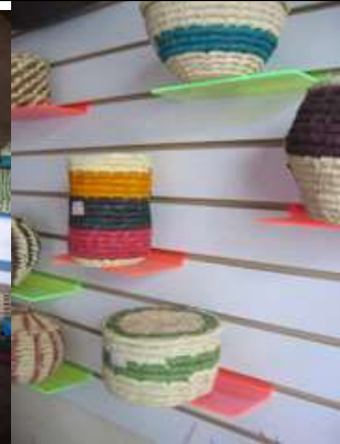
Lugar: Almacén Asociación Artesanos Casa de la cultura de Colosó. Fecha : Agosto 9 /08 Descripción: Visita al almacén