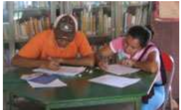
Lugar: Biblioteca Casa de la Cultura de Colosó Fecha : Agosto 8 /08 Descripción: Taller Identidad Gráfica artesanos Arte en Iraca