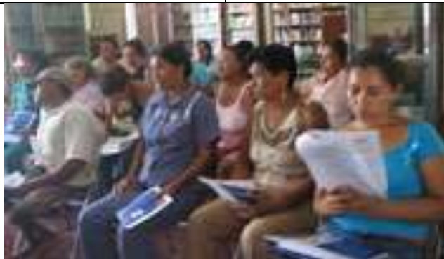
Tomada por : Adriana Sáenz Forero Lugar: Biblioteca Casa de la Cultura de Colosó Fecha : Agosto 7 /08 Descripción: Los artesanos leen atentamente el documento referencial.