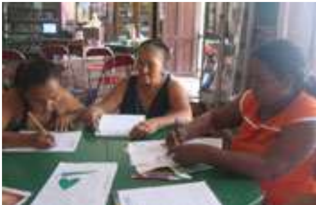
Lugar: Biblioteca Casa de la Cultura de Colosó Fecha : Agosto 8 /08 Descripción: Taller Identidad Gráfica artesanos Asociación Casa de la Cultura de Colosó