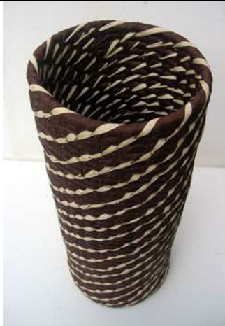
Fecha: Sept. 2 /08 Descripción: Resultados - contenedor Amparo Novoa - Asociación artesanos casa de la cultura Colosó