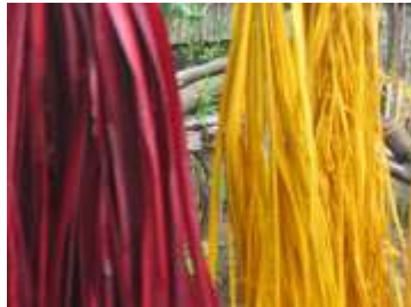
Lugar: Casa de Martha Borja Padilla, calle de las flores, Colosó Fecha : Agosto 11 /08 Descripción: obtención color amarillo puro terasil y rojo.