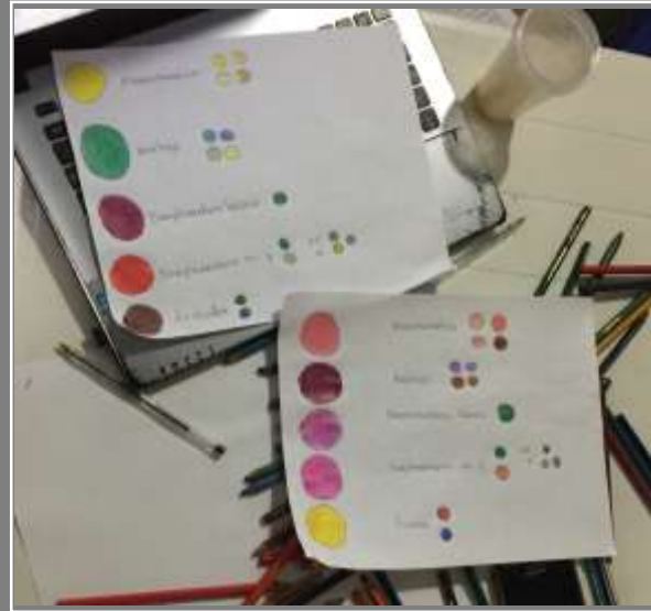
Paletas de color