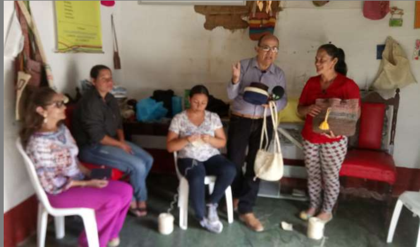
PLANO GENERAL/MEDIO DEL ARTESANO