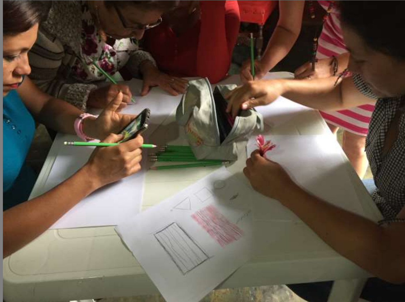
Pueblo Nuevo, Ocaña, Norte de Santander

Seguido de esto, a partir de los referentes trabajados en la sesión anterior, se hizo un ejercicio de identificación de formas y texturas para replicarlas o interpretarlas en los tejidos.