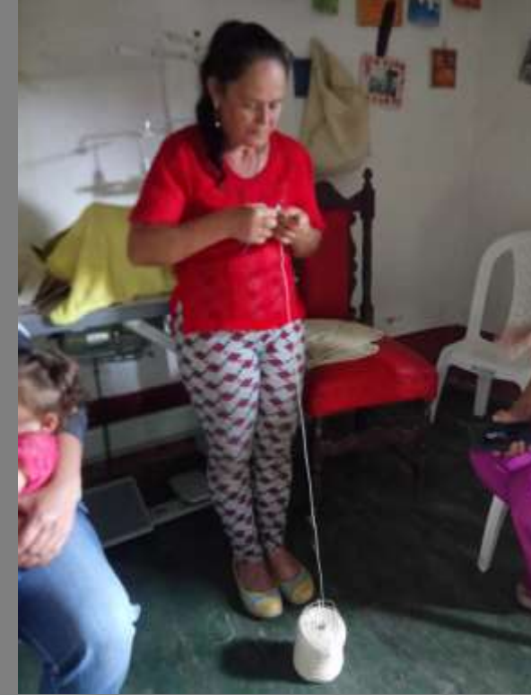
PLANO GENERAL DEL TALLER/COMUNIDAD