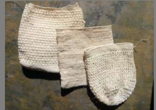
FOTOS DE LOS PRODUCTOS ACTUALES