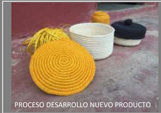
PROCESO DESARROLLO NUEVO PRODUCTO