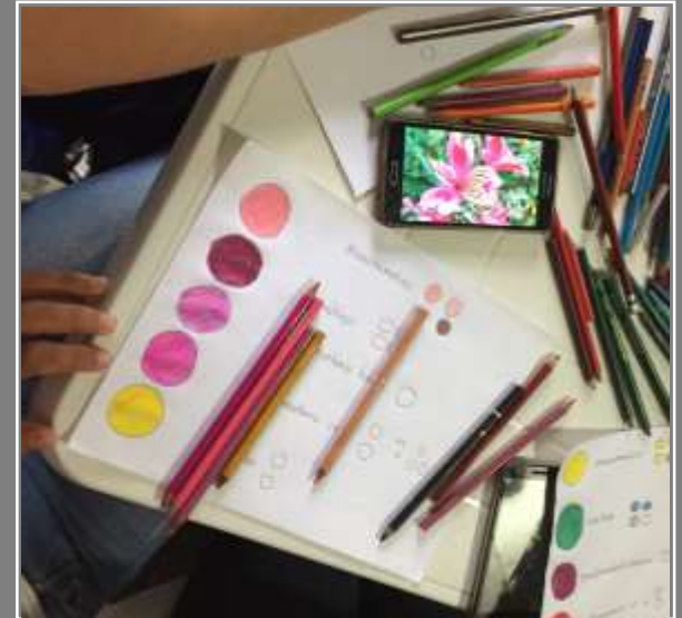
Paletas de color