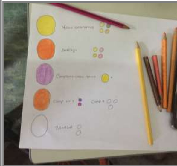
Paletas de color