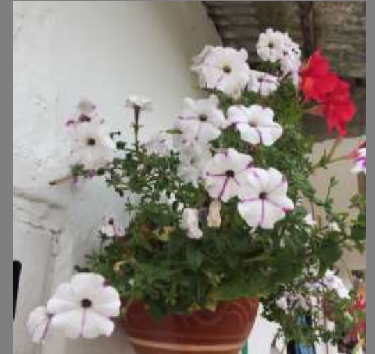
Flores encontradas en el corregimiento— Inspiración para creación de paletas de color.