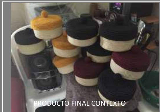
PRODUCTO FINAL CONTEXTO