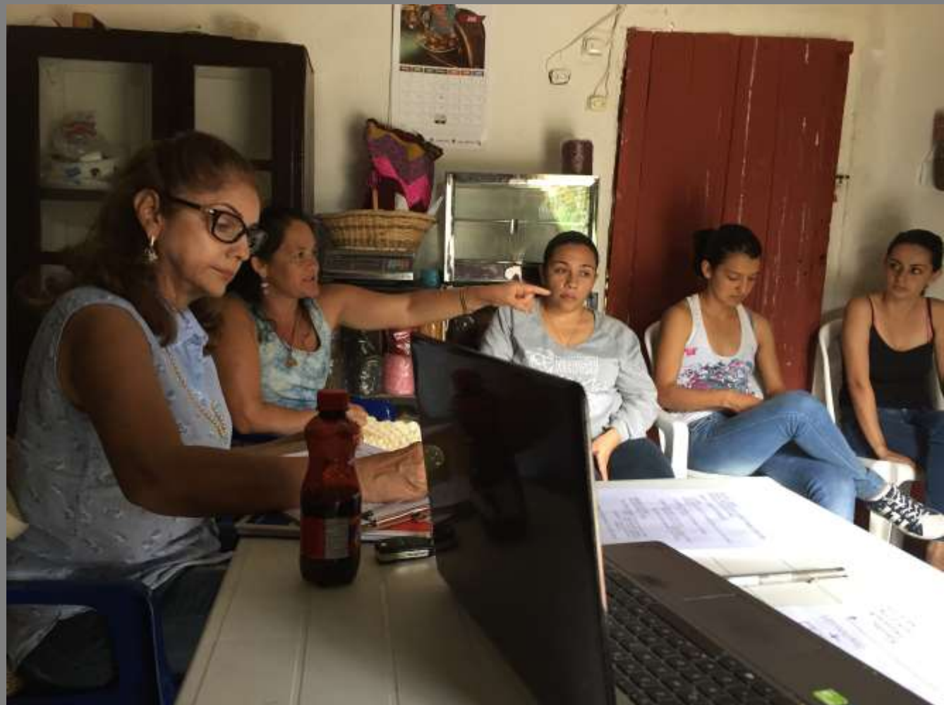
Pueblo Nuevo, Ocaña, Norte de Santander

Esta comunidad está reforzando el tema de la producción de fique, ya que durante un tiempo lo han comprado a otras comunidades, y se planteó que al tener solo color crudo se pueda tinturar la materia prima buscando los colores identificados en el ejercicio con las flores.