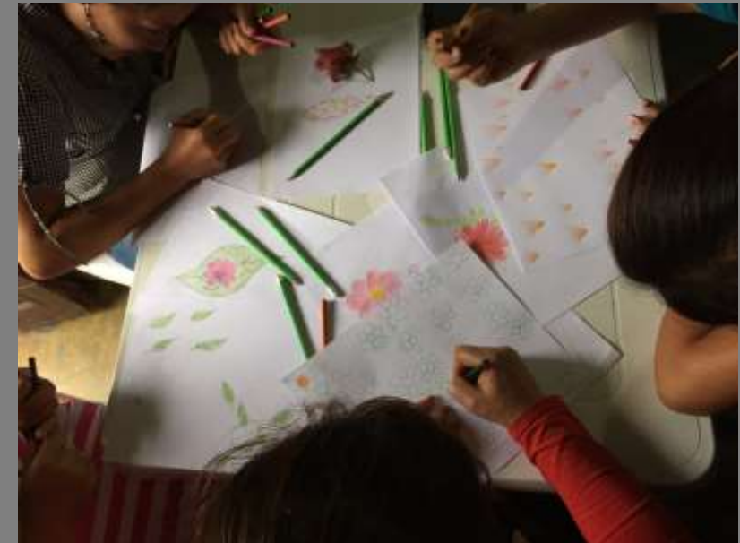
Ejercicio de texturas y color