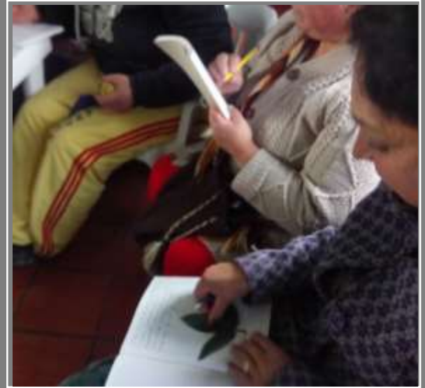
Bocetación de texturas

Taller de texturas Mutiscua, Norte de Santander