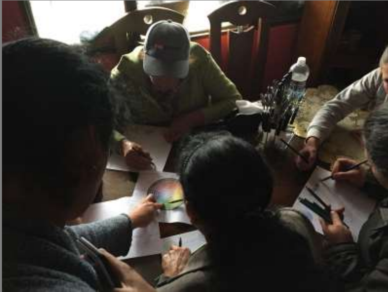
Artesanas en la actividad de elaboración de paletas de colores