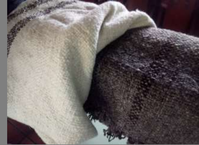
FOTOS DE LOS PRODUCTOS ACTUALES