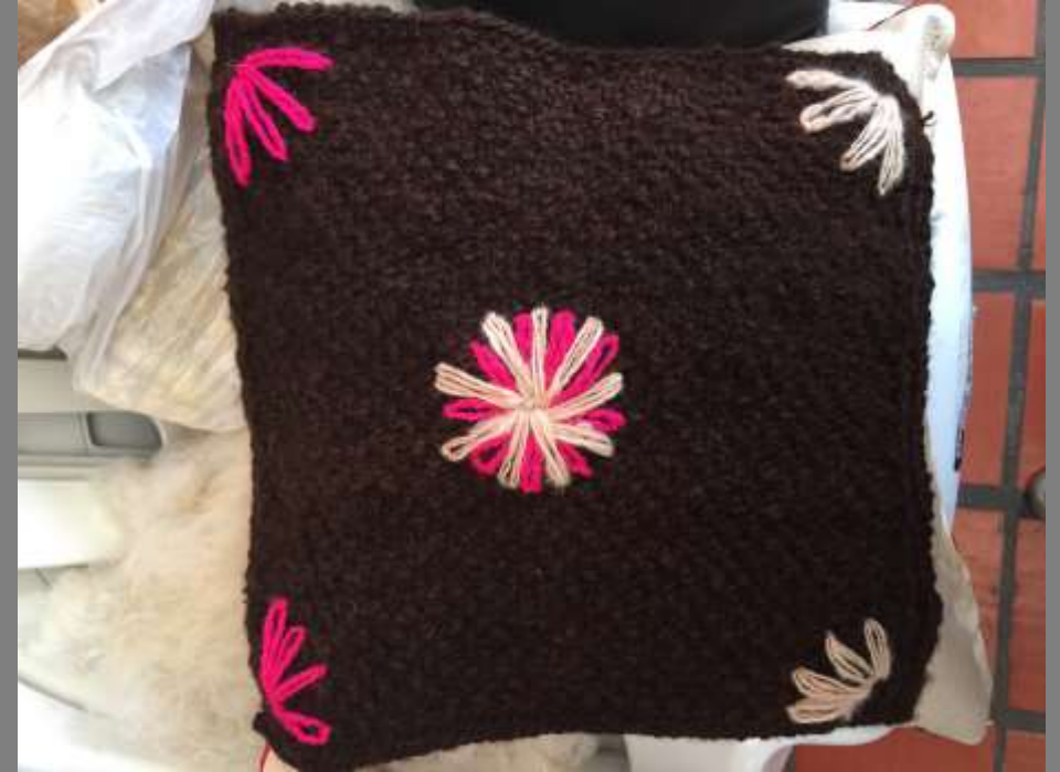
Texturas en lana virgen de ovejo

Taller de texturas Mutiscua, Norte de Santander