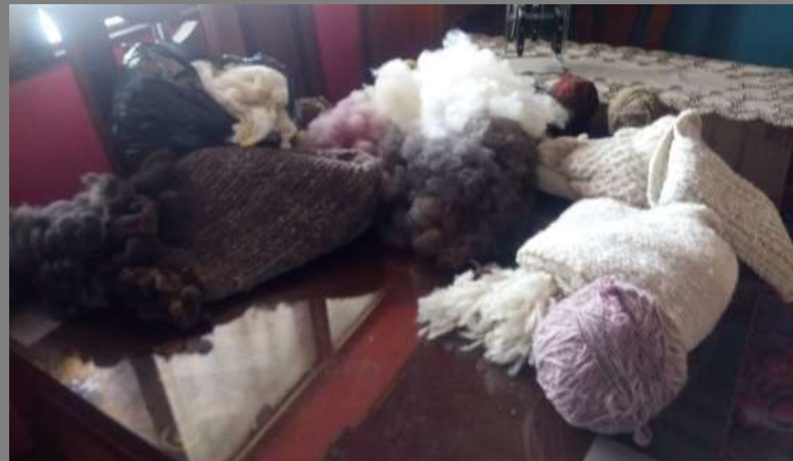
PLANO GENERAL/MEDIO DEL ARTESANO