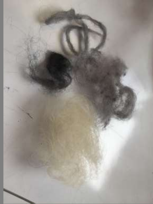
Lana gris obtenida del negro tinturado y blanco natural.