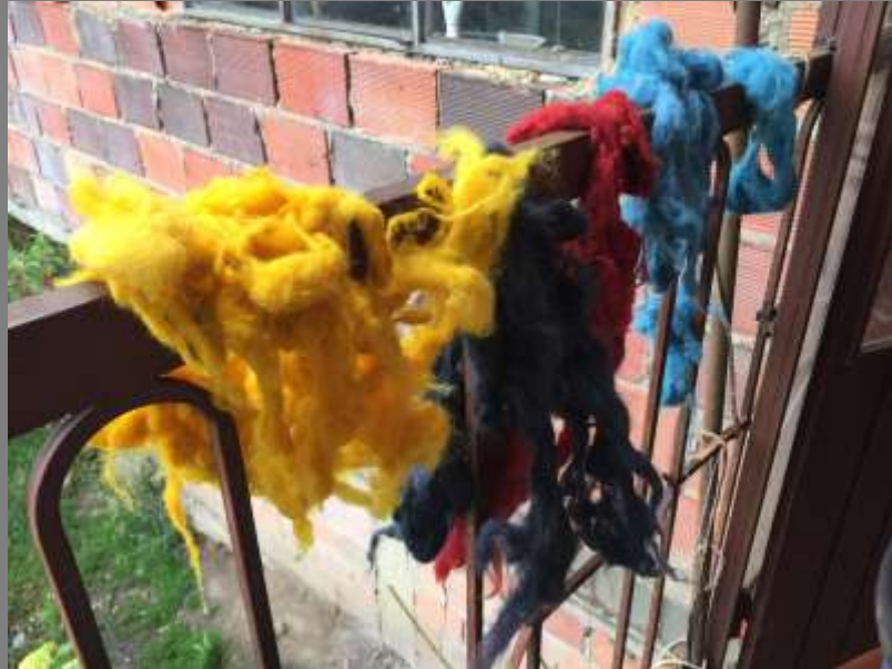
Lana virgen sin hilar tinturada (amarillo, negro, rojo y azul)