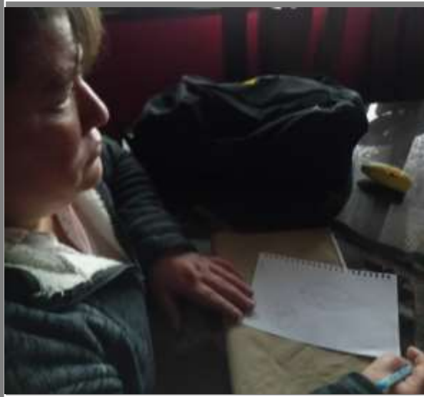
Bocetación de texturas