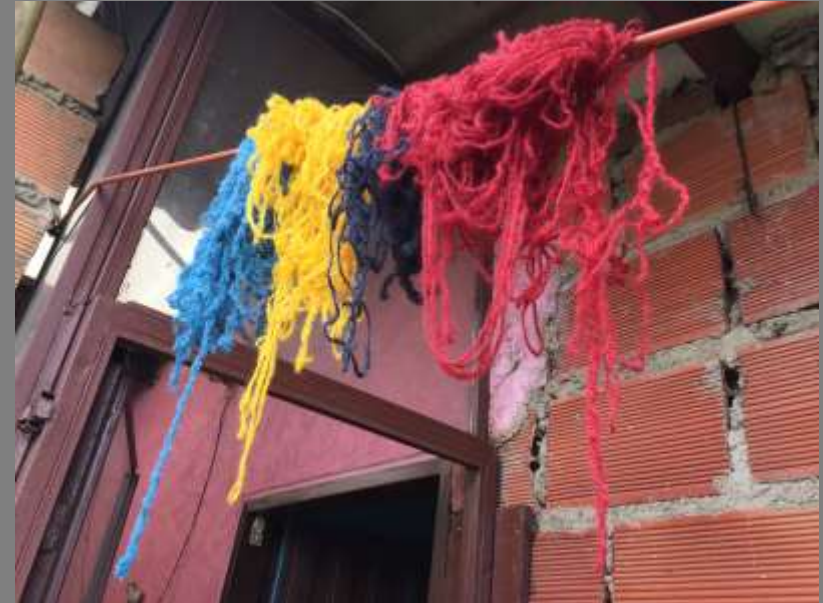
Lana virgen hilada tinturada (amarillo, negro, rojo y azul)

Taller de color, tintes y tendencias Mutiscua, Norte de Santander