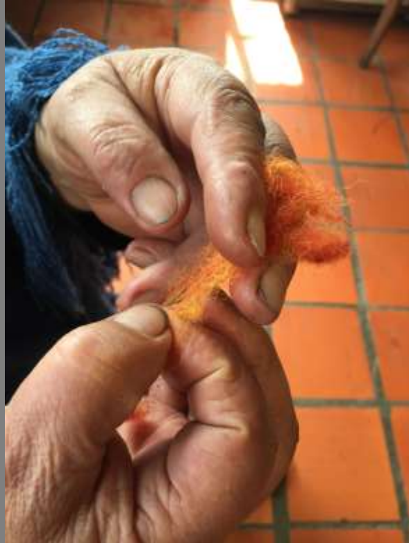
Cachimbeado de lana amarilla y roja para obtener naranja