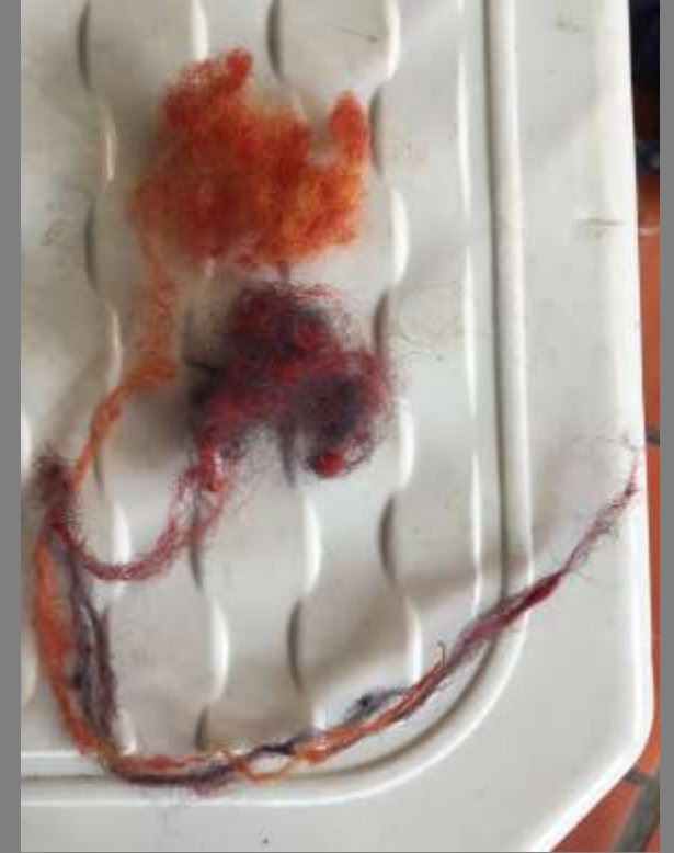
Lana naranja y morada obtenida en cachimberado.

Fotos tomadas por Alexandra Savelli Taller de color, tintes y tendencias Mutiscua, Norte de Santander