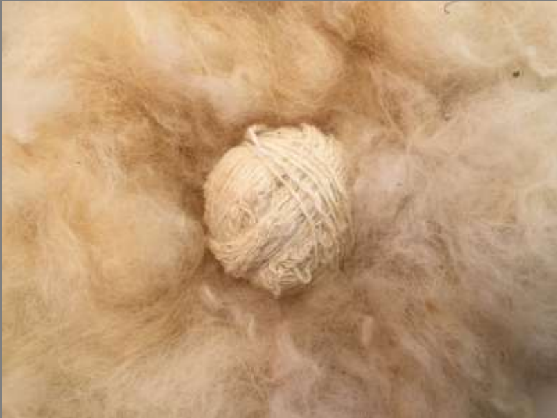
Lana virgen usada para el tinturado