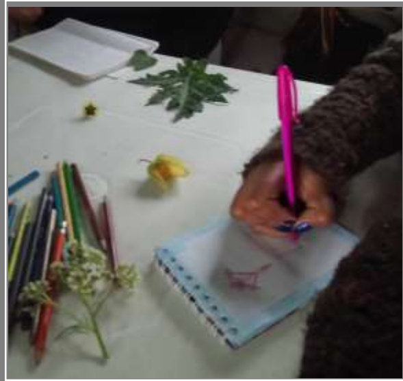
Bocetación de texturas