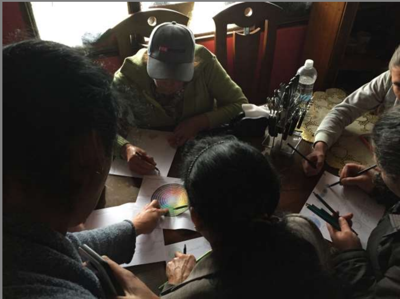
Taller de color, tintes y tendencias Mutiscua, Norte de Santander

Se decidió teñir las lanas solo con los tonos primarios (amarillo, azul y rojo) y adicional negro para luego realizar un ejercicio al que ellas llaman cachimbear para mezclar los colores de las lanas y observar que tonos se logran.