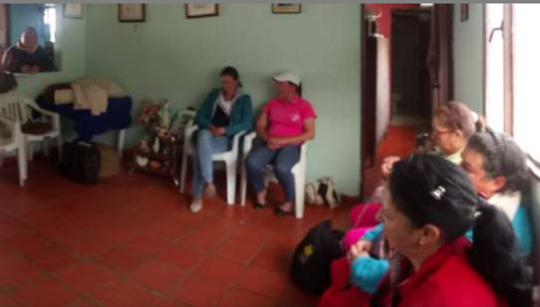
PLANO GENERAL DEL TALLER/COMUNIDAD