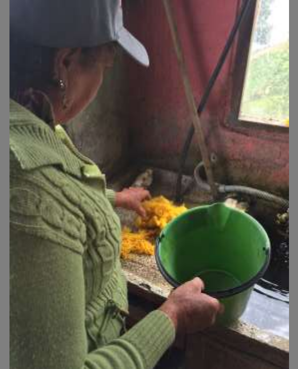
Proceso de tinturado

Taller de color, tintes y tendencias Mutiscua, Norte de Santander