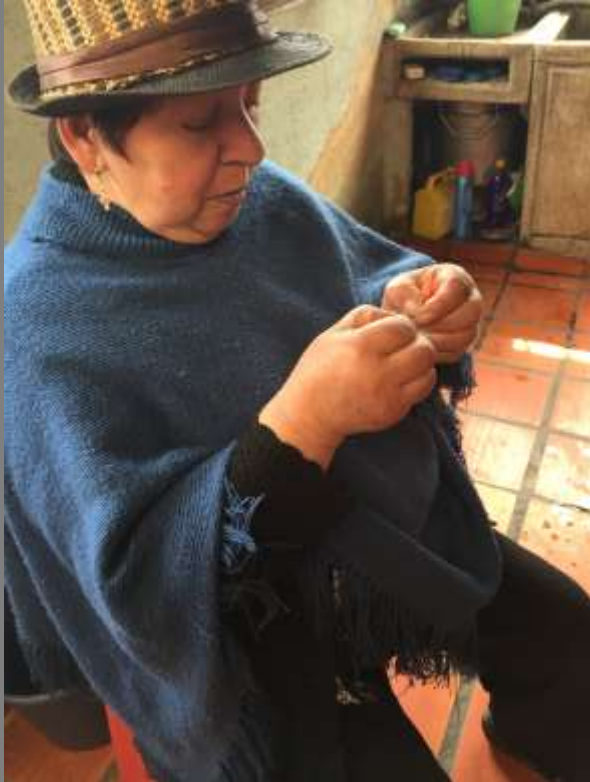
Artesana realizando el cachimbeado de la lana