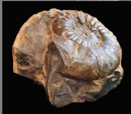
REFERENTE DE INSPIRACIÓN FOSILES DE LOS PATIOS

Los Patios, Norte de Santander