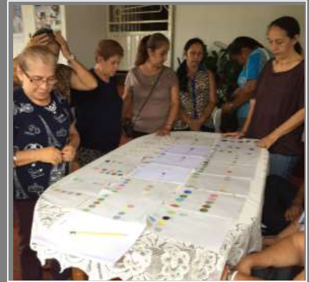
Paletas de colores