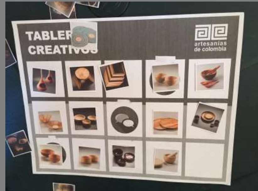
Tablero creativo de texturas

Los Patios, Norte de Santander