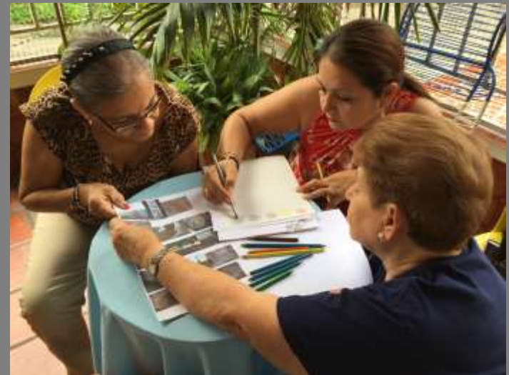
Los Patios, Norte de Santander