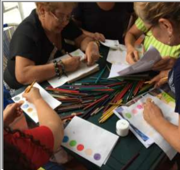
Paletas de colores

Los Patios, Norte de Santander