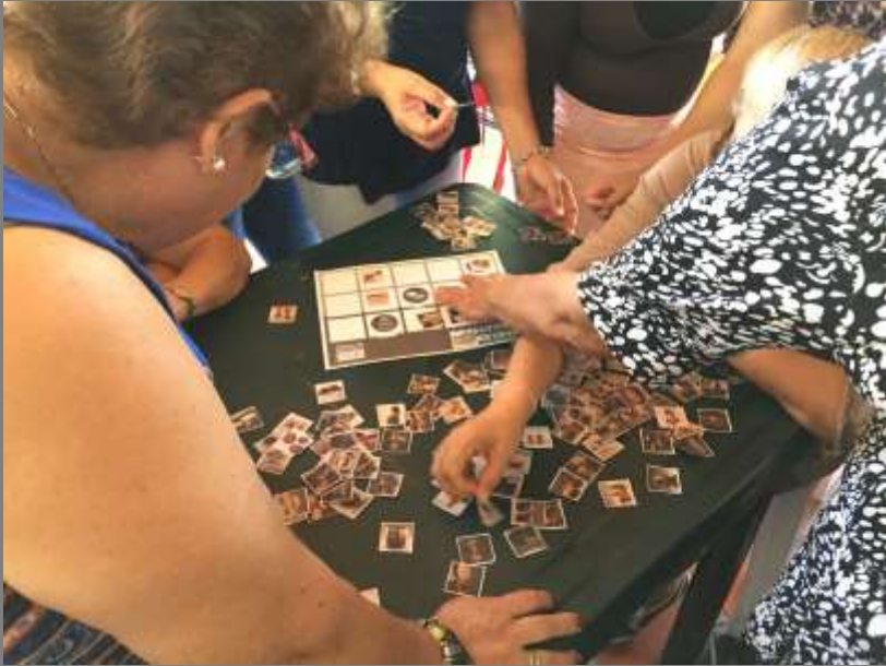
Desarrollo de ejercicio con el tablero creativo

Imágenes de los resultados del los talleres