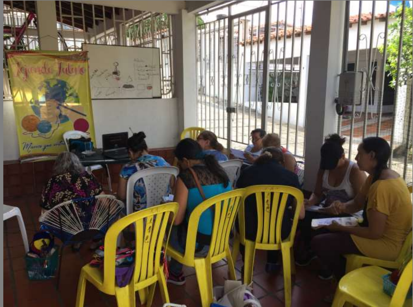
Los Patios, Norte de Santander

Las artesanas, por medio de bocetos, hicieron sus propuestas de línea de producto y se planteó poder formar una colección al reunir todas sus propuestas.