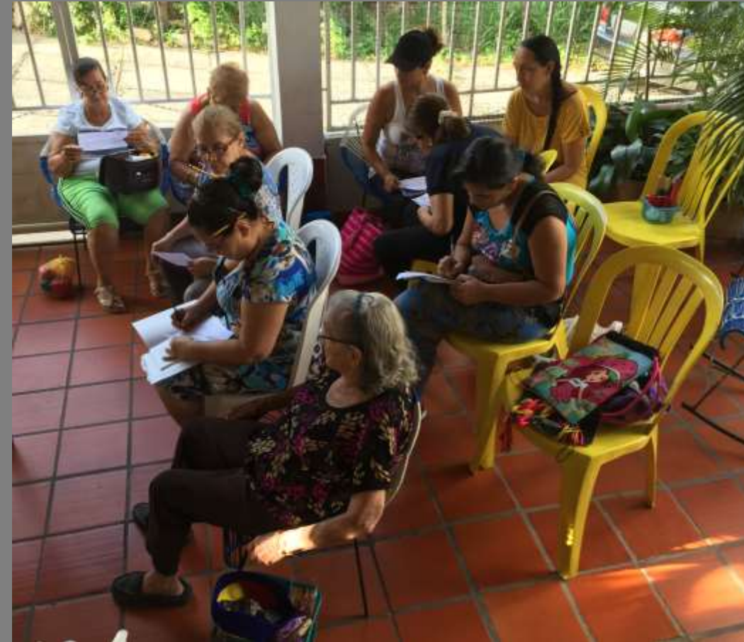
Los Patios, Norte de Santander