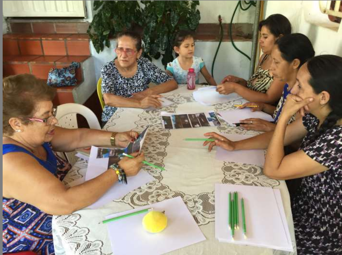
Los Patios, Norte de Santander

Seguido de esto, a partir de los referentes trabajados en la sesión anterior, se hizo un ejercicio de identificación de formas y texturas para replicarlas o interpretarlas en los tejidos.