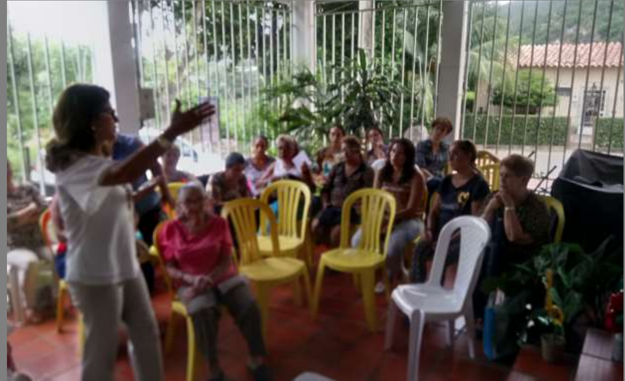
PLANO GENERAL DE LA COMUNIDAD

Los Patios, Norte de Santander