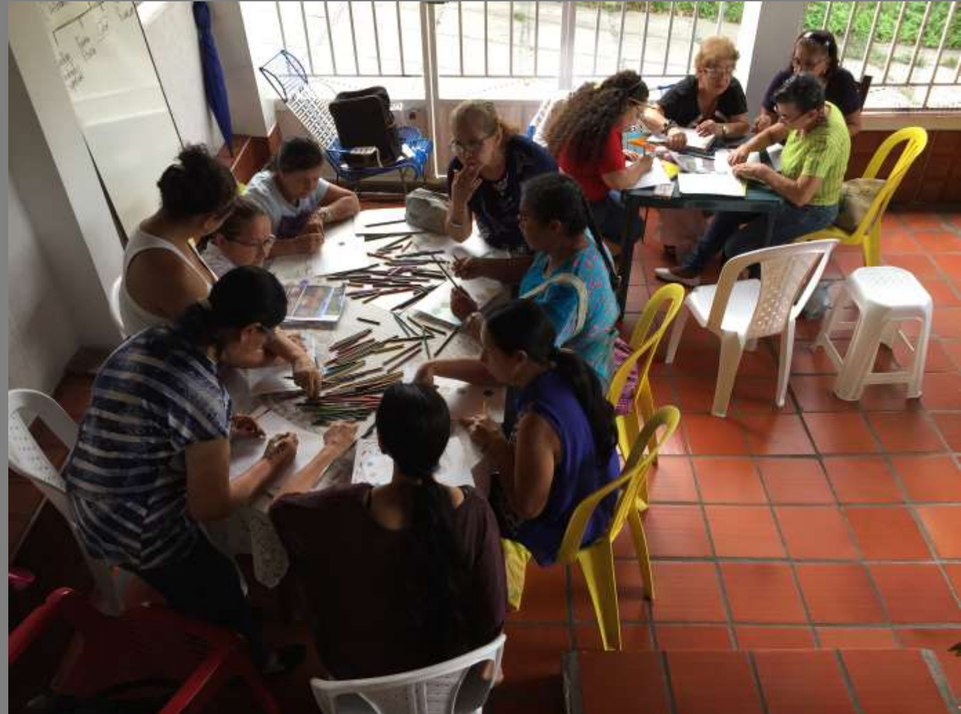
Los Patios, Norte de Santander

Se procedió a identificar los colores de las mismas y su entorno donde se podía observar una primera paleta de color y luego con cada todo se realizó un ejercicio de elaborar sus armonías según la rueda cromática.