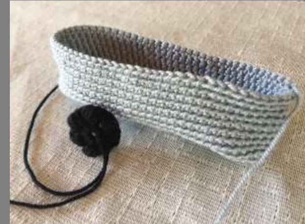
Muestras a escala de aplicación de texturas y selección de color