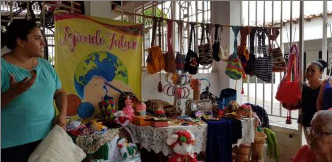
PLANO GENERAL DE LA COMUNIDAD/PRODUCTOS

Los Patios, Norte de Santander