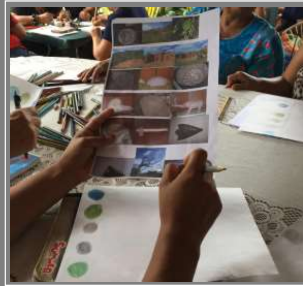
Paletas de colores