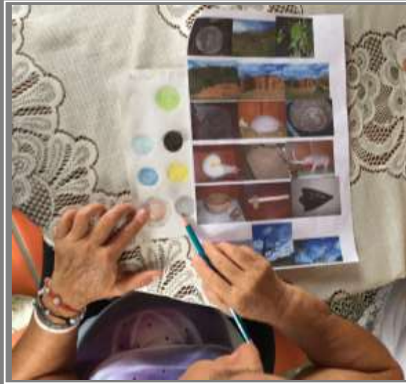
Paletas de colores