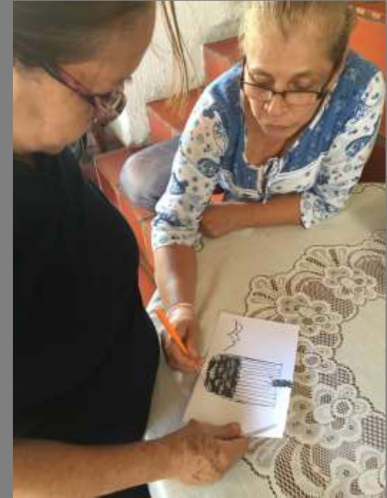
Tablero creativo de texturas