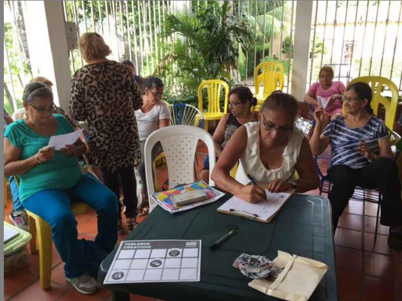
Los Patios, Norte de Santander

Quedó como actividad para las artesanas tomar algunas fotografías o muestras de elementos naturales como referentes para la próxima actividad trabajar en el taller de color a partir de dichos referentes.