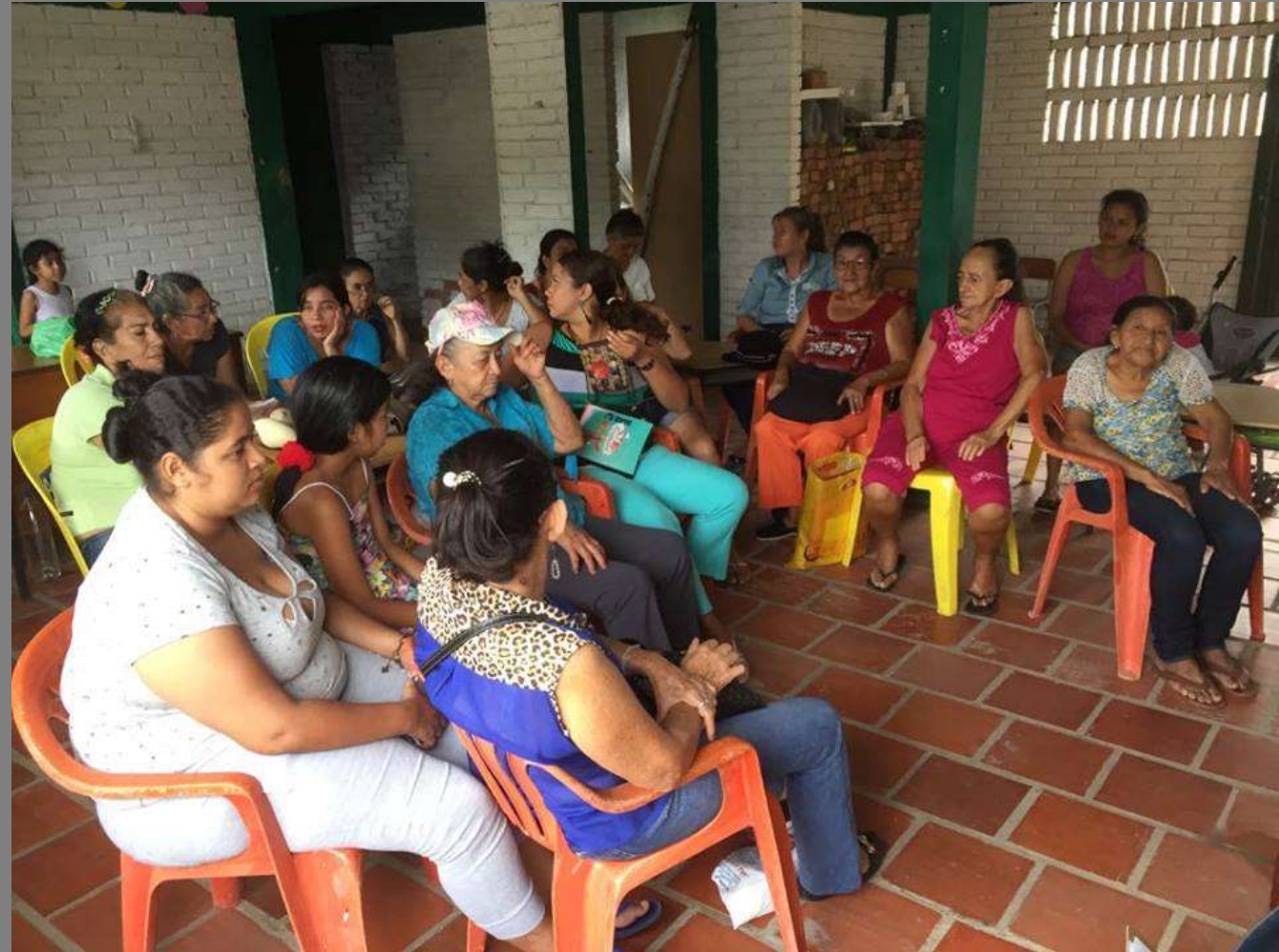
Los Patios, Norte de Santander

Quedó como actividad para las artesanas tomar algunas fotografías o muestras de elementos naturales como referentes para la próxima actividad trabajar en el taller de color a partir de dichos referentes.