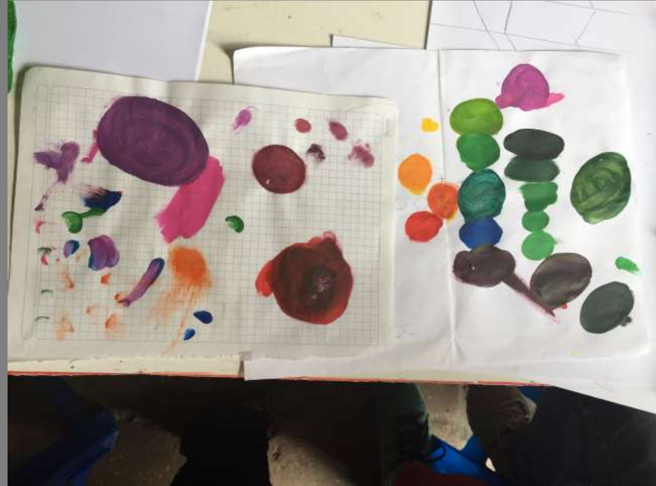
Los Patios, Norte de Santander

Luego de esto, se hizo un ejercicio práctico con temperas para probar mezclas de color y generar paletas de colores.