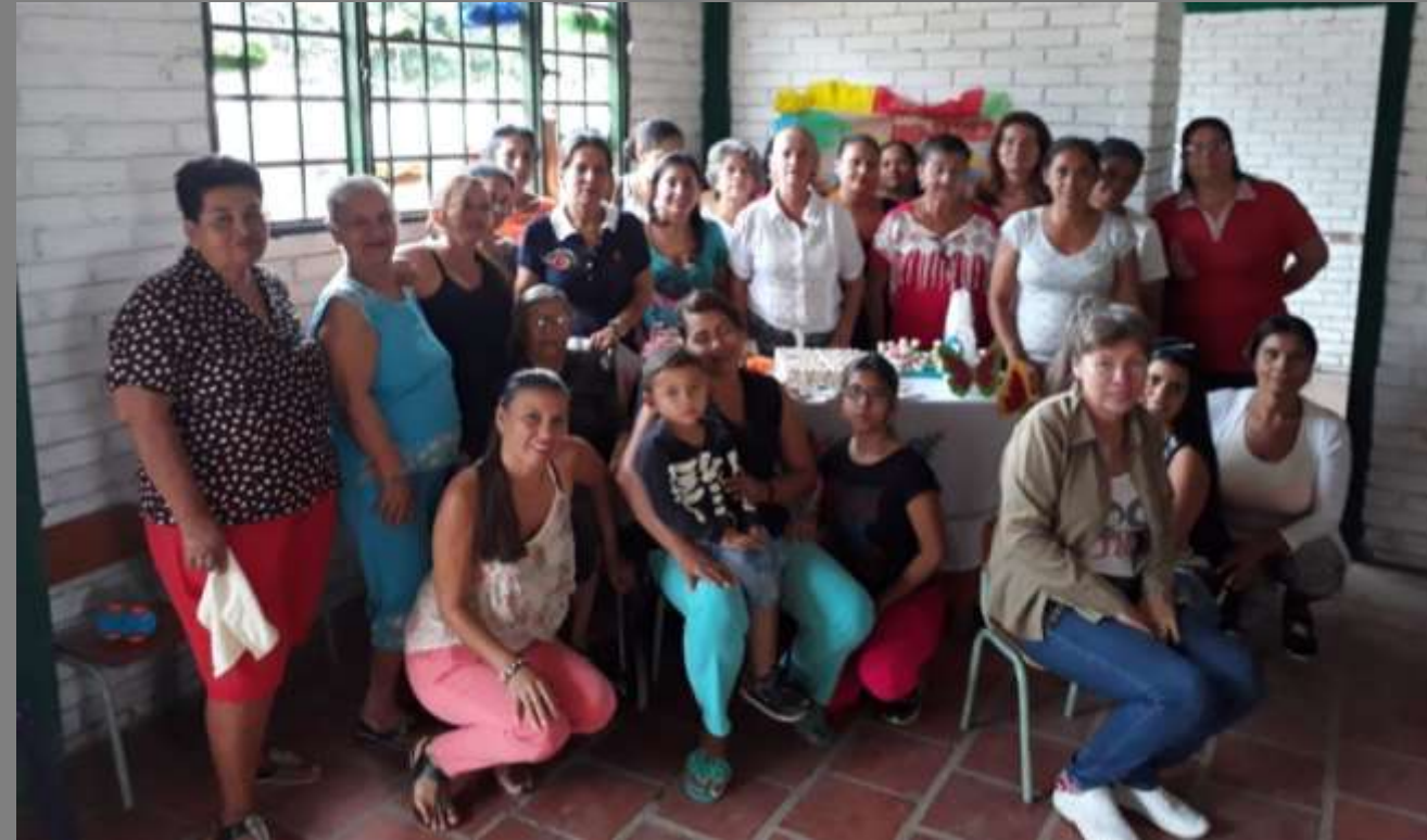
PLANO GENERAL DE LA COMUNIDAD

Los Patios, Norte de Santander