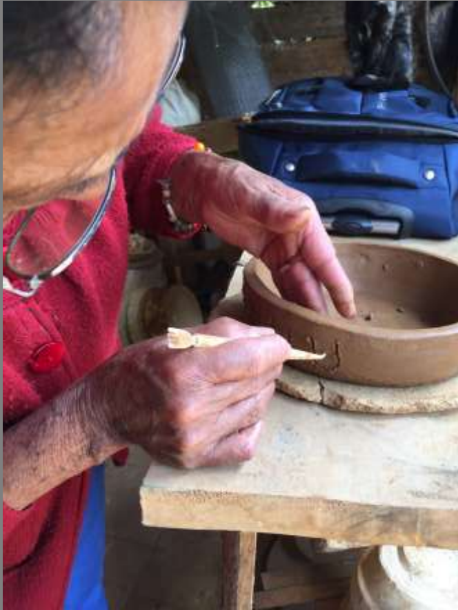
Elaboración de texturas sobre la arcilla