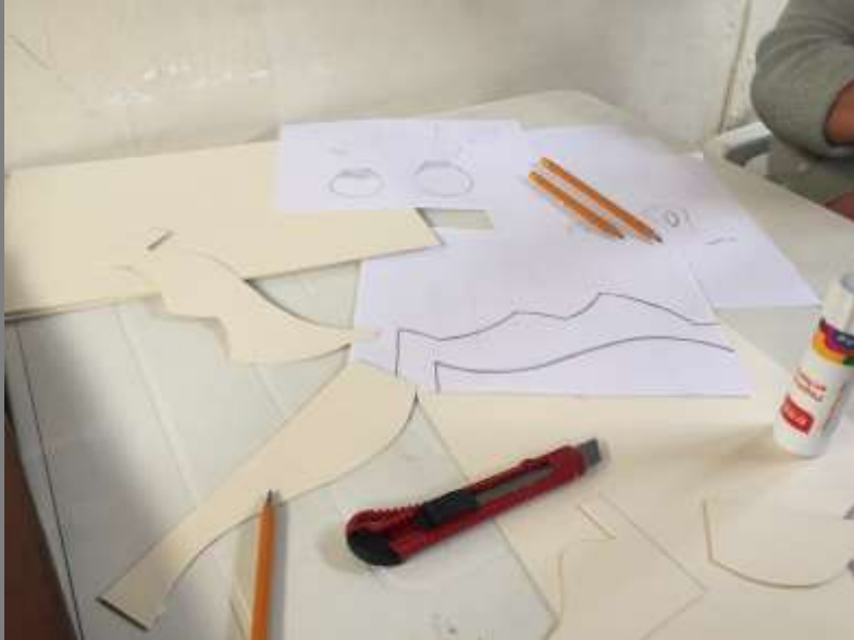
Bocetos de propuestas de forma de producto y elaboración de plantillas.