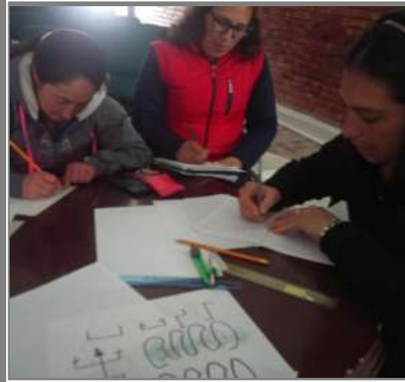
Bocetación de texturas - propuestas