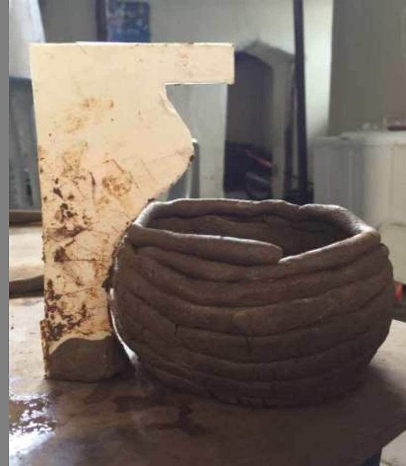
CÁCOTA, Norte de Santander