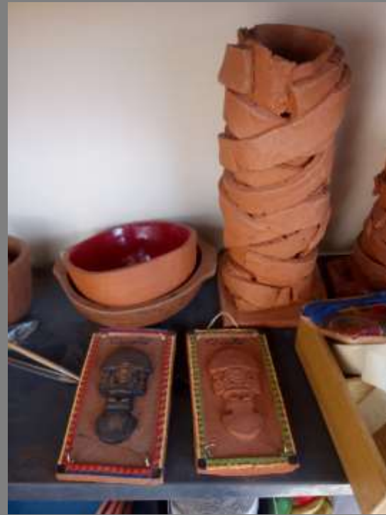
FOTOS DE LOS PRODUCTOS ACTUALES