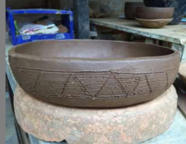
Texturas elaboradas con la comunidad alfarera