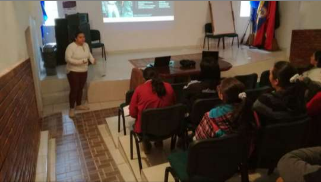
PLANO GENERAL DEL TALLER/COMUNIDAD