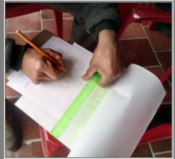
Bocetación de texturas - propuestas