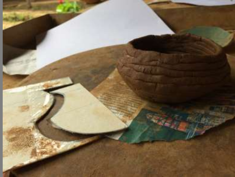
Plantillas a escala real y primeros desarrollos de producto.