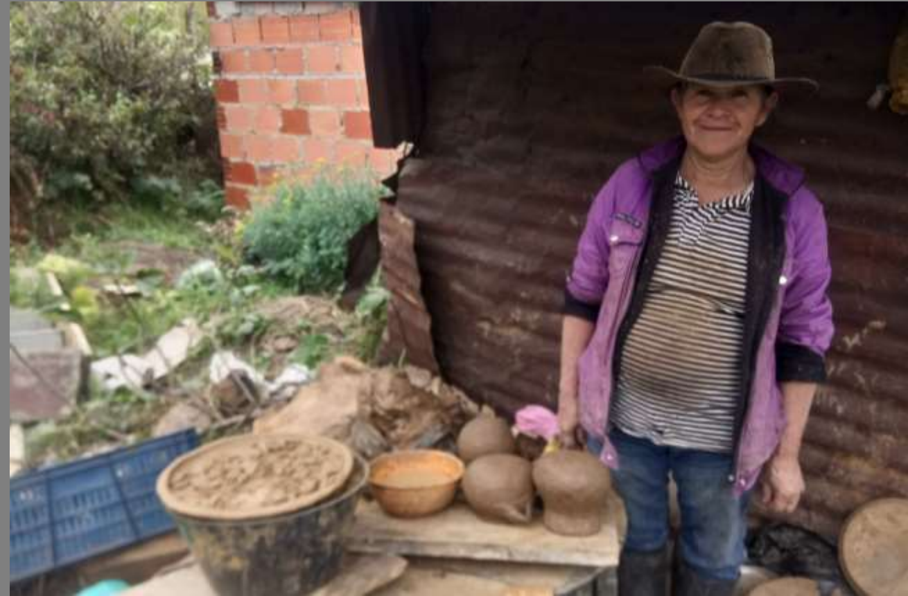
PLANO GENERAL/MEDIO DEL ARTESANO