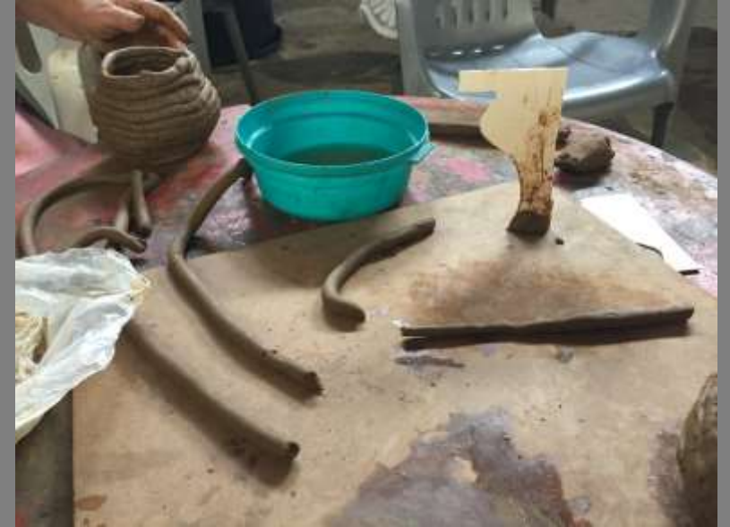
CÁCOTA, Norte de Santander