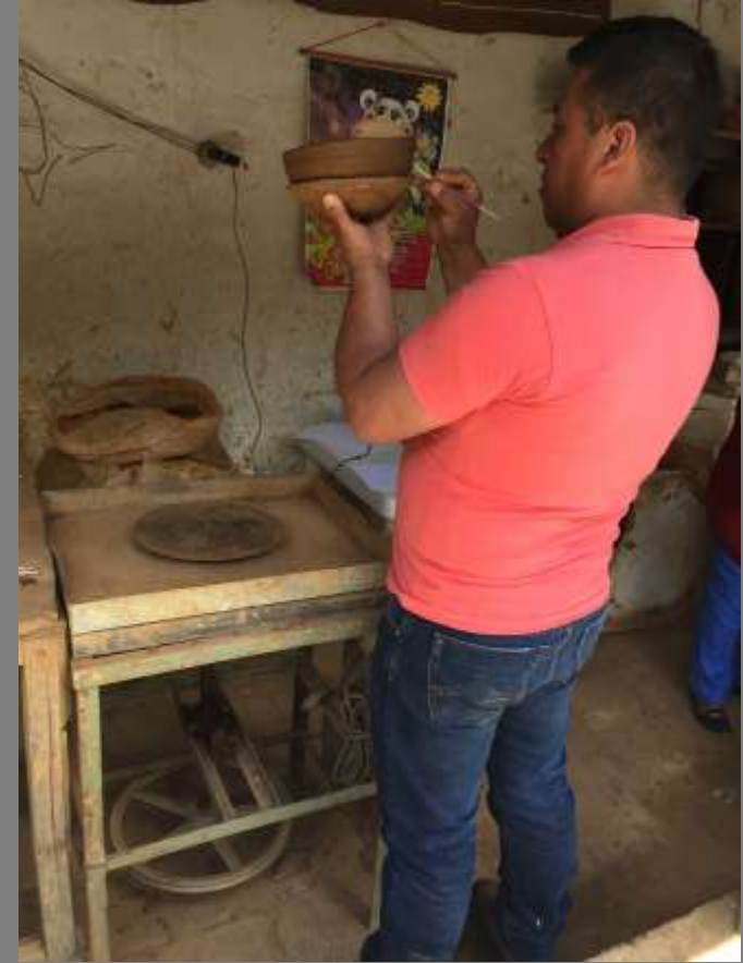
CÁCOTA, Norte de Santander