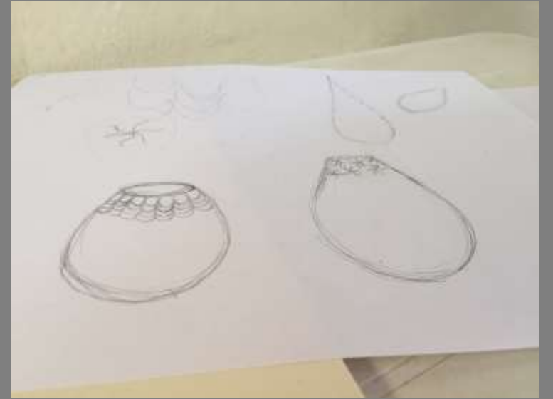
Bocetación – propuestas de texturas inspiradas en la laguna de cákota (agua) y flores del sector

Cáкота, Norte de Santander