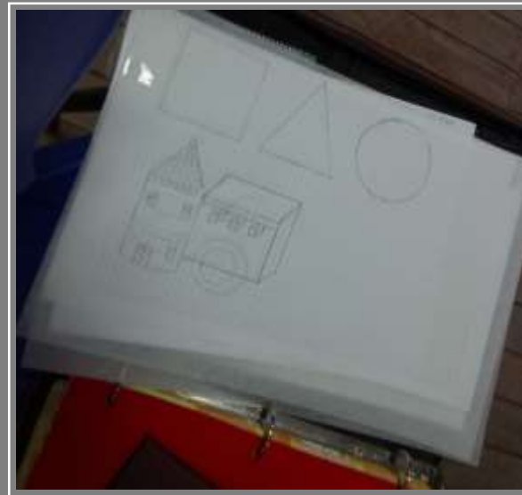
Bocetación de texturas a partir de formas básicas