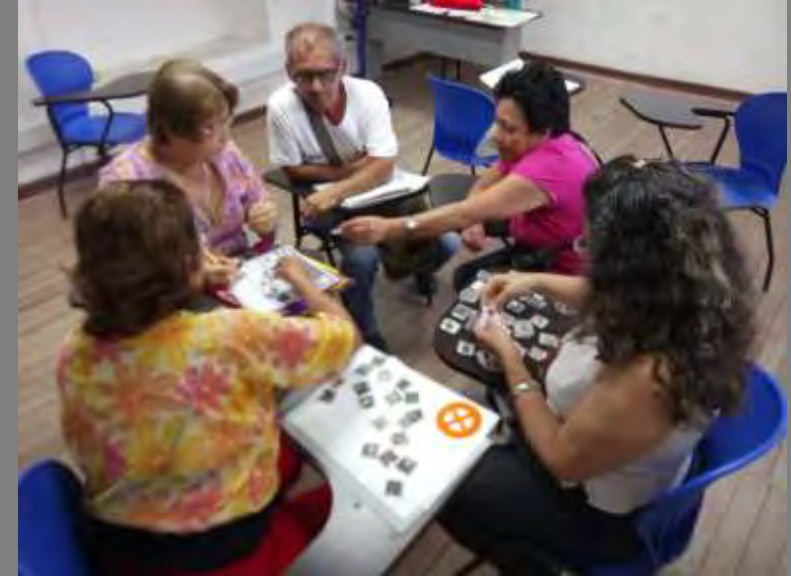
Fotos tomadas por Alexandra Savelli Salazar de las Palmas, Norte de Santander