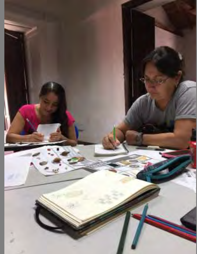
Fotos tomadas por Alexandra Savelli Salazar de las Palmas, Norte de Santander