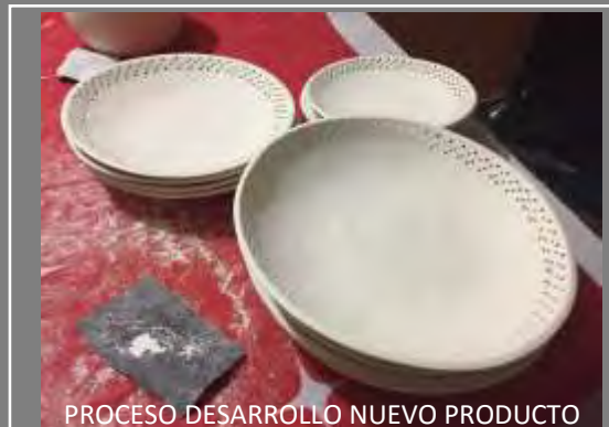
PROCESO DESARROLLO NUEVO PRODUCTO