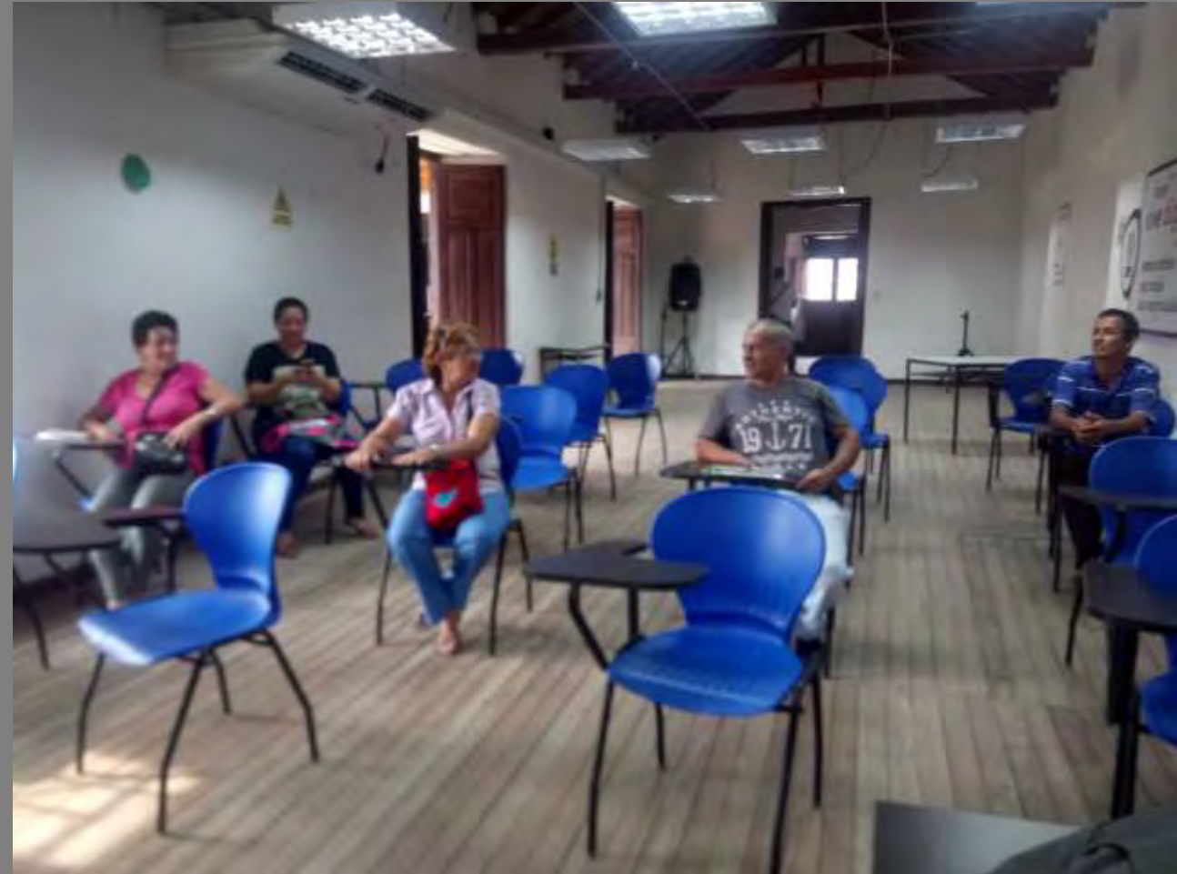
PLANO GENERAL DE LA COMUNIDAD

Con esta comunidad se inició un proceso desde el año anterior donde trabajaron sobre los conceptos básicos de diseño, por lo tanto se dio inicio a los talleres de co-diseño iniciado con el de texturas.