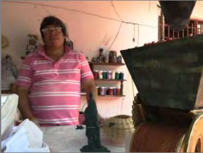
FOTO DEL ARTESANO