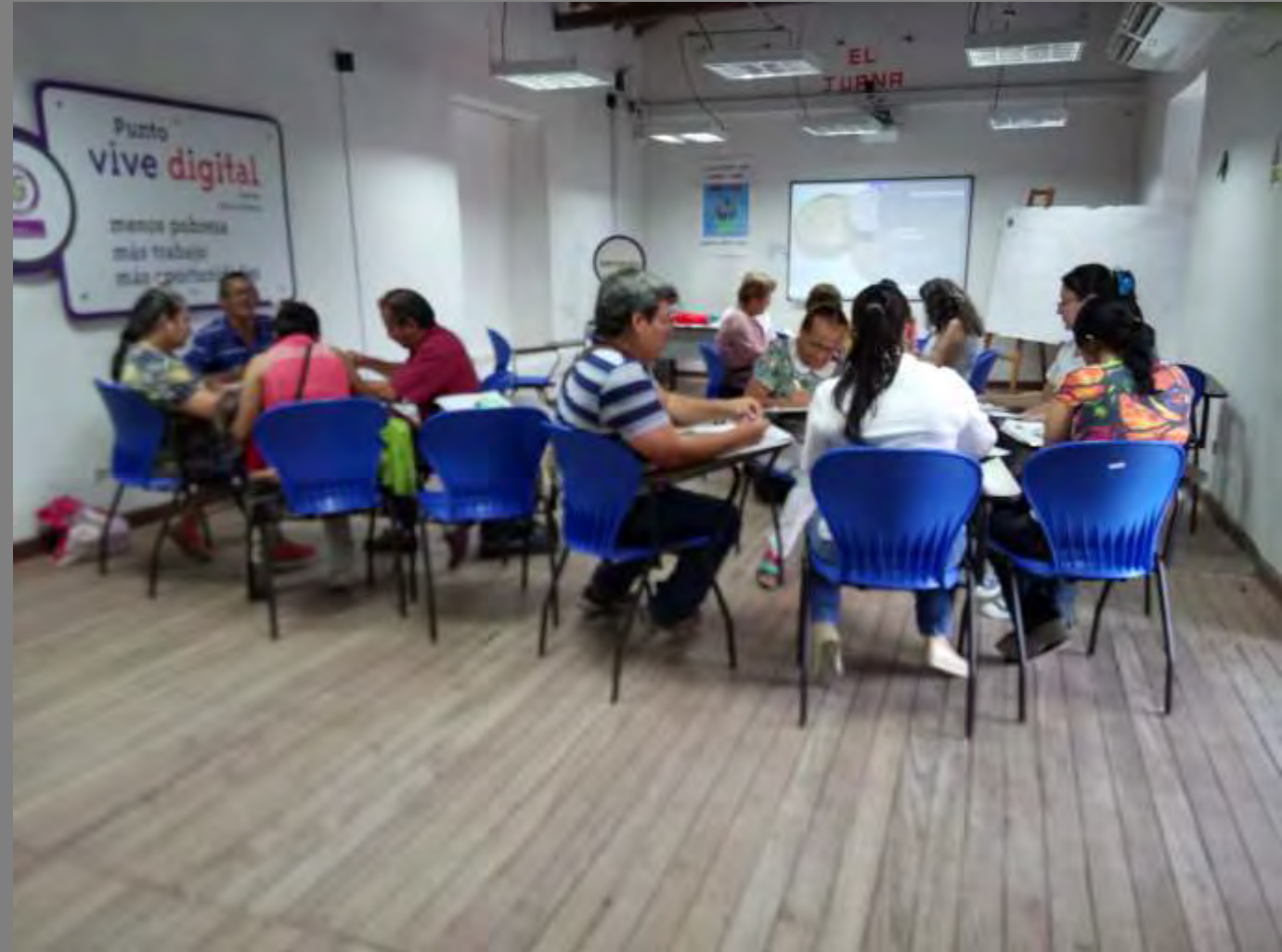
Fotos tomadas por Alexandra Savelli Salazar de las Palmas, Norte de Santander

Se hicieron unos ejemplos de aplicación de textura a modo de idea o boceto a partir de los cuales los artesanos debían profundizar y tratar de hacer esas texturas en sus respectiva materia prima.