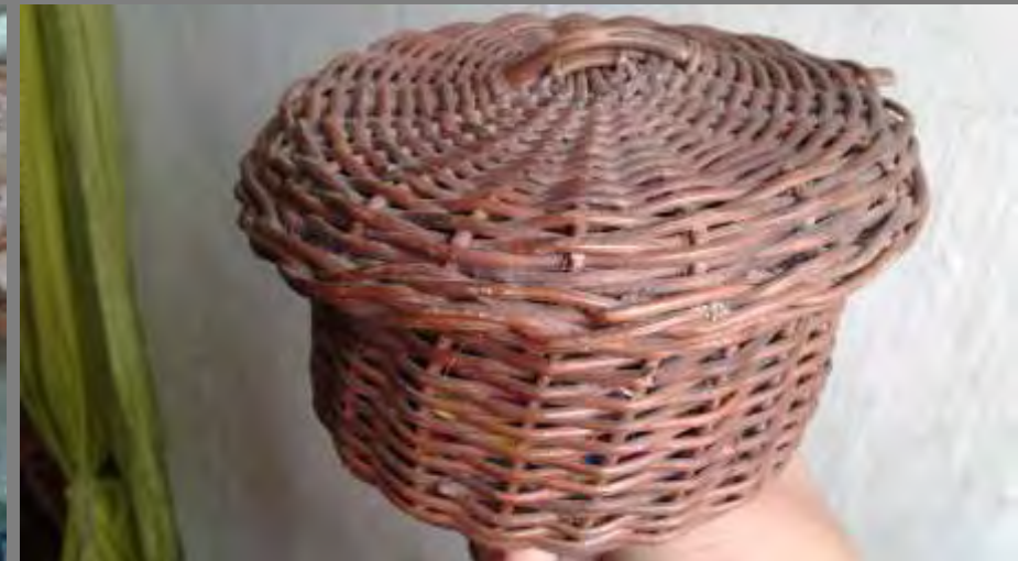
PRODUCTOS DESARROLLADOS POR LA COMUNIDAD Fotos tomadas por Alexandra Savelli Toledo, Norte de Santander