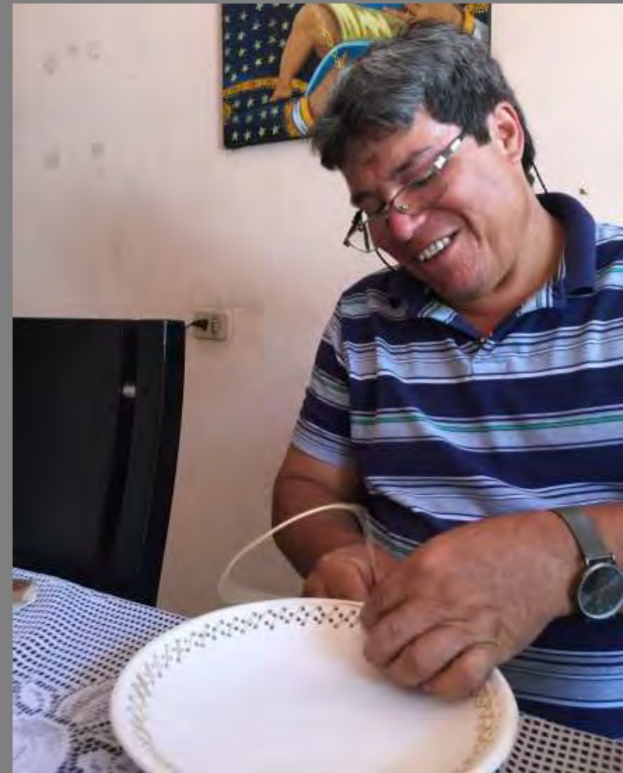
PLANO GENERAL/MEDIO DEL ARTESANO

Foto tomada por Alexandra Savelli Salazar, Norte de Santander