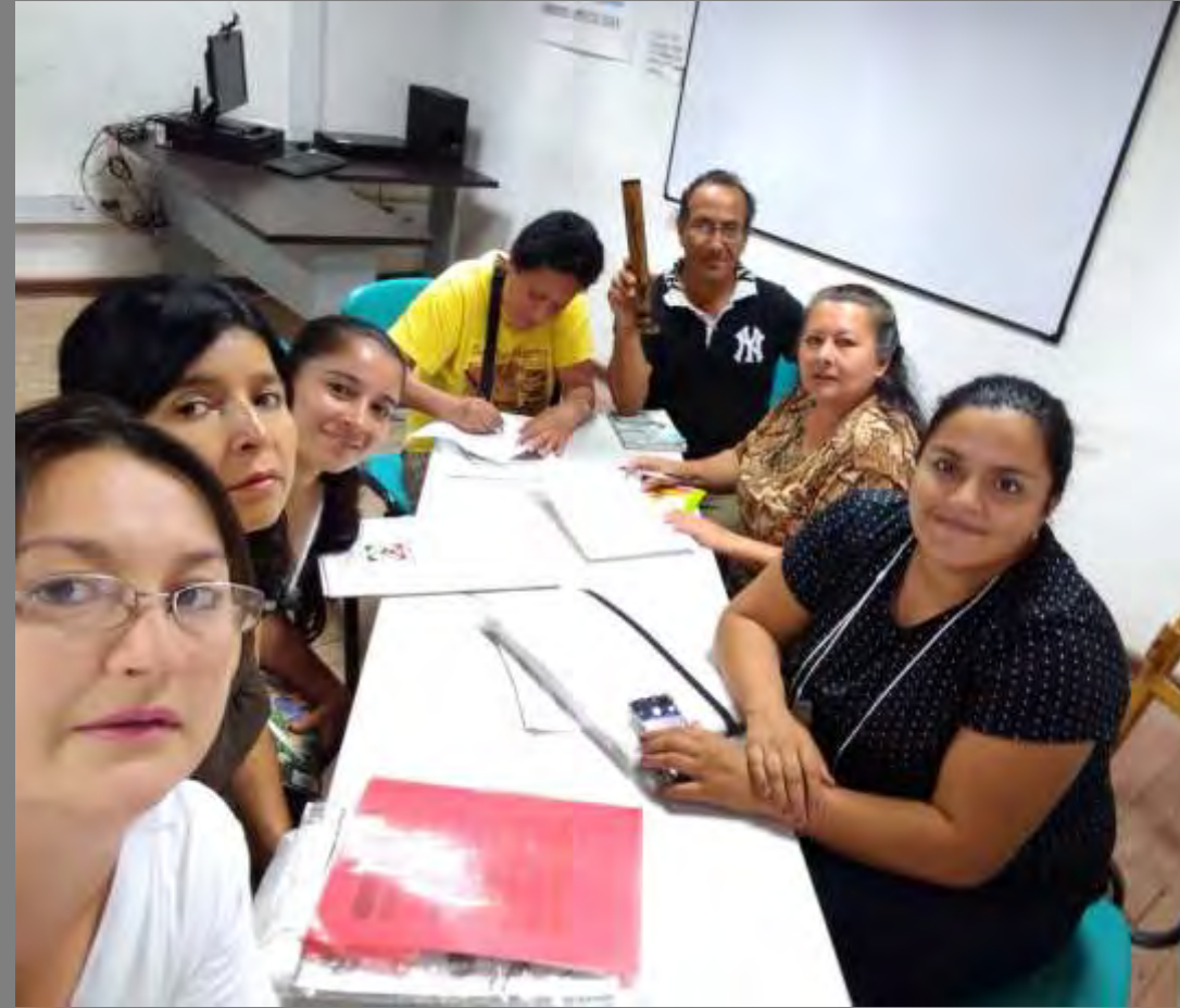
Salazar de las Palmas, Norte de Santander