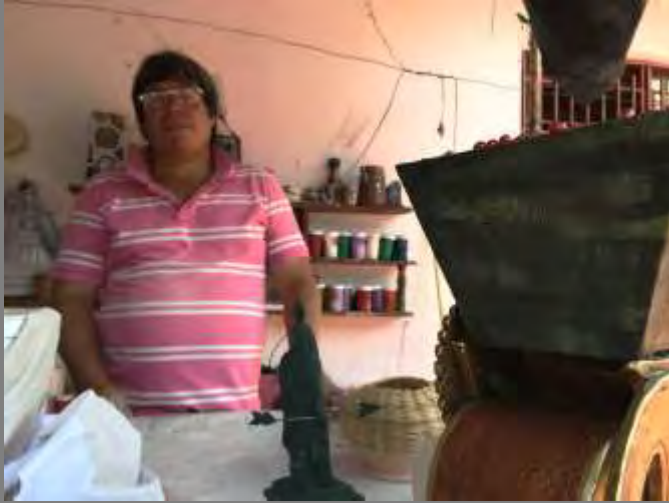
FOTO DEL ARTESANO