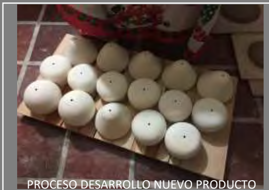
PROCESO DESARROLLO NUEVO PRODUCTO