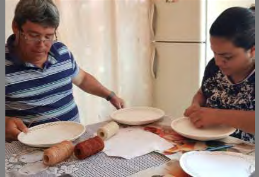
2do desarrollo de texturas en bejuco y fique.

Fotos tomadas por Alexandra Savelli y Lilian A. Contreras Salazar, Norte de Santander