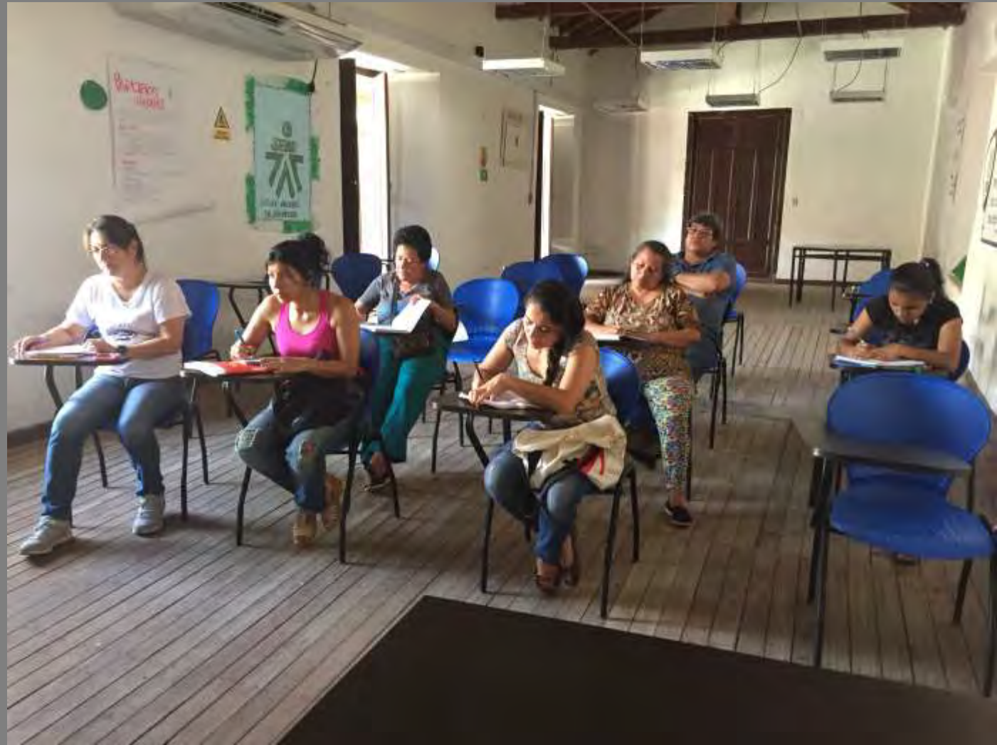
Fotos tomadas por Alexandra Savelli Salazar de las Palmas, Norte de Santander

Se explicó a la comunidad el concepto de producto, línea y colección para entender como funcionan los productos en un espacio. También, teniendo en cuenta lo trabajado en los talleres anteriores, se explicaron e hicieron algunos ejercicios de ejemplo de como aplicar las estrategias para diversificar productos.