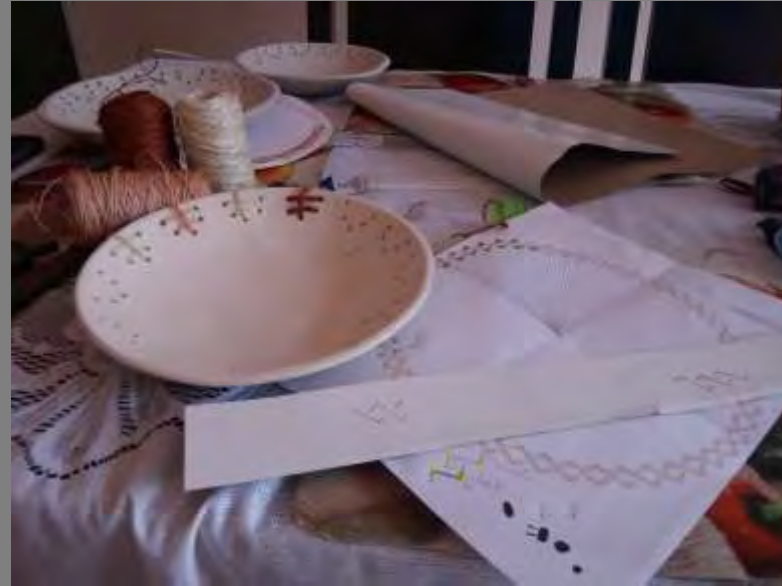
1er desarrollo de texturas en fique.