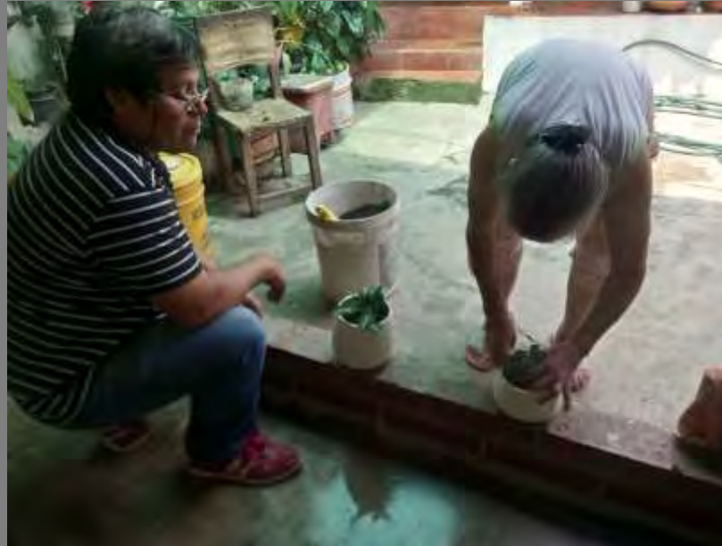
Impermeabilización de materas. Una de estas con esmalte y la otra con imprimante de vinilo. Esta impermeabilización se hizo en el interior del producto.