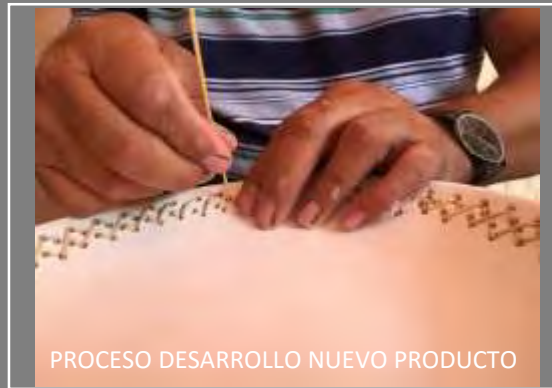
PROCESO DESARROLLO NUEVO PRODUCTO