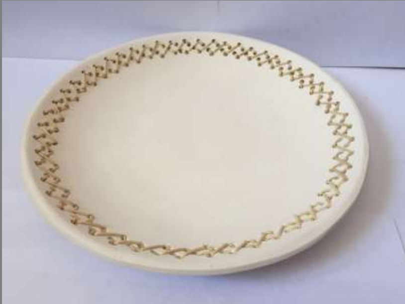
Muestra de producto final con nueva textura tejida en bejuco

Se realizó una impermeabilización en las materas.