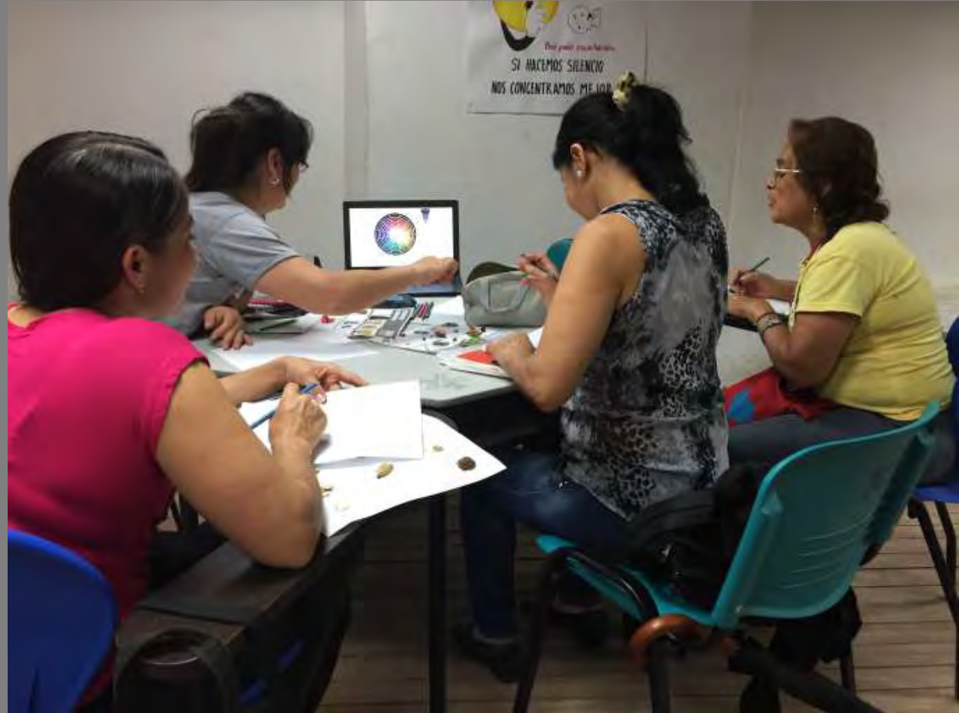
Fotos tomadas por Alexandra Savelli Salazar de las Palmas, Norte de Santander

Se procedió a identificar los colores de las mismas y su entorno donde se podía observar una primera paleta de color y luego con cada todo se realizó un ejercicio de elaborar sus armonías según la rueda cromática.