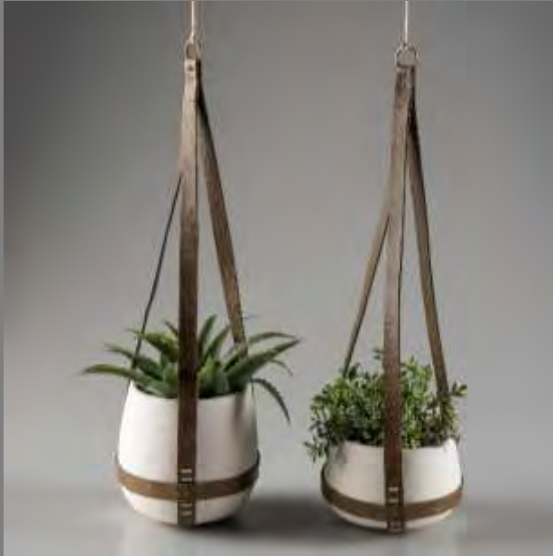
PRODUCTOS ELABORADOS POR EL ARTESANO

A partir de los productos elaborados en los años anteriores se planteó con este artesano trabajar con la impermeabilización de las materas, y el proponer otros tejidos para una línea de producto de vajilla.