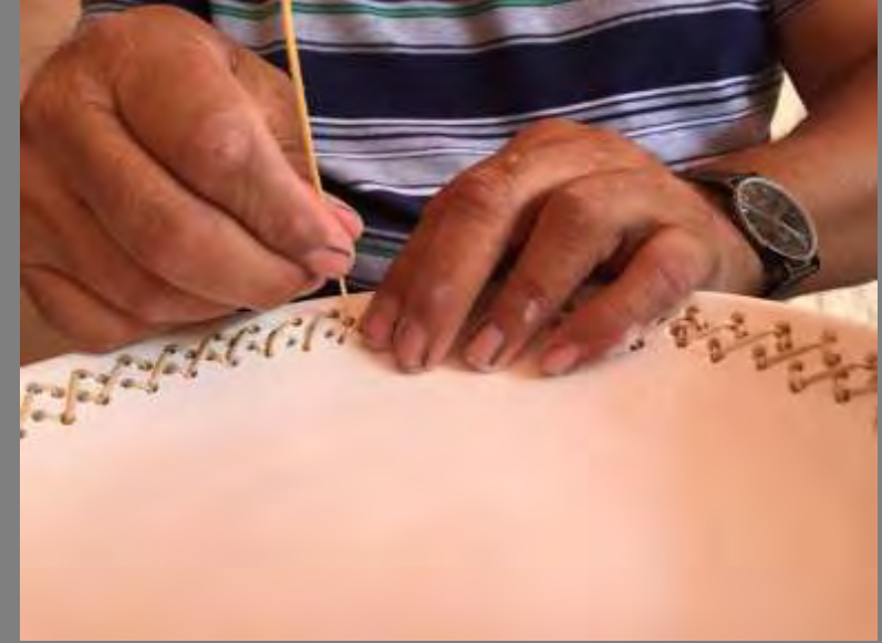
Elaboración del tejido en el plato