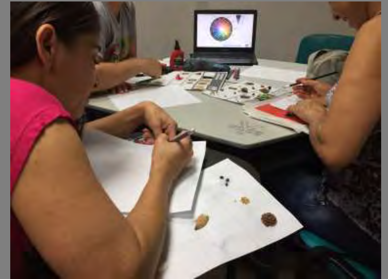
de las Palmas, Norte de Santander