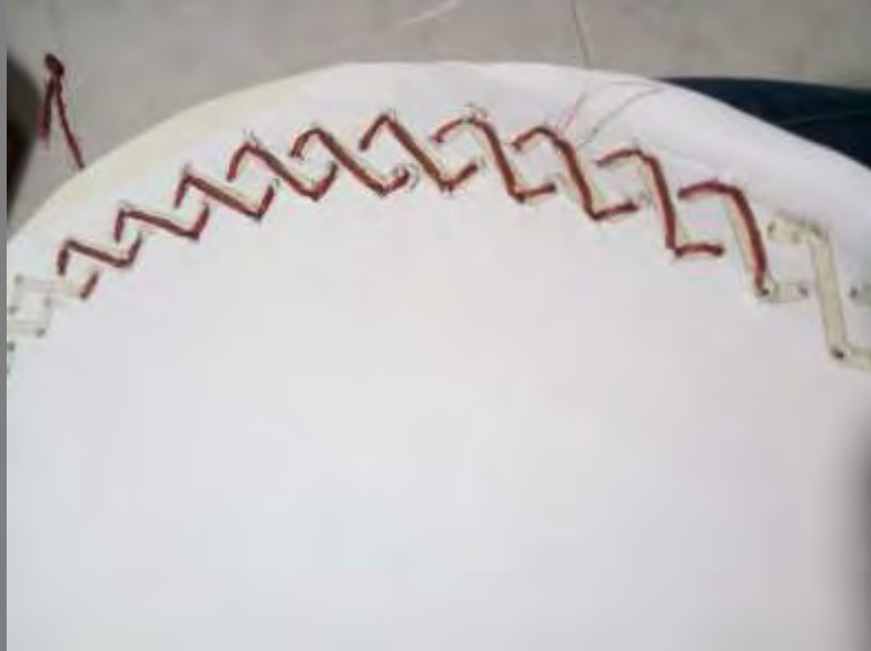
Desarrollo de textura sobre cartón para definir como realizar los agujeros en la arcilla.

Se plantearon varias propuestas de texturas tejidas inspiradas en unos petroglifos que se encuentran en el municipio de Salazar. Estas se comenzaron a desarrollar en bejuco y en fique, para indagar en una propuesta de cambio de color en el tejido.