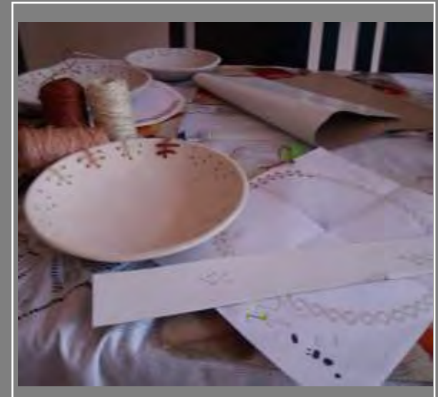
Muestra de textura en plato tejido. Inspiración: petroglifos de Salazar.