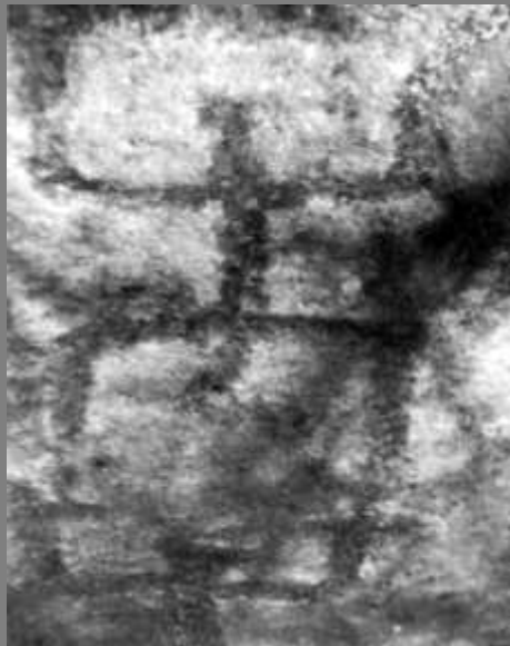
Petroglifo de Salazar

Se plantearon varias propuestas de texturas tejidas inspiradas en unos petroglifos que se encuentran en el municipio de Salazar. Estas se comenzaron a desarrollar en bejuco y en fique, para indagar en una propuesta de cambio de color en el tejido.