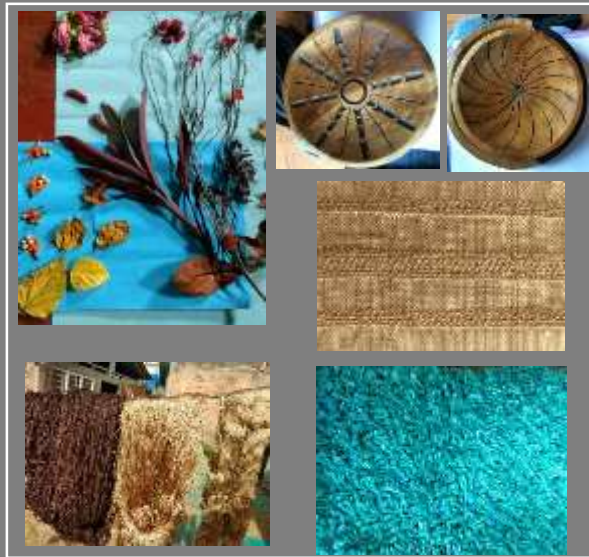
Paletas de color Pruebas de Texturas