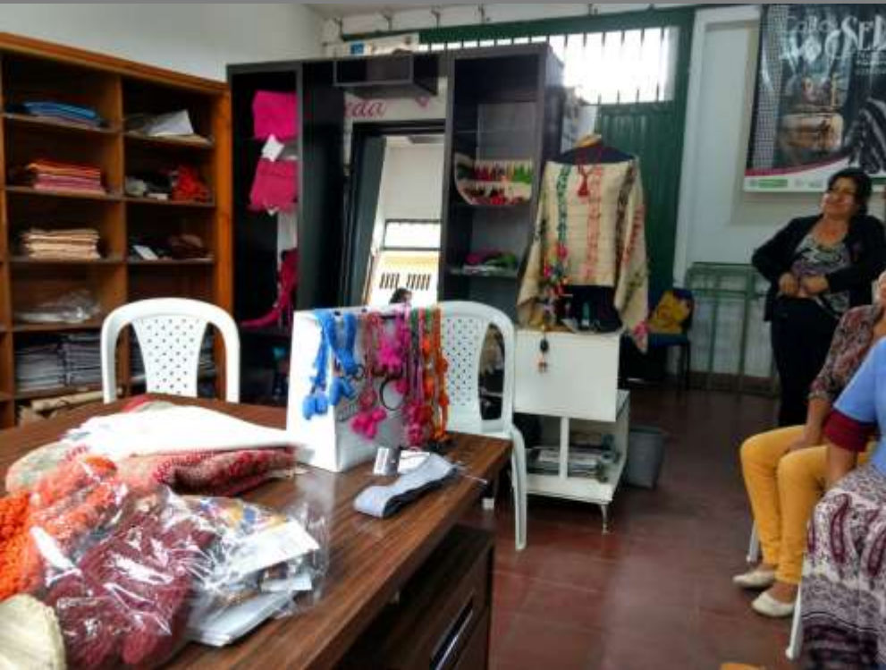
PLANO GENERAL DEL TALLER/COMUNIDAD