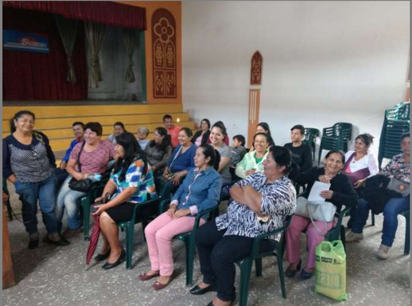
FOTOS DEL TALLER

Exhibición de producto: se imparte taller de vitrinismo para la artesanía, haciendo énfasis en los diferentes oficios que trabajan como la tejeduría en seda, trabajo en madera, cerámica y bisutería. Se explican diferentes métodos para resaltar los valores estéticos de los productos y se enseñan pautas para el buen servicio y la buena atención al cliente.