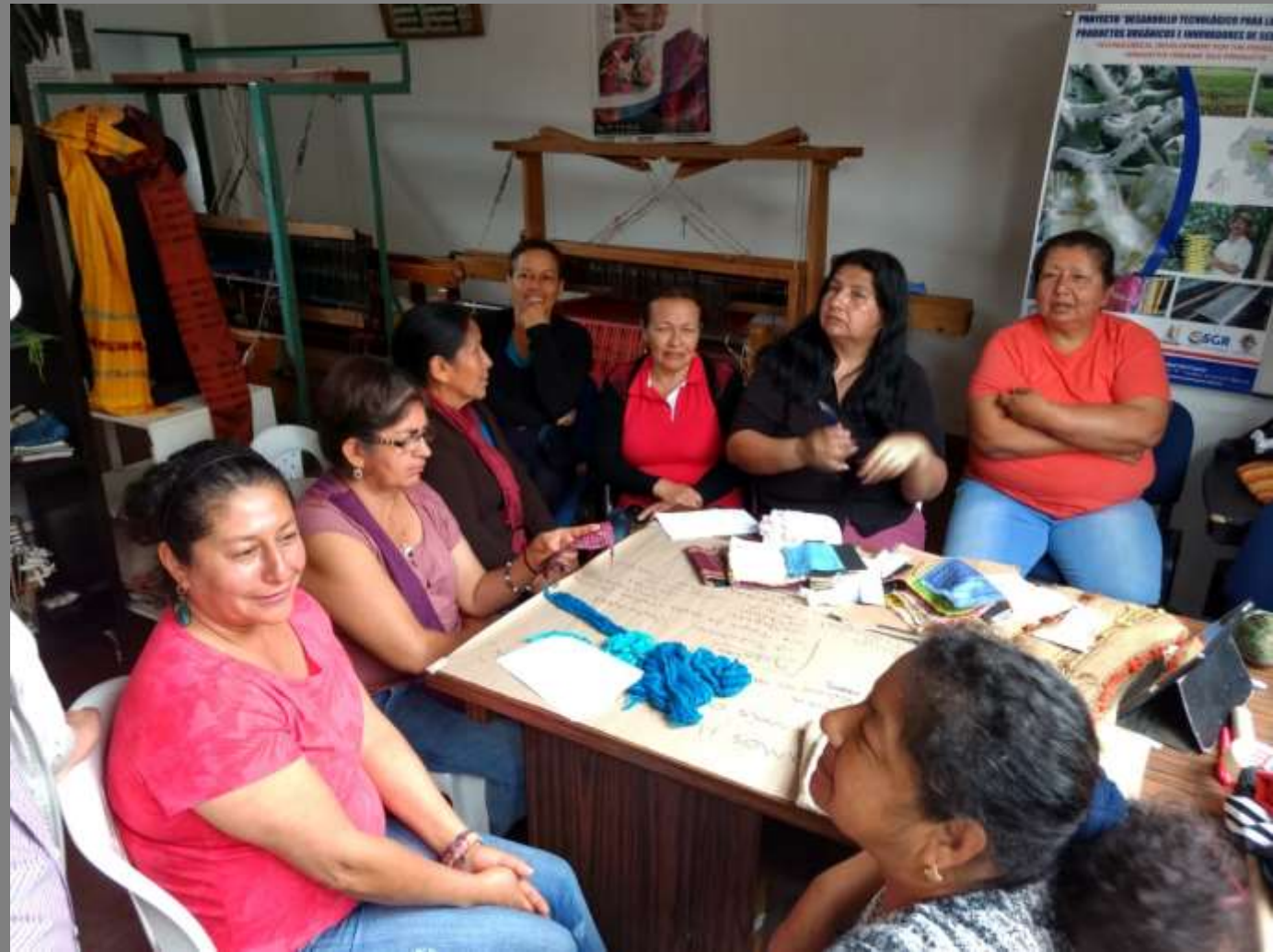
FOTOS DEL TALLER