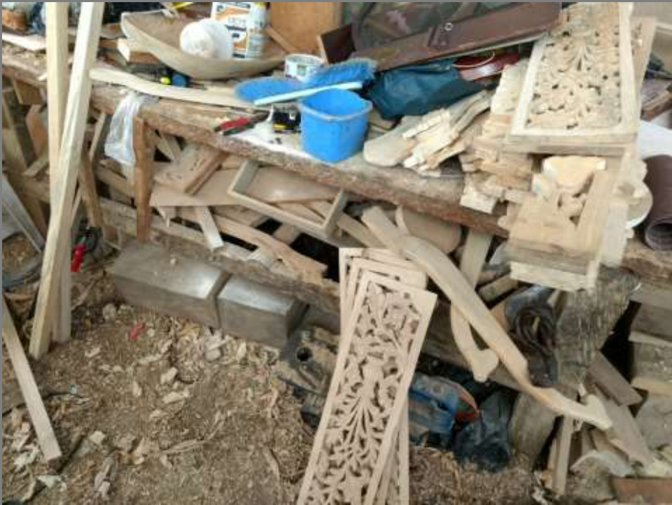
PLANO GENERAL DEL TALLER/COMUNIDAD