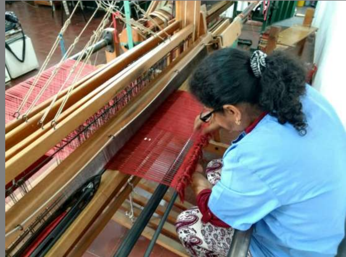
PLANO GENERAL/MEDIO DEL ARTESANO

ENTRADA 2: Diagnóstico inicial de productos e inspiración.