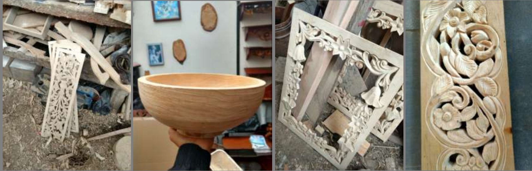
FOTOS DE LOS PRODUCTOS ACTUALES (PRIMERA/S VISITA/S) FOTOS DE LOS PRODUCTOS ASESORADOS (MUESTRAS, MODELOS, PROTOTIPOS)

Diagnóstico de productos encontrados, propuestas de mejoramiento de los mismos y creación de nuevos objetos.