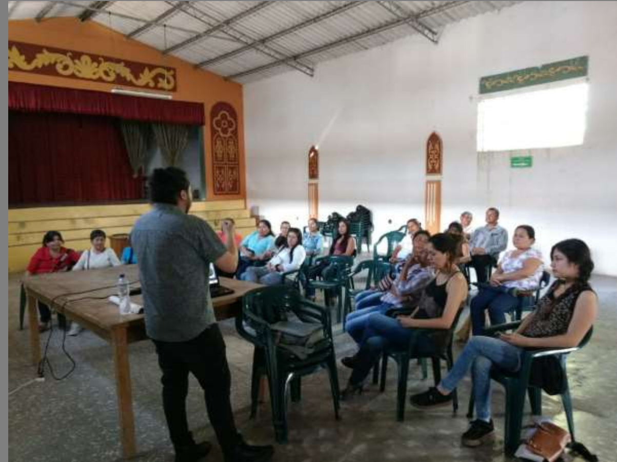
FOTOS DEL TALLER

Para continuar se hace un taller práctico en el cual los artesanos salen a un lugar como un parque o jardín a recoger algunos elementos naturales los cuales, se configuran de manera coherente con papeles de color según las tendencias y así los artesanos obtienen una herramienta autónoma para generar sus propias paletas de color.