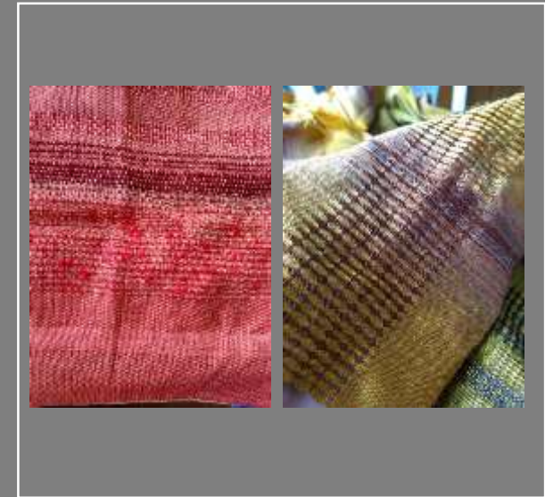
Pruebas a escala Muestras Prototipos