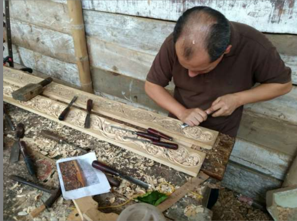
ENTRADA 2: Diagnóstico inicial de productos e inspiración.