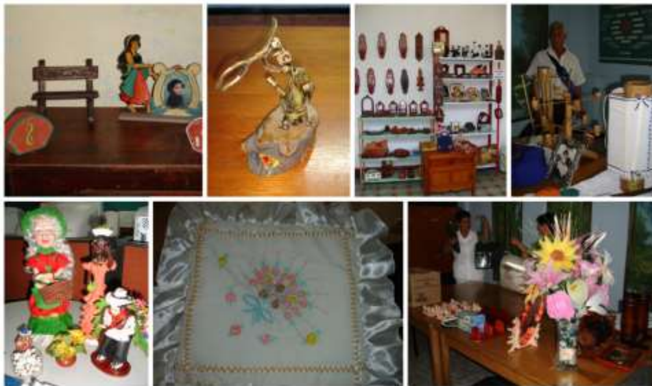
Foto5-11. Algunos productos presentados por los asistentes de Buga - junio de 2006 Adriana Oliveros Niebles