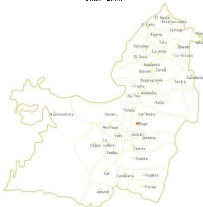
Mapa 2. Valle del cauca: Municipio Buga Adriana Oliveros Niebles Julio 2006