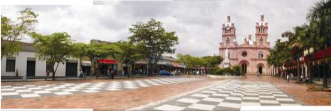
Foto 1. Buga - Junio 2006

Buga es una ciudad pequeña muy tradicional, la cual gira en torno a la Basílica del Señor de los Milagros, allí asisten muchos turistas y devotos siendo así el turismo una de las mayores fuentes de ingresos de los bugueños los cuales cuentan con hoteles, restaurantes y ventas de “artesanías” religiosas.