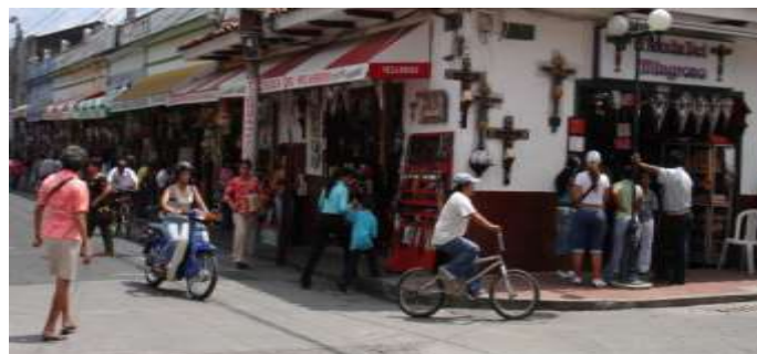
Foto 12. Calle de las Artesanías. Buga junio de 2006 Adriana Oliveros Niebles