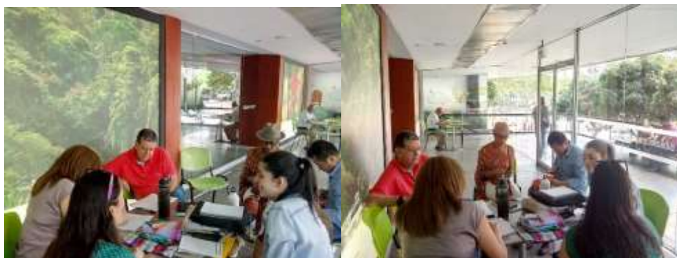
Diagnóstico grupo artesanos tejedores Medellín, Antioquia, mayo 15 de 2018

Igualmente en Medellín se realizó una reunión organizada por el enlace y los diseñadores del laboratorio de Antioquia, con los artesanos que se dedican a oficios textiles para establecer sus necesidades de asistencia técnica en procesos como los que se van a manejar con el grupo del Carmen de Viboral, se encontró en los asistentes a dicha reunión un requerimiento similar en procesos de acabados generales textiles lo que permitió conformar un grupo que se incorporara al taller realizado en el Carmen de Viboral en el mes de agosto de 2018.