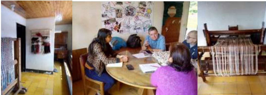
Diagnóstico grupo Telares Santa María Carmen de Viboral, Antioquia, mayo 14 de 2018

realizando el diagnóstico del grupo en lo relativo a las instalaciones, técnicas y equipos de tejeduría con que cuenta para el manejo de fibras naturales como la lana, el fique y el algodón; se estableció con el grupo de artesanas el apoyo que requerían en los procesos de pre tratamientos (descruce, blanqueo etc.), tintura y postratamientos (suavizado, aprestos) en las fibras que ellos manejan.