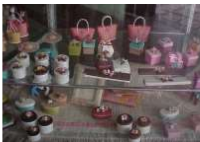
Artesanías de Colombia La Jagua Junio 2.006 Artículos tradicionales, miniaturas en fique.

Los productos que principalmente elabora Artefique: Son las miniaturas que se comercializan como artículos decorativos, estos son muy conocidos desde hace varios años, tanto que La Jagua es recordada por este tipo de productos, lo mismo que las brujas hechas en fique por una antigua leyenda que existe, y de ahí que la Jagua es conocida como la población de las brujas.