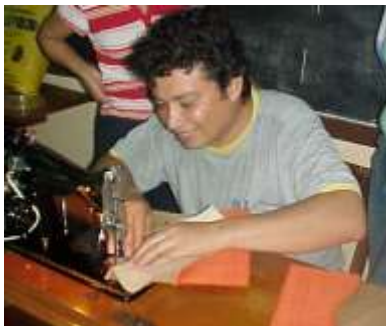
Artesanías de Colombia, La jagua Junio 2.006 Proceso de cosido a máquina

Se escoge una tela de 35 cm X 70 cm, y un retal de cuero de 10 cm X 35 cm, se trazan con los moldes las partes tanto del cuero como las de fique, dejando en ambos casos, 1 cm para las costuras, se toman las partes delantera y trasera del bolso cosiendo primero el cuero a la tela de fique, después se unen estas dos partes y luego a la base, y por último al forro, para la cargadera se tejen en macramé dos tiras de 70 cm X 3 cm de grueso, y se unen al bolso.