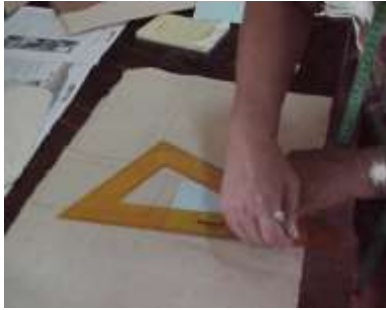
Artesanías de Colombia, Trazado de moldes, La jagua Junio 2.006