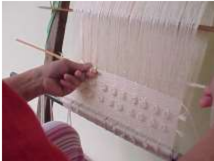
Artesanías de Colombia, La jagua Junio 2.006 Tejido obtenido en el taller

En esta actividad se dispusieron los telares para elaborar un tejido de 35 cm de ancho por 70 cm de largo; partiendo del tradicional tejido tafetán se hizo una variación en la trama cada 2 cm, formando aros o argollas, el cual generó una nueva textura, siendo un diseño muy interesante tanto para la vista como para el tacto.