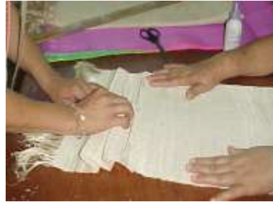
Artesanías de Colombia Trazado de Prensas la Jagua Junio 2.006