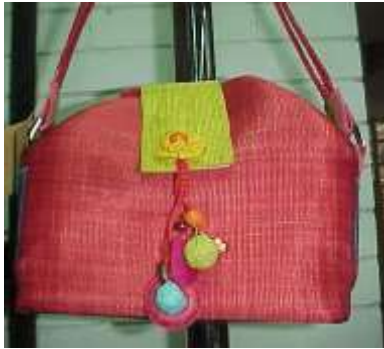
Artesanías de Colombia Junio 2.006 Referente bolso en fique La Jagua.

Sin embargo se ha diversificado el tipo de productos; teniendo en cuenta que el diseño de bolsos en fique se ha posicionado de manera significativa en el mercado local y departamental.