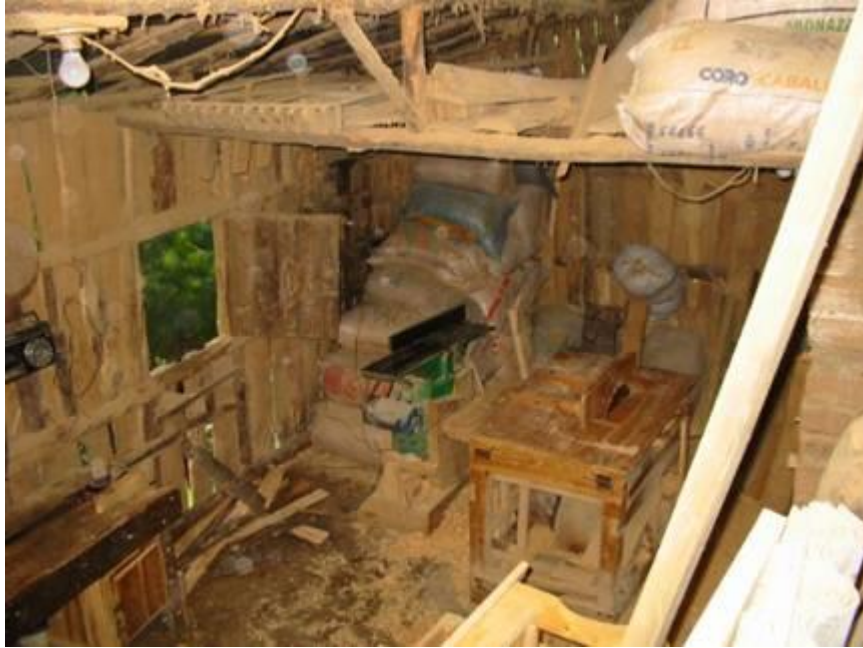
Talleres – Empresa José y María