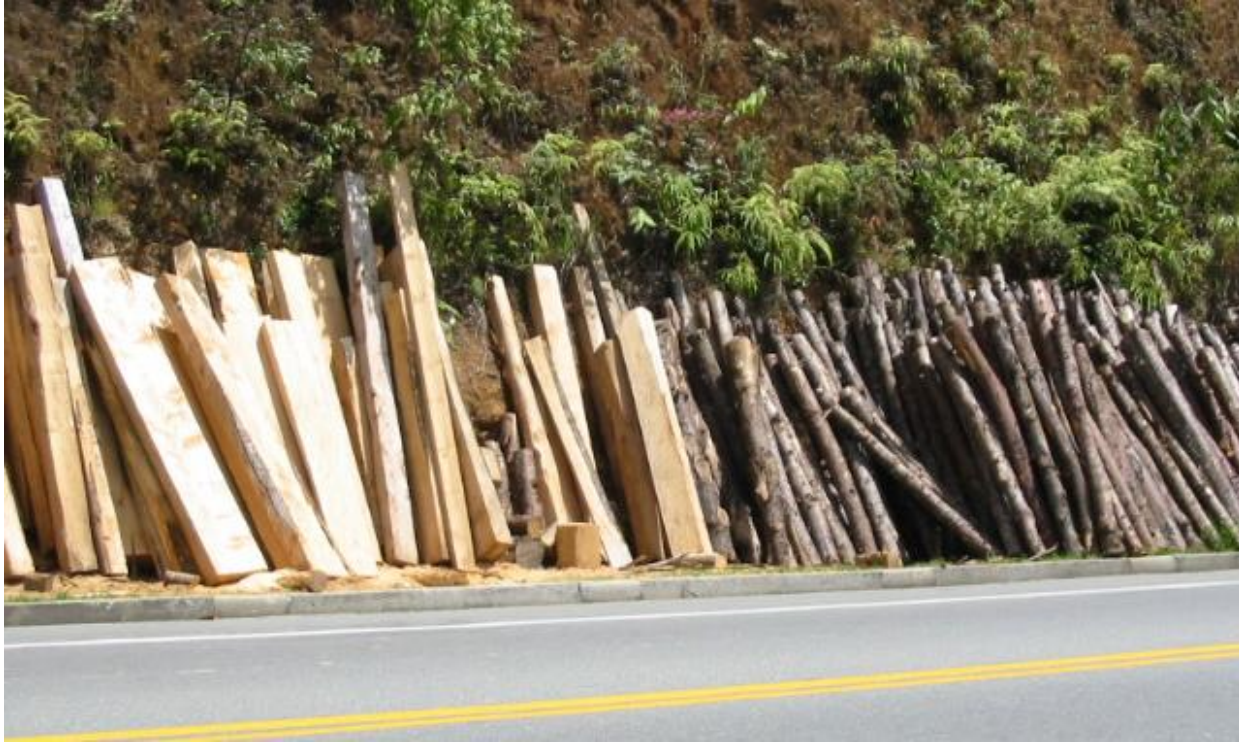
Secado natural de la madera