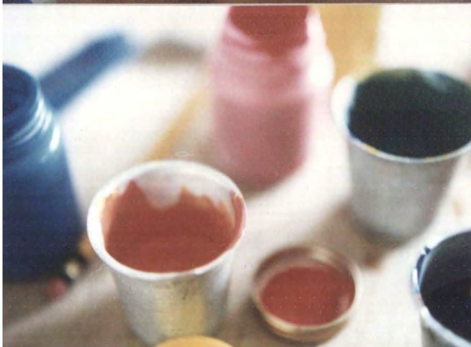
MOTIVO: Taller de teoría del color