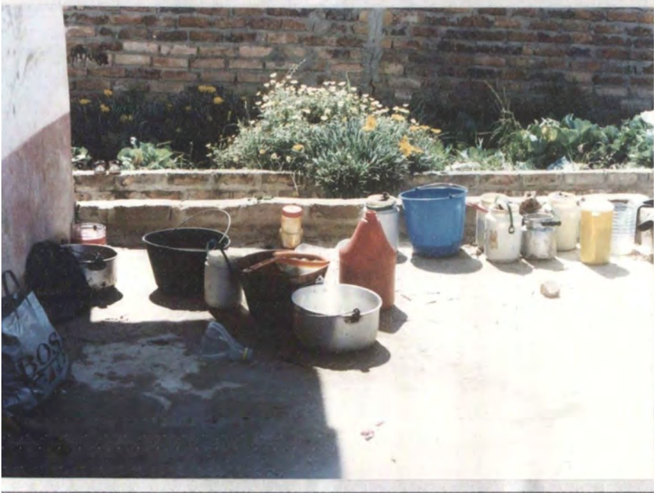
MOTIVO: Taller de tintes naturales