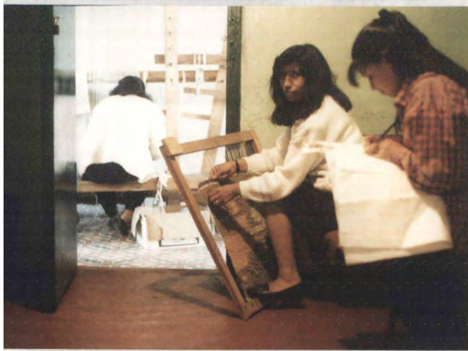
MOTIVO: Tejeduría telar vertical