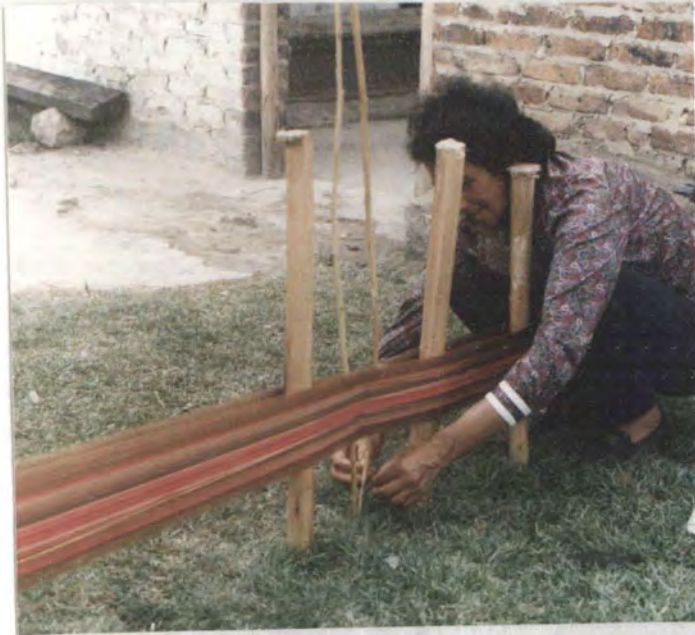
MOTIVO: Urdido en estacas