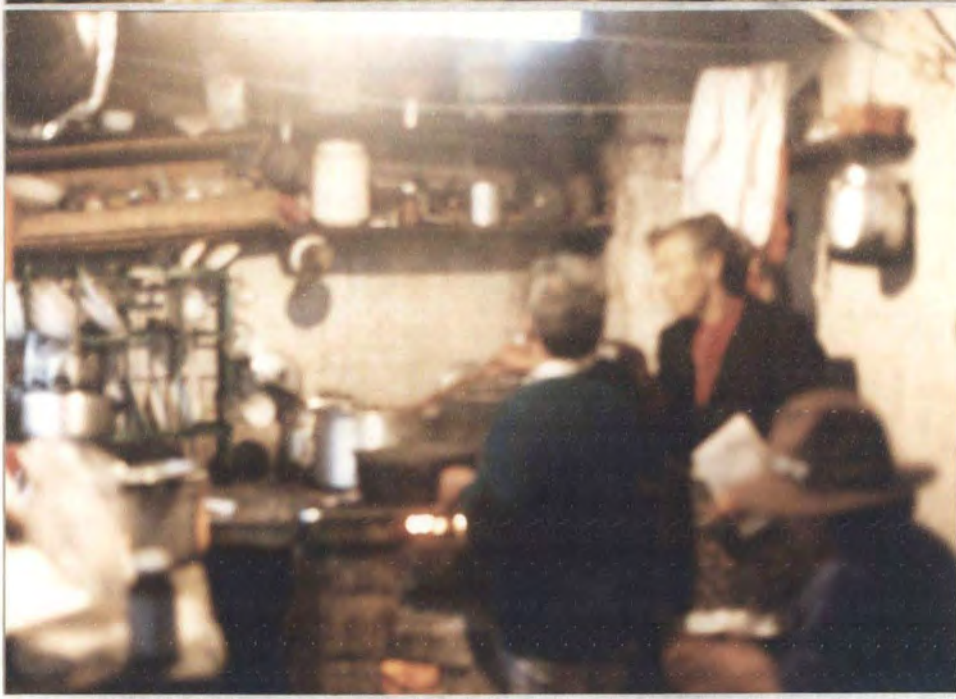
MOTIVO: Taller de tintes naturales