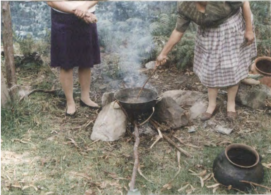
MOTIVO: Taller de tintes naturales