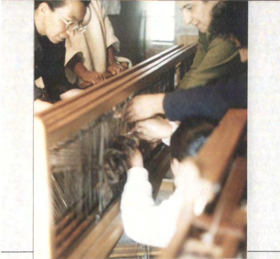
MOTIVO: Montura del telar horizontal