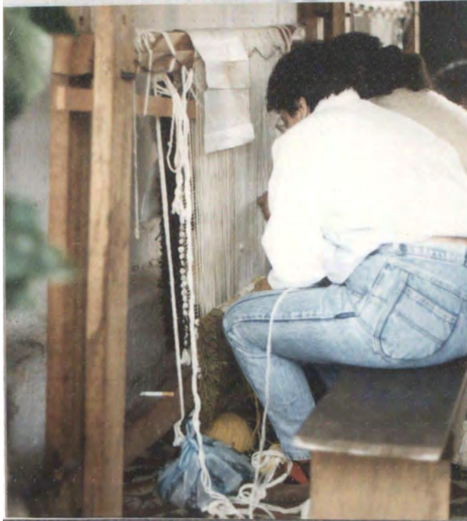
MOTIVO: Tejeduría telar vertical