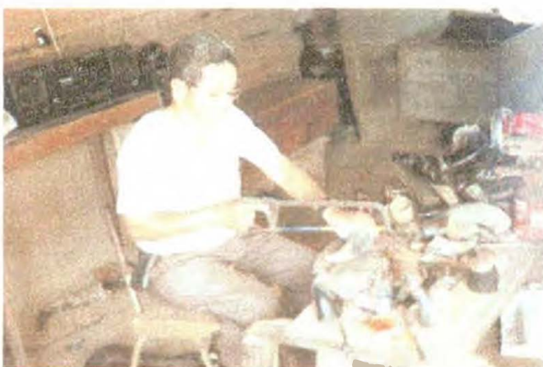
Se hacen cortes sesgados