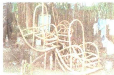
Taller de “Curvado”