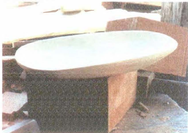
Batea Oval – Desarrollo de Referente