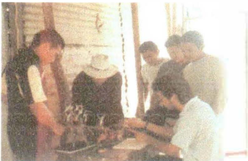
Equipo Diseñador y Artesanos Análisis de referentes y Visualización Desarrollo de Líneas de Productos

Con ellos analizamos que su trabajo tenia identidad y buena calidad (aunque es hecho sin herramientas apropiadas), pero que su carácter decorativo y de souvenir podía evolucionar aplicándolo a líneas de productos utilitarios, es así que desarrollamos una línea de accesorios para asados, utilizando como referentes las tallas de sus garzas; entonces se propusieron Cubiertos, Pinchos y Servilleteros tallados en tolúa y encerados al natural... Los resultados fueron muy interesantes y ellos los apropiaron.