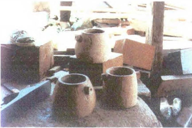
Contenedores – Gr a n o s - Referente