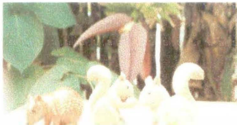
Referentes tallados – "Armadillos". (Izquierda)"Lapa"- (Derecha)Ardillas