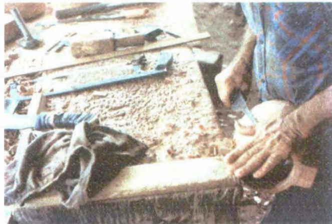
Talla de Pieza...