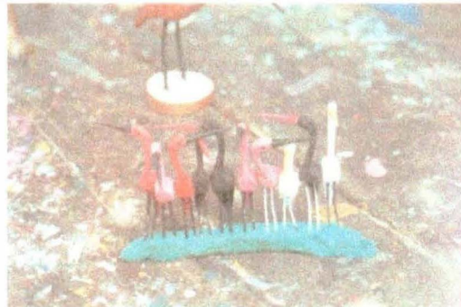
Ejercicio para llegar al Servilletero de 4 puestos; se toman algunas garcitas que colocan en palos (souvenir). Se montan en plastilina para simular base.