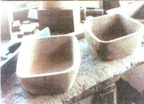
Bateas - Referentes