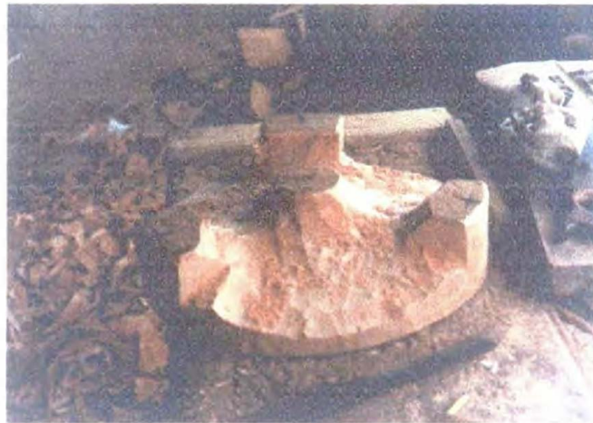
Talla gruesa – Aproximación a la forma