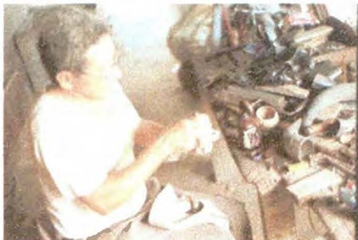
Ensamblamos tapas y agarraderas