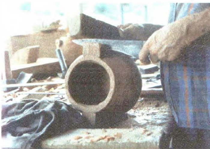
Talla fina – Forma final