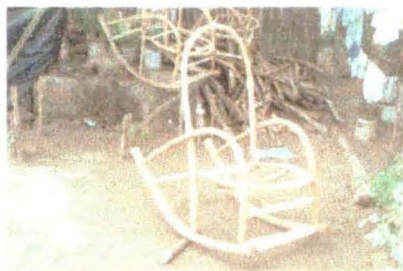
Mueble en Proceso