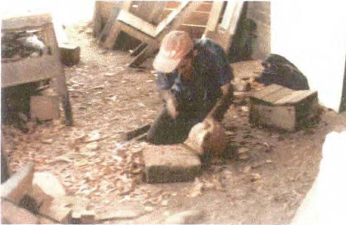
Desbaste de Bloque