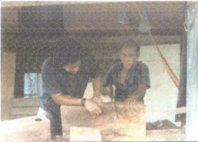
Diseñador - Artesano