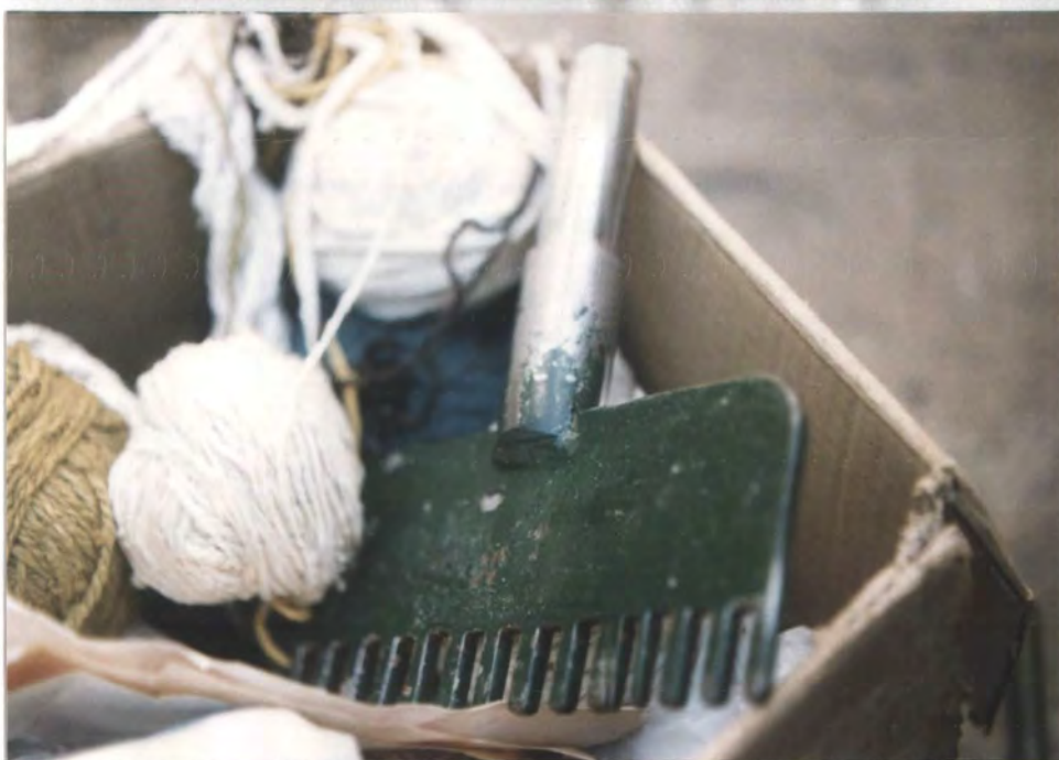
MOTIVO: Tejeduría telar vertical