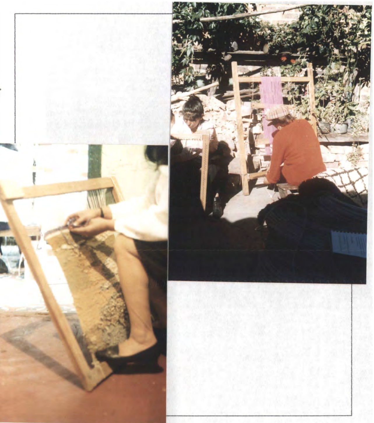
MOTIVO: Tejeduria telar vertical