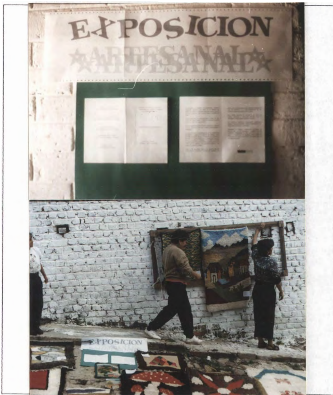
MOTIVO: Exposición artesanal