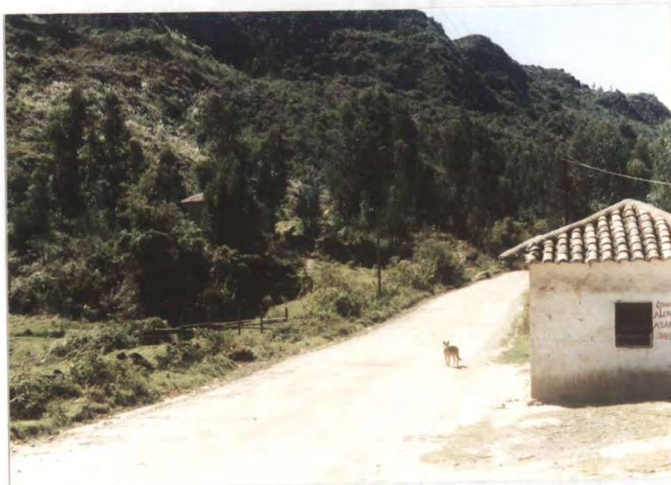
MUNICIPIO: TASCO - VEREDA DE HORMEZAQUE