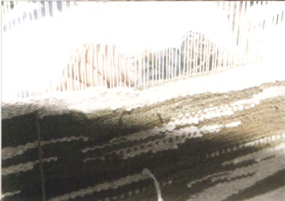
MOTIVO: Montura de lisos telar vertical Tejido Irregular