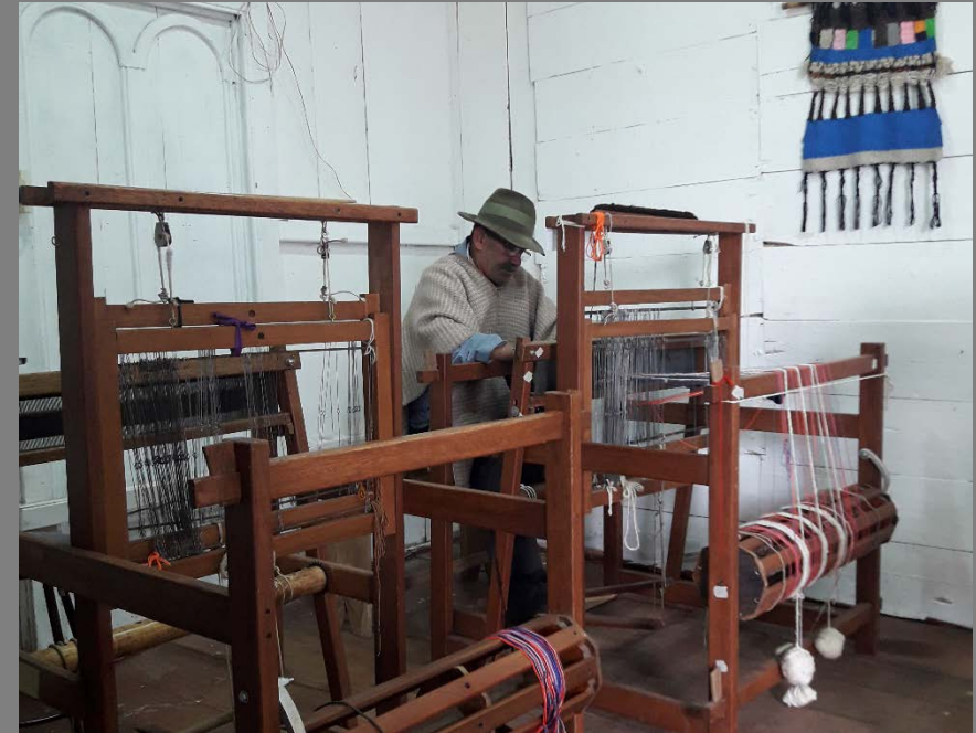
PLANO GENERAL/MEDIO DEL ARTESANO

ENTRADA 2: Socializar el proyecto con la artesana y realizar levantamiento de información acerca de La cultura material del oficio, así como las generalidades del mismo, con el objetivo de realizar un diagnostico tanto del artesano como del oficio.