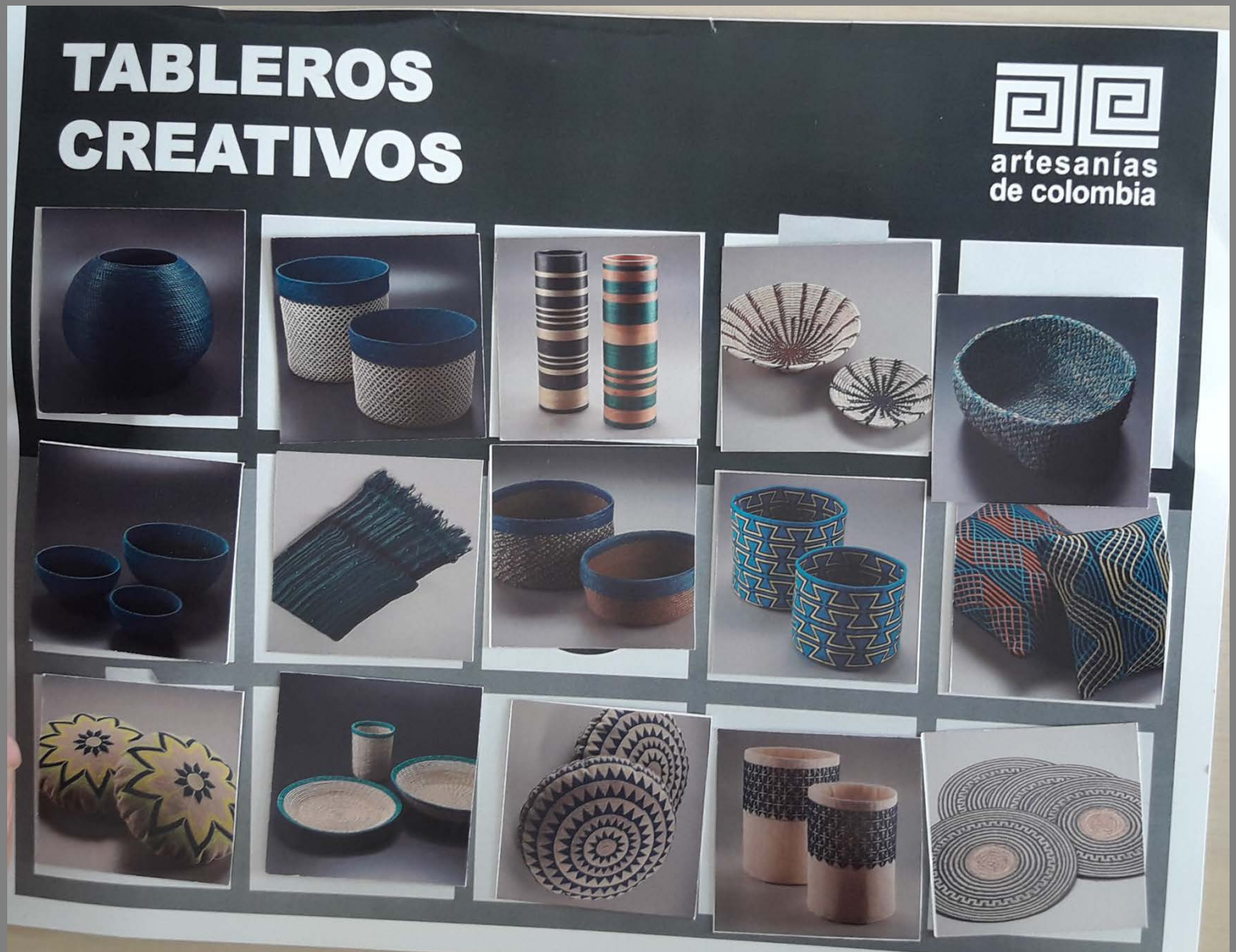
Imágenes Tableros – Grupo 1 Tablero por colores azules y naturales

ENTRADA 5: RESULTADOS TALLER Imágenes de los resultados del los talleres