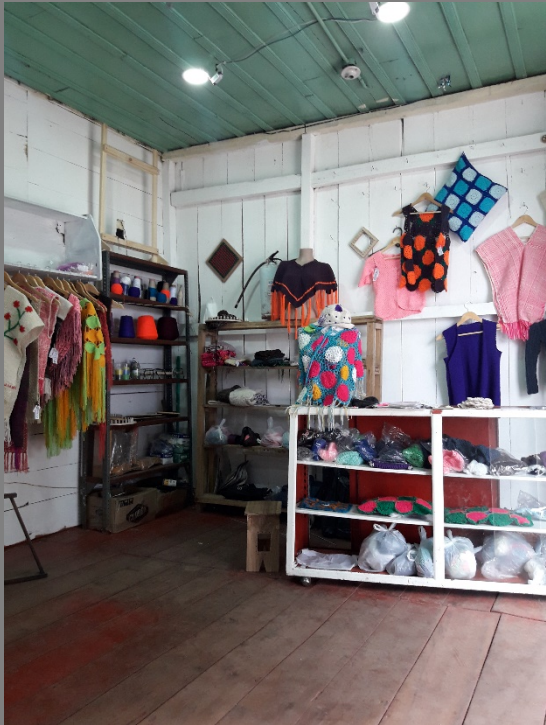
PLANO GENERAL DEL TALLER/COMUNIDAD

ENTRADA 1 Datos generales de la comunidad o taller Nombre de la Comunidad o taller: Artemur Oficio: Tejido, Crochet Técnica: Tejido en telar horizontal, agujas Materias Primas: Lana de ovejo, hilo Productos: Ruanas, cojines, bufandas, bolsos, gorros. Artesanos(nombre o numero): 2