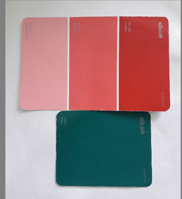
Imágenes Tableros – Artesanos Paleta de color, referente arquitectónico