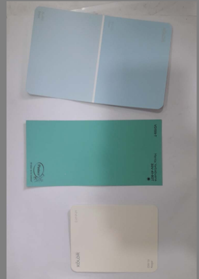
Imágenes Tableros – Artesanos Paleta de color, referente arquitectónico