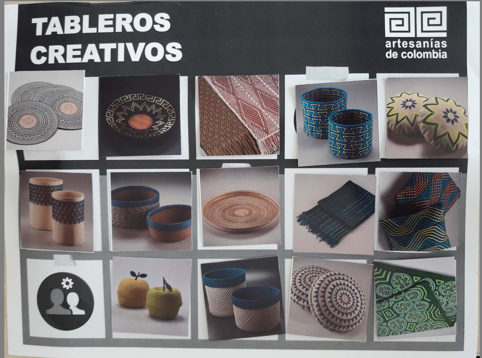
Imágenes Tableros – Grupo 2 Tablero por complementos cromáticos y funcionales

ENTRADA 5: RESULTADOS TALLER Imágenes de los resultados del los talleres