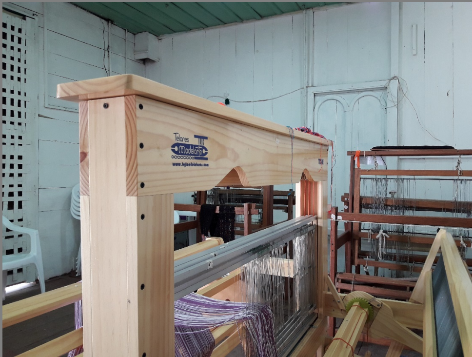
PLANO GENERAL DEL TALLER/COMUNIDAD

ENTRADA 1 Datos generales de la comunidad o taller Nombre de la Comunidad o taller: Artemur Oficio: Tejido, Crochet Técnica: Tejido en telar horizontal, agujas Materias Primas: Lana de ovejo, hilo Productos: Ruanas, cojines, bufandas, bolsos, gorros. Artesanos(nombre o numero): 2