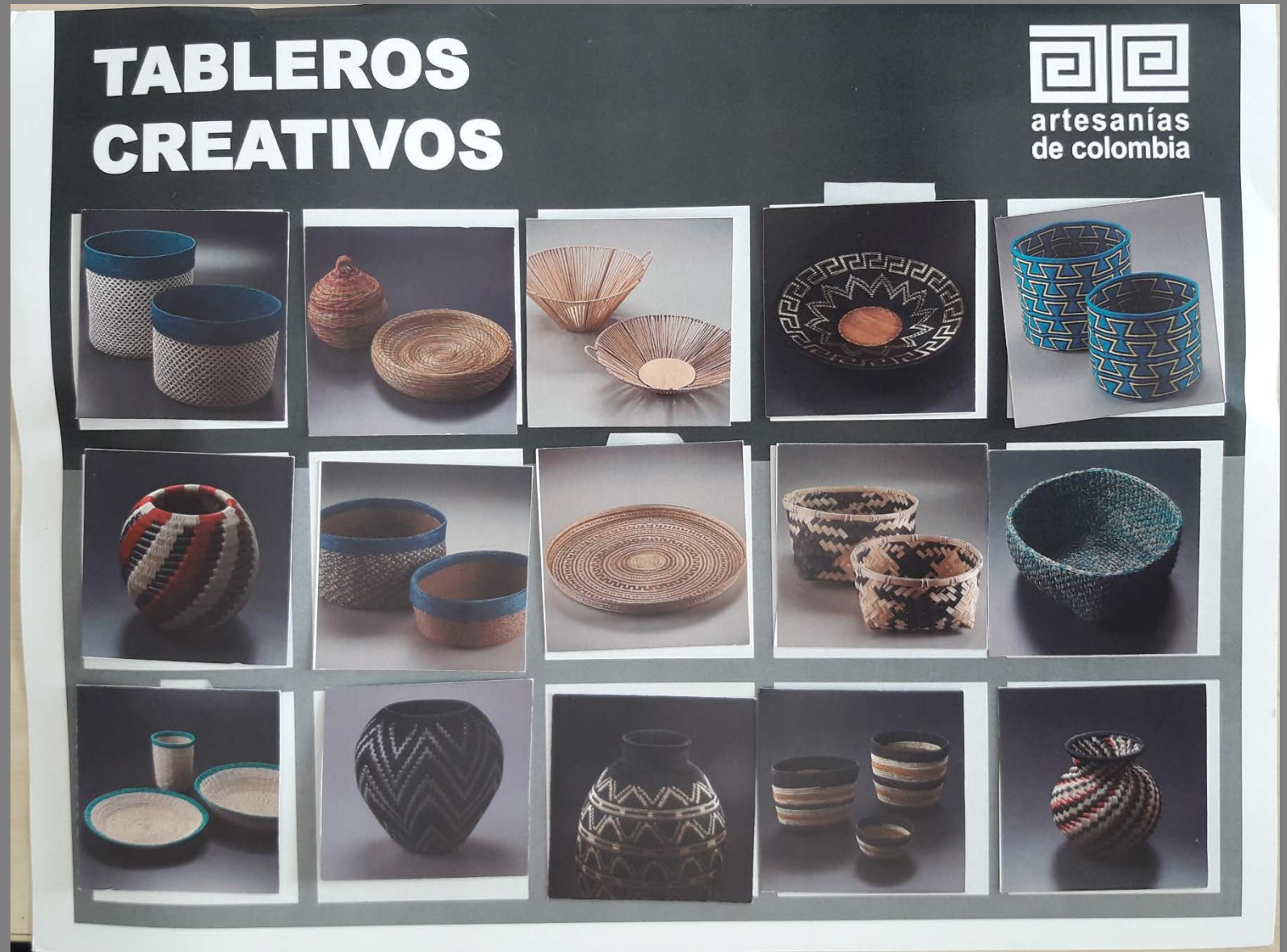
Imágenes Tableros – Grupo 1 Tablero por Función y color

ENTRADA 5: RESULTADOS TALLER Imágenes de los resultados del los talleres