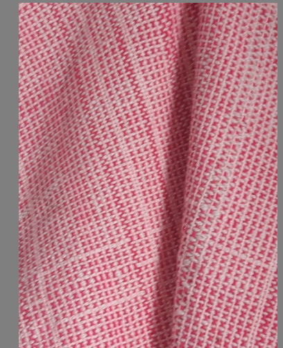
FOTOS DE LOS PRODUCTOS ACTUALES (PRIMERA/S VISITA/S) FOTOS DE LOS PRODUCTOS ASESORADOS (MUESTRAS, MODELOS, PROTOTIPOS)