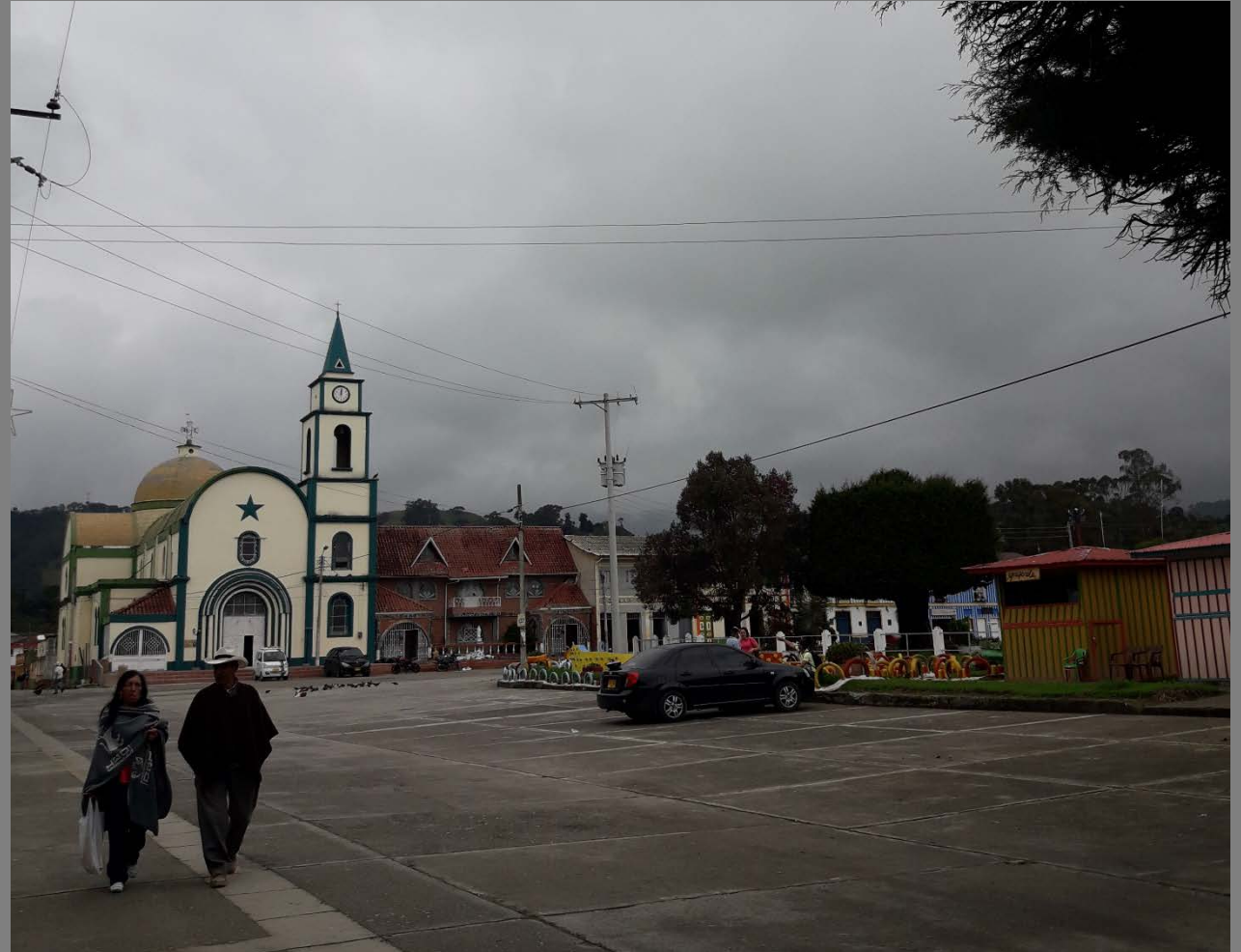
FOTO PLANO GENERAL DEL MUNICIPIO

Esta población se identifico en el año 2015, entrado a trabajar con ellos en Diseño, y en el año 2016 y 2017 se realizaron acompañamientos en mejoramiento de técnica, logrando excelentes resultados.