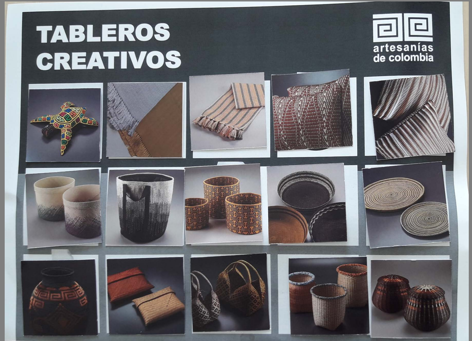
Imágenes Tableros – Grupo 2 Tablero por colores tierra

ENTRADA 5: RESULTADOS TALLER Imágenes de los resultados del los talleres