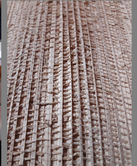
FOTOS DE LOS PRODUCTOS ACTUALES (PRIMERA/S VISITA/S) FOTOS DE LOS PRODUCTOS ASESORADOS (MUESTRAS, MODELOS, PROTOTIPOS)