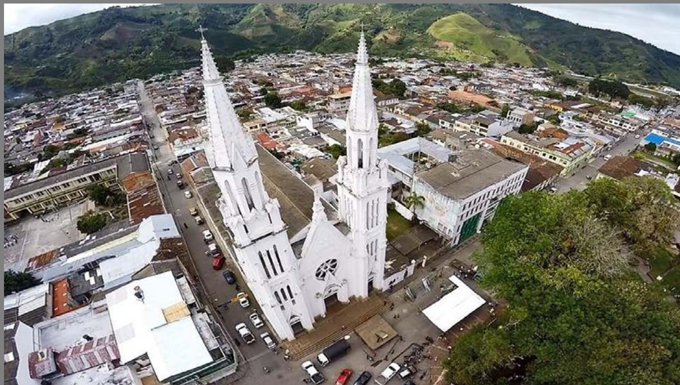
FOTO PLANO GENERAL DEL MUNICIPIO

Se realizan trabajo en calceta de plátano, totumo y guadua, además un artesano que maneja el tejido en lana de ovejo. Los productos encontrados fueron los siguientes: sombreros, canastos pequeños tipo souvenir, pulseras, contenedores, individuales, posavasos, portarretratos, empaques, pesebres y sopladeras, algunos tejidos en calceta de plátano otros en totumo o la mezcla de los dos, lámparas en guadua, mochilas, sacos y ruanas tejidas en lana de ovejo.