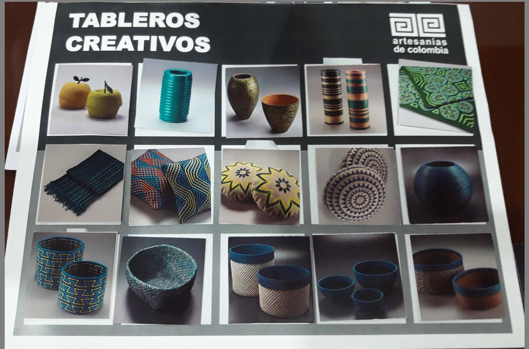
Imágenes Tableros – Grupo 1 Tablero por color azul

ENTRADA 5: RESULTADOS TALLER Imágenes de los resultados del los talleres