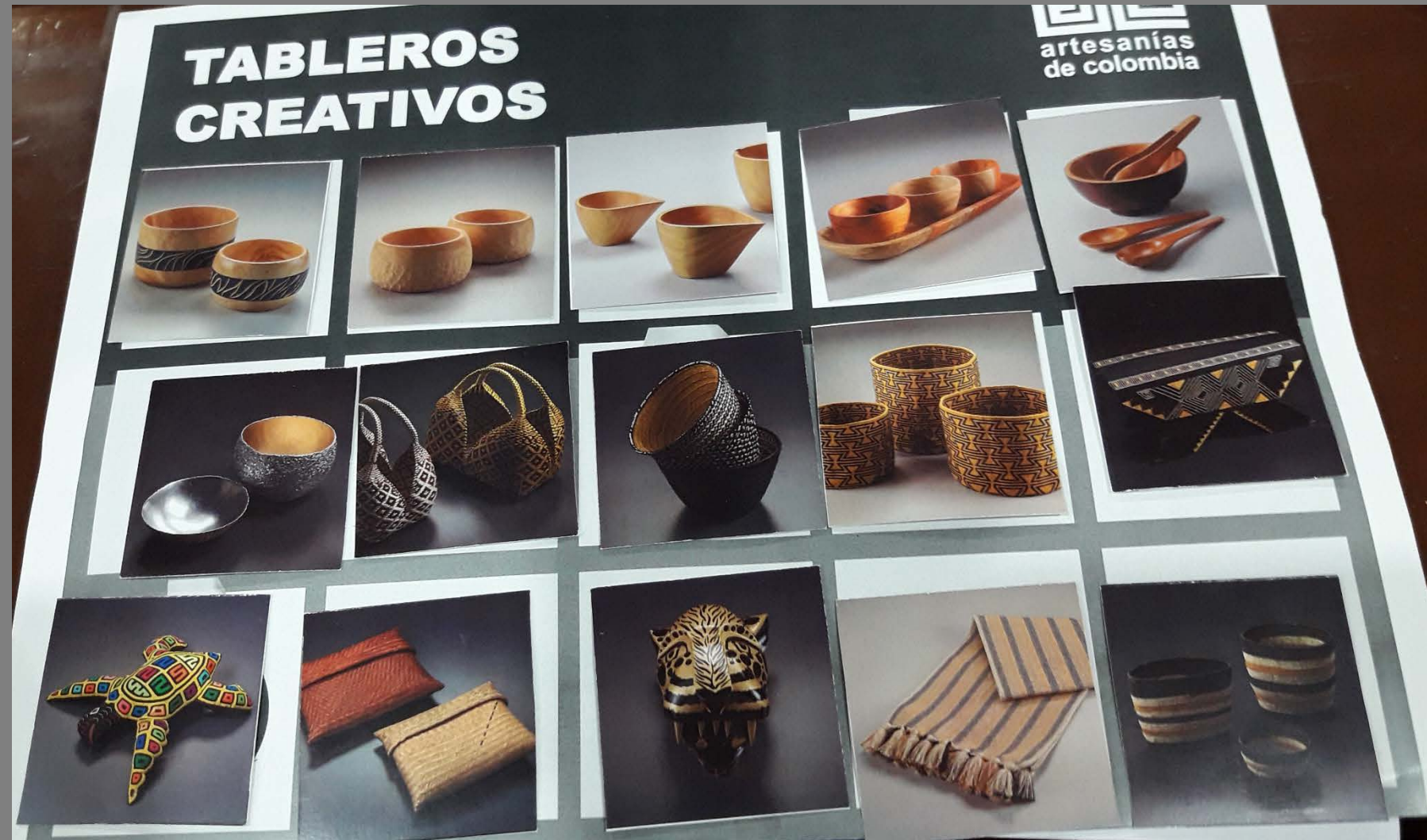
Imágenes Tableros – Grupo 1 Tablero por color amarillo