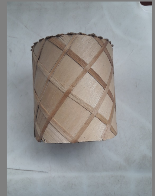
FOTOS DE LOS PRODUCTOS ACTUALES (PRIMEROS PRODUCTOS) FOTOS DE LOS PRODUCTOS ASESORADOS (PRODUCTOS DESARROLLADOS)