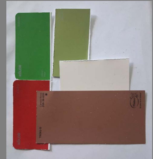
Imágenes Tableros – Artesanos Paleta de color, referente arquitectónico