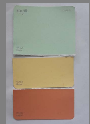
Imágenes Tableros – Artesanos Paleta de color, referente arquitectónico