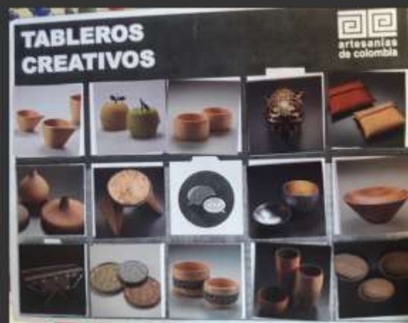
-Tablero por colores amarillos