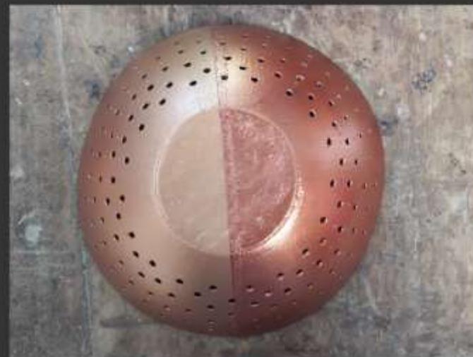
-Segunda mitad con pincel y pintura acrílica

➤ Imágenes taller – Artesanos de Maraguay Taller de color enfocado en la aplicación de color sobre superficies.