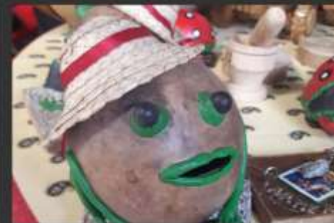
-Alcancías como "souvenir"