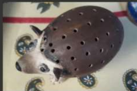
-Animales utilitarios, porta palillos