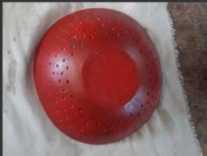
-Prueba con base roja