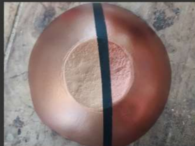
-Segunda mitad con pincel y pintura acrilica

➤ Imágenes taller – Artesanos de Maraguay Taller de color enfocado en la aplicación de color sobre superficies.