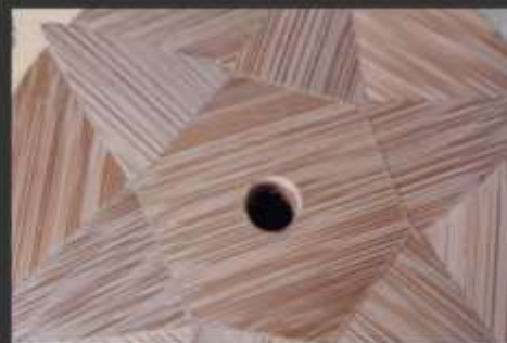
-Reloj con enchapes geometricos