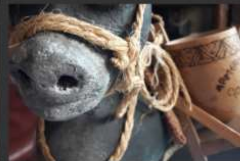
-Animales con detalles de "souvenir"