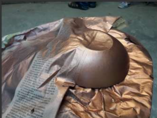
-Primera mitad con aerosol