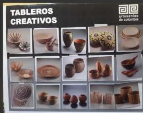
-Tablero por complementos de línea