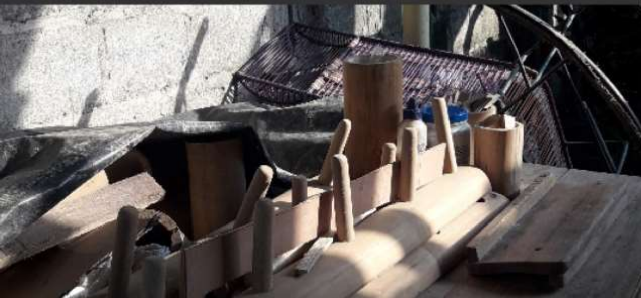
Artesanos Maraguay. ↙