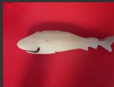
-Peces en guadua