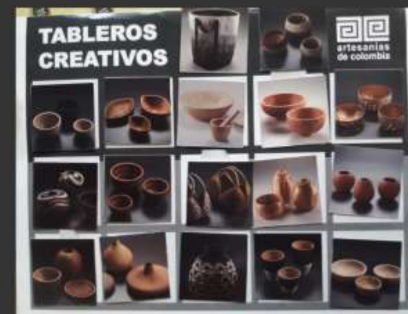
-Tablero por función y color.

➤ Imágenes Tableros – Artesanos de Maragúe Inspiración y conocer los productos realizados por los artesanos del país.