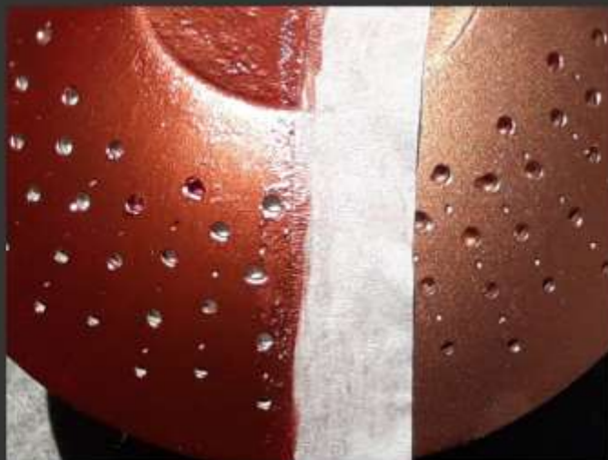
-Primera mitad con aerosol