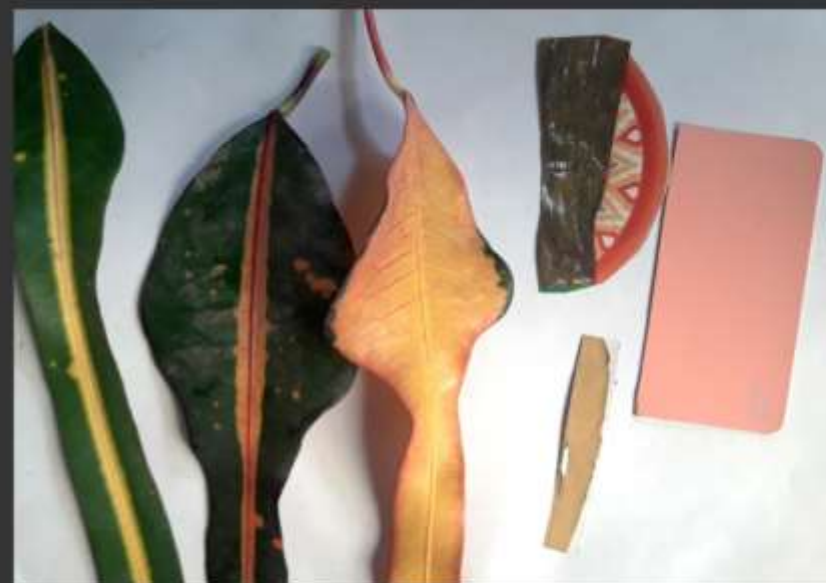
Imágenes Tableros – Rosa (Artesano) Paleta de color, referente con una hoja encontrada en el entorno