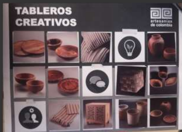
-Tablero por colores neutros de la materia prima