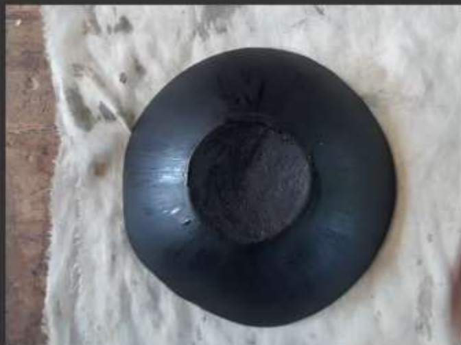
-Prueba con base negra