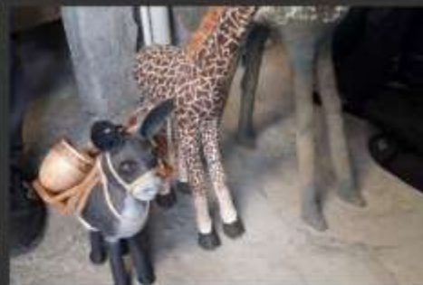
-Animales con detalles de "souvenir"