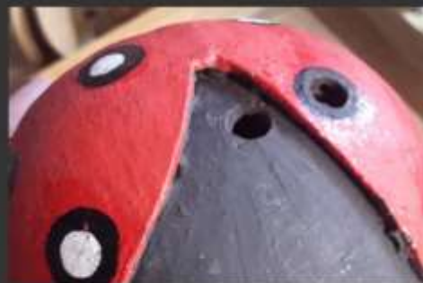
-Objetos decorativos (alcancías)

El diseñador líder realizo una charla sobre productos hechos en guadua para inspirar a los artesanos en este oficio.