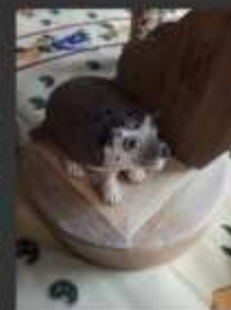
-Animales en papel