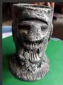
-Figuras decorativas mache