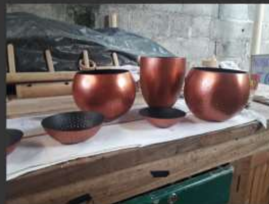
➤ Fotografía de los defectos de pintura / productos listos para ser empacados y enviados