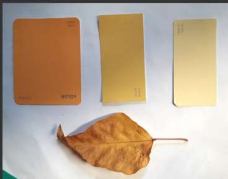
Imágenes Tableros – Yesid (Artesano) Paleta de color, referente con una hoja encontrada en el entorno