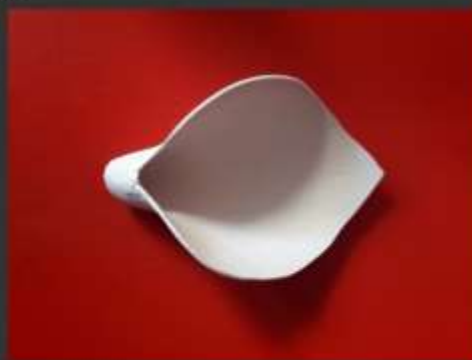
-Flores en totumo