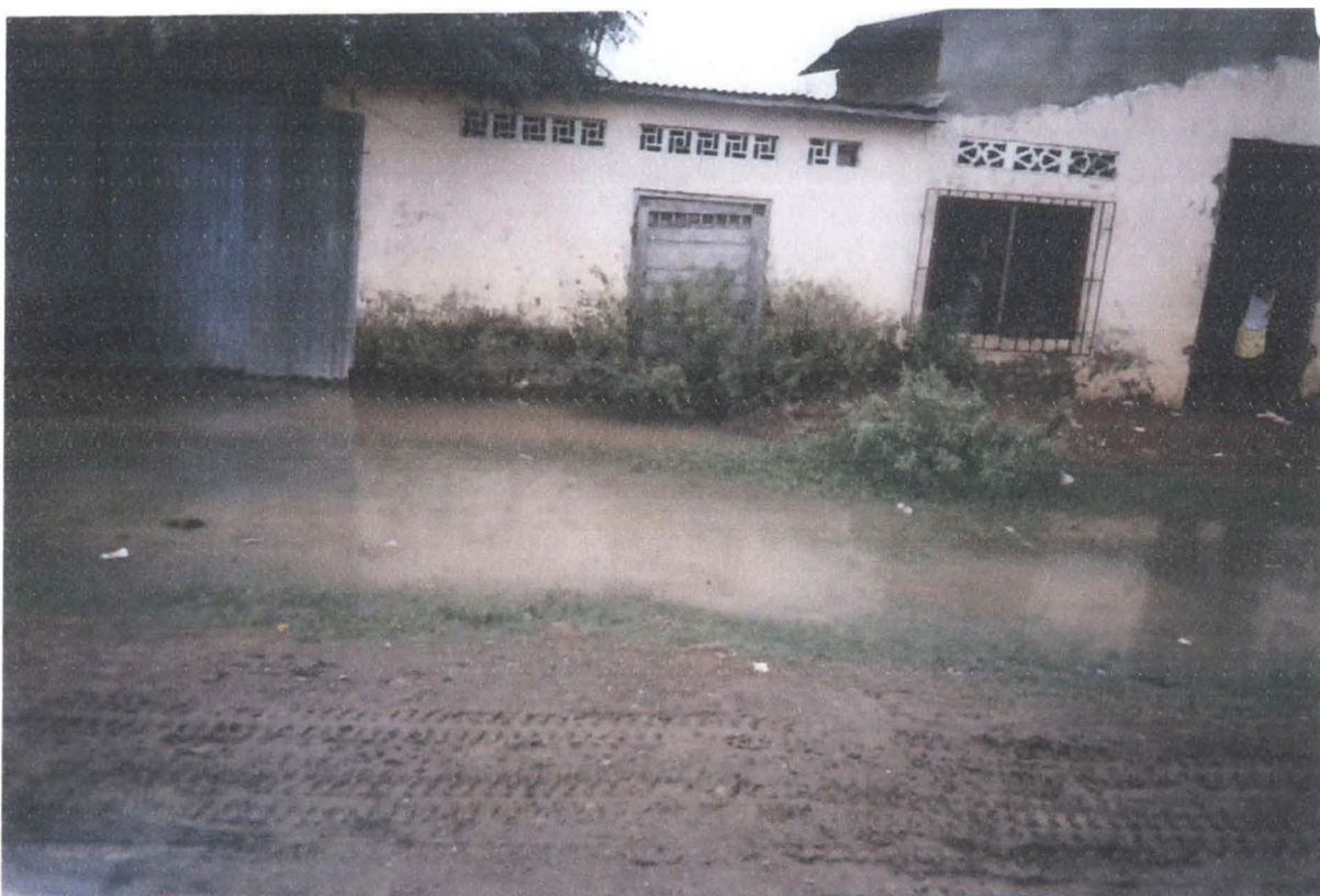
Camino al taller