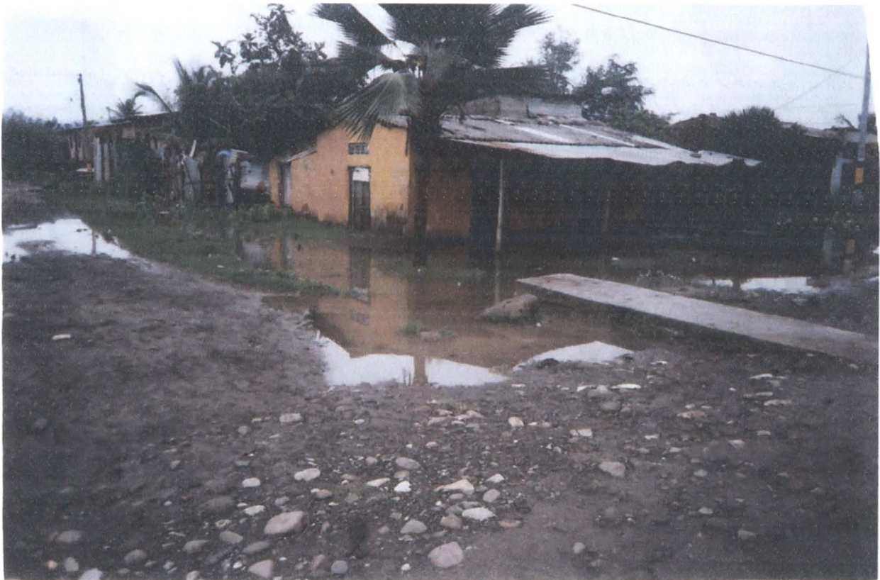
Calle de Turbo inundada

La region es de alta pluviosidad y suelen caer unos aguaceros muy fuertes y el taller se inunda, la calle que no es pavimentada se vuelve una laguna y luego un barrizal que hace difícil el acceso.