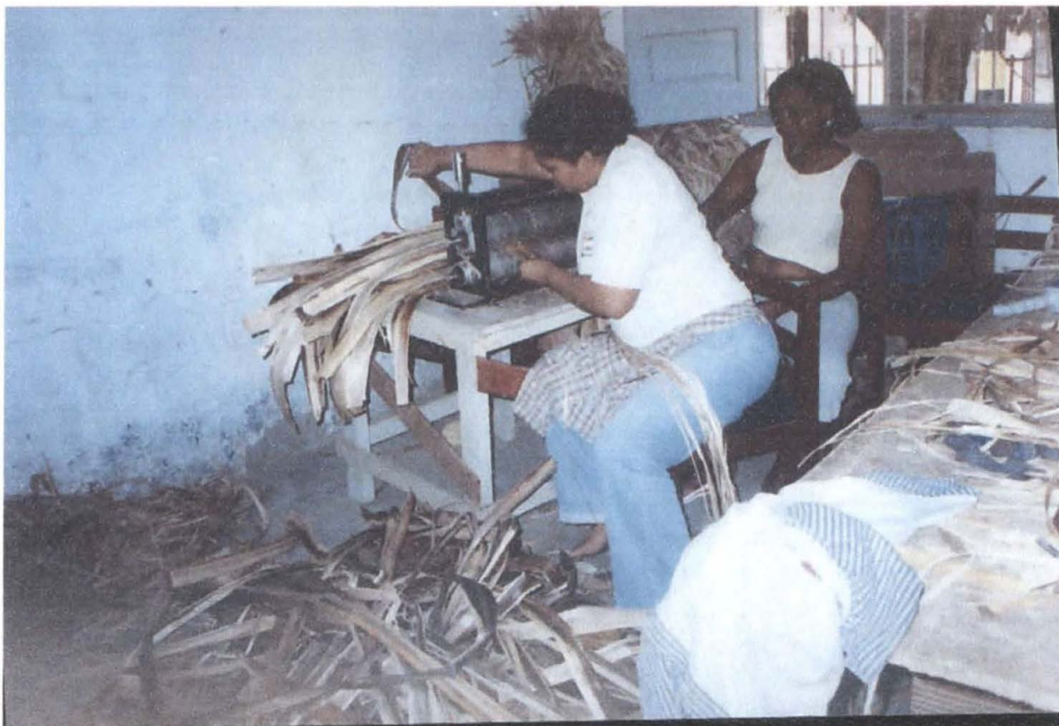
Artesanas laminando calceta.

En el momento de recibir el pedido, fecha el grupo no estaba completo ya que dos artesanas estaban en embarazo muy avanzado, cuatro se encontraban vendiendo chance y una consiguió un trabajo en Necoclí, debido a la situación económica que es bastante deprimente. Estas artesanas son cabeza de familia y tienen un promedio de 5 hijos cada una.