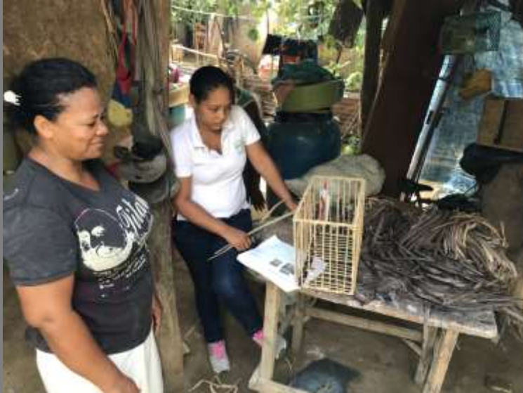
FOTO DEL ARTESANO