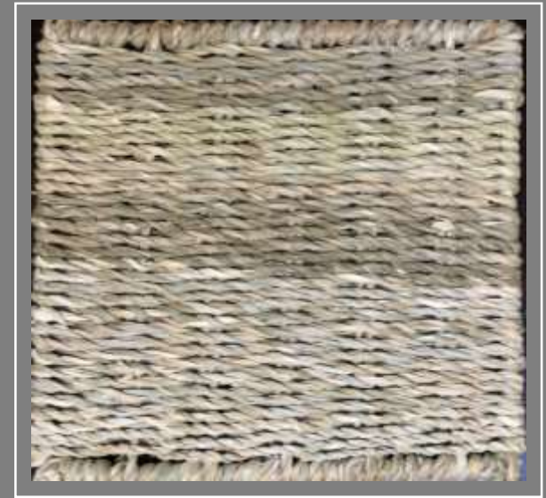
Paletas de color Pruebas de Texturas Jenny Gonzalez