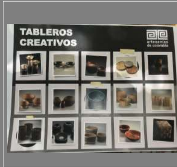
Actividad Texturas Jenny Gonzalez