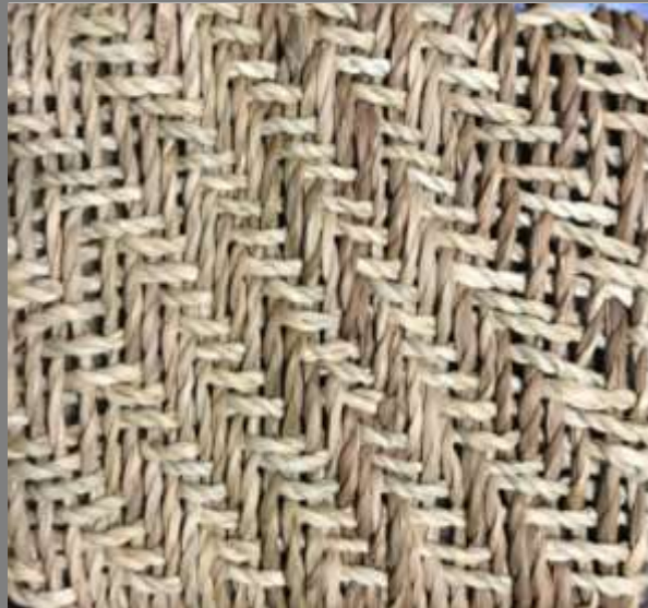
Paletas de color Pruebas de Texturas Delfina Salas