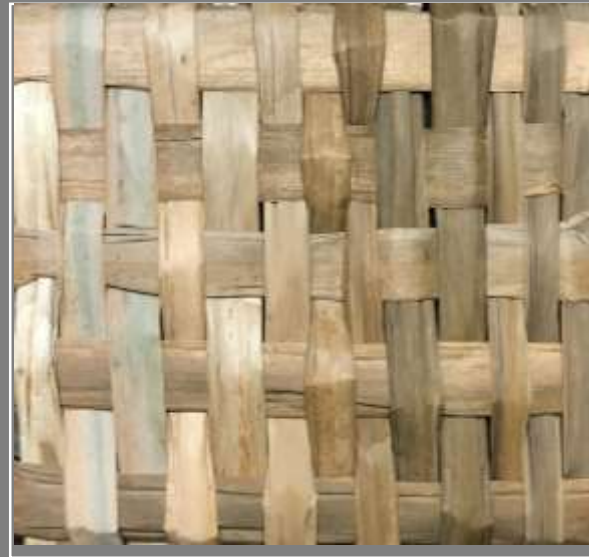
Paletas de color Pruebas de Texturas Delfina Salas