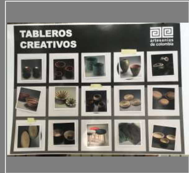
Actividad Texturas Delfina Salas