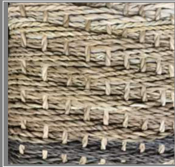
Paletas de color Pruebas de Texturas Jenny Gonzalez