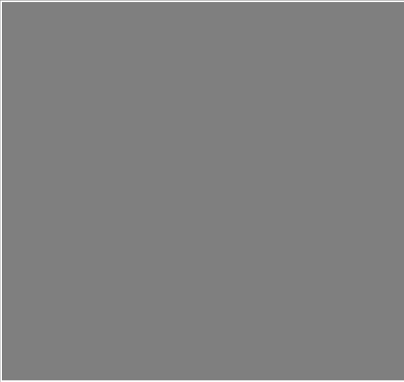
Paletas de color Pruebas de Texturas