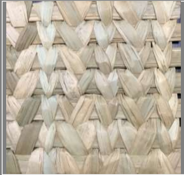
Paletas de color Pruebas de Texturas Jenny Gonzalez