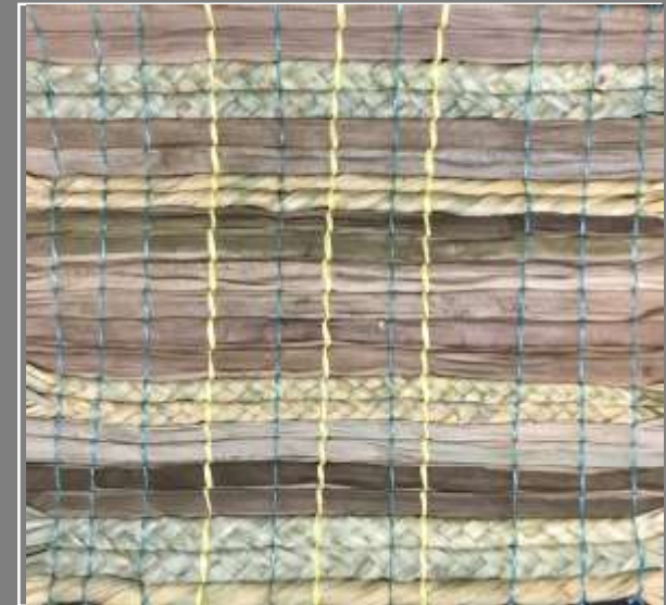
Paletas de color Pruebas de Texturas Delfina Salas