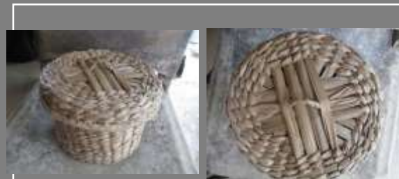
PRODUCTO FINAL CONTEXTO