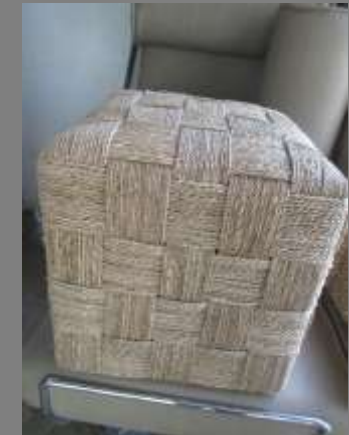
FOTOS DE LOS PRODUCTOS ACTUALES (PRIMERA/S VISITA/S) FOTOS DE LOS PRODUCTOS ASESORADOS (MUESTRAS, MODELOS,