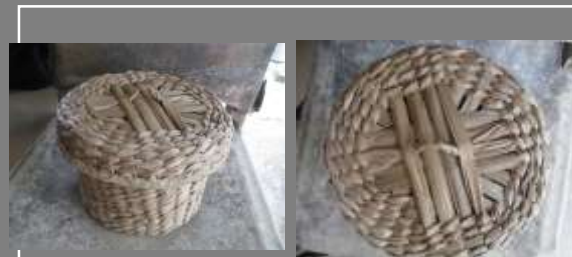
PRODUCTO FINAL CONTEXTO