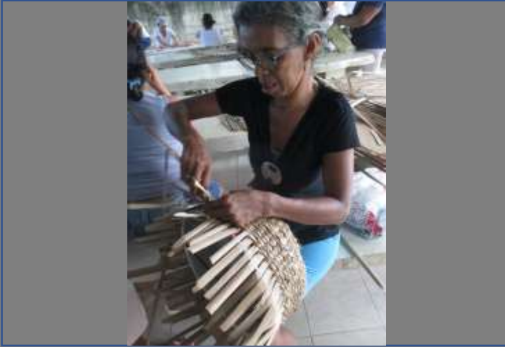
FOTO DEL ARTESANO