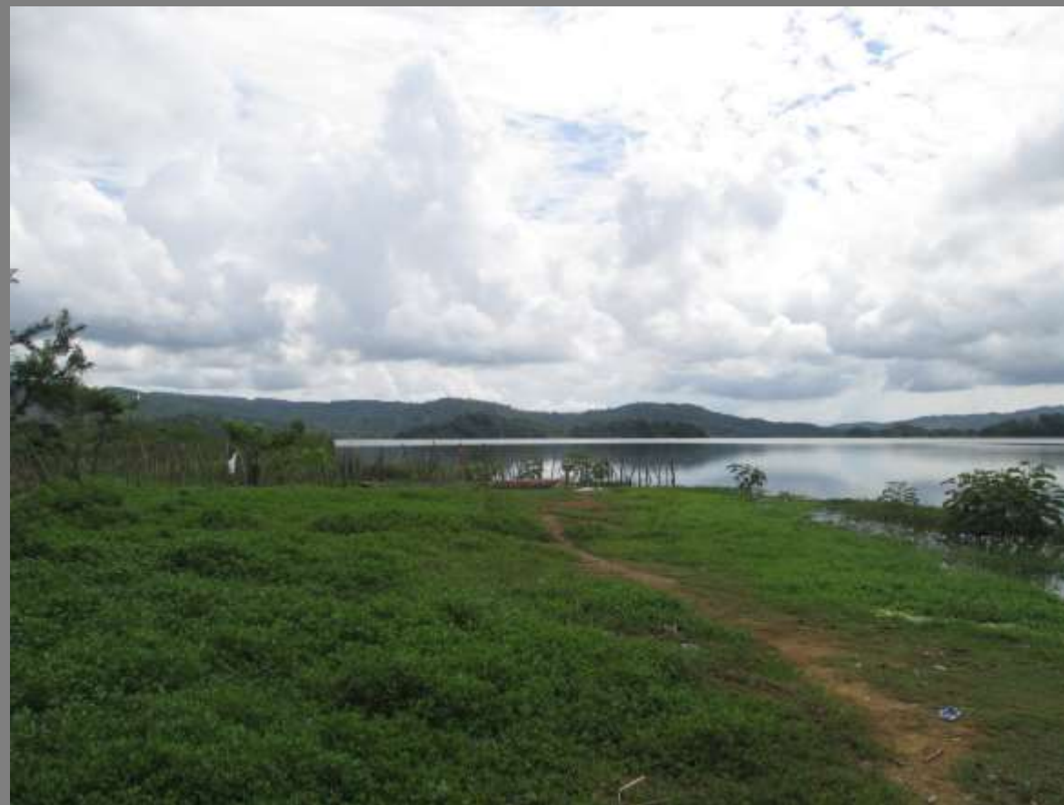
FOTO PLANO GENERAL DEL MUNICIPIO

La enea y el junco son plantas que crecen en áreas templadas subtropicales y tropicales, específicamente en humedales, lagunas, regiones pantanosas, canales de drenaje y riego, y en las cunetas de los caminos