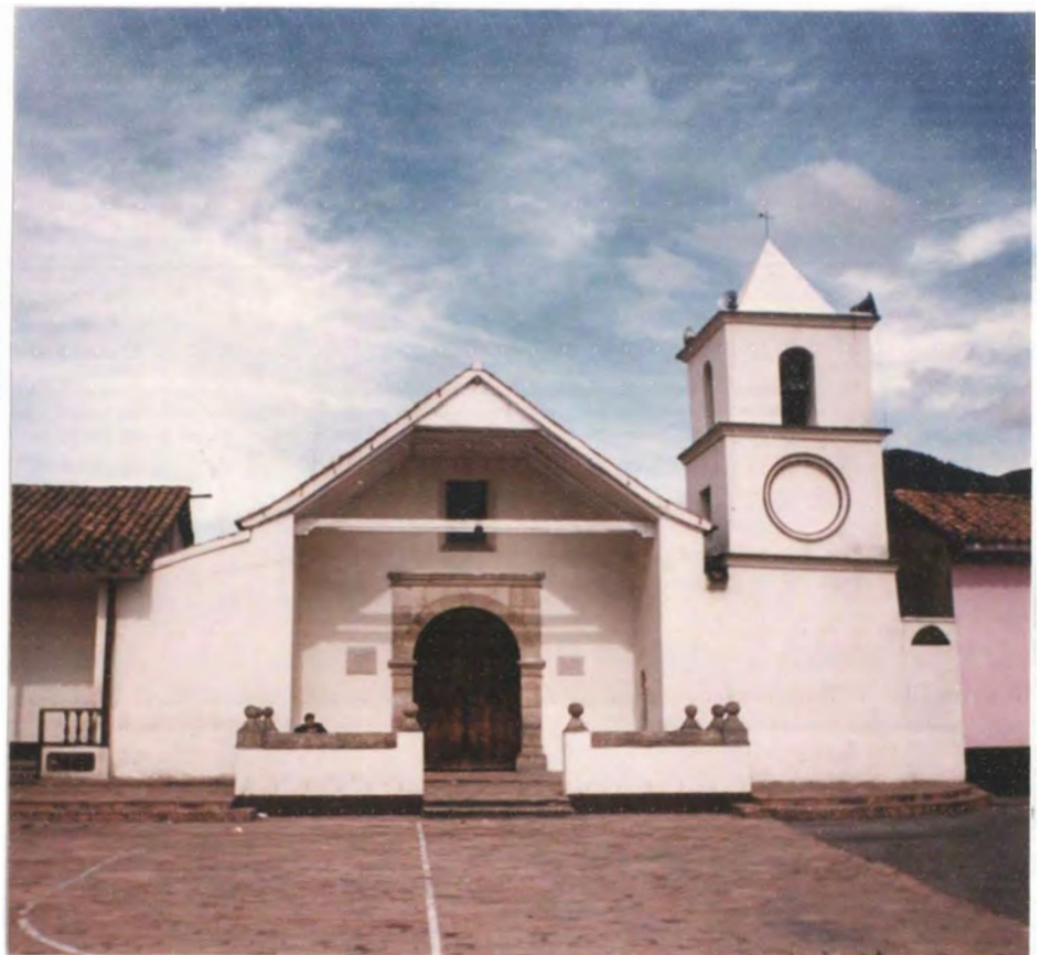
Iglesia de Tópaga, fundada en 1561 por Fray Pedro Durán y los indígenas. Es la única iglesia, con una que se encuentra en Francia, con la representación del diablo en su interior, esto con el fin de diferenciar el bien del mal.