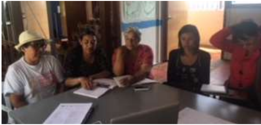
Taller del Municipio de Cota