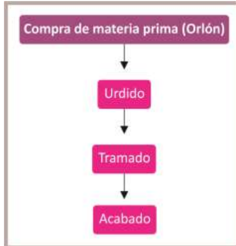
Proceso Productivo Tejeduría en Telar