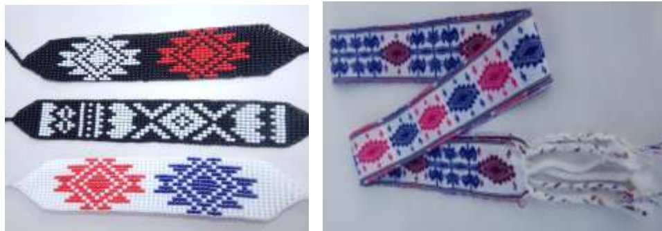
Manillas y accesorios. Elaborados en mostacilla y en lana