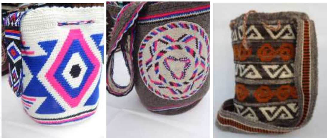
Mochilas Misak. (Productos elaborados en lana o hilo guajiro)