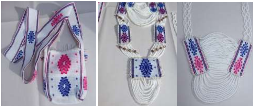
Mochila Misak y Accesorios. Elaborados en lana o hilo guajiro y mostacillas