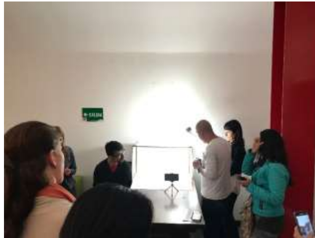
Taller de Fotografía – Sede de las Aguas Foto tomada por Lina Maria Rodríguez – Julio de 2017

Dentro del Programa Nacional de Asesorías Puntuales están definidos los cuatro ejes temáticos de fortalecimiento mencionados anteriormente, sin embargo en el programa se plantean algunas actividades complementarias de fortalecimiento en otras áreas que no se abordan durante el proceso de asesoría; por esto se planteó el desarrollo de un taller de fotografía donde los beneficiarios trabajaron conceptos básicos y herramientas de fácil aplicación para mejorar el registro fotográfico de sus productos. Mediante un taller teórico – práctico llevado a cabo en el mes de julio y desarrollado por Gustavo Chávez, se insistió en la importancia de mejorar el área de comunicación de producto para las estrategias de promoción y divulgación del taller.