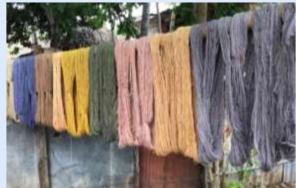
Tinturado de hilo – Morroa, Sucre