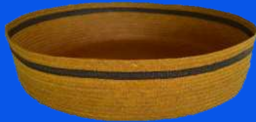
Producto diseñado en 2018- Palmito Sucre