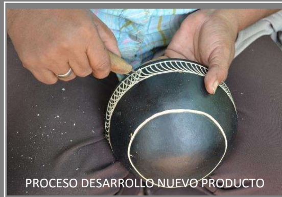
PROCESO DESARROLLO NUEVO PRODUCTO