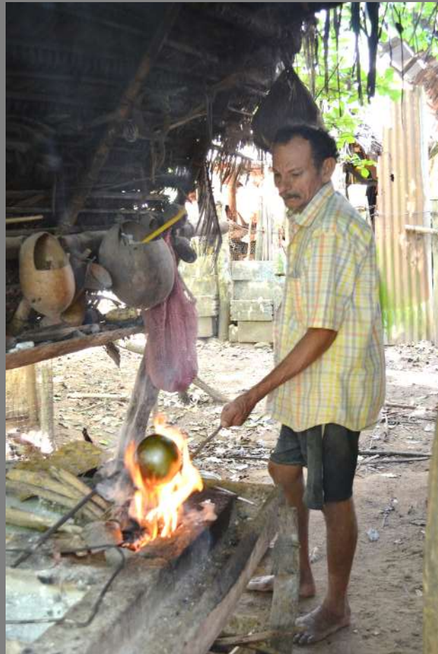
Se sostiene el totumo introduciéndole una varilla de acero