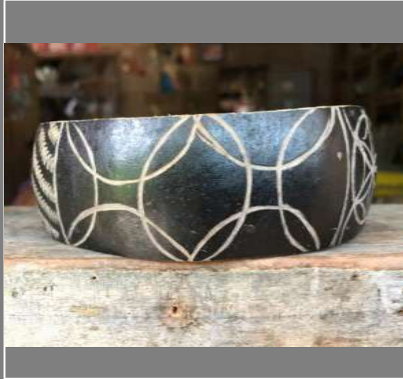
Ejemplos de Texturas 2