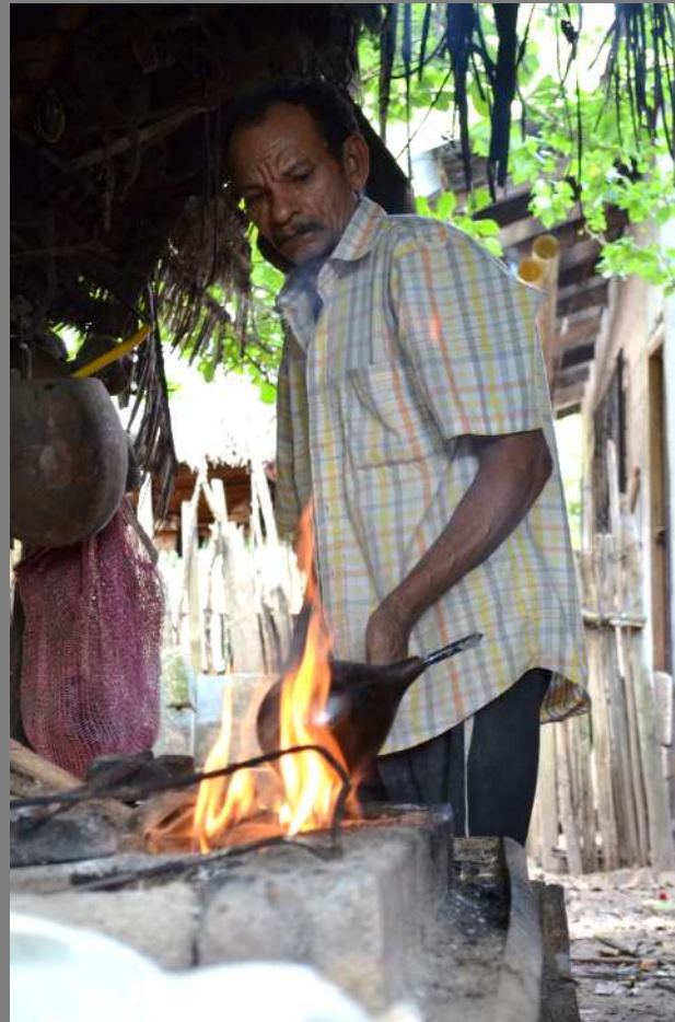
Se pone el totumo al fuego durante 10 minutos aproximadamente.