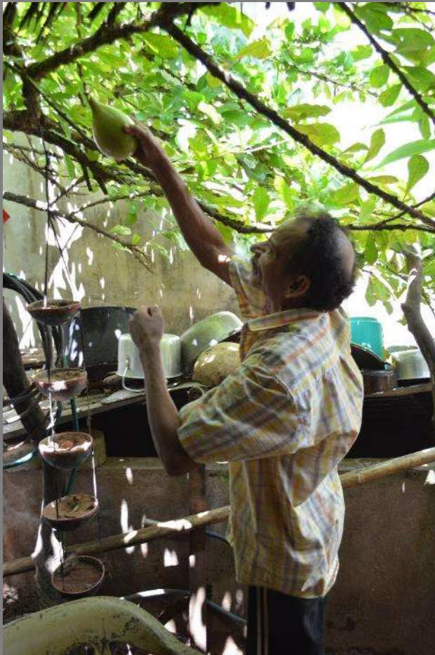
Extracción de la materia prima