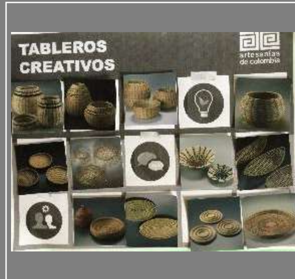
Imágenes Tableros (2)