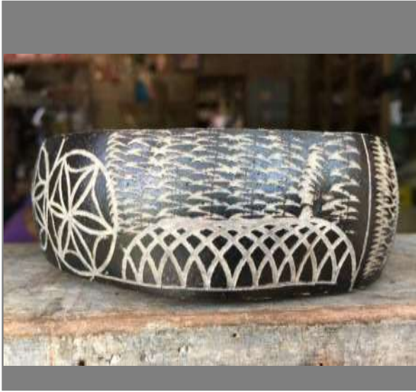
Ejemplos de Texturas 1