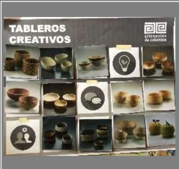
Imágenes Tableros (1)