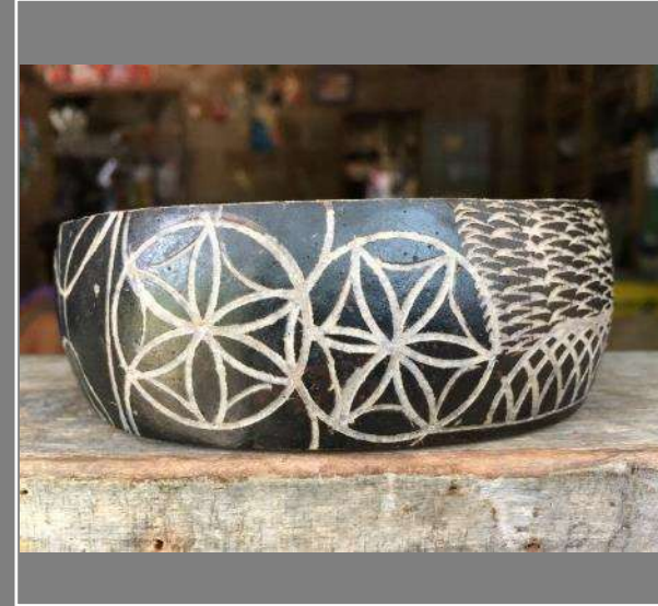
Ejemplos de Texturas 4