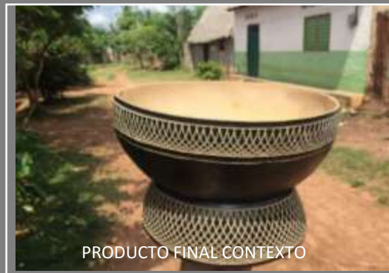
PRODUCTO FINAL CONTEXTO