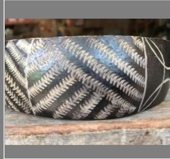
Ejemplos de Texturas 3