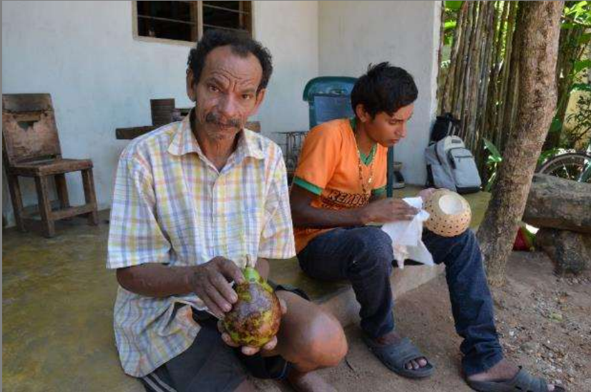
FOTO DEL ARTESANO