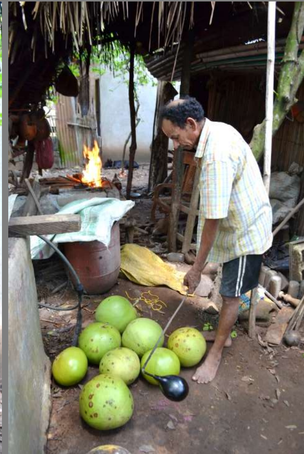
El totumo ya negreado esta listo para iniciar el proceso de secado.