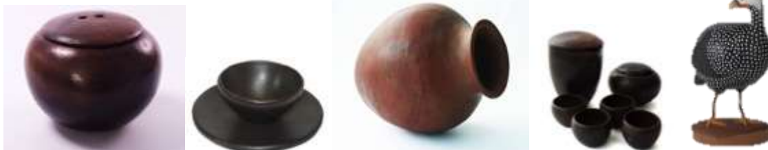
Descripción: Productos artesanales de San Sebastián (Lorica) Lugar: San Sebastián, Lorica, Córdoba, Colombia.