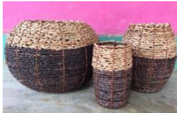
Descripción: Productos artesanales de Ayapel Lugar: Ayapel, Córdoba, Colombia.