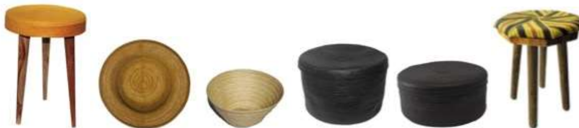
Descripción: Productos artesanales de San Andrés de Sotavento Lugar: San Andrés de Sotavento, Córdoba, Colombia.