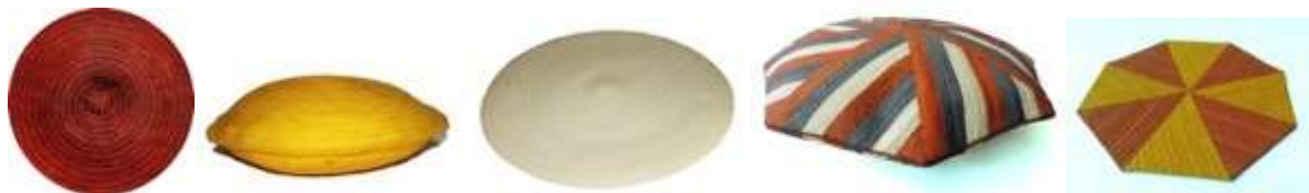
Descripción: Productos artesanales de Tuchín Lugar: Tuchín, Córdoba, Colombia.

En este sentido, la comunidad artesanal de Tuchín fue atendida por proyectos tales como “Fortalecimiento de la competitividad y el desarrollo de la actividad artesanal en el Departamento de Córdoba”, “OVOP – One Village, One Product” y “Pueblos indígenas de Colombia”. Además, varios grupos han trabajado para colecciones especiales de Artesanías de Colombia como Tradición y Evolución o Diseño Colombia.