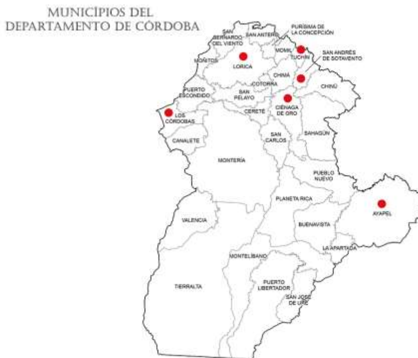
Mapa de los Municipios priorizados en la fase III (2018)

El proyecto se ejecutará en 6 municipios y 6 comunidades artesanales del Departamento de Córdoba, 2 de ellas indígenas y 4 campesinas o tradicionales.