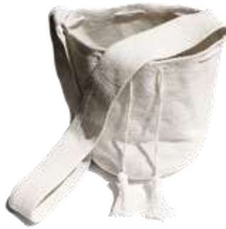
Mochila Tradicional Ette Ennaka, Elaborada en algodón Industrial 100%