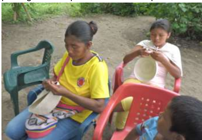
Artesanas del grupo Arte Chimila. Ette Butteriya. 2017

La institución etnoeducativa departamental Ette Ennaka anunció su interés en realizar talleres de capacitación a las niñas para instruir las en el tema del tejido de la mochila. Se espera contar con la presencia de las maestras artesanas que han sido identificadas en el programa de economías propias de artesanías de Colombia, para que hagan una réplica de los talleres para las niñas.