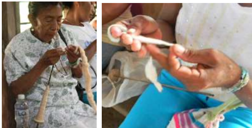
Mujeres artesanas de la comunidad-2016

Para efectos del programa, se localizaron en Issa Oristunna 15 mujeres artesanas y Ette Butteriya otras 15, en ambos grupos las mujeres están entre los rangos de edad de 20 a 60 años, lo que permite realizar procesos de transmisión de saberes. Estos grupos se dedican a hacer mochilas tejidas en algodón e hilo industrial.