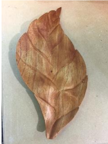
hoja tallada a mano por un interno de la Penitenciaría de la Picota , foto : Graciela García ,diciembre 2016.