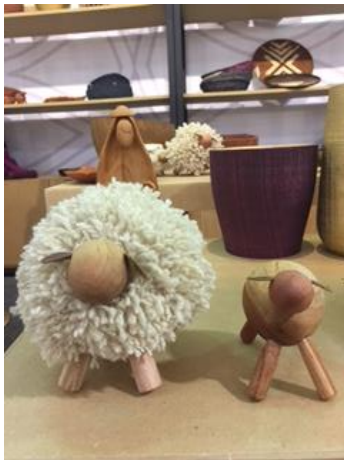
Ovejas torneadas en madera y Trabajadas en Lana Por dos internos De la Penitenciaría de la Picota . Foto: Graciela García , diciembre 2016