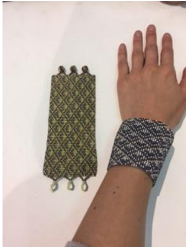
Pulseras tejidas en mostacilla por un interno De la penitenciaría de la Picota diciembre 2016.