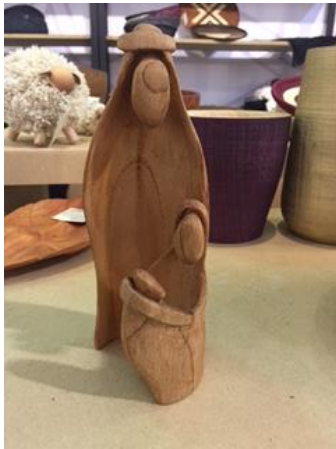
Pesebre tallado a mano por un interno de la Penitenciaría de la Picota , foto : Graciela García ,diciembre 2016.

Con el fin de apoyar el fortalecimiento de la actividad artesanal de la población interna en la penitenciaría se realizó un proceso de asesorías en la penitenciaría de la Picota en la ciudad de Bogotá. En primer lugar se desarrolló un diagnóstico de las diferentes actividades artesanales trabajadas en el complejo carcelario. En los patios visitados ( estructuras 1 , 2 y 3 ) se encontraron los oficios de trabajo en madera , tejeduría en arpa y marroquinería en orden respectivo además de otras técnicas de arte manual como tejeduría en mostacilla y tejeduría en crochet. Teniendo en cuenta que la técnica y los acabados de los productos son buenos se decide realizar asesorías en diseño. Para esto se desarrollan presentaciones de tendencias, de referentes, talleres de bocetos y ejercicios de experimentación dando como resultado los siguientes productos presentados a continuación.