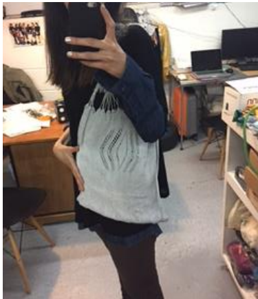
Mochila o shopping bag tejido por los internos De la penitenciaría de la Picota, diciembre 2016