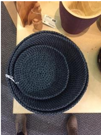
Juego de cestos tejidos en crochet por Un interno de la penitenciaría de la Picota. diciembre 2016.