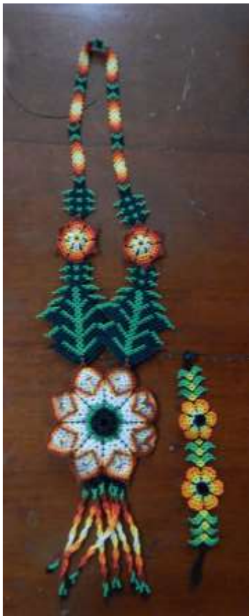
Collar de flor con manilla hechos en chaquira