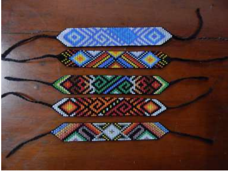
Manillas en chaquira