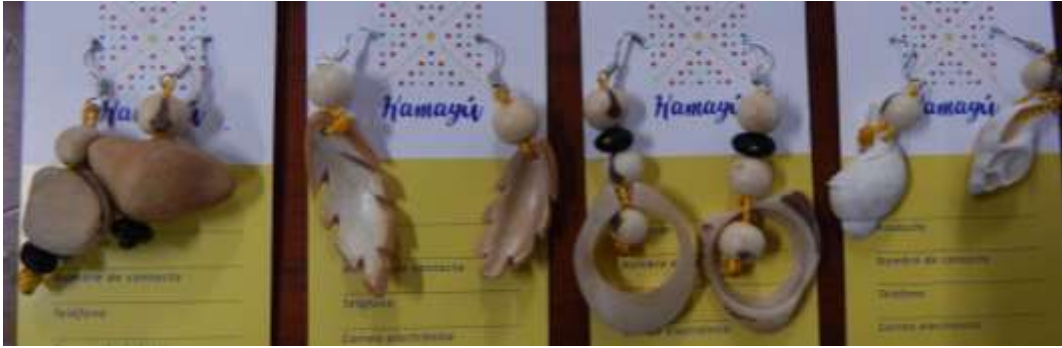
Pendientes hechos con técnica de bisutería