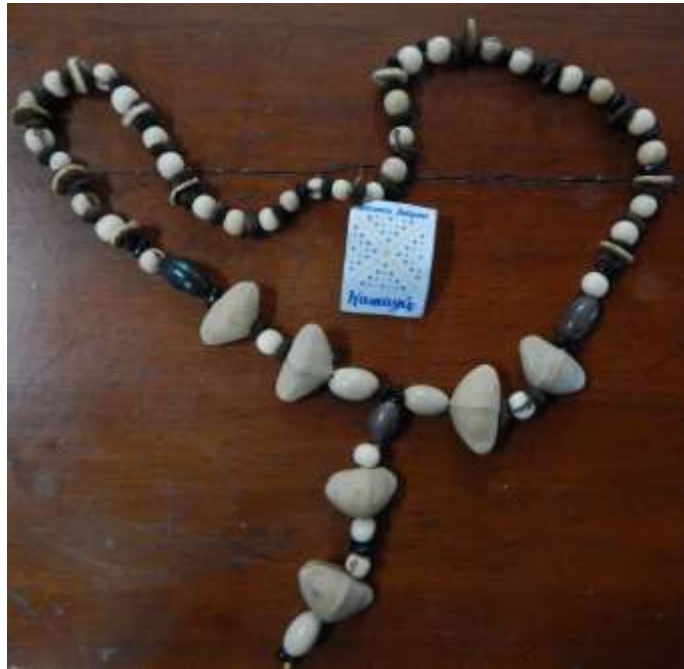
Collas elaborado en semillas con la técnica de bisutería.