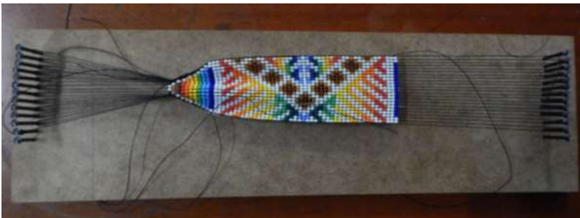
Telar de tejido en chaquira

La chaquira checa es la materia prima principal, desafortunadamente es foránea y su adquisición está supeditada a algunos distribuidores que venden por bolsitas, de la cual no se precisa la cantidad pero se estima en 15 gramos. Dado sea el caso se presenta una producción mayor, los artesanos se dirigen a Pasto donde compran 1 libra a un precio de venta de $30.000COP a $32.000 COP, cada libra contiene 35 cucharaditas, que es la medida en común que emplean los artesanos y artesanas.