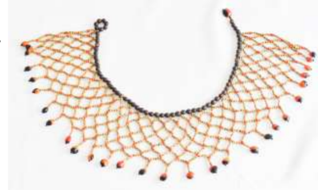
COLLAR TIPO PECTORAL Semillas de Sirindango y chochos. 10 gr.