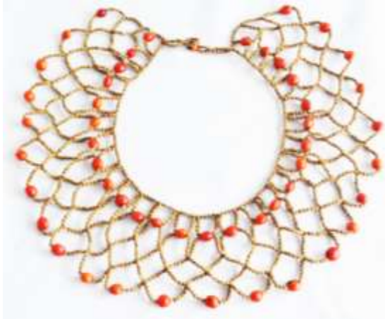
COLLAR TIPO PECTORAL Semillas de Sirindango y chochos. 8 gr.