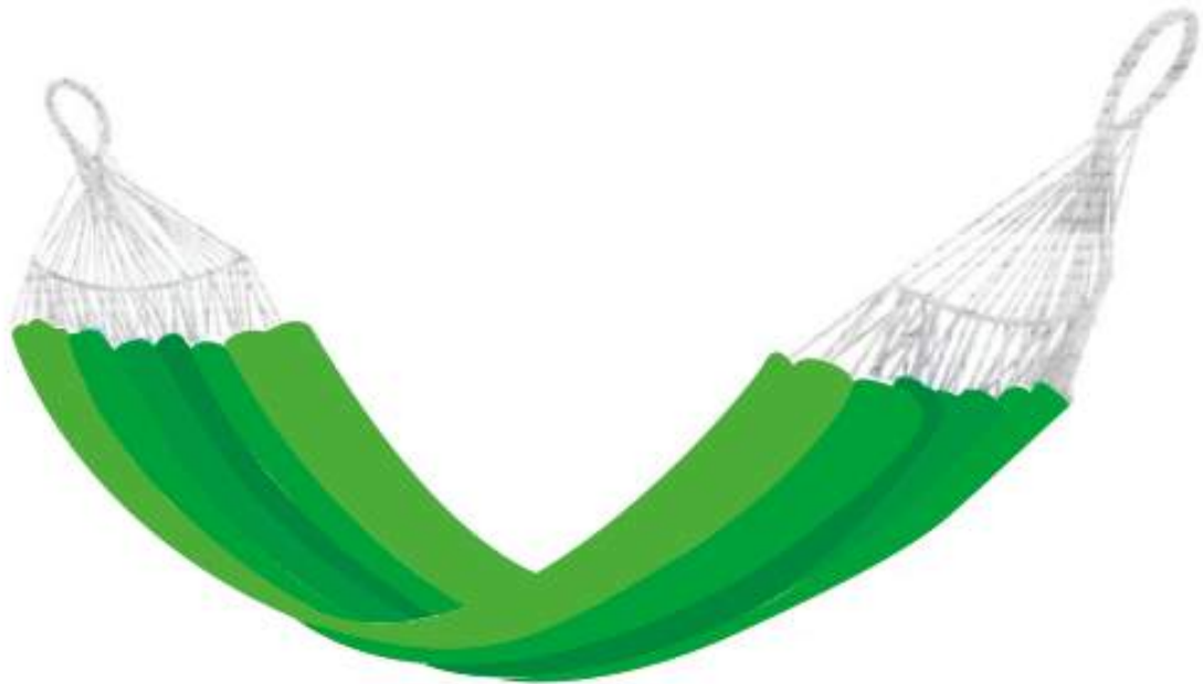
Paleta de Color