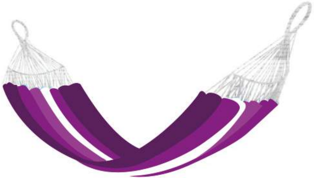
Paleta de Color