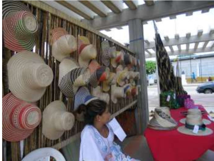
Festival de la Cultura Wayuu- Uribía 2017 CORWAS- Comunidad Siapana

Si bien, las mujeres que hacen parte de esta Cooperativa, son mujeres con buena disposición para aprender y tiene la voluntad de hacer esfuerzos para alcanzar su último fin, saben que tiene aspectos en los que deben trabajar para poder fortalecerse como cooperativa y hacer de esta opción de vida algo sostenible en el tiempo, por lo que buscan apoyo en la orientación y fortalecimiento de la Cooperativa como empresa social, económica y democrática en su proceso de autogestión. Buscan educar a la comunidad Cooperativa en filosofía, valores y principios cooperativos. Necesitan apoyo en la orientación de los mecanismos de la autogestión democrática entre sus asociados. Solicitan capacitación y acompañamiento a los integrantes de los órganos administrativos en la gestión económica de la Cooperativa. Igualmente quieren ser capaces de identificar los factores y valores culturales propios de la comunidad que coadyuven al fortalecimiento del quehacer cooperativo. Por último, buscan acompañamiento el diseño del Plan de Desarrollo Estratégico de la Cooperativa a los próximos 5 años, que apunten al cumplimiento de su objeto social.