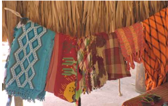
6 Clases de chinchorro diferentes. Siapana. 2017

dispendioso realizarlo. Cada chinchorro se usa en una ocasión distinta. También depende de la edad de la mujer artesana y su grado de experticia. Se empieza por el reciclado, luego en el encierro y al salir se aprenden los más complejos que se tejerán al momento de formar una familia.