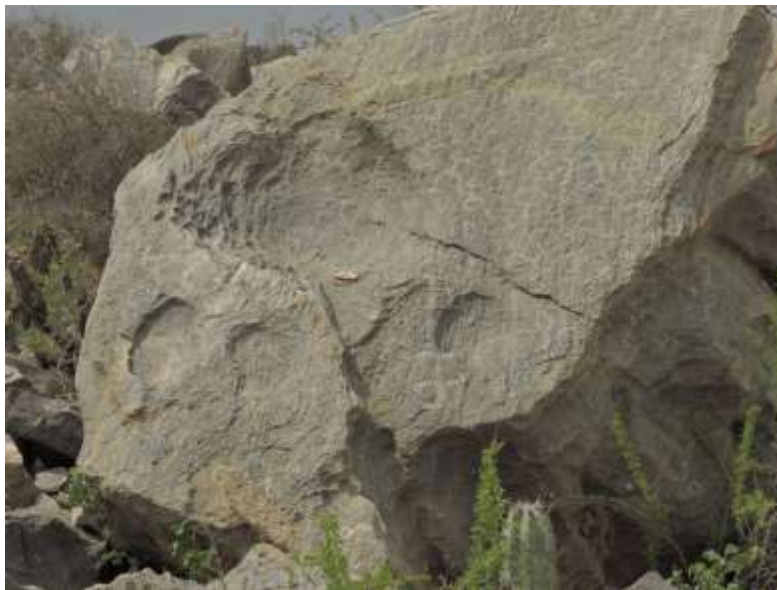
Piedra de las castas, Siapana. Alta Guajira. 2017

La comunidad de Siapana, está ubicada en el Resguardo de la Alta y Media Guajira, a seis horas de Uribía en temporada seca y a cuatro horas tomando la carretera por Venezuela saliendo de Maicao, la cual se encuentra en mejores condiciones. Ahora bien, el acceso es casi imposible en época de lluvias ya que no cuenta con vías de acceso pavimentadas, se transita a través de un camino de trocha en medio del desierto donde sólo camionetas 4x4, camiones, motocicletas y burros pueden transitar cuando las condiciones lo permiten. De Uribía a Riohacha el tiempo estimado de viaje es 1 hora y 30 minutos y el valor del pasaje es 15.000 .