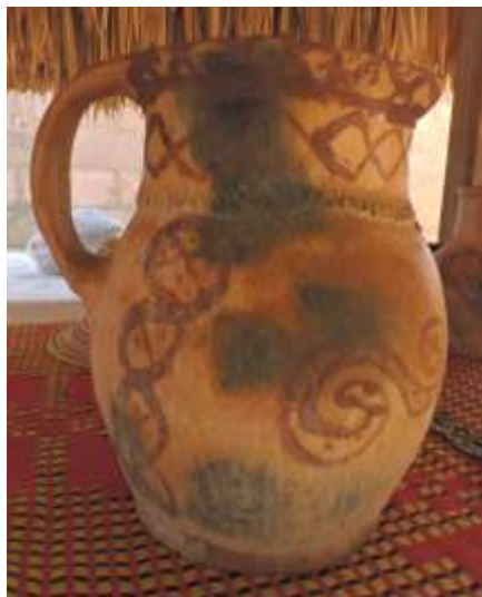
Cerámica tradicional. Siapana 2017

El caso de la cerámica es un poco crítico por que se ha perdido el conocimiento de las artesanas, incluyendo las vetas de arcilla de mejor calidad y su correcto cocimiento. Actualmente se está pensando en recuperar este conocimiento pues en Siapana aún existe una abuela que posee la técnica. Estas cerámicas eran utilizadas para almacenar agua, e incluso se comenta que resisten muy bien el fuego por lo que es posible cocinar en ellas.