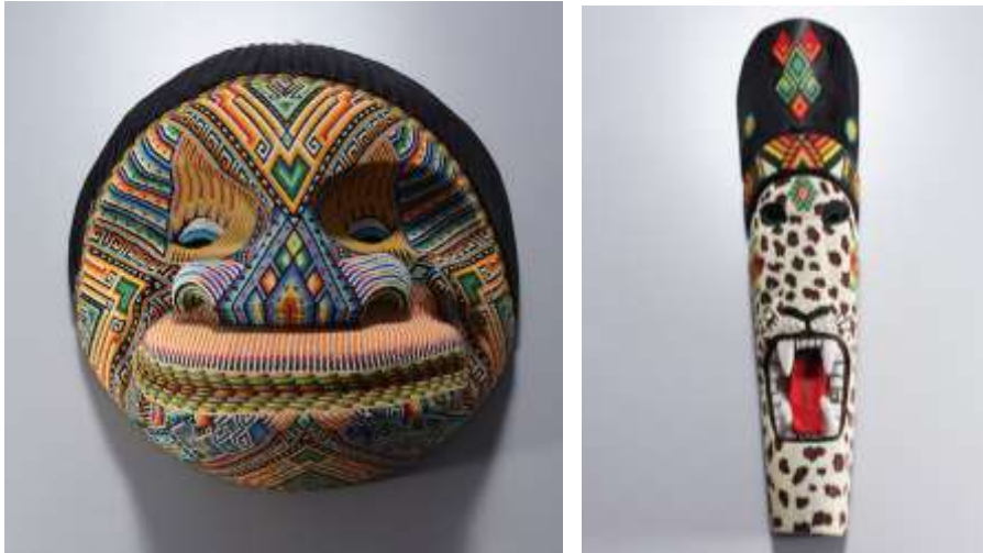
Mascaras gran formato con enchape en chaquira