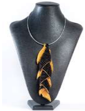
Collar en chaquira con herraje metálico