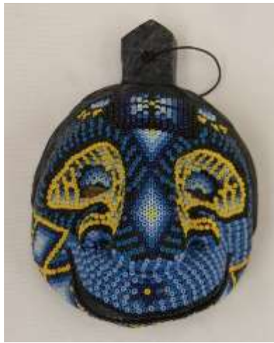
Mascaras para colgar y mesa con enchape en chaquira