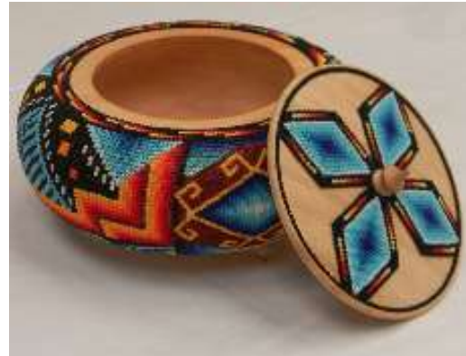
Contenedores en madera con enchape en chaquira