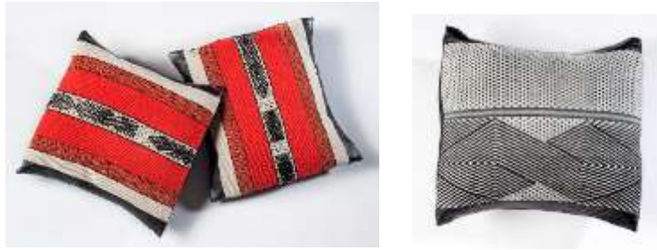
Cojines con cuero y tejido en guanga