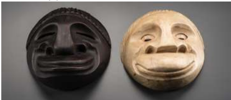
Mascaras talladas en crudo