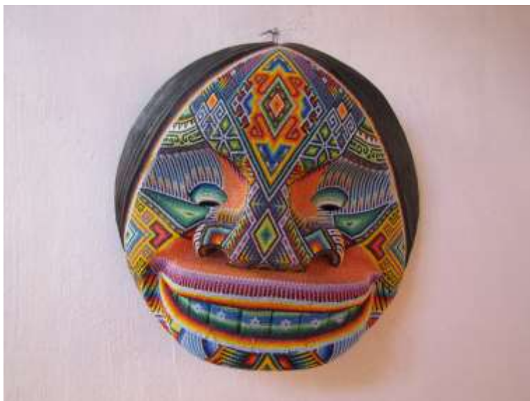
Mascara de representación chamánica femenina elaborada por Arte Mumtbajoy, 2016