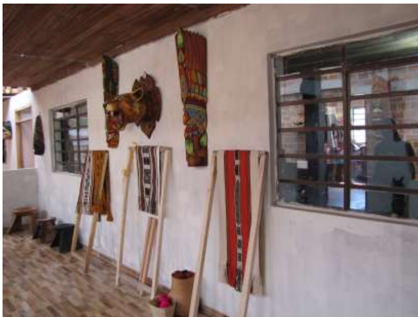
Taller de la pareja Mutumbajoy, finca Paraíso, Vereda Santa Elena, Municipio de Sanjuna de Pasto, 2016

Concretamente, en la vereda Santa Elena viven 19 integrantes mientras que en el casco urbano de San Juan de Pasto viven otros 4, mientras que dispersos en municipios de Putumayo como San Francisco o Sibundoy viven alrededor de unas 38 personas que trabajan con la fundación. En total son 61 integrantes que laboran de manera fija con la organización, sin embargo, hay un número de personas no determinado que colabora con la producción en momentos en que los pedidos rebasan la capacidad de la mano de obra fija. Sí se tiene en cuenta únicamente aquellos que están integrados de manera directa a la fundación el número de familias beneficiadas por esta organización circunda las 48, un número alto contemplando el hecho de que casi siempre hay un solo integrante por familia, que por iniciativa propia acude a la fundación. Por otro lado hay que mencionar que el número de familias beneficiadas puede ser más si se tienen en cuenta las épocas en que se necesita una mano de obra mayor.