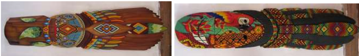
Mascaras de representación chamánicas elaboradas por Arte Mutumbajoy, 2016.

generación de redes de artesanos de todo el país para apoyarlos y capacitarlos en la construcción de empresa artesanal.