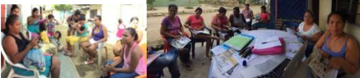
Artesanas en actividades de los talleres. Cantaclaro y La Palma, Montería Córdoba.

En el taller de Identificación de Referentes se realizó una presentación explicando el trabajo referentes como modelos para generar nuevos diseños. Se realizó un taller para explorar patrones con apoyo de revistas y materiales para realizar una lluvia de ideas. Por último se desarrolló la ficha de inventarios.