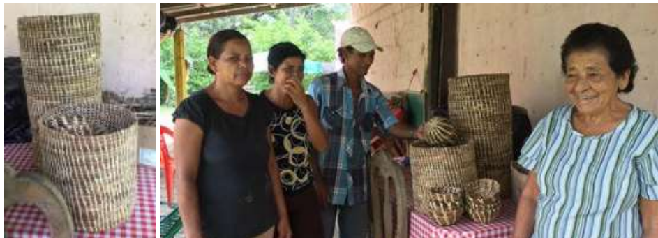
Arterasnas en entrega productos para la feria. El Sabanal, Montería Córdoba Tomada por: Daniela Bucheli.2016