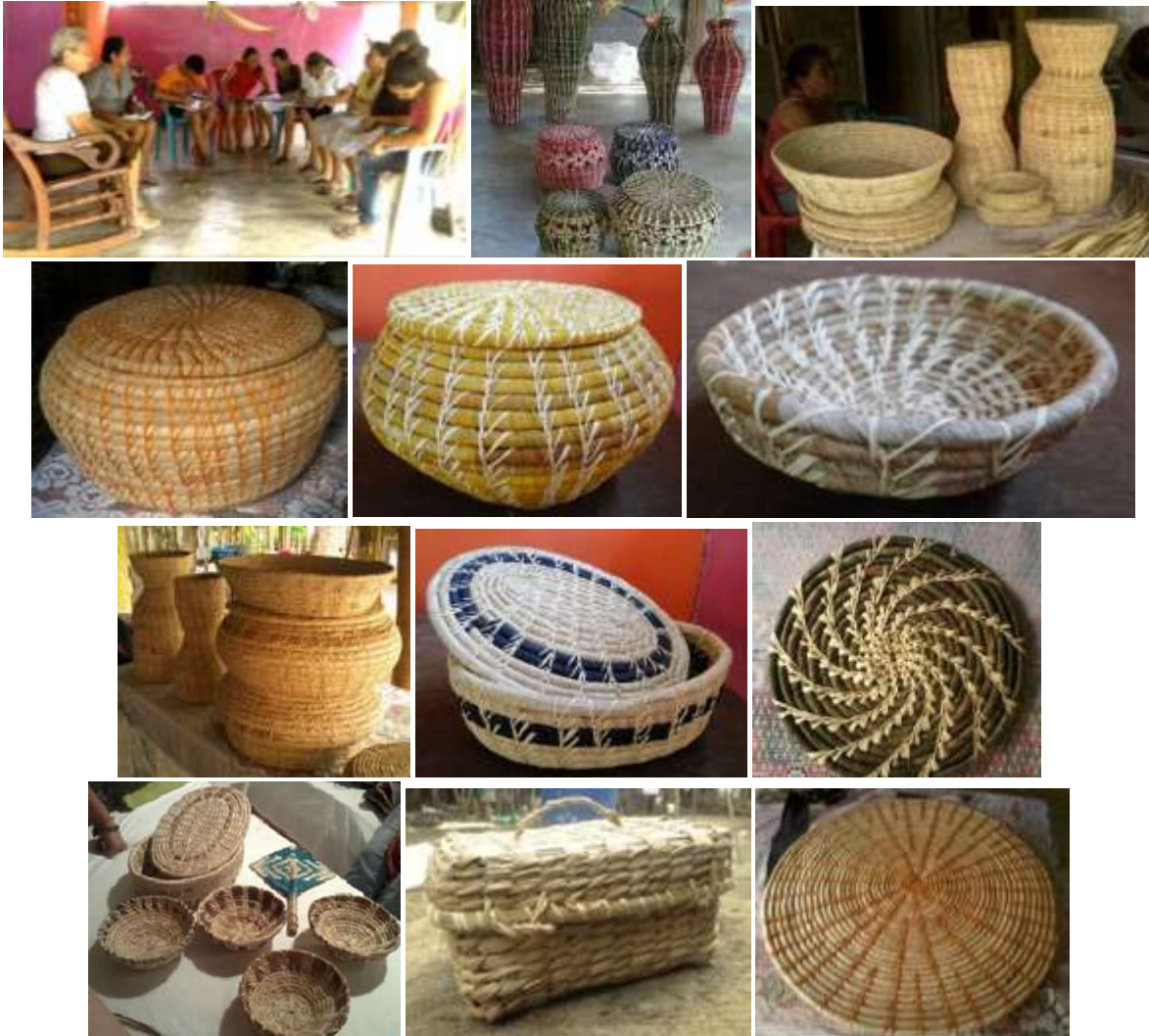
Reunión con artesanas y productos de la comunidad de Rabolargo. / Diciembre de 2015.