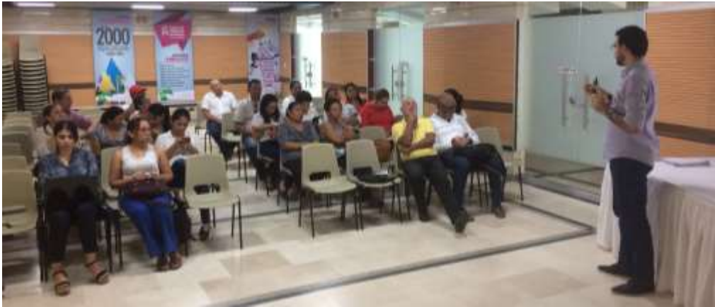
Descripción: Mesas de trabajo proyectos 2017, 24 de noviembre de 2016. Lugar: Centro de Eventos de la Cámara de Comercio, Montería (Córdoba), Colombia.

Se presentó la metodología y el formato de trabajo a utilizar basado en la matriz de componentes, sobre el cual se definen las actividades a realizar por módulos y se consultó a los representantes de las entidades sobre sus posibles aportes. Se hicieron propuestas y sugerencias de cómo hacerlo de manera distinta.