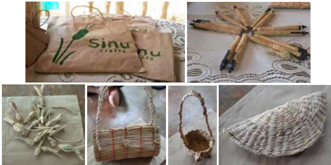
Talleres. San Nicolás de Bari. Loricá. Mayo de 2016.

Transferencia tecnológica. El grupo es completamente productivo pero se especializa en piezas pequeñas, especiales para souvenir por lo cual se les realizó transferencia de telares para la elaboración de piezas más grandes.