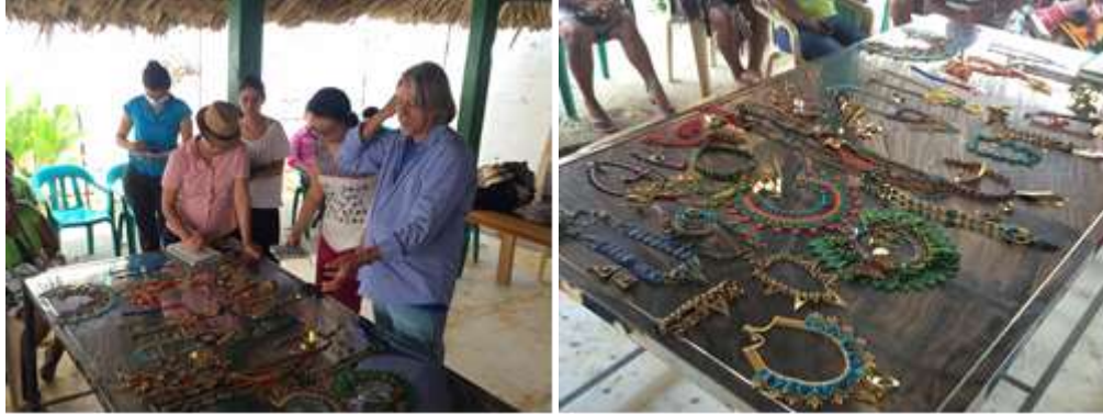
Descripción: Revisión de productos artesanales. Lugar: Sede Asociación Ebera Neka, Tierralta, Córdoba, Colombia

de los colores, los referentes, y la mezcla equilibrada de diferentes técnicas, elementos metálicos, y proporciones.