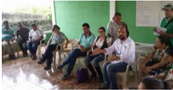
Reunión de articulación con artesanos del Movimiento OVOP. Tuchín, Córdoba