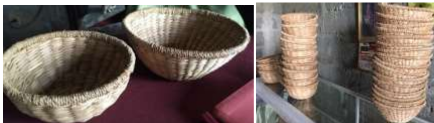
Asesorías puntuales y revisión de productos. La Palma, Montería Córdoba Tomada por: Daniela Bucheli 2016