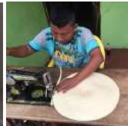
Reunión con las señoras de ASUMAPAR. Tuchín, Córdoba.

Se verificó tanto acabados como cantidades de producto con el taller en Tuchín, revisando las muestras y haciendo los correctivos correspondientes para lograr las metas