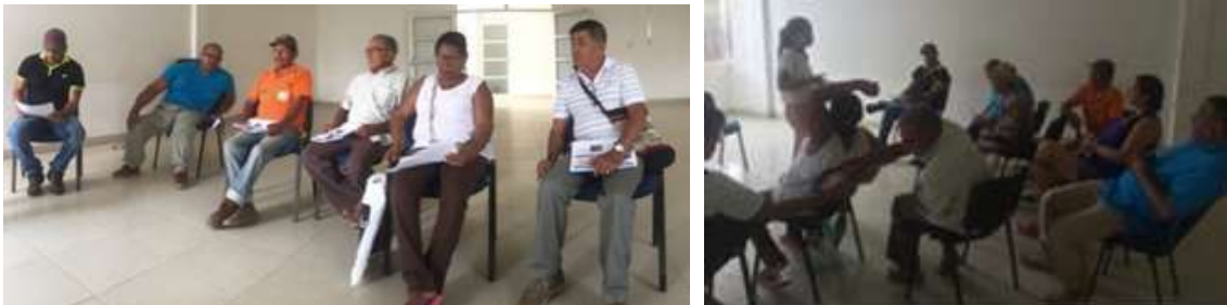
Artesanos nuevos en Buenavista. Febrero 2016

generación de ingresos, con las técnicas de calado y ensamble, utilizando como materia prima el totumo. Se conformaron dos grupos participantes uno en la zona urbana y otro en la zona rural, vereda Polonia. En este último grupo se contó con la participación de aproximadamente 15 personas, quienes desarrollan su actividad artesanal con elementos como el totumo y se destacan por su calidad. Se evidenció una tendencia en la participación de los talleres, con mayor incidencia por parte de las mujeres, el nivel educativo presente en este grupo es la secundaria incompleta, la edad de los participantes oscilan entre los 25 y los 40 años. La actividad principal de la zona es la agricultura y la ganadería.