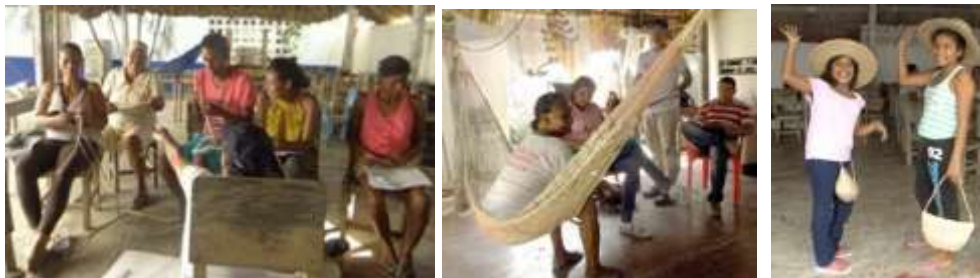
Talleres. San Nicolás de Bari. Loricá. Enero de 2016.

El taller de Reconocimiento de la identidad se desarrolló dividido en pequeños grupos con participantes de niveles de escolaridad similares. Se desarrollaron los conceptos de cada componente de un producto artesanal como: Identidad, cultura material, origen, relación con el entorno, relación de uso, función, diseño e Innovación, oficio-técnica, producción gráfica, empaque y precio vs. valor percibido.