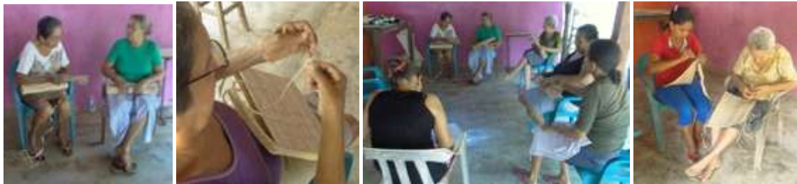
Talleres de producción. Rabolargo. Junio 2015.

Se realizaron los talleres de mejoramiento de técnicas incluidos en la matriz del módulo de producción. Con ayuda de los telares, la puntada mejoro mucho y la calidad es óptima. La transferencia tecnológica se realizó con una capacitación en el uso del telar plano para realizar piezas de formato cuadrado.