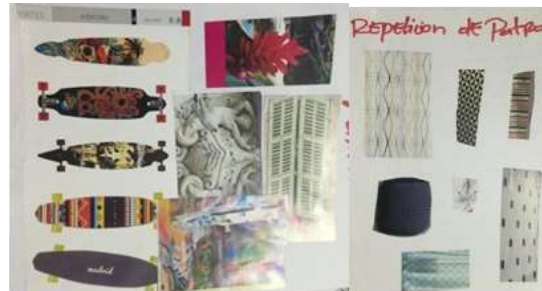
Ejercicio de patrones en tendencias. Buenavista, Vereda Polonia, Córdoba

Para el taller de tendencias se realizó una presentación y la exploración de conceptos basados en tendencias actuales. Con ayuda de revistas y cartulinas los artesanos realizaron mapas conceptuales y collage definiendo una tendencia