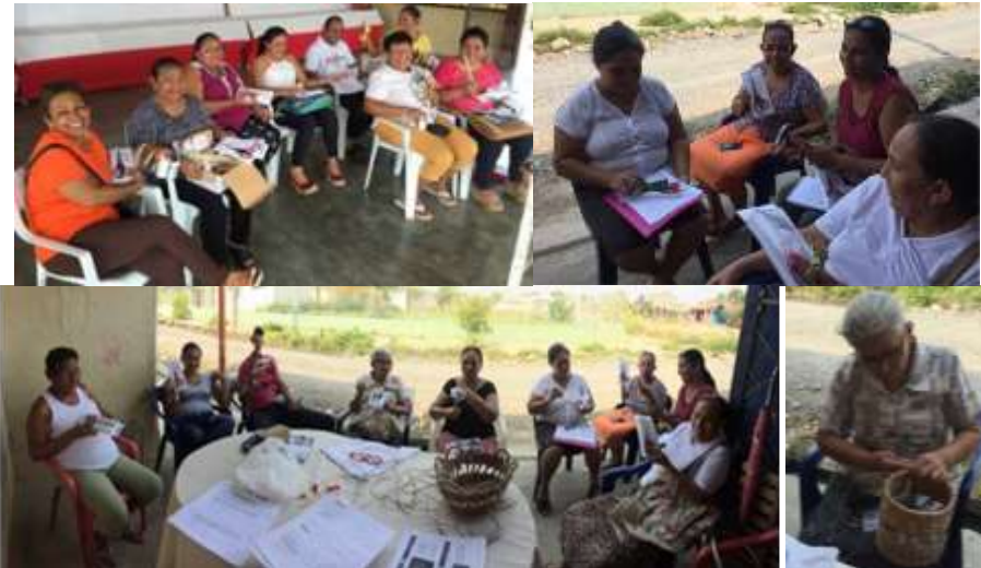
Arterasnas recibiendo herramientas básicas - La Palma, Montería Córdoba Tomada por: Daniela Bucheli / Marzo de 2016

Se hizo entrega al grupo de la Palma algunas herramientas básicas como tijeras, cintas métricas, agujas.