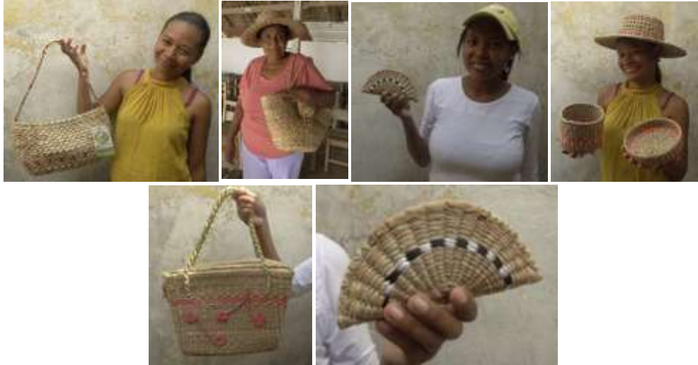
Piezas encontradas. San Nicolás de Bari. Loricá. Diciembre de 2015.

En el corregimiento de San Nicolás de Bari se encontró una comunidad que trabaja la cestería en enea con amarre en telar vertical.