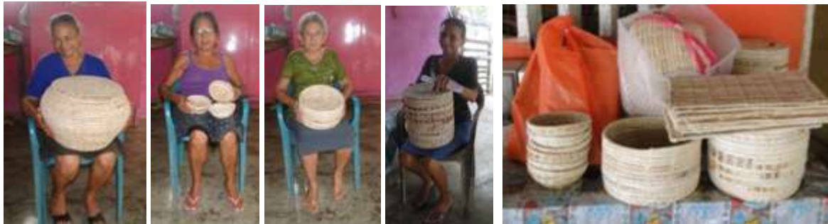
Primeras muestras. Rabolargo, Cerete. Marzo de 2016.

A la comunidad de Rabolargo se le hizo entrega de telares planos de mesa; la matriz de diseño para fue la misma utilizada en diciembre 2015 para los productos a llevar a Expoartesano, con una colección similar con productos mejorados, redondo, cocido en espiral y color natural blanco y se recibieron los prototipos previamente encargados como culminación de los talleres de la fase inicial del proyecto. La producción se centró en la producción de individuales, canastos y porta cazuelas.