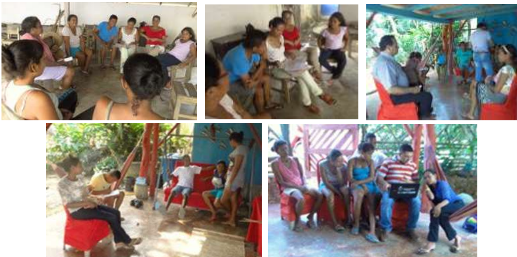
Talleres. San Nicolás de Bari. Loricá. Marzo de 2016.

Se realizó un Taller mejoramiento técnicas procurando que fueran entendidos por todos los participantes, la metodología empleada fue sencilla y clara con el tiempo necesario para lograr las metas.