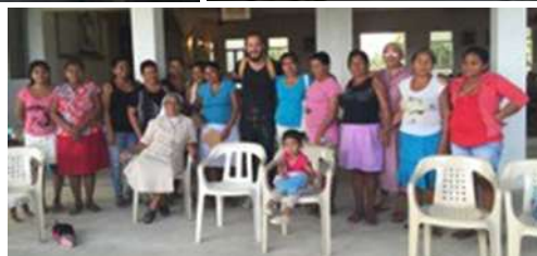
Talleres con las señoras de ASUMAPAR, con Coopcañaflécha y con el grupo de Rodrigo Lazaro. Tuchín, Córdoba.

En la comunidad de La Esmeralda participaron en conjunto los dos grupos de artesanos (Coopcañaflécha y el grupo de Rodrigo Lázaro) en los talleres de Sensibilización al producto artesanal, tocando temas como el de “producto línea y colección”. Esta