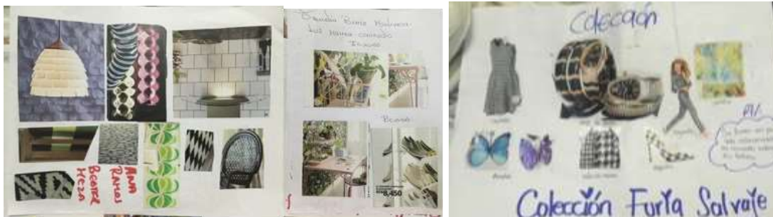
Talleres de Tendencias en la Palma y Sabanal, Montería Córdoba. Tomada por: Daniela Bucheli / Febrero 2016

Para el taller de tendencias se desarrolló el concepto de Tendencia, se explicaron sus ciclos históricos, la metodologías para construirlas, sus fuentes y quien las crea, y otros aspectos que relacionados. Se expusieron casos de aplicación de tendencias en la artesanía por categorías de productos. Se hicieron ejercicios en donde los artesanos exploraron la búsqueda de patrones y realizaron una colección de moda por medio de tendencias, todo esto con ayuda de revistas, tijeras y cartulinas.