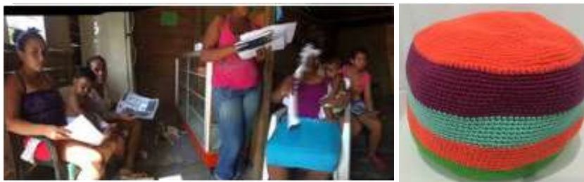
Descripción: Artesanas de Cantaclaro y muestras experimentales - Cantaclaro, Montería Córdoba Tomada por: Daniela Bucheli / Marzo 2016