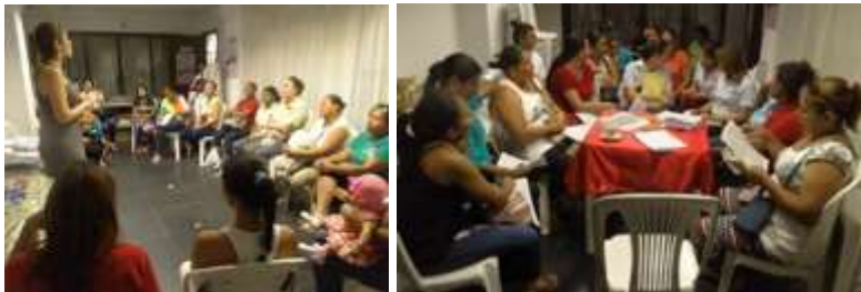
Grupo de mujeres artesanas en talleres de producción. Cereté / Enero 2016.

En la cabecera municipal de Cereté, el grupo de mujeres que trabajan con la empresa record (apuestas de chance) que elaboran bisutería con chaquiras se puede considerar experto y disciplinado, con una gran capacidad de producción y de aprendizaje; estas mujeres están dispuestas al cambio.