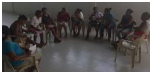
Taller con las señoras de ASUMAPAR. Tuchín, Córdoba.

Se trabajó en la capacidad y calidad del producto trabajado, y se hizo énfasis en los acabados naturales y tinturados tradicionales, a fin de garantizar un producto 100 % artesanal.