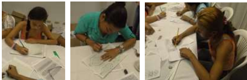
Taller Crecer. Cerete. Enero de 2016.

Se hizo énfasis en la tradición de Rabolargo como productores de plátano y como trabajadores de los subproductos derivados del cultivo.