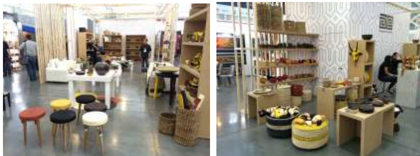
Descripción: Stand Laboratorios en Expoartesano 2016. Lugar: Plaza Mayor, Medellín (Antioquia), Colombia.

Para la feria Expoartesano La Memoria 2016 en la ciudad de Medellín (Antioquia) se contó con la exhibición de productos todos los proyectos anteriormente mencionados, con diversas referencias de productos artesanales que ascendieron a más de 83 referencias, en distintos oficios artesanales.