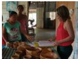
Asesoría en casa de una artesana. Los Córdoba. Galilea.

Los objetivos se cumplieron orientados a reestructurar la operación comercial y operativa; para lograr mayor colocación a partir de estrategias solidas de comercialización, de precios, de promoción, de exhibición y de ampliación de brochure.