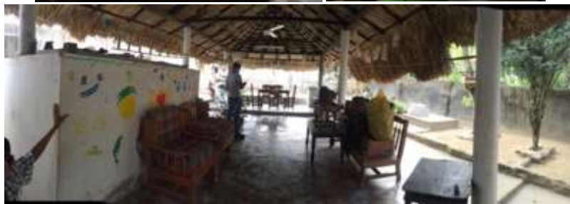
Taller de los Urán (máquinas y herramientas). Municipio de Ciénaga de Oro. Enero 2016