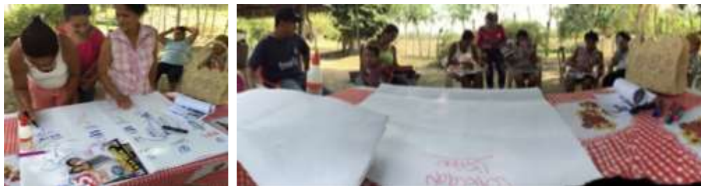
Artesanas en taller - El Sabanal, Montería Córdoba. Tomada por: Daniela Bucheli / Enero 2016

Para el grupo de Montería de Asocor, que realiza artesanías y manualidades se realizó una charla para explicar y contextualizar a los artesanos sobre el sector artesanal y sobre los conceptos y diferencia entre línea y colección.