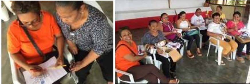
Artesanas realizando el círculo cromático en Tacasuan, Montería Córdoba. Tomada por: Daniela Bucheli / Marzo 2016

explorar el color por medio del círculo cromático, se explican los conceptos de rescate, mejoramiento, creación, diversificación y rediseño.