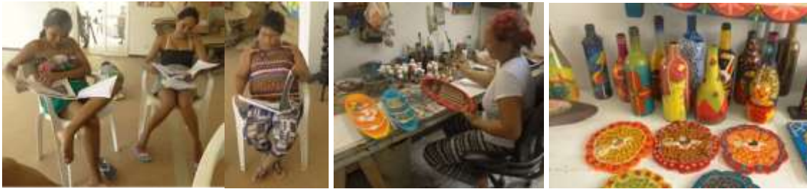
Taller y obras de artesanos, grupo Creer. Cerete. Enero de 2016.

Para el taller de Referentes se trabajó en grupo, presentando por cada participante una serie de referentes y haciendo luego un análisis de la relevancia de cada uno, trabajando también en el desarrollo de ideas generadas a partir de ellos, ligándolo al taller de línea y colección. La comunidad del casco urbano está comenzando nuestro acompañamiento y no se tenía experiencia similar en este grupo artesanal.