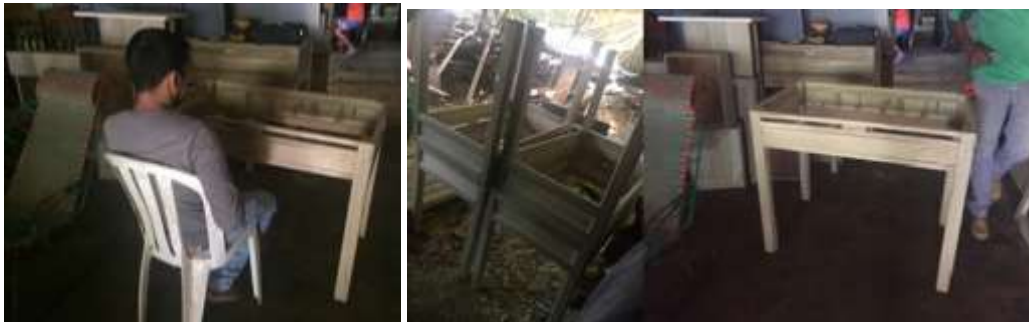
Revisión del mobiliario en el taller de madera, para verificar la ergonomía de las mesas. Municipio de Ciénaga de Oro. Junio de 2016

Se realizó la Transferencia tecnológica con la implementación de 5 puestos de trabajo de joyería, cuya producción tuvo seguimiento por parte de los asesores para verificar el cumplimiento de las condiciones ergonómicas de los muebles.