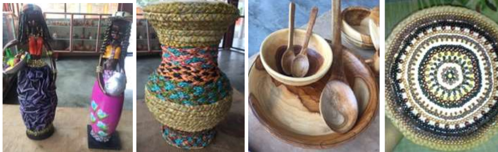
Artesanos y muestras de productos de Tacasuan, Montería Córdoba.