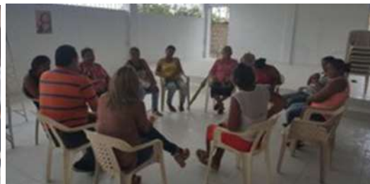
Talleres con artesanos. Salón Parroquial. Tuchín.

Se deja un grupo con gran empoderamiento a nivel del departamento dada la experticia y el reconocimiento que a nivel nacional tiene estos artesanos.