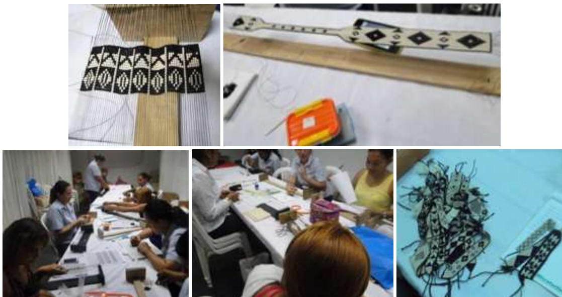
Talleres de diseño y producción. Cereté. Enero 2016.

Se impartieron todos los talleres procurando que fueran entendidos por todas las participantes, con una metodología sencilla y clara. Tras los talleres de diseño especializado en mostacilla, se trabajó en los diseños propuestos en líneas de aretes, pulsera, collar, balaca, anillo y gargantilla, de la colección Zenú