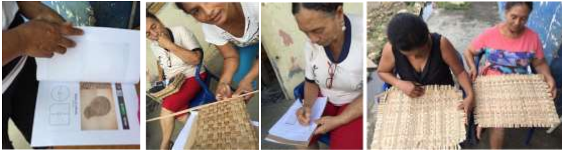
Asesorías puntuales y artesanas proponiendo nuevos diseños. La Palma, Montería. Tomada por: Daniela Bucheli / Junio 2016

Con los artesanos de la Palma, se realizaron acercamientos para nuevos diseños con lluvia de ideas y bocetos rápidos, con lo cual se definieron algunos prototipos para trabajar. Las artesanas proponen individuales planos y con acabados en los bordes de madera, canastos con nuevos agarres y nuevas formas.