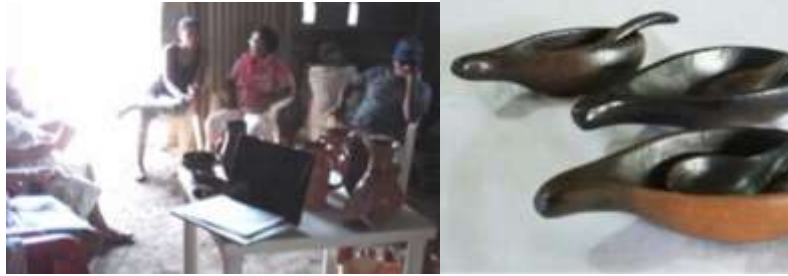
Artesanas. San Sebastián. Lorica. Enero de 2016

En los Talleres de Creatividad se explicaron cada uno de los conceptos y luego de las presentaciones, las artesanas se involucraron en un animado juego de propuestas interesantes. Luego se realizó una actividad creativa donde cada artesano diseñó su matriz de transformación de la materia prima. Como resultado del taller y la exploración de nuevos referentes se desarrolló una línea de salseros para San Sebastián. Se hizo la Verificación del Diseño de Producto para ferias, se terminaron de ajustar unos prototipos aprobados en el comité de diseño de Cartagena.