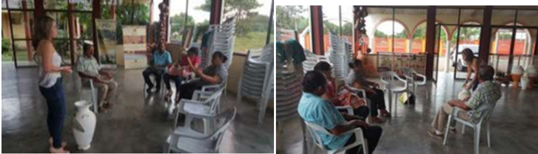
Municipio: Montería / Tacasuan Lugar: ASACOR.

Se deja un grupo de artesanos comercializadores con un mejor perfil y con una estratégica organización que les va a permitir crecer en el mercado artesanal y generar mayores rentabilidades. Los contenidos trabajados con el grupo de Tacascuan fueron decisiones de producto, talleres de estrategias de precio, determinación de canales de distribución, promoción y exhibición de productos y alistamiento evento ferial.