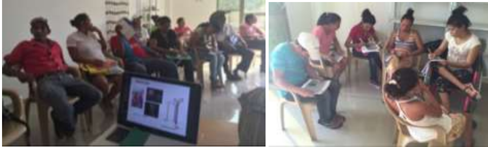
Taller con el grupo Renaceres de Esperanza. Momíl ,Córdoba.

Se trabajaron los contenidos con el grupo RENACERES DE ESPERANZA.