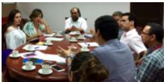
Descripción: Reunión de gestión con la Universidad del Sinú. Lugar: Bloque central, Montería, Córdoba.

Se realizó la formulación pormenorizada de presupuesto y actividades y la contratación de los diseñadores para el proyecto, realizando la reuniones de coordinación y articulación del Laboratorio con el equipo del proyecto caña flecha.