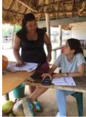
Sacando costos de productos. Buenavista, Vereda Polonia, Tomada por: Daniela Bucheli / abril 2016

El secretario de cultura del municipio ofreció apoyo a los artesanos de Buenavista, dejando puertas abiertas para aprovechar esta coyuntura y gestionar recursos que permitan mejorar el funcionamiento de la asociación.