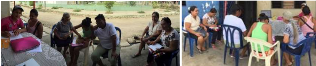
Ejercicios de referentes en La Palma, Montería Córdoba. Tomada por: Daniela Bucheli. / Febrero 2016