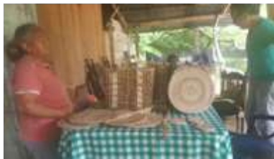
Casa de una artesana El Puente. Los Córdoba Tomada por: Diógenes Guerra.

Se propuso superar todas estas complicaciones y desajustes, por lo que las variables tratadas en los diferentes talleres fueron concluyentes para la definición de un nuevo estándar de negocio, que les permitirá en el tiempo, ganar reconocimientos nacionales, así como mejores colocaciones y por ende un mayor crecimiento de la unidad de negocios. Quedan los artesanos comprometidos, ávidos de más información y capacitación y con la necesidad de un mayor acompañamiento. Los contenidos trabajados fueron decisiones de producto, talleres de estrategias de precio, determinación de canales de distribución, promoción y exhibición de productos.