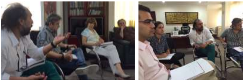
Descripción: Reunión de gestión con la Cámara de Comercio de Montería. Lugar: Despacho Presidente Ejecutivo, Montería, Córdoba