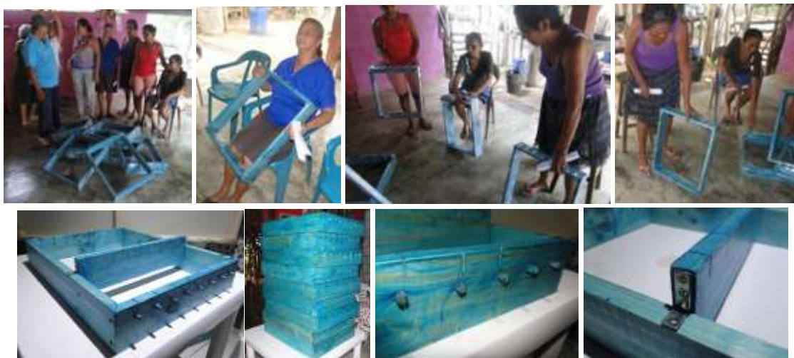
Entrega de telares planos de mesa. Rabolargo. Abril 2016.