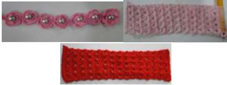
Manillas en crochet Cerete fundación. Mayo de 2016.