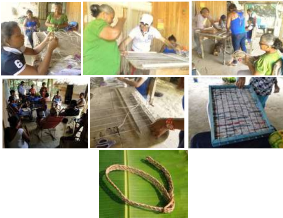
Talleres. Los Córdoba. Febrero de 2016.

Se obtuvo datos de los proveedores de tintes para poder trabajar el color en la cepa, con base en lo cual el líder regional tomó la decisión de trabajar una línea redonda en color crudo blanco, y las piezas requeridas fueron individuales redondos clásicos y forros para mesas de madera de cincuenta cms.