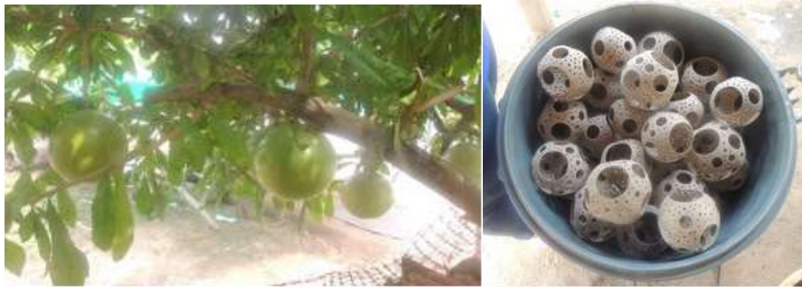
árbol del totumo y piezas en proceso. Buenavista. Daniela Bucheli / Diciembre de 2015

Se presentan los resultados obtenidos en las visitas realizadas con una contextualización con los artesanos, el estado del arte de sus materias primas y su técnica, así como aspectos importantes de los oficios.