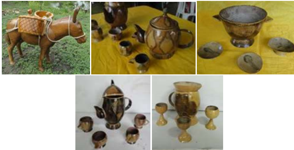
Productos. Los Córdoba. Galilea. Marzo de 2016.

Las presentaciones de Tendencias ayudaron a identificar el cambio que debe tener el trabajo de diseño para poder acomodarse a las demandas del mercado actual.