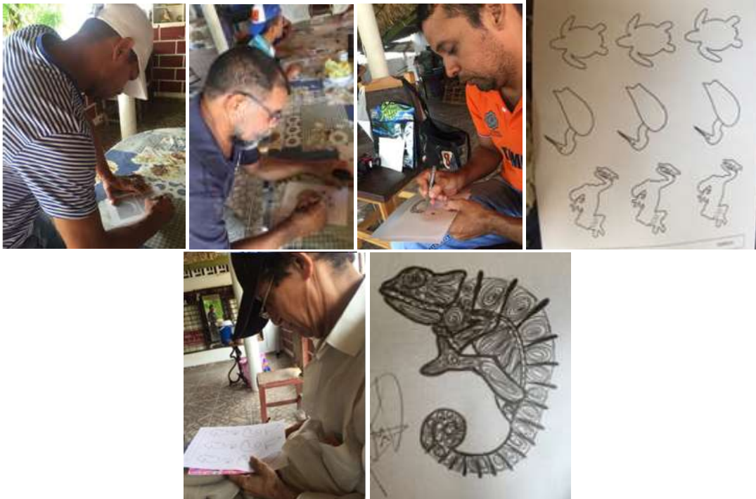
Taller de creatividad. Municipio de Ciénaga de Oro. Abril 2016