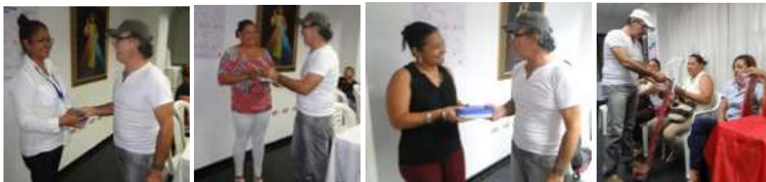
Entrega de kits de herramientas. CERETE. Abril de 2016.

Se realizó transferencia tecnológica, con la entrega de telares y kits de herramientas para hacer más fácil y productivo el trabajo. El telar es un telar grande plano y el kit tiene tijeras, cinta métrica, pinzas largas de punta, hilo, 14 agujas, panola blanca, y dos libras de mostacilla.