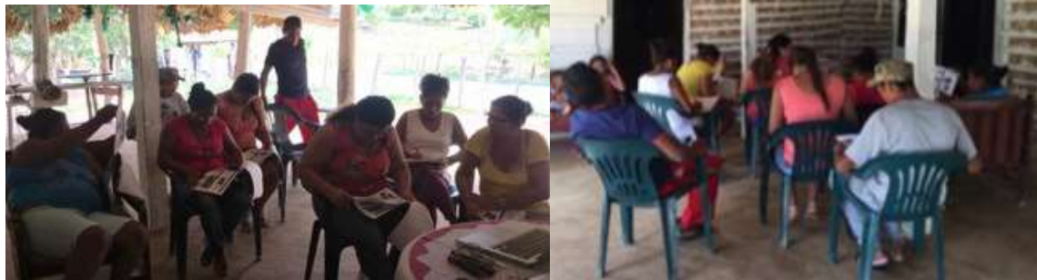
Capacitación de los artesanos. Buenavista, Vereda Polonia

En el taller de Producto, Línea y Colección se les explicó cada concepto sobre producto, línea y colección. Se realizó un ejercicio para aplicar sus productos en totumo a una colección. Entre todos los artesanos diseñaron una colección con los productos que tenían en stock. Todos los artesanos demostraron gran disposición para aprender. Se explicó cada concepto y se realizaron en cartulina varios ejemplos de los conceptos y como se podrían aplicar en sus productos.