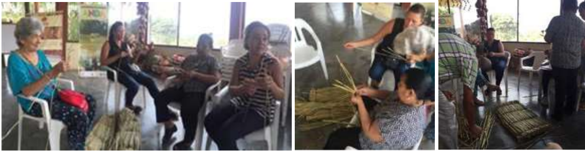
Mejoramiento de la técnica - Tacasuan Montería Córdoba Febrero 2016