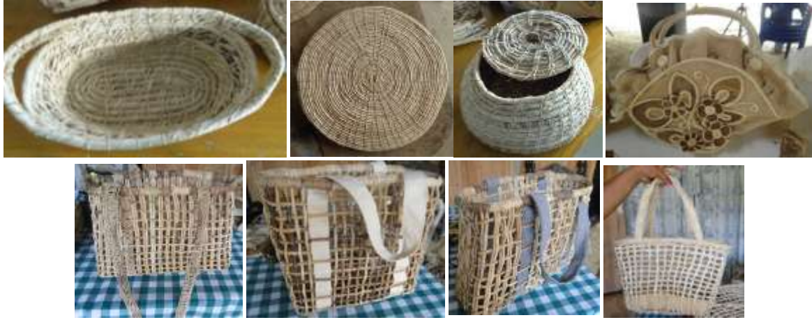
Piezas identificadas. Los Córdoba. Diciembre de 2015

diseño e impresión del catálogo, exploración que se realizaría en todas las comunidades para un catálogo general para los municipios beneficiarios del proyecto.