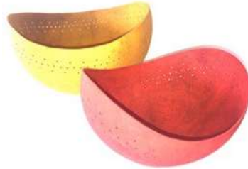
Asesoría en diseño y nuevas bases para los totumos. Buenavista, Vereda Polonia.

En cuanto a transferencia tecnológica, se hizo entrega de herramientas básicas incluyendo lija, mascarillas y cuchillos, quedando cada grupo de artesanos dotado de herramientas: caladora manual y motor tools para mejorar la calidad de los productos. En el momento de la entrega se explicó el uso de las herramientas, como se deben guardar y los pasos a seguir para su manipulación. Se hicieron pruebas para verificar su estado y dar a los artesanos una inducción para su utilización.