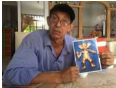
Artesano explicando referentes de su región. Municipio de Ciénaga de Oro. Tomada por: Daniela Bucheli. 2016

Con ayuda de los artesanos se realizaron talleres de acercamiento a referentes, en donde cada uno explicó referentes de la región y buscaron trabajos en oro y plata que alguna vez realizaron en su trayectoria como joyeros.