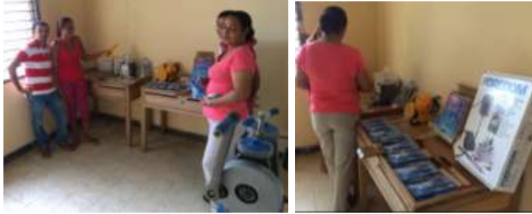
Entrega de herramientas y maquinaria para Taller de Joyería. Ciénaga de Oro. 2016

Suárez, con la entrega de maquinaria y herramienta especializada como dotación del taller.