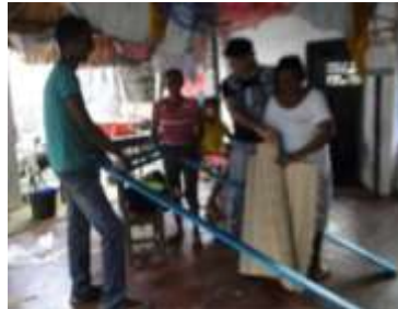
Transferencia tecnológica. San Nicolás de Bari. Loricá. Junio de 2016.

Transferencia tecnológica. El grupo es completamente productivo pero se especializa en piezas pequeñas, especiales para souvenir por lo cual se les realizó transferencia de telares para la elaboración de piezas más grandes.