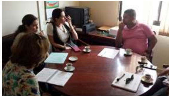
Descripción: Reunión gestión con Alcaldía Municipal de Tuchín, Córdoba. Lugar: Oficina del despacho del alcalde, Tuchín, Córdoba

Acompañamiento a la socialización del Programa “Mi Negocio” en el municipio de Tuchín, por parte de la oficina de Prosperidad Social en Córdoba, haciendo articulación y colaboración en la convocatoria de los posibles artesanos beneficiarios.