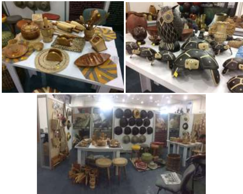
Descripción: Stand Proyecto Regional en Expo Córdoba 2016. Lugar: Centro de Convenciones de Montería, Córdoba

La feria Expo Córdoba 2016 considerada un evento de positiva relevancia en el entorno empresarial del departamento se desarrolló del 17 al 20 de Noviembre en el Centro de Convenciones de la ciudad de Montería (Córdoba).