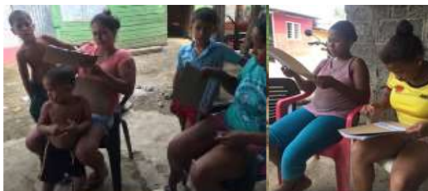
Artesanas en taller de modos de intervención en Cantaclaro. Montería Córdoba. Tomada por: Daniela Bucheli. 2016

En el taller de modos de intervención se realizó un ejercicio entregando a cada uno una imagen de una artesanía, debiendo plantear una solución de rediseño, de rescate, de mejoramiento o una nueva creación.