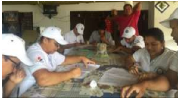
artesanos nuevos que se vincularon al proyecto. Municipio de Ciénaga de Oro. 2016

Se desarrollaron y definieron Líneas de producto para la feria Exportesano en Medellín; para ello los artesanos realizaron los pedidos y los entregaron en reuniones, pues no tienen taller para trabajar juntos. A este grupo se sumaron nuevos artesanos que trabajan country, son artesanos interesados en hacer parte de nuevos proyectos y mejorar su técnica.