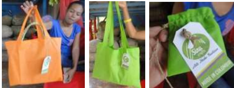
Talleres. San Nicolás de Bari. Loricá. Mayo de 2016.

En los Talleres de Creatividad se desarrollan los conceptos de forma, función y su relación según el usuario, el contexto y ocasión de uso. Color, texturas. Aplicación del referente al producto. Se definieron aspectos relevantes de la función de un producto y los beneficiarios iniciaron el proceso de bocetaje.