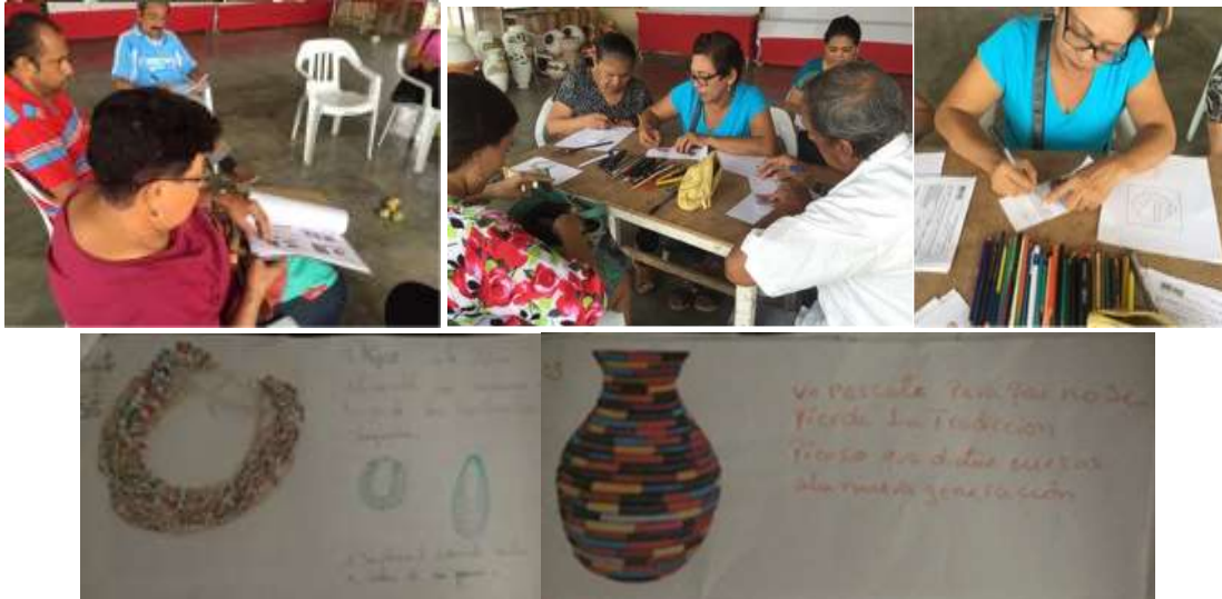
Artesanas en talleres de modos de intervención. Tacasuan, Montería Córdoba Tomada por: Daniela Bucheli. 2016

Se realizaron talleres de referentes aplicados al producto donde los artesanos exploraron formas, contornos y nuevos diseños a partir de referentes. Por cada técnica se definieron variables de diseño.