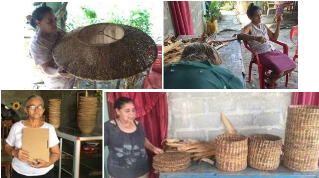
Arterasnas con productos para clientes y para ferias. El Sabanal, Montería. 2016