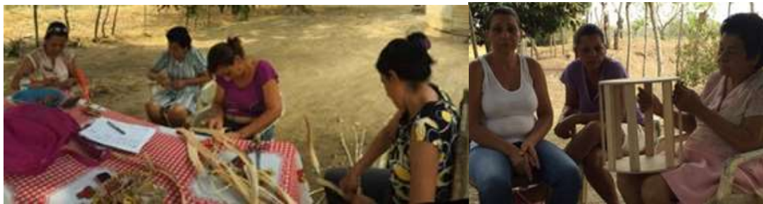
Artesanas en mejoramiento de técnica - Sabanal, Montería Córdoba. Febrero 2016

Se realizó asesoría puntual para mejoramiento en cuanto acabado, rediseño y creación de nuevas piezas a partir de productos ya existentes.