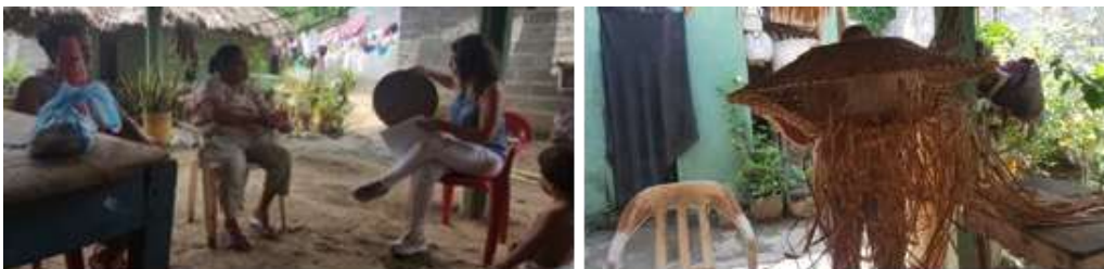
Municipio: Montería / Sabanal. Casa Artesano.

Se deja un grupo mejor estructurado y en capacidad de aplicar lo aprendido. La resistencia inicial frente a los talleres se convirtió en una razón más para seguir creciendo en su labor comercial.