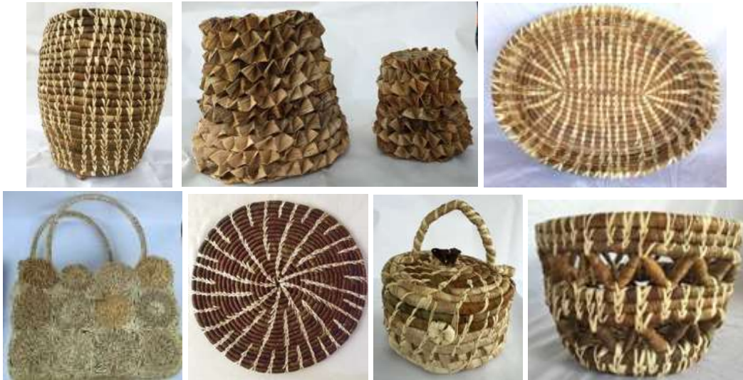
Productos desarrollados en el mejoramiento de la técnica. El Sabanal, Montería Córdoba Tomada por: Daniela Bucheli / Marzo de 2016

Se hizo entrega al grupo de la Palma algunas herramientas básicas como tijeras, cintas métricas, agujas.