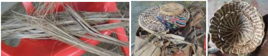
Aspectos de la producción con cepa de plátano El sabanal, Montería – Córdoba. Diciembre 2015

Compran la materia prima en el centro cuando en la zona no hay. El precio oscila entre $40.000 y $50.000 el ciento de Iraca que procede de Planeta Rica o de Tierralta. En la zona cultivan la hoja del plátano y en sus casas tienen matas cultivadas.