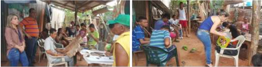
Institución educativa.

entorno, en políticas y establecimiento de precios, en determinación de canales de distribución y en un muy buen plan de merchandising. Los contenidos trabajados: Decisiones de producto, talleres de estrategias de precio, determinación de canales de distribución, promoción y exhibición de productos y alistamiento evento ferial.