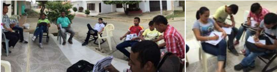
Taller en casa de los Urán. Municipio de Ciénaga de Oro. Lugar: Enero 2016

En el Taller de Producto, Línea y Colección se explicaron todos los conceptos y como ejercicio final se realizó una muestra con sus productos como se podría conformar una línea y una colección.