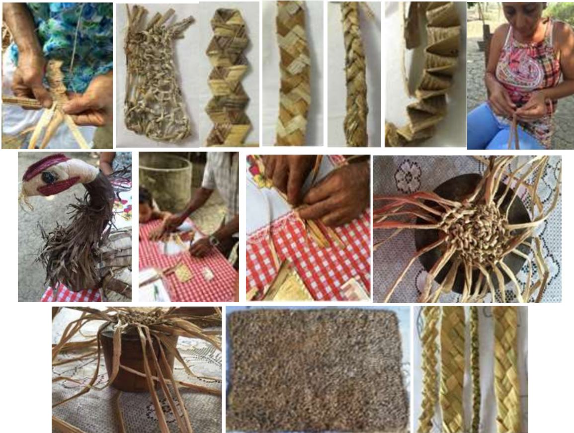
Trabajos realizados para el mejoramiento de la técnica en el Sabanal - Montería Córdoba. Tomada por: Daniela Bucheli / Enero 2016

En Montería se realizaron talleres de diseño y de producción. Para Sabanal y la Palma, comunidades que van para Expoartesanías, se les apoyó en el plan de producción. Se diseñaron estrategias y cronograma para la revisión de productos, con seguimiento semanal para revisar y analizar cada detalle de producción; en las comunidades que no fueron a feria se realizaron talleres de mejoramiento de la técnica con la entrega de algunas herramientas básicas y talleres de asesorías puntuales.