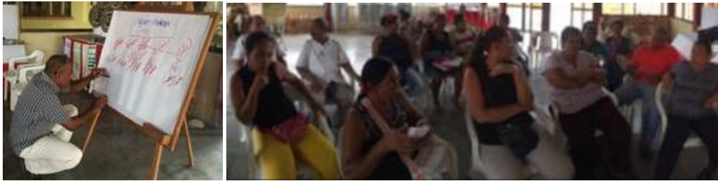
Contextualización grupo Tacasuan - Montería Córdoba Enero 2015