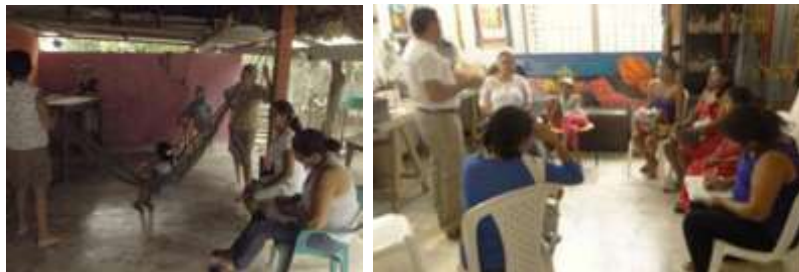
Taller en Rabolargo y en Cereté. Enero de 2016.

Para el taller de Referentes se trabajó en grupo, presentando por cada participante una serie de referentes y haciendo luego un análisis de la relevancia de cada uno, trabajando también en el desarrollo de ideas generadas a partir de ellos, ligándolo al taller de línea y colección. La comunidad del casco urbano está comenzando nuestro acompañamiento y no se tenía experiencia similar en este grupo artesanal.