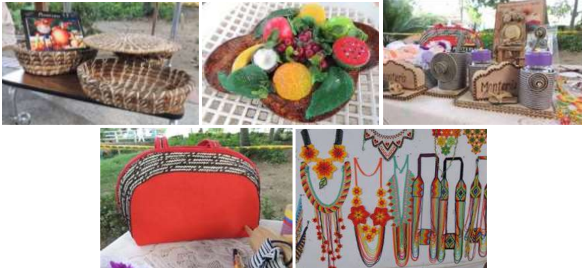
Artesanías de Montería Córdoba. Tomada por: Daniela Bucheli / Fecha: Diciembre 2015

En entrevista a los artesanos se identifica que: