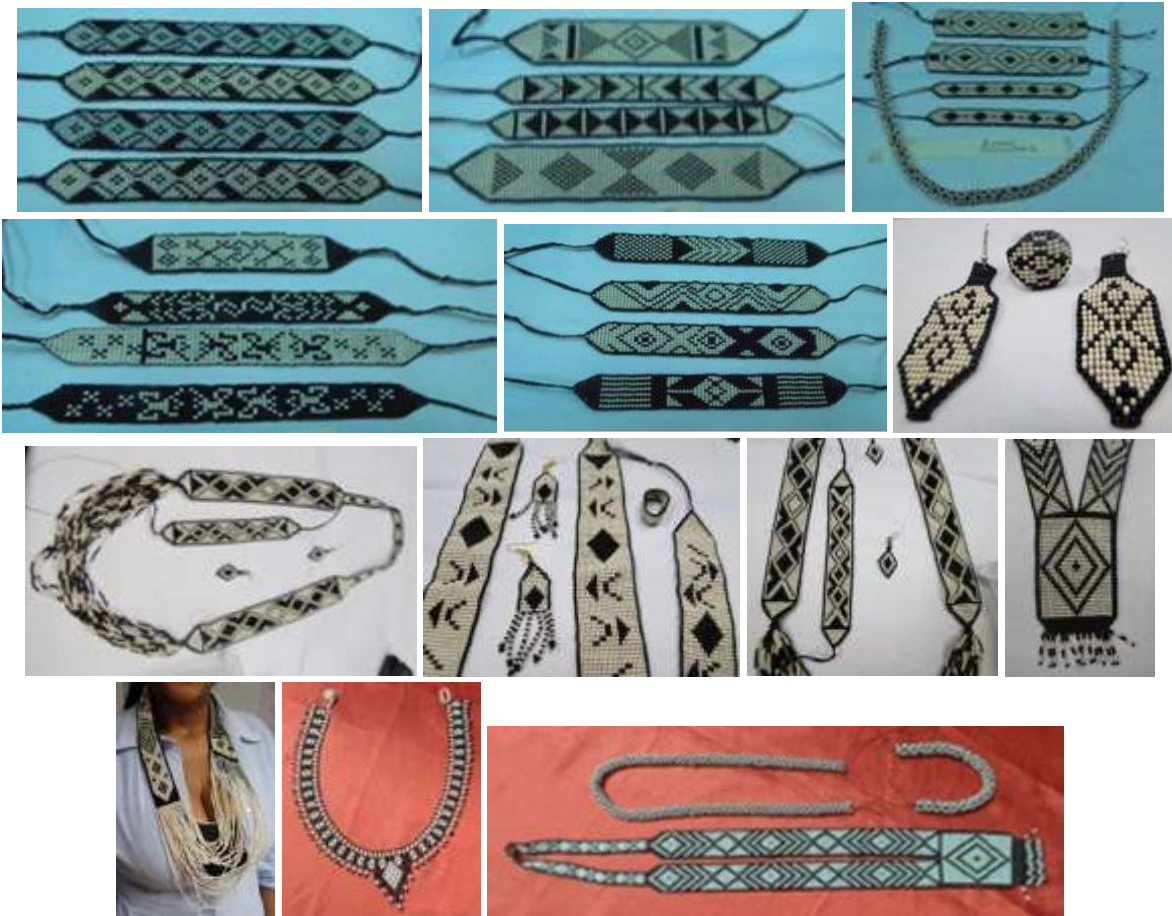
Colección ZENÚ. Cereté. Febrero 2016.

Para el caso del taller de bisutería y el de crochet se continuó con la producción que se venía realizando para el mercado local entre ellos las balacas y porta celulares de buena aceptación.