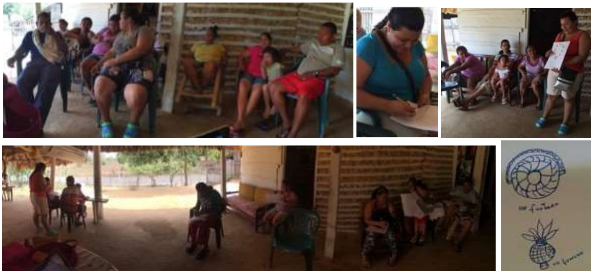
Identificación de referentes Buenavista, Vereda Polonia, Córdoba Tomada por: Daniela Bucheli / Febrero 2016

Se realizó un taller de identificación de Referentes, presentando cada concepto y luego se exploraron los referentes en la zona. Los artesanos exploraron formas de la naturaleza, y formas geométricas para obtener nuevos referentes para sus productos.