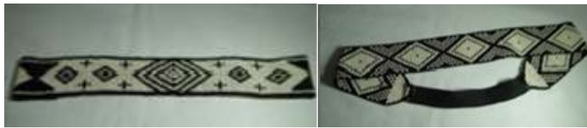
Balacas Taller Creer. Cerete . Mayo 2016