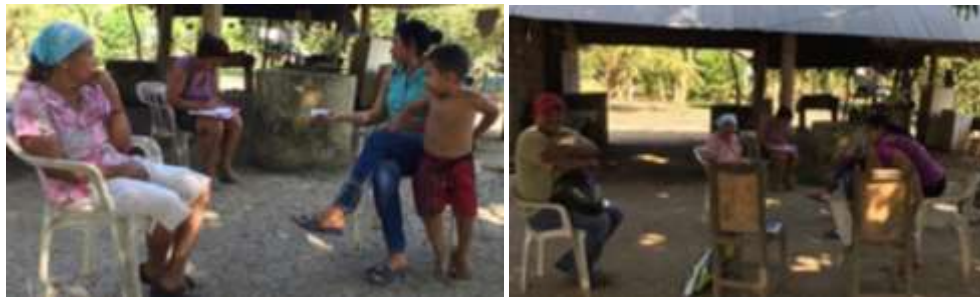
Artesanas de El sabanal - Montería Córdoba Tomada por: Daniela Bucheli / Enero 2016

Al finalizar el taller, en sus trabajos es evidente que para ellos los iconos representativos de la región son el sombrero, la fauna, la flora, el acordeón, las abarcas, entre otros.