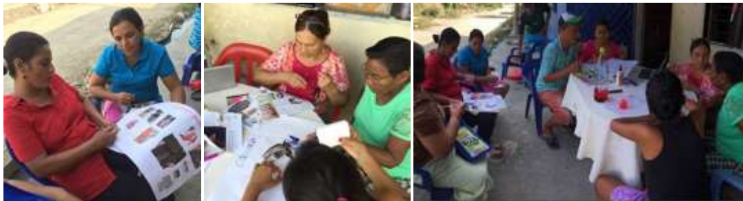
Artesanas en actividades del taller - La Palma, Montería Córdoba Tomada por: Daniela Bucheli / Enero 2016

Para el Taller de reconocimiento de la identidad se desarrollaron los conceptos de identidad (individual y colectiva), expresión (material e inmaterial), relación con variables externas y transformación. Se realizaron trabajos creativos basados en reconocer la propia identidad, con collages, mapas conceptuales y talleres de dibujo donde cada artesano expreso la identidad monteriana y como rescatar cada elemento y cada forma de sus antepasados; se exploró la naturaleza y la identidad geográfica para luego aplicarla a los productos