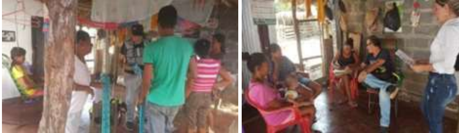
San Nicolás de Bari Lugar: Casa de una artesana

contenidos trabajados fueron decisiones de producto, talleres de estrategias de precio, determinación de canales de distribución, promoción y exhibición de productos y alistamiento evento ferial.