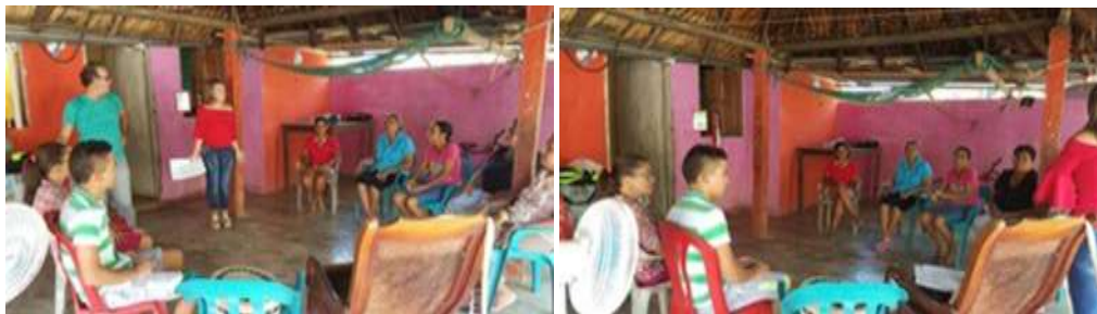
Talleres del Módulo Comercial. Casa Artesano Rabolargo, Cereté. Tomada por: Jorge A. Campo Ruz. 2016

Con el grupo de Rabolargo se logró identificar a partir de los diferentes talleres, el porqué de la baja rotación de las piezas de estos artesanos; se les reestructuro su operación comercial y logística, así como la identificación de las necesidades del mercado y su entorno, dándoles respuesta a una dinámica rotación y variedad de productos. El grupo consiguió empoderarse del tema de políticas y estrategias de precios, que para ellos representaba pérdida constante; se logró determinar canales de distribución que permitirán mayor rotación de las piezas artesanales. Queda el grupo fortalecido y reestructurado con visión y misión diferentes a las que traían, con estándares de producción basados en el conocimiento de las necesidades y las tendencias del mercado. Los contenidos trabajados con la comunidad giraron en torno a Decisiones de producto, estrategias de precio, determinación de canales de distribución, promoción y exhibición de productos y alistamiento evento ferial.