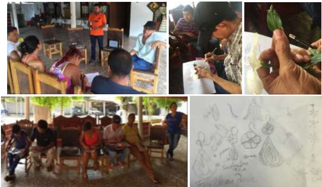
Taller de identificación de referentes. Municipio de Ciénaga de Oro. Enero 2016

En el taller de Identificación de Referentes se realizó una lluvia de ideas donde escogieron algunos referentes de su comunidad que fueron plasmados en dibujos. Luego de tener claro cómo se trabajaba productos con base en referentes, se escogió una flor como referente para plasmar bocetos de productos en filigrana.