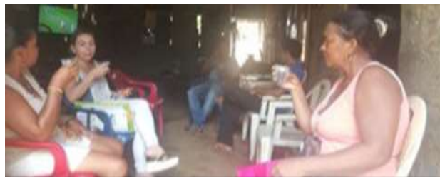
Casa de artesana en San Sebastián - Lorica

Se consiguió con los talleres mejorar la calidad de los diseños y la innovación de productos, como respuesta a las necesidades del mercado y al benchmarking realizado; de igual manera se les suministro herramientas para el aumento de la competitividad y el diseño de planes de comercialización, exhibición y eventos feriales. Los contenidos trabajados fueron decisiones de producto, talleres de estrategias de precio, determinación de canales de distribución, promoción y exhibición de productos y alistamiento evento ferial.