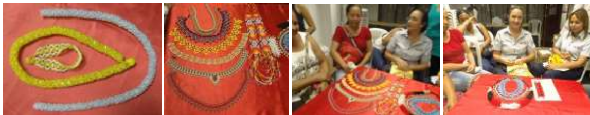
Piezas identificadas del grupo Creer. Cerete. Enero 2015.

A continuación se presentan piezas que actualmente produce el grupo: