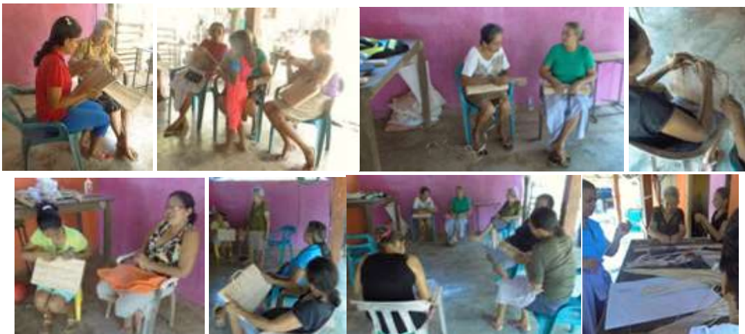
Taller de Tendencias. Cerete. Febrero de 2016.

En el Taller de Tendencias, las presentaciones ayudaron a identificar el cambio que debe tener el trabajo de diseño para poder acomodarse a las demandas del mercado actual.