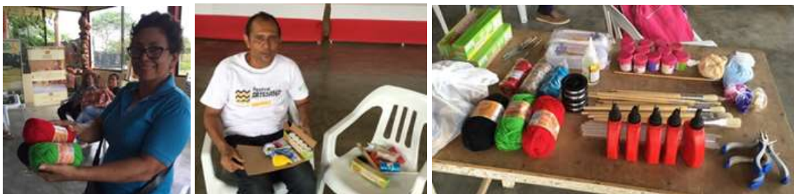
Artesanas en entrega de insumos y herramientas básicas - Tacasuan, Montería Córdoba.