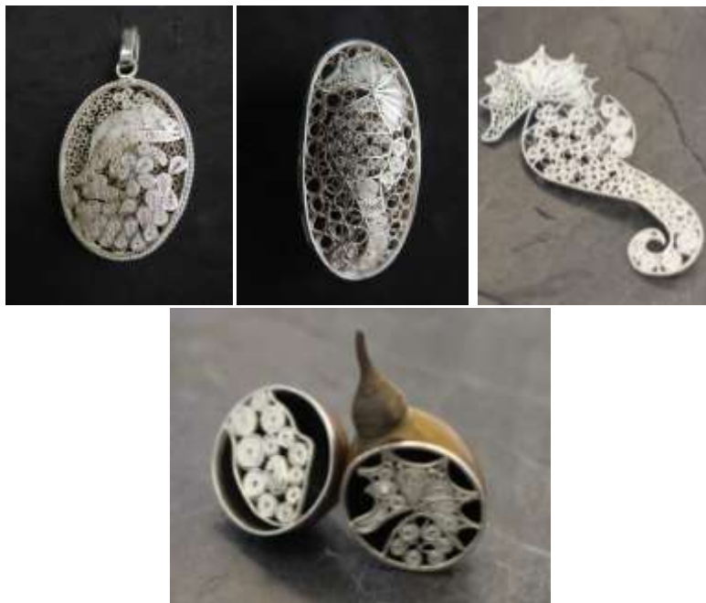
Productos desarrollados para Expoartesanías 2016 Tomada por: Artesanías de Colombia Bogotá D.C. 2016.

A partir de la inclusión del municipio como pueblo joyero de Colombia, en el Programa Nacional de Joyería de Artesanías de Colombia, se brindó asistencia técnica especializada con diseñadores de joyería, efectuadas bimensualmente, que enriquecieron su quehacer artesanal, construyeron colecciones de joyas que se tradujeron en encargos de producción para participación en los eventos feriales de Expoartesano 2016 y Expoartesanías 2016.