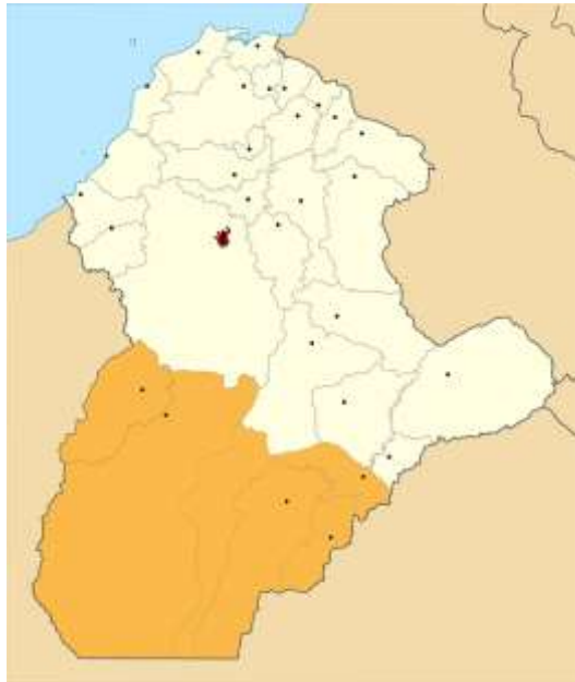
Municipios beneficiarios Py-Sur de Córdoba

El proyecto “Fortalecimiento de la competitividad y el desarrollo de la actividad artesanal en Montelíbano, Puerto Libertador, San José de Uré, Tierralta y Valencia – Fase II” se formuló para atender, en su Fase I y Fase II a 308 artesanos pertenecientes a 10 organizaciones relacionadas en la Tabla 1, identificadas por Colombia Responde. En la Fase I estos artesanos fueron identificados y el levantamiento de línea base de los 308 artesanos beneficiarios del proyecto se realizó en la Fase II en el primer semestre de 2015.