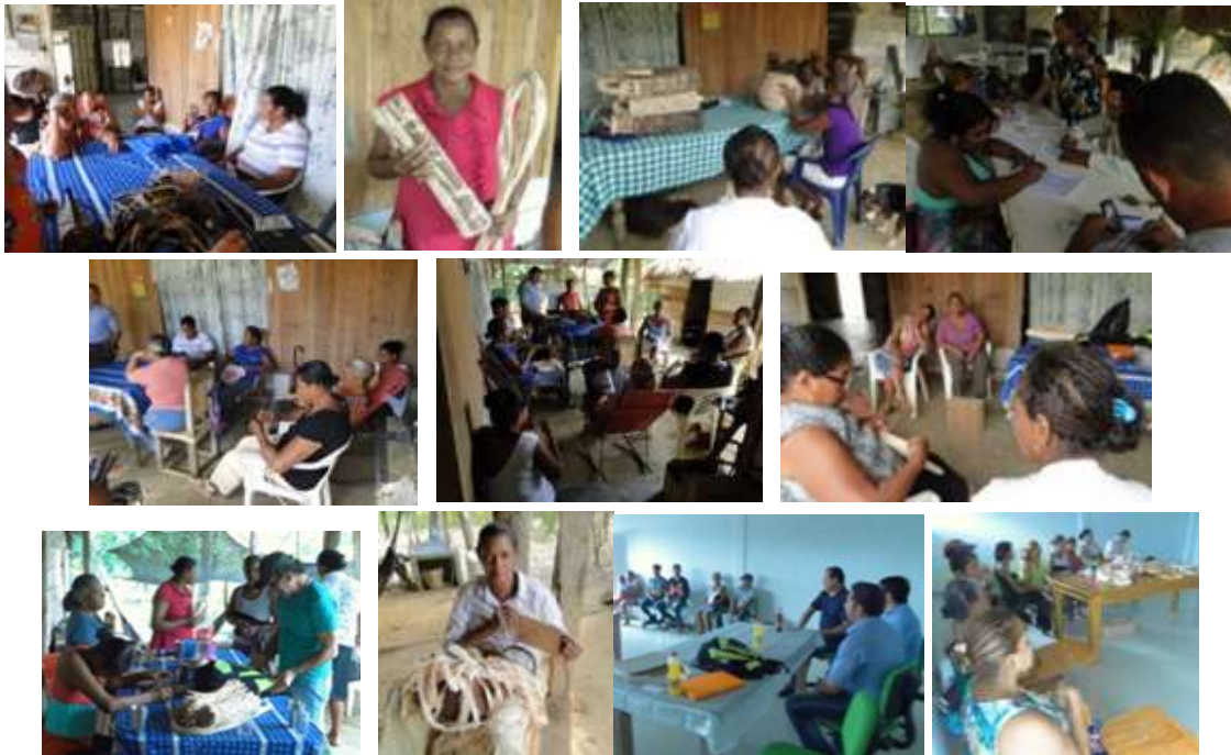
Talleristas. Los Córdoba. Febrero de 2016.