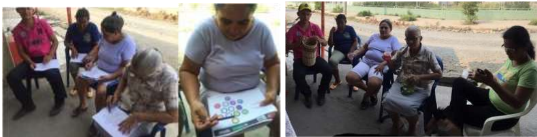
Artesanas realizando el círculo cromático en La Palma, Montería Córdoba.