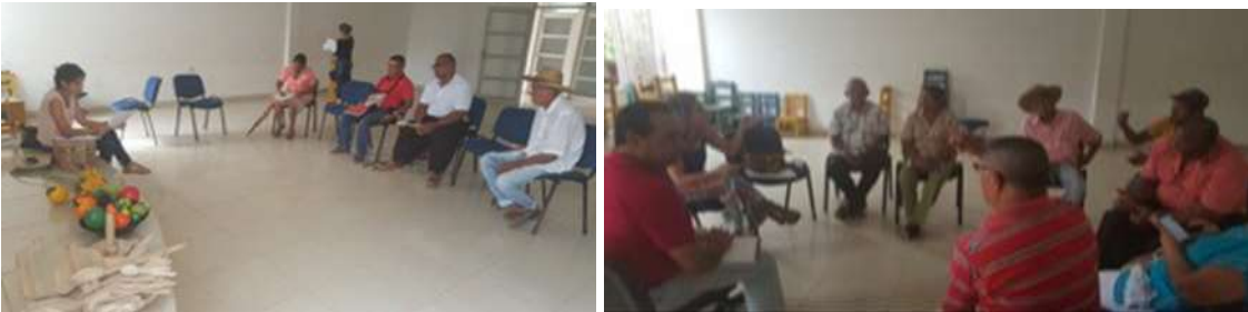
Buenavista zona urbana Lugar: Casa del artesano.

Se deja un grupo con una amplia variedad de piezas artesanales con pertinencia actual, y segmentada de acuerdo a las tendencias del mercado; además de orientadas comercialmente a nivel de estructura, lo cual demandó de los artesanos un mayor esfuerzo y una mayor decisión de colocación.