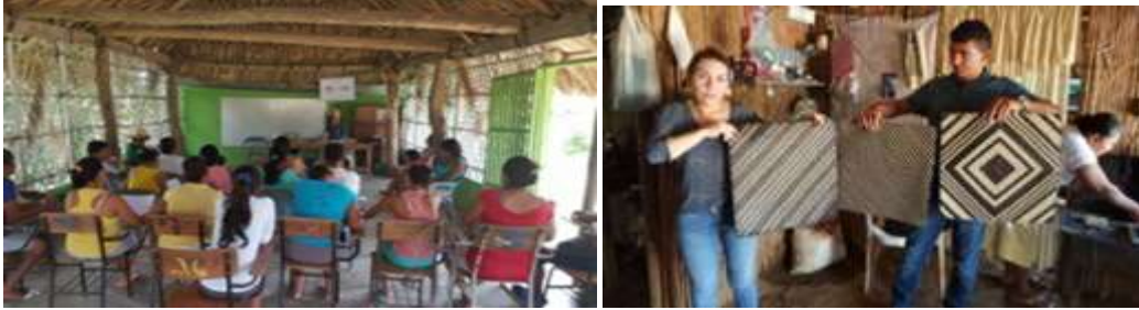
Salón Cultural El Delirio. San Andrés de Sotavento.