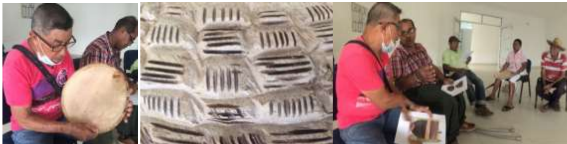
Reunión con artesanos sobre técnica y experimentación de nuevas formas. Buenavista, Córdoba. Tomada por: Daniela Bucheli / Junio 2016

Con los artesanos del casco urbano se realizaron muestras experimentales para el ambiente cocina, se propuso realizar recipientes en teca, haciendo apliques con repetición.