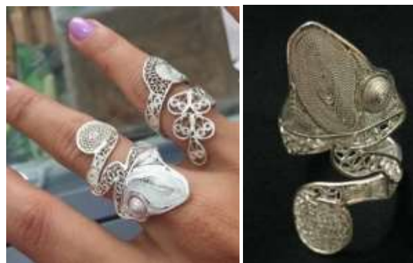
Anillos enviados a la feria. Municipio de Ciénaga de Oro. 2016