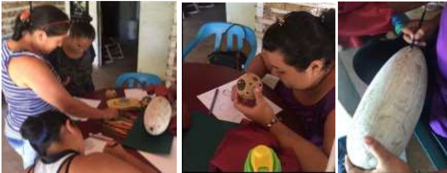
Bocetos de nuevos diseños y experimentación de nuevas formas Buenavista, Polonia-.Tomada por: Daniela Bucheli

Con los artesanos de Polonia se trabajó el desarrollo de nuevos productos a partir de referentes y se escogieron líneas de hogar para diseñar: Sala y alcoba. Se hizo bocetaje de nuevos diseños, experimentación de nuevas formas y referentes.