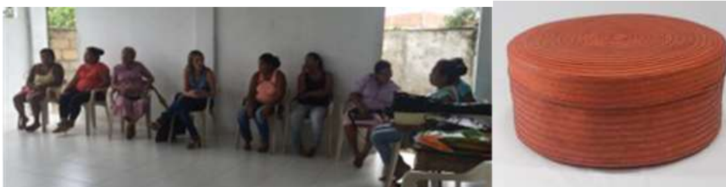
Entrega de productos ASUMUPAR. Lugar: Tuchín, Córdoba.

Se hizo la recepción de los productos para la feria Expoartesano en dos reuniones, con el grupo de ASUMUPAR y con el Sr. Reinel Mendoza, en ambas casos con productos a satisfacción con un preciso inventario y análisis de acabados y calidad.