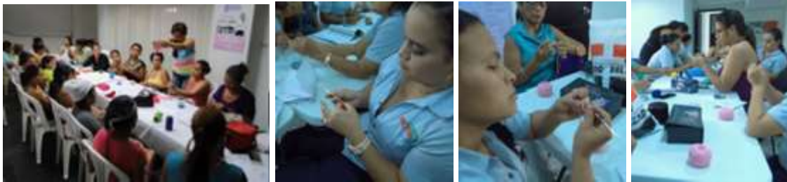
primeras puntadas de crochet. Grupo Creer. Cerete. Marzo de 2016.