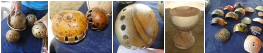
Ensayos de productos. Los Córdoba. Galilea. Marzo de 2016.