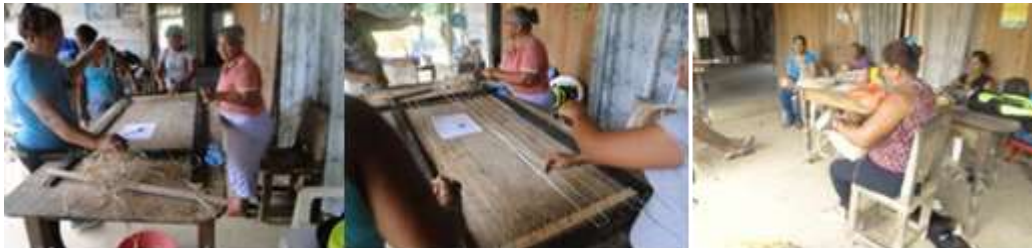
Talleristas. Los Córdoba. Febrero de 2016.

Las presentaciones de Tendencias ayudaron a identificar el cambio que debe tener el trabajo de diseño para poder acomodarse a las demandas del mercado actual.