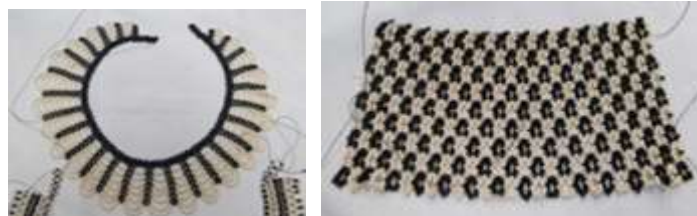
Elaboración de collares. Cerete. Mayo 2016.

Se realizó transferencia tecnológica, con la entrega de telares y kits de herramientas para hacer más fácil y productivo el trabajo. El telar es un telar grande plano y el kit tiene tijeras, cinta métrica, pinzas largas de punta, hilo, 14 agujas, panola blanca, y dos libras de mostacilla.