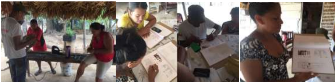
Taller mejoramiento de la técnica y asesorías en diseño. Buenavista, Vereda Polonia. Tomada por: Daniela Bucheli / abril 2016