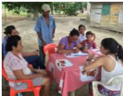
Taller con artesanos de El sabanal. Montería Córdoba. Tomada por: Daniela Bucheli / Enero 2016

En el taller de Identificación de Referentes se realizó una presentación explicando el trabajo referentes como modelos para generar nuevos diseños. Se realizó un taller para explorar patrones con apoyo de revistas y materiales para realizar una lluvia de ideas. Por último se desarrolló la ficha de inventarios.