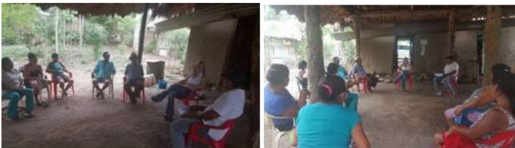
Casa Artesano. El Contenido. San Andrés de Sotavento. Junio de 2016.

Quedan los artesanos provistos de herramientas comerciales sustanciales, que garantizan su desenvolvimiento en las diferentes actividades y encausan los flujos de cajas hacia las arcas de los artesanos. Con estos dos grupos se trabajaron los talleres de Decisiones de producto, talleres de estrategias de precio, determinación de canales de distribución, promoción y exhibición de productos y alistamiento evento ferial, y también, por la pertinencia de los productos elaborados y su impacto en el mercado nacional, la capacitación en propiedad intelectual y asociatividad a las comunidades artesanales.