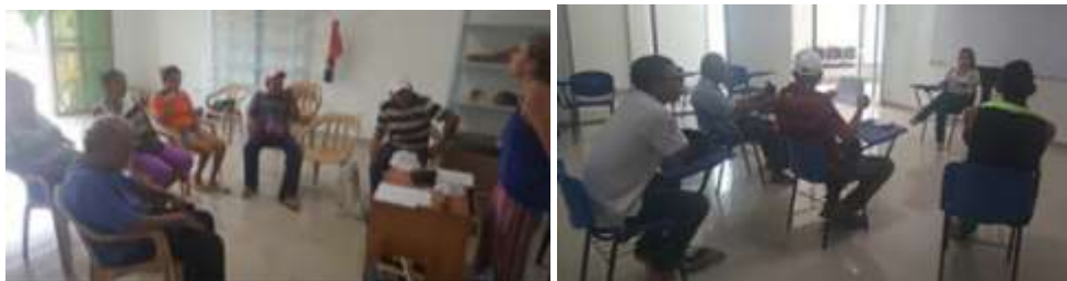
Centro Cultural. Momil.

El desarrollo de los talleres marcó para este grupo de artesanos un cambio de concepción frente a lo que venían desarrollando, lo cual mejoró las condiciones de producción y comercialización de sus piezas. Los artesanos quedan con la firme convicción de asociarse para así tener más oportunidades de colocación y de crecimiento. Los contenidos trabajados fueron decisiones de producto, talleres de estrategias de precio, determinación de canales de distribución, promoción y exhibición de productos y alistamiento evento ferial.