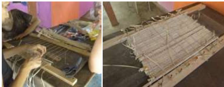
Taller de telares planos. Rabolargo. Febrero 2016.