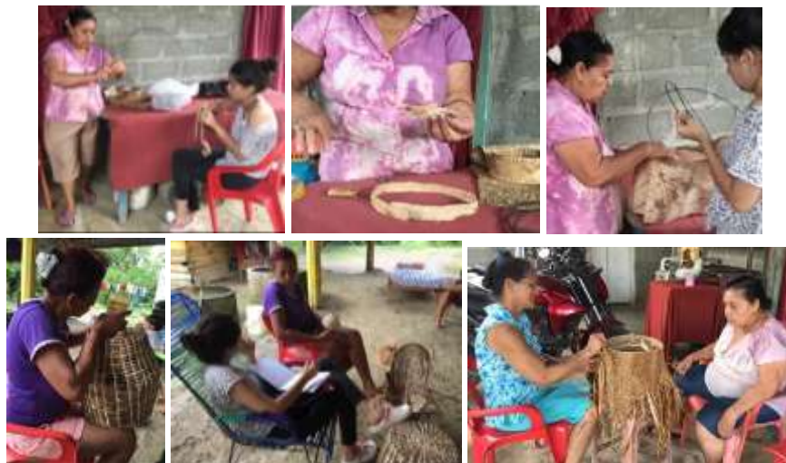
Asesorías en ensamble de piezas y muestras de nuevos diseños para ambiente sala. El Sabanal, Montería. Tomada por: Daniela Bucheli / Junio 2016

En el taller de Referentes aplicado al Producto los artesanos de la Palma se empezó a trabajar en ambientes para co diseñar productos, los ambientes fueron sala y comedor. Los artesanos propusieron empezar a diseñar tapetes y lámparas en cepa de plátano. Para este caso se realizaron asesorías puntuales de tendencias de estos ambientes y como podrían innovar en la creación de dichas piezas. Paralelo a esto, se crearon piezas alternas que complementarían los espacios, desarrollando líneas de productos no solo productos únicos. Se les sugirió manejar un solo material al momento de tejer.