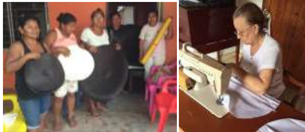
Desarrollo de muestra de cojín. Tuchín, Córdoba y Fabricación de forros para cojines, Sincelejo, Sucre.

Se aprobó la producción de cojines autorizada por el diseñador líder, haciendo entrega de la producción para la feria, previa evaluación de la calidad de la trenza y del plan de producción para cumplir con la meta solicitada. Para completar la entrega de productos destinada para Expoartesano fue necesario hacerle a los cojines un forro en tela que contuviera el relleno en algodón sintético, los cuales se mandaron a hacer en Sincelejo.