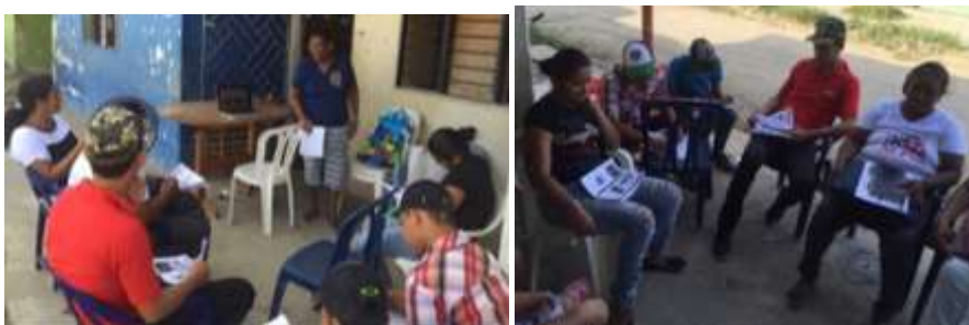
Arterasnas en talleres - La Palma Montería Córdoba. Tomada por: Daniela Bucheli / Enero 2016

Para el taller de producto, línea y colección se hizo una presentación para explicar los conceptos básicos y se realizó un ejercicio práctico con cada uno de los grupos.