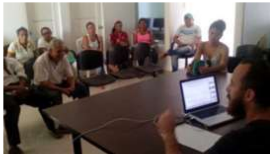
Taller con el grupo Renaceres de Esperanza, asofaarmo y artemon Momíl ,Córdoba.

Se realizó el Taller de Referentes generando una dinámica interesante; la comunidad participó de manera enérgica al darse cuenta que elementos particulares de su entorno pueden ser un punto de partida en el proceso creativo y un factor muy práctico al momento de desarrollar su actividad.