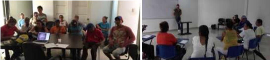
Taller con el grupo Renaceros de Esperanza, asofaarmo y artemon Momil ,Córdoba.

Se evaluaron las muestras y se hicieron los correctivos correspondientes, se tomaron fotografías de los productos entregados.