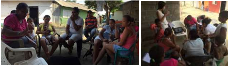
Explicación de diseño con referentes en Cantaclaro, Montería Córdoba. Tomada por: Daniela Bucheli / 2016

Con ayuda de los artesanos se realizó el documento de inventario de referentes, donde cada uno llevo un producto realizado y se evaluó todas las características descritas en la tabla.