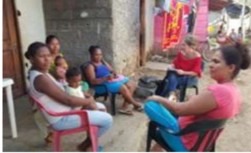
Municipio: Montería / Cantablaro. Casa Artesana.

En el sector de la Palma el grupo de mujeres asociadas tienen un trabajo muy bien consolidado y de mucho tiempo; trabajan la enea y comercializan sus productos en eventos feriales.