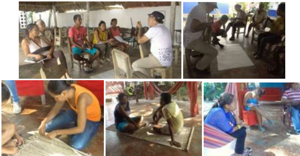
Talleres. San Nicolás de Bari. Loricá. Febrero de 2016.

Para el taller de Producto, Línea y Colección en San Nicolás de Bari se utilizaron métodos de nemotecnia para que las beneficiarias recordaran los conceptos básicos de línea y colección, también se expusieron las presentaciones y se explicó la manera de crear líneas de productos enfocados a sus técnicas y materias primas