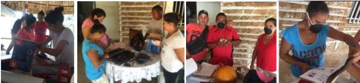
Entrega de herramientas básicas. Buenavista, Vereda Polonia. marzo 2016

En cuanto a transferencia tecnológica, se hizo entrega de herramientas básicas incluyendo lija, mascarillas y cuchillos, quedando cada grupo de artesanos dotado de herramientas: caladora manual y motor tools para mejorar la calidad de los productos. En el momento de la entrega se explicó el uso de las herramientas, como se deben guardar y los pasos a seguir para su manipulación. Se hicieron pruebas para verificar su estado y dar a los artesanos una inducción para su utilización.