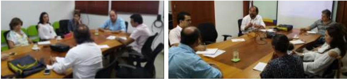
Descripción: Reunión de gestión con la Alcaldía de Montería. Lugar: Oficina del Despacho del Alcalde,. Montería, Córdoba

Se hicieron propuestas proyectuales a la alcaldía de Montería y seguimiento para firma de convenio. Se gestionaron reuniones con la Coordinación de Cultura de la Alcaldía para impulsar el proyecto de asesoría técnica para el Centro Cultural y Artesanal del Sinú.