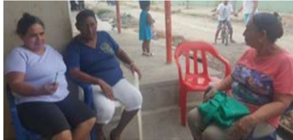
Montería, Barrio la Palma Lugar: Casa de una Artesana

producción, comercialización y procesamiento, todo lo cual les permitirá tomar mejores decisiones a futuro.