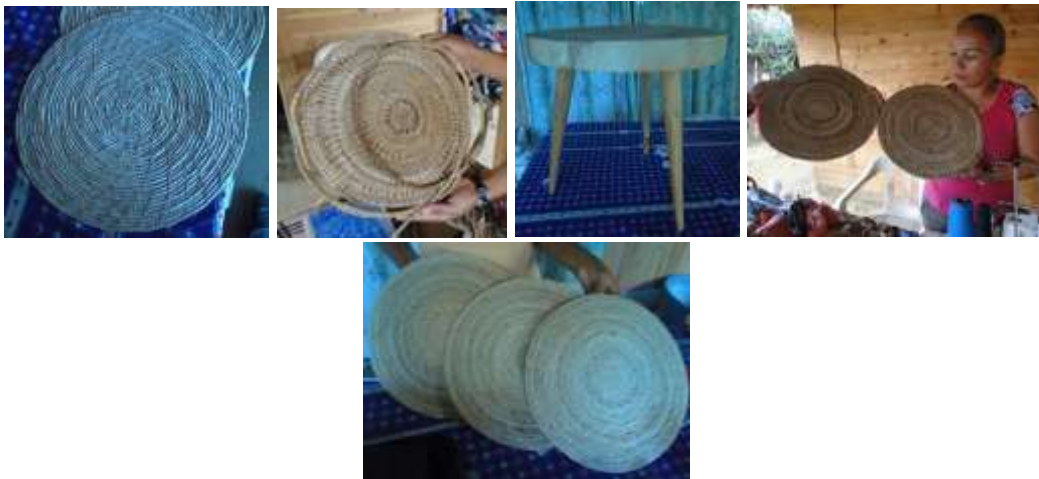
Piezas producidas en la colección. Los Córdoba. Junio de 2016.

El plan de producción de esta comunidad se centró en la producción de individuales, y cubiertas de butacas de madera de las cuales se realizó la producción correspondiente.