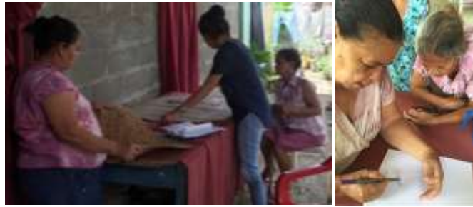
Realización de moldes y guías en cartón en El Sabanal, Montería Córdoba. Tomada por: Daniela Bucheli / Julio 2016

Se hizo corrección de prototipos aprobados en Comité. El puff se ajustó a 4 patas y se propusieron nuevos diseños con los artesanos.