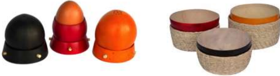
Productos desarrollados para feria en el Proyecto Sur de Córdoba. Montería.