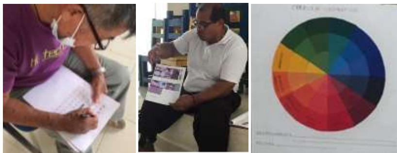
Ejercicios de creatividad, explicación de referentes y círculo cromático. Buenavista.

Con los artesanos del casco urbano se realizaron talleres de creatividad, con ejercicios de exploración de nuevas formas y diseños. Se empezó a bocetar y hacer prototipos con referentes de la región; cada artesano debía traer como tarea una lista de referentes con fotografías de la región.