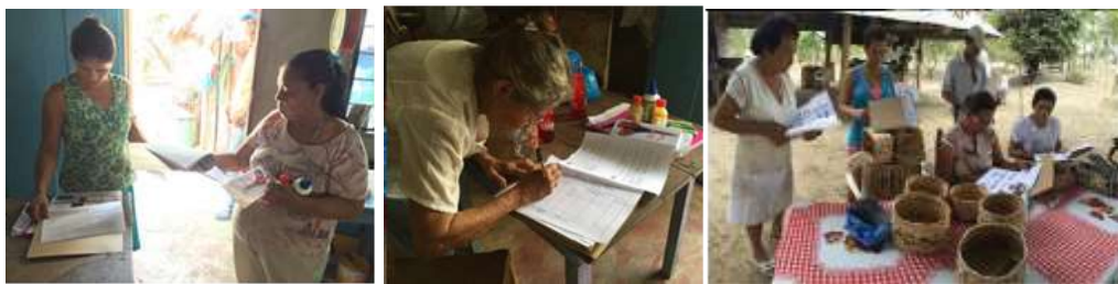
Artesanas en entrega de herramientas básicas Lugar El Sabanal, Montería. Tomada por: Daniela Bucheli 2016