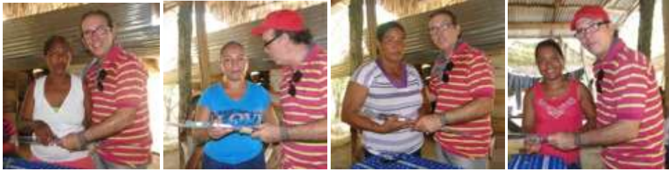
Descripción: entrega de kits. Los Córdoba. Mayo de 2016.

En esta comunidad se realizó un Taller para el mejoramiento de técnicas que se concentró en la costura y en los acabados, trabajando también los temas de nuevos productos con la innovación y el mejoramiento de la calidad. También se realizó Transferencia tecnológica haciendo la entrega del kit de herramientas a cada una de las artesanas.