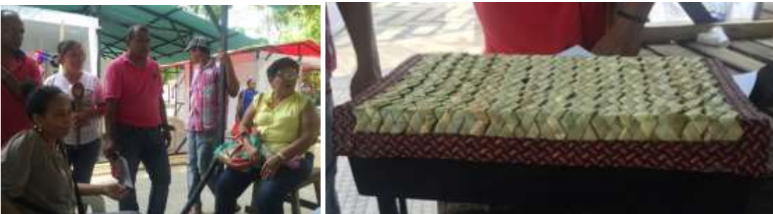
Artesanas en la Feria Artesanal y productos en madera, enea y caña flecha Lugar Tacasuan, Montería Córdoba. Tomada por: Daniela Bucheli / Junio 2016

En el caso de los artesanos de Tacasuan se empezó a desarrollo exploración para mejorar su logo como asociación. Se realizaron asesorías puntuales sobre nuevos diseños de los artesanos, con la sugerencia de manejar un solo material al tejer, no combinar trenzas y uso de colores complementarios. Todos son diseños de los artesanos fueron hechos de forma aleatoria y autónoma.