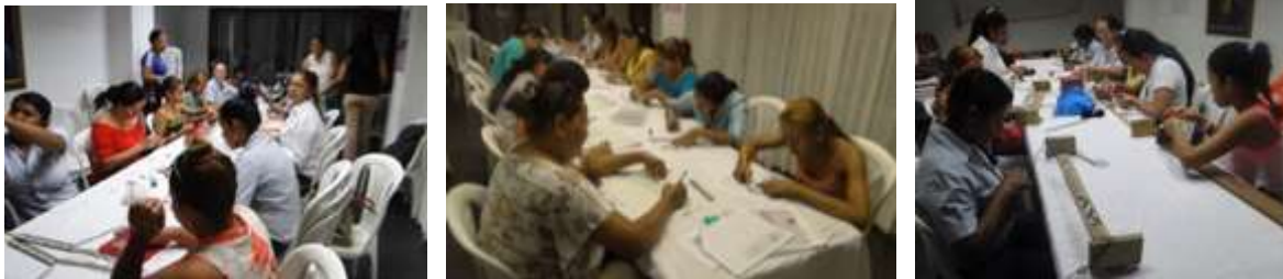
Talleres de diseño y producción. Cereté. Enero 2016.

Las participantes buscaron información fotográfica anterior a la llegada del Laboratorio para decidir de qué forma se podría trabajar el diseño del catálogo. No obstante se decidió que en catalogo solo se incluirían los grupos seleccionados para ir a feria.