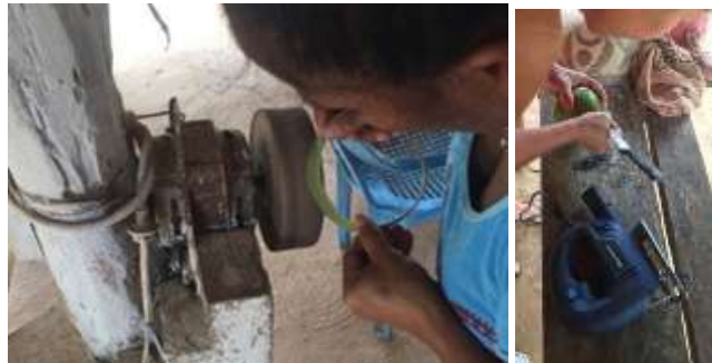
Artesanos realizando muestras experimentales. Buenavista, Córdoba. Tomada por: Daniela Bucheli / abril 2016

Con los artesanos del casco urbano se realizaron talleres de creatividad, con ejercicios de exploración de nuevas formas y diseños. Se empezó a bocetar y hacer prototipos con referentes de la región; cada artesano debía traer como tarea una lista de referentes con fotografías de la región.