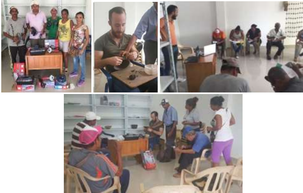
Taller con el grupo Renaceres de Esperanza, asofaarmo y artemon. Momil ,Córdoba.

Con los beneficiarios se trabajó un taller de mejoramiento de técnica en los dos oficios del municipio. Para empezar y mediante el uso de las herramientas entregadas en la actividad de transferencia tecnológica se trabajaron las diferentes técnicas aplicadas en el oficio de trabajo en frutos secos como calado, tallado o grabado. En el tema de alfarería se trataron temas de formado, cortes en barro y apliques. El taller se dio de manera muy fluida donde los beneficiarios compartieron sus conocimientos y aprendieron unos de otros.