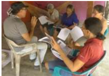
Taller de Reconocimiento de la identidad Rabolargo. Enero de 2016.

El taller de Reconocimiento de la identidad se desarrolló con pequeños grupos conformados por similar nivel de escolaridad. Se desarrollaron los conceptos de cada componente de un producto artesanal como: Identidad, cultura material, origen, relación con el entorno, relación de uso, función, diseño e Innovación, oficio-técnica, producción gráfica, empaque y precio vs. valor percibido.