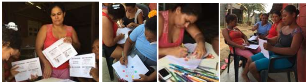
Artesanas en taller de creatividad en las cartillas en Cantaclaro. Montería Córdoba. 2016

En el taller de modos de intervención se realizó un ejercicio entregando a cada uno una imagen de una artesanía, debiendo plantear una solución de rediseño, de rescate, de mejoramiento o una nueva creación.