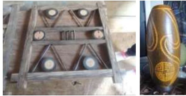
Elaboración de artesanías en lata de corozo y en totumo. Buenavista. Daniela Bucheli / Diciembre 2015

Los artesanos de Buenavista, en su gran mayoría mujeres, trabajan día a día para conseguir el sustento de la familia, llevando sus productos principalmente a ferias nacionales, argumentando que en el departamento esta subvalorado el arte de la elaboración del totumo. Trabajan más de 6 horas al día, descansando para desayunar y almorzar, dado que hacer productos para ferias es un trabajo extenuante e intensivo.