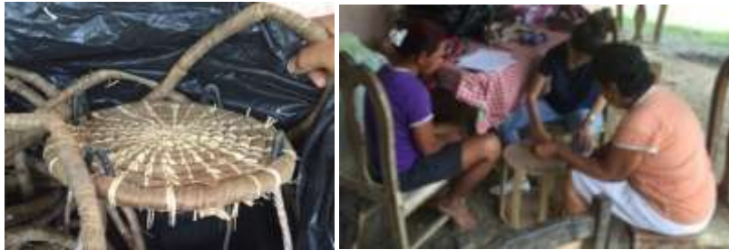
Estructura de puff con 4 patas y sugerencias para cortes en estructura para lámpara. El Sabanal, Montería Córdoba. Tomada por: Daniela Bucheli / Junio 2016

Se hizo corrección de prototipos aprobados en Comité. El puff se ajustó a 4 patas y se propusieron nuevos diseños con los artesanos.